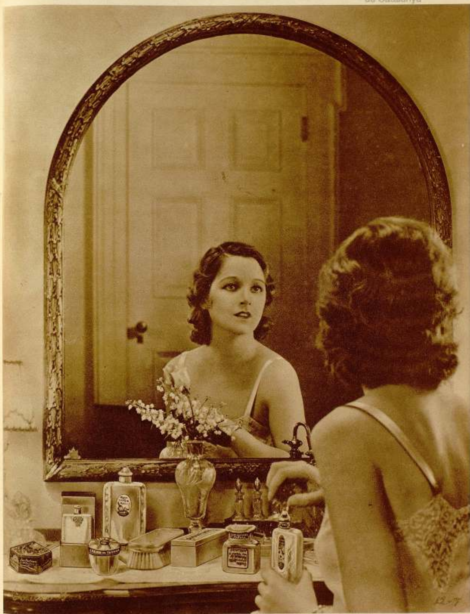
He aquí un tocador de una bella estrella del arte mudo. Como verán las amables lectoras, en él no faltan las grandes creaciones de la perfumería Isern, Navarro y Pascual, de Badalona.