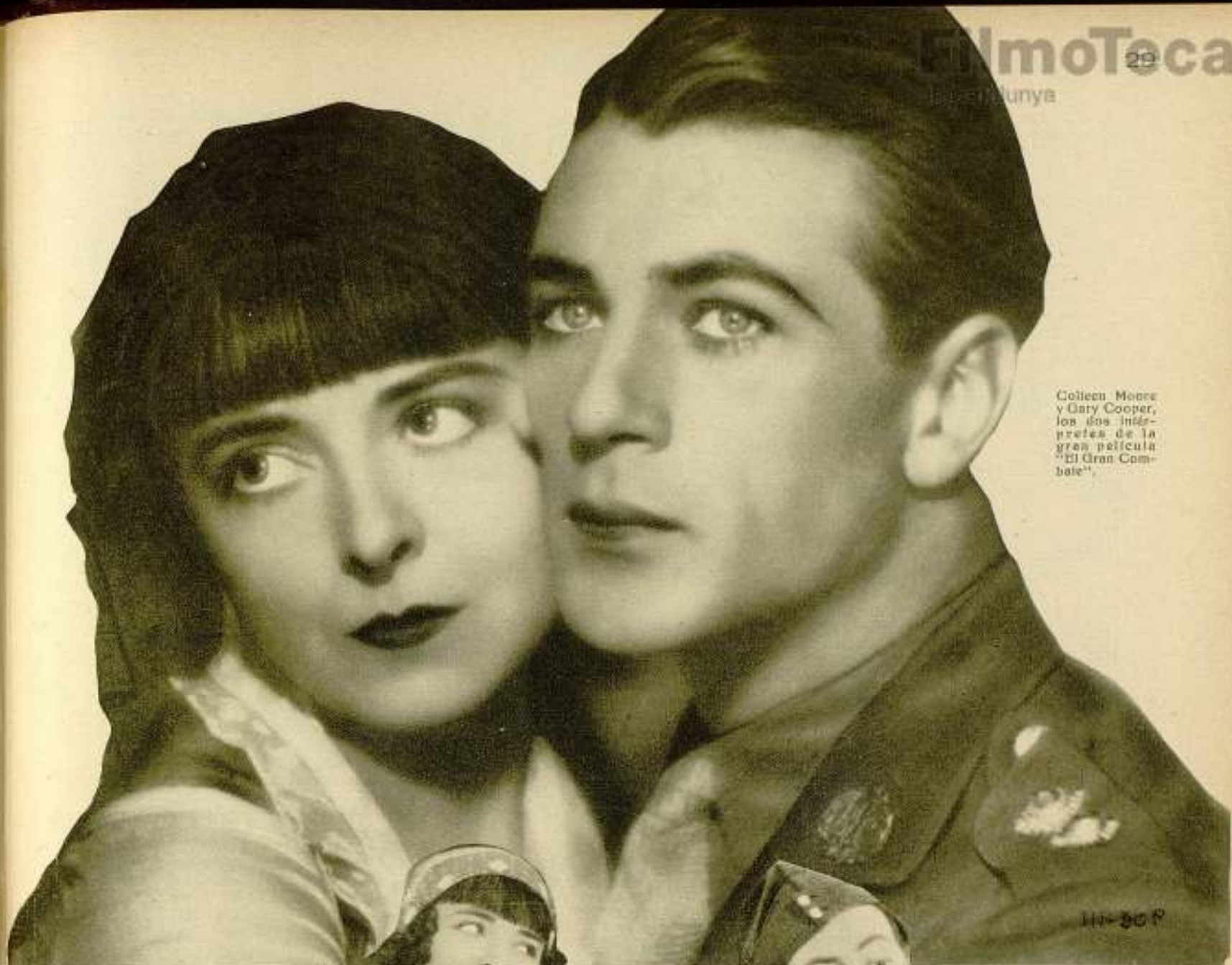
Cellean Moore y Gary Cooper, los dos intérpretes de la gran película "El Gran Combate".

Esta cinta, producida por la famosa marca First National, está siendo representada en Nueva-York desde la pasada temporada con éxito creciente.