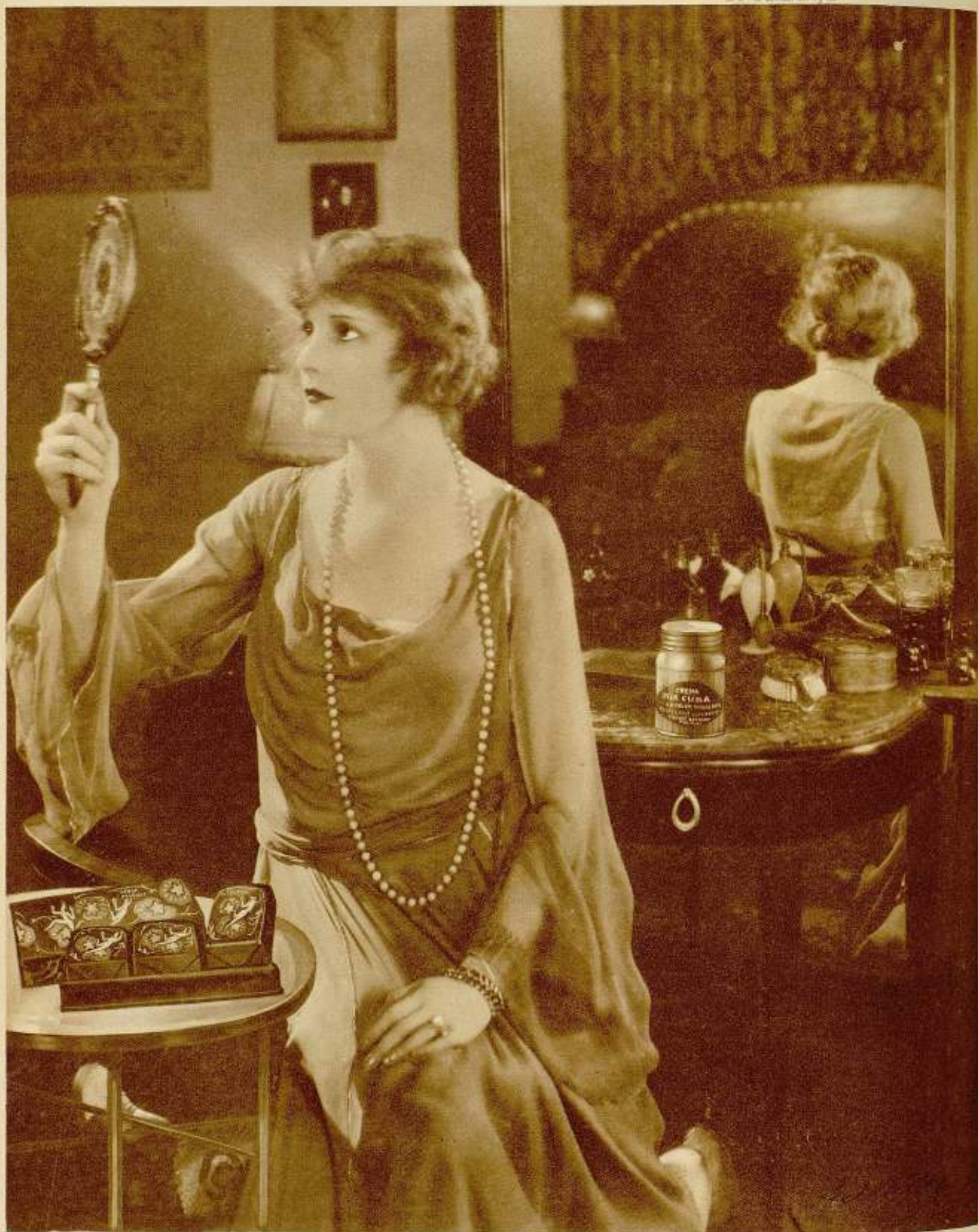
Las grandes estrellas cinematográficas no descuidan en su tocador los productos PECA CURA de la casa Cortés H. nos - Barcelona