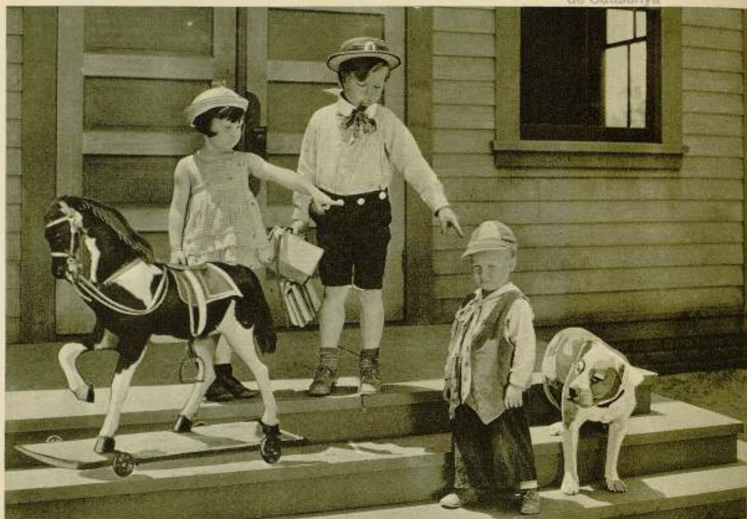
Los originales juguetes que exhibe "La Pandilla" en sus películas, contribuyen en gran manera al éxito que obtienen. Díriase que son comprados en la casa Arnau - Fernando, 18.