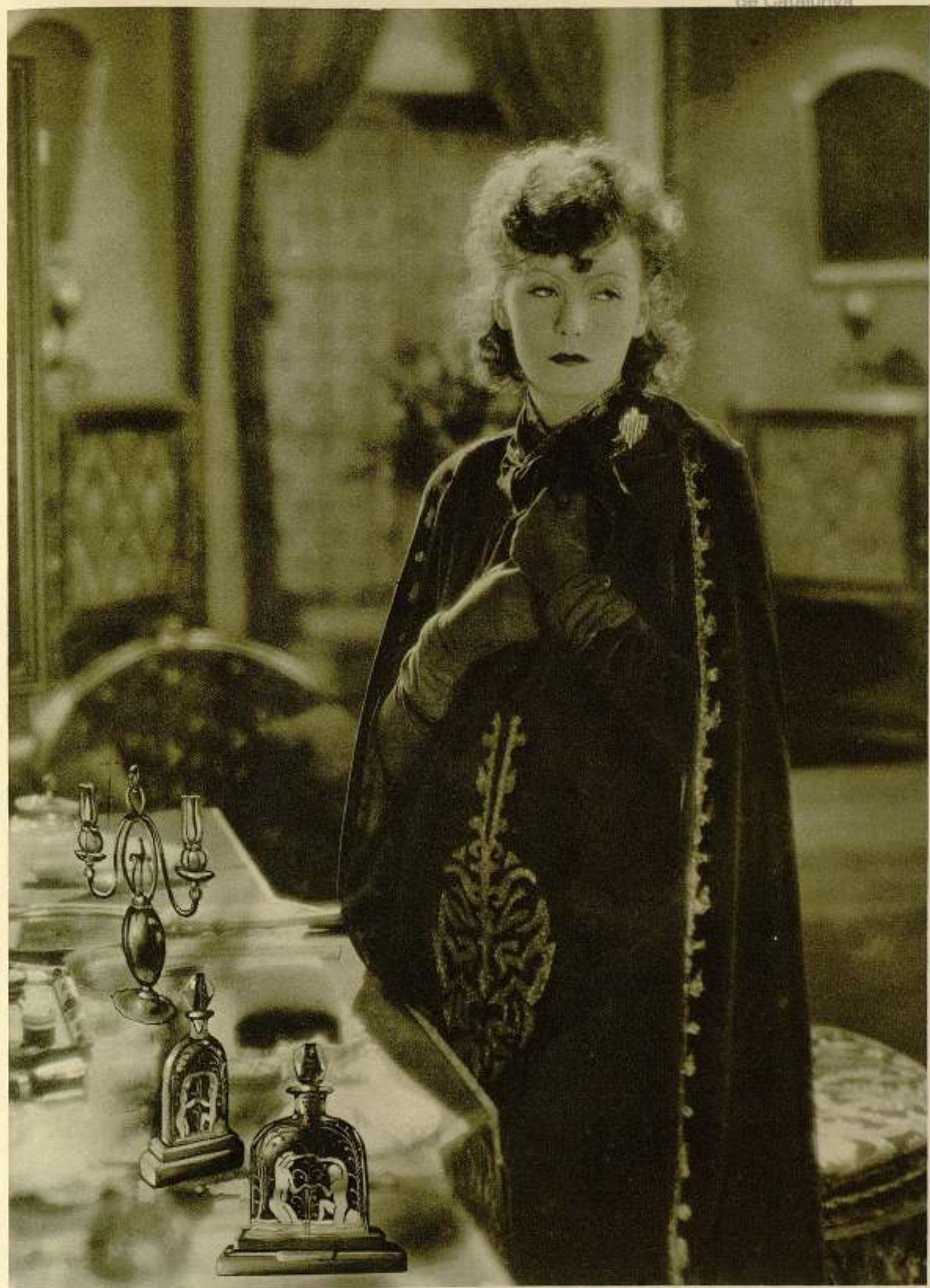
greta garbo es una ferviente admiradora del arte de su país; sobre su tocador figuran varios flacones de cristal grabado de Orrefors y un soberbio candelabro de plata del maestro danés georg jensen; gracias a la casa uralita, s. a., sucursal paseo de gracia, 90, estos objetos de arte, famosos en el mundo entero, también son conocidos del público barcelonés.