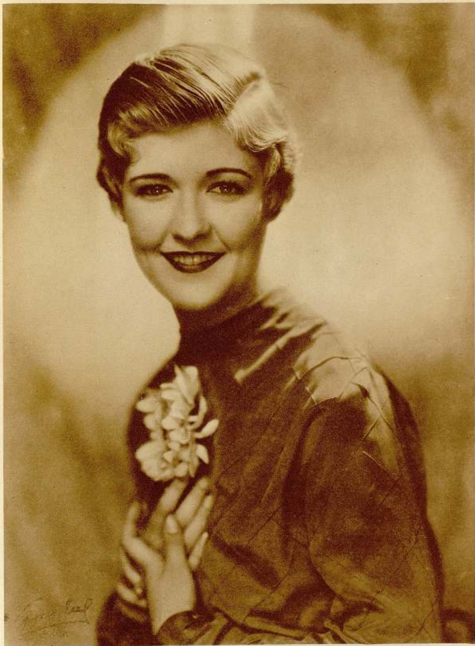
LAURA LA PLANTE