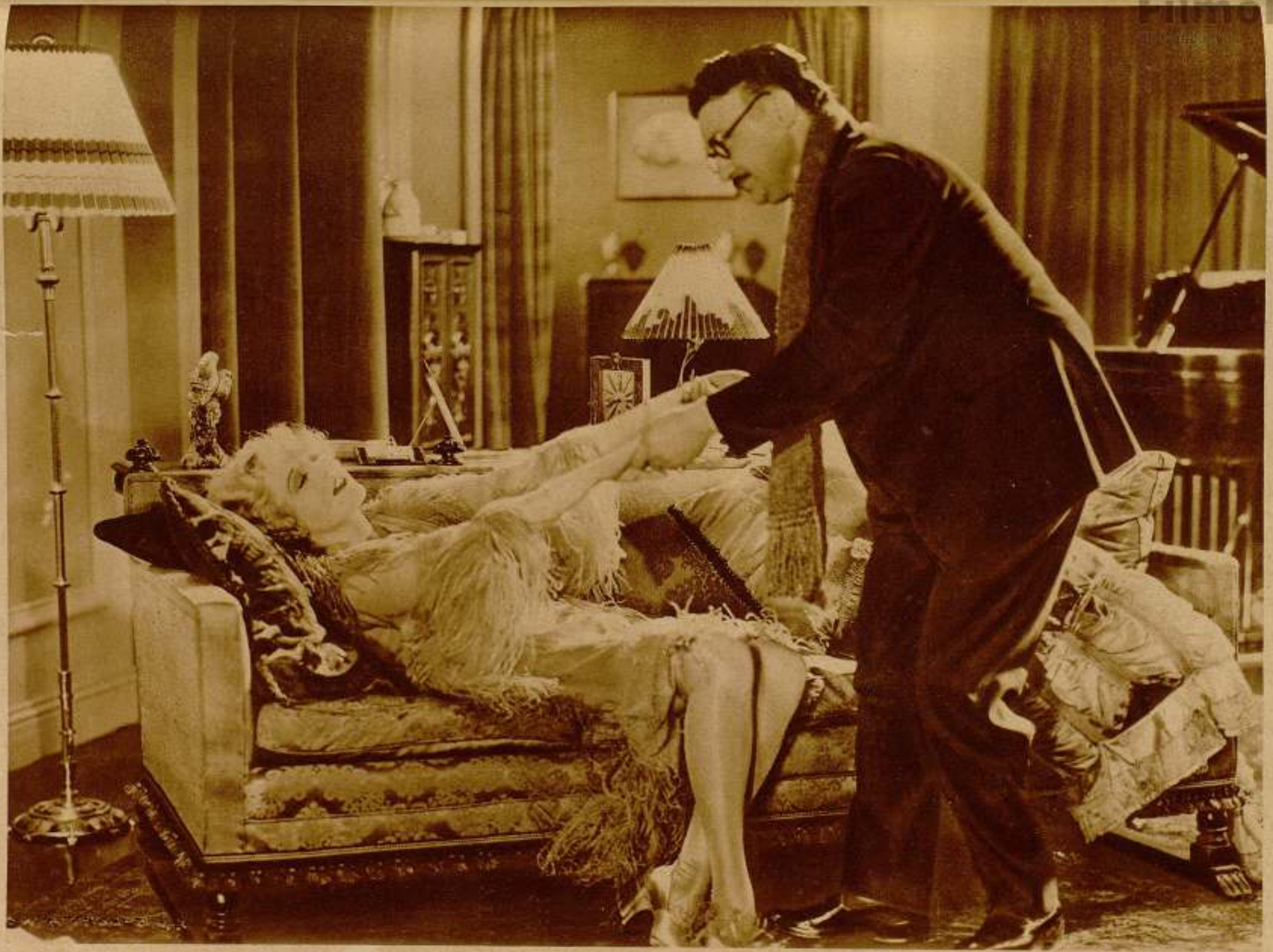
Déjame seguir en el dulce reposo que proporcionan los muebles de la casa Pallarols