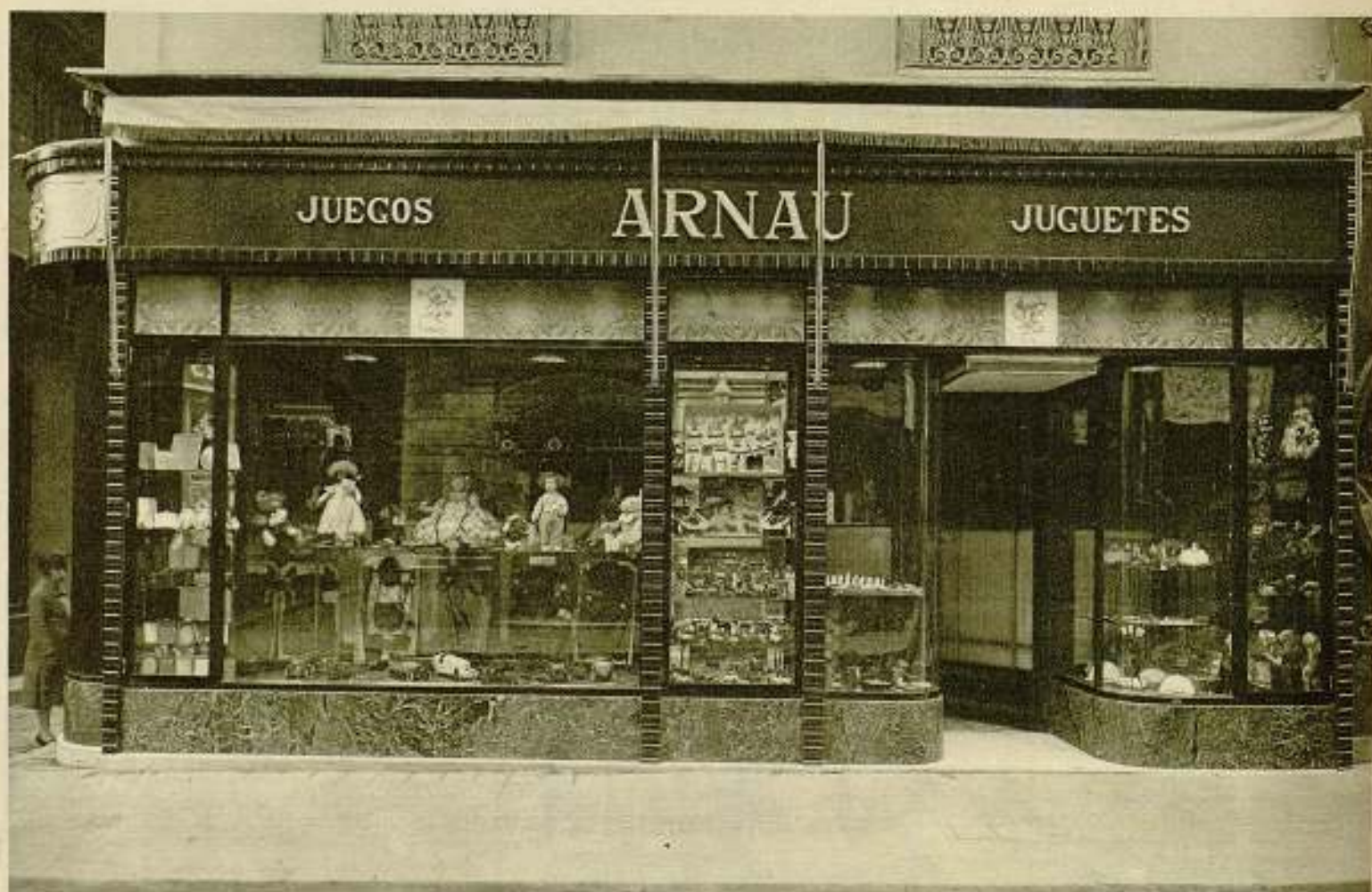
Arnau. - Primera casa para juegos y juguetes - Fernando, 18 - Barcelona.