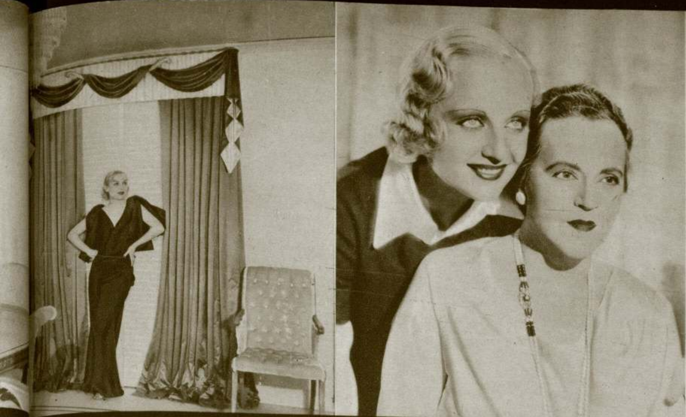
Carole Lombard, en Hollywood.