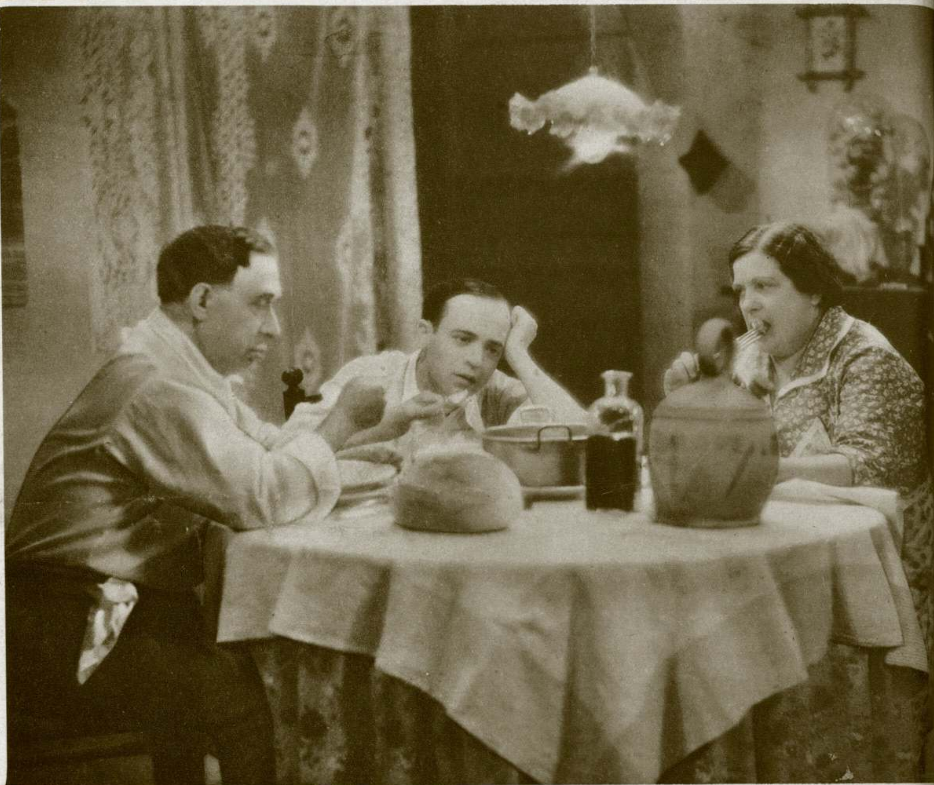
En una escena de «Los Claveles», film en el que realiza una labor digna de todo elogio.

Unos días más tarde se me comunicó que había sido escogido para el papel de «Perico» en la versión de «La Dolorosa» que iba a dirigir Gremillón.