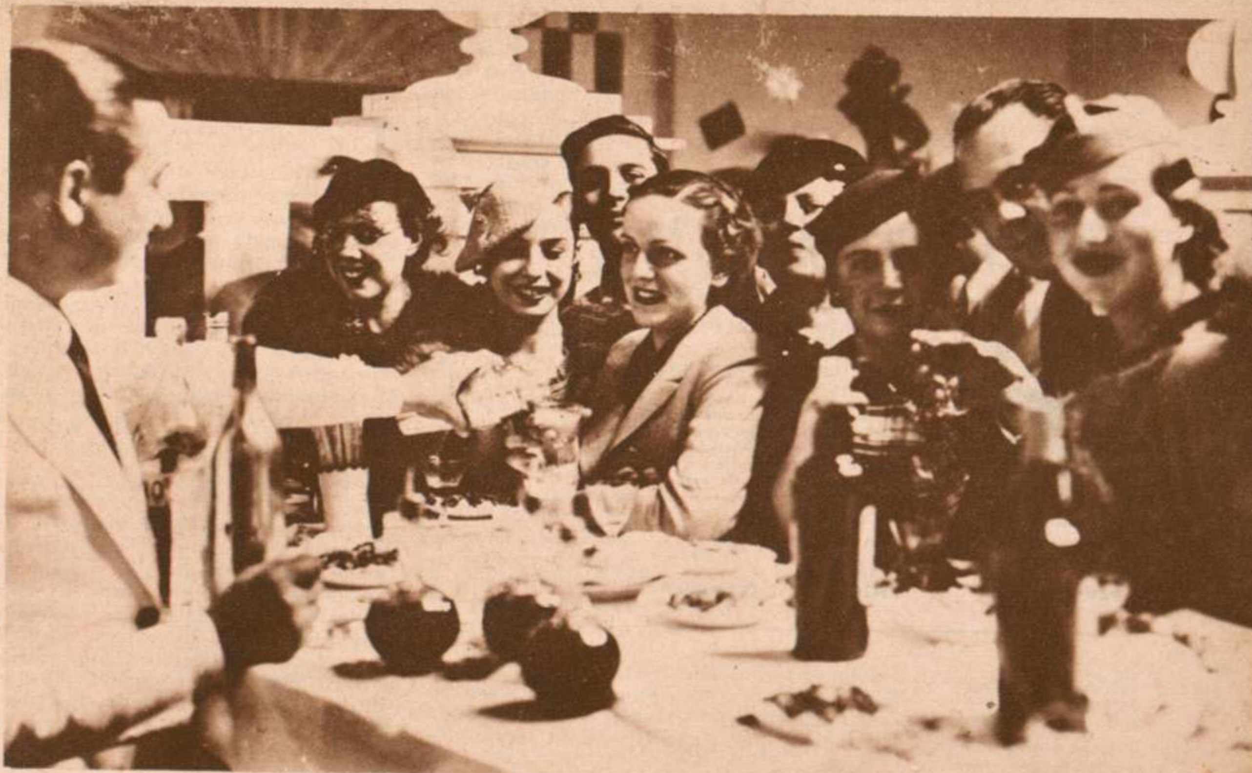
INAUGURACIÓN DE LOS ESTUDIOS BALLESTEROS TONA FILM, EN MADRID.-Dos aspectos de la fiesta celebrada en los estudios Ballesteros Tona Film, con motivo de su inauguración.-Entre los asistentes, algunas artistas españolas y personalidades varias del mundillo cinematográfico madrileño.