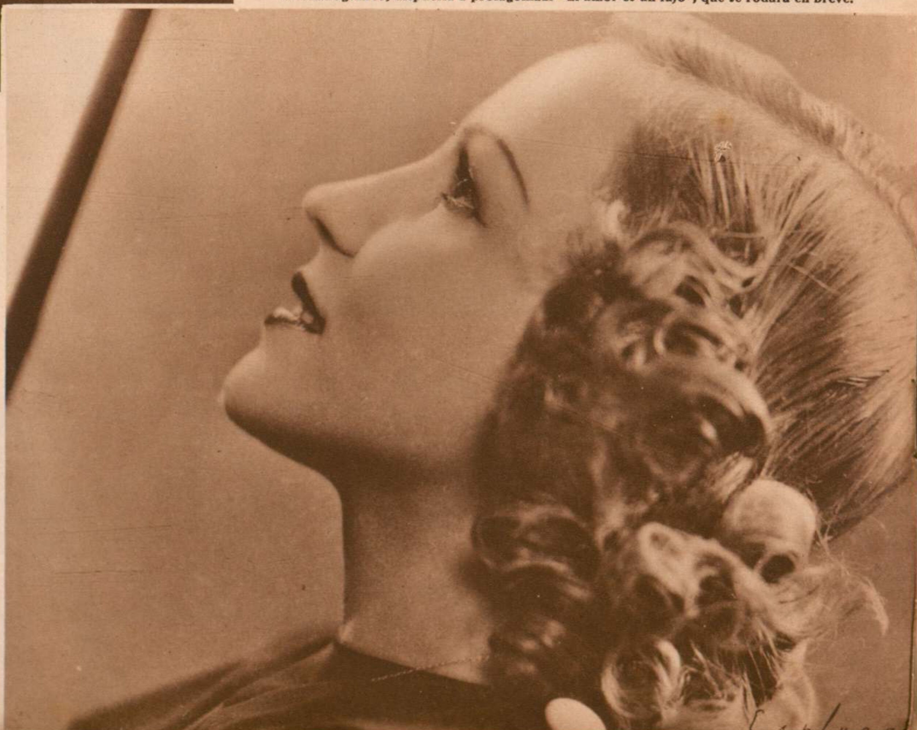
Isa España, joven y bellísima actriz, que repuesta de su enfermedad, vuelve al trabajo cinematográfico, dispuesta a protagonizar "El amor es un lujo", que se rodará en breve.