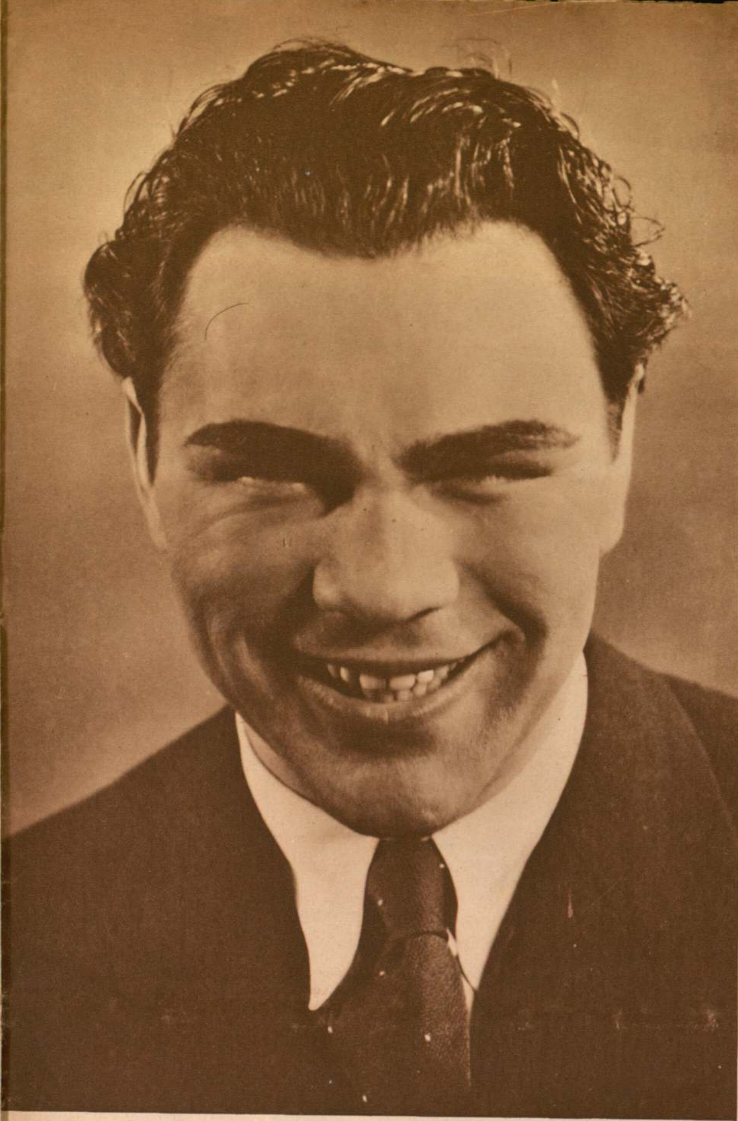
Max Schmeling, campeón internacional de boxeo y actor universal, vuelve al cine en «Knock-out», en el que colabora con su esposa, la famosa actriz Anny Ondra, con la que aparece en la parte inferior en una escena de este film.