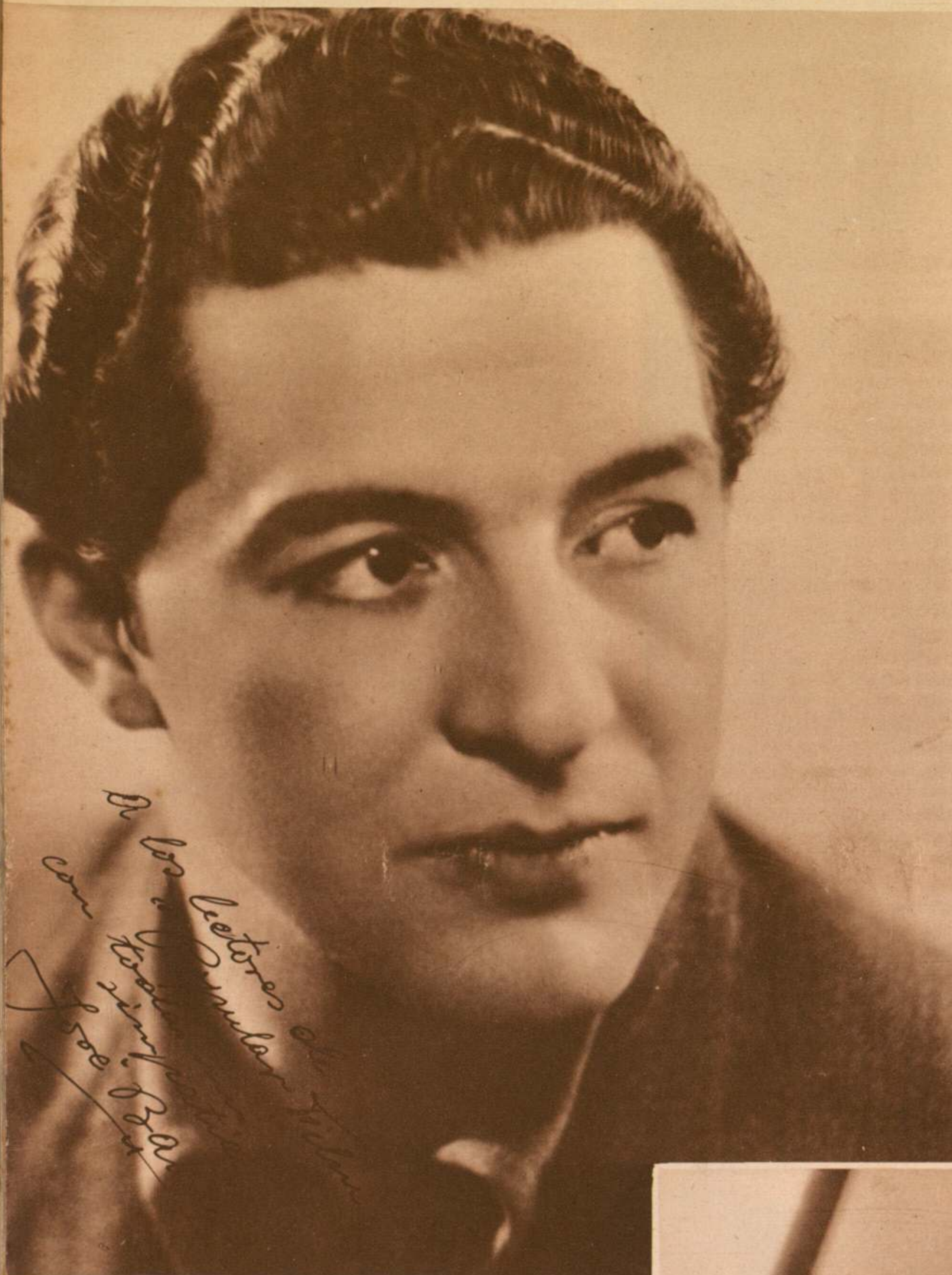
José Baviera, uno de los primeros galanes del film nacional, y tal vez uno de los que más títulos cuenta en su haber cinematográfico, ofrece una fotografía dedicada a nuestros lectores - José Baviera ha tomado parte este año en las siguientes producciones: "20.000 duros", "Madre Alegría", "El octavo mandamiento" y "La farándula", esta última en plan de rodaje en la actualidad.