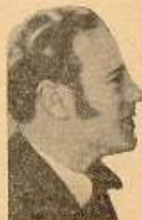
Leslie Howard, «partenaire» de Mary en «Secretos», lo cual constituye una gloria para él.