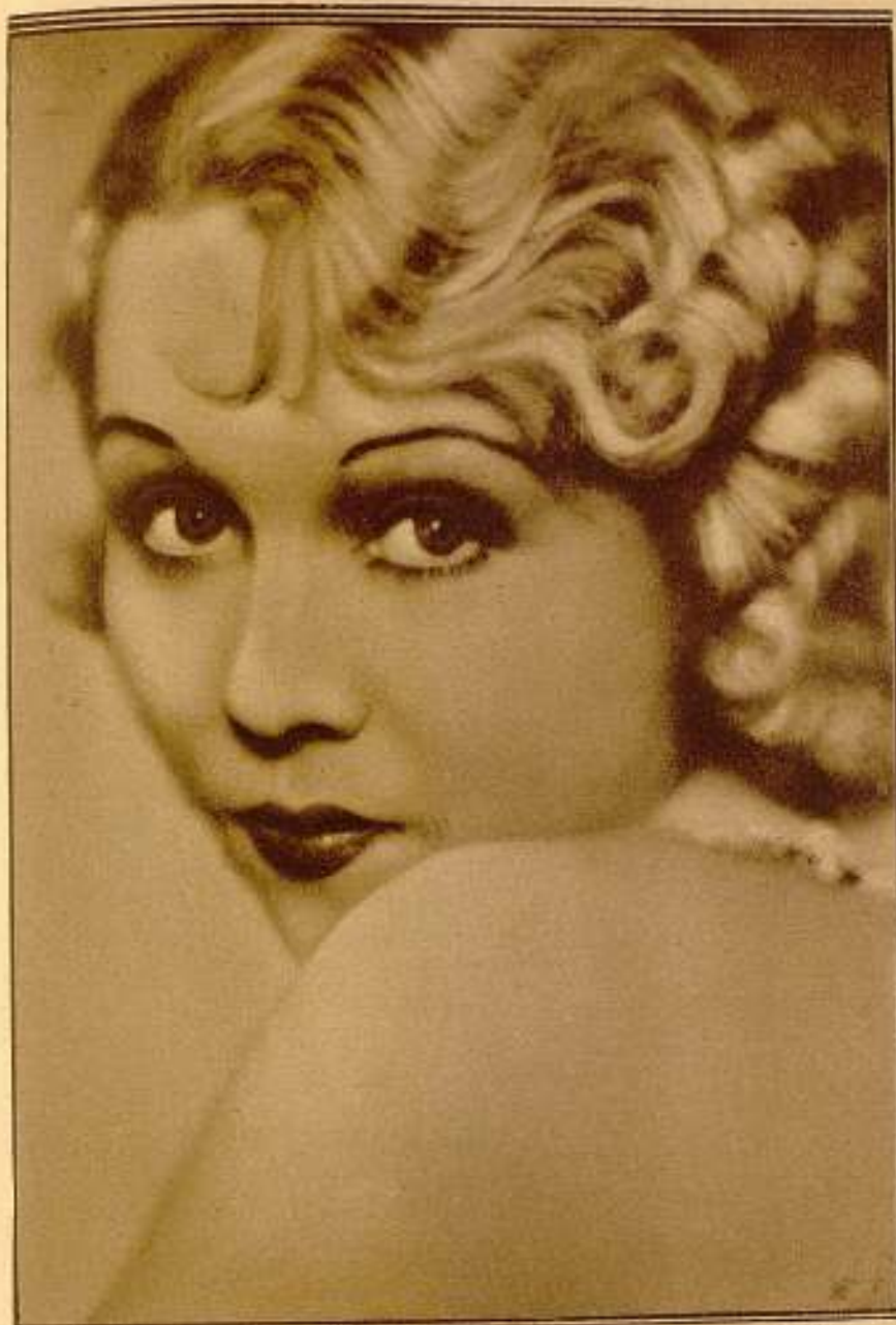
Florelle, la bella actriz de la pantalla, principal intérprete femenina de «El manco de botica».

Por sus dotes excepcionales, su puesto estaba señalado en «El manco de botica», nuevo film de Selecciones Filmófono.