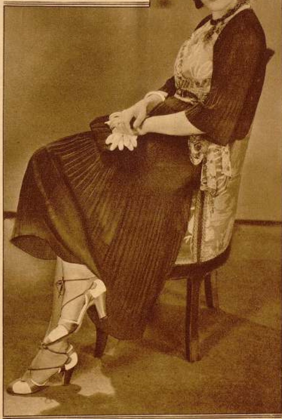
María Alba, la bella española que conquistó Hollywood, figura ahora en el elenco de la M-G-M.

PELUQUERIA DE ARTE "MANON" INSTALACION PRINCEPS/CA ESPECIALIDAD EN EL RUBIO PLATING "HOLLYWOOD" PERMANENTES/ ETC. PRECIO/ CORRIENTE/ INSTITUT DE BEAUTE "MANON" RAMBLA DE CATALUNYA 6 - BARNA.