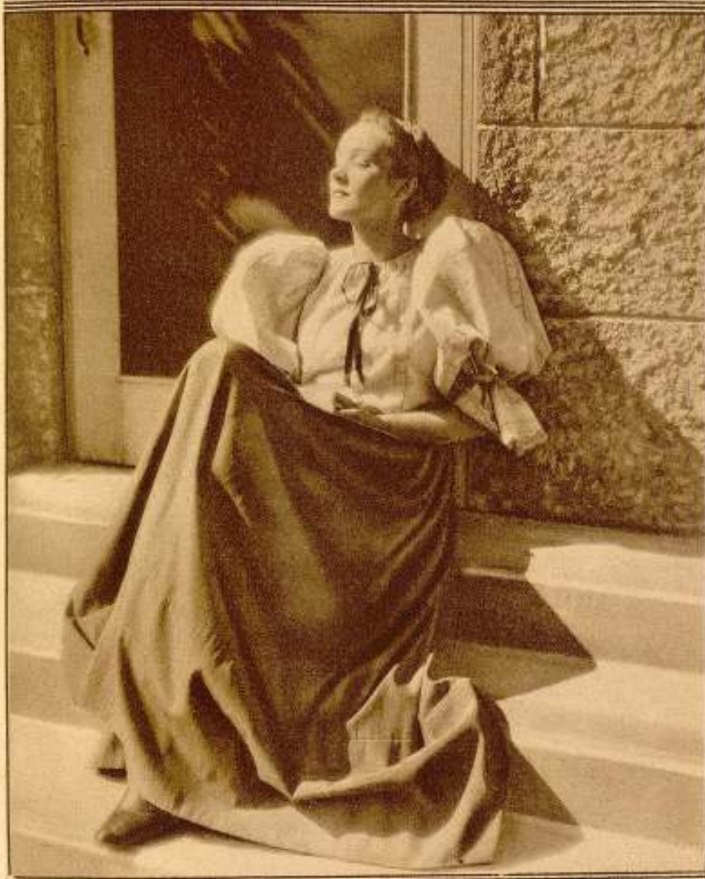
Marlene Dietrich, en «El cantar de los cantares», de la Paramount.