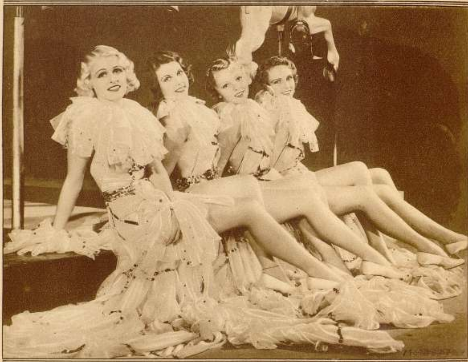
Original bailable que aparecerá en una próxima revista musical de la Metro-Goldwyn-Mayer

A los citados concursos tendrían ocasión de presentarse cuantos escritores teatrales lo desearan. Y en ellos demostrarían si efectivamente, por el mero hecho de ocupar un lugar preeminente en la literatura, les es fácil dedicar paralelamente sus actividades a componer guiones de cine.