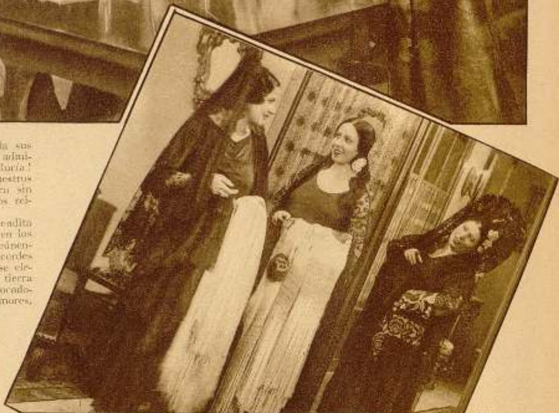
Escenas de la zarzuela cinematográfica de Ricardo Baños, "El relicario" que se estrenó en el Salón Kursaal.