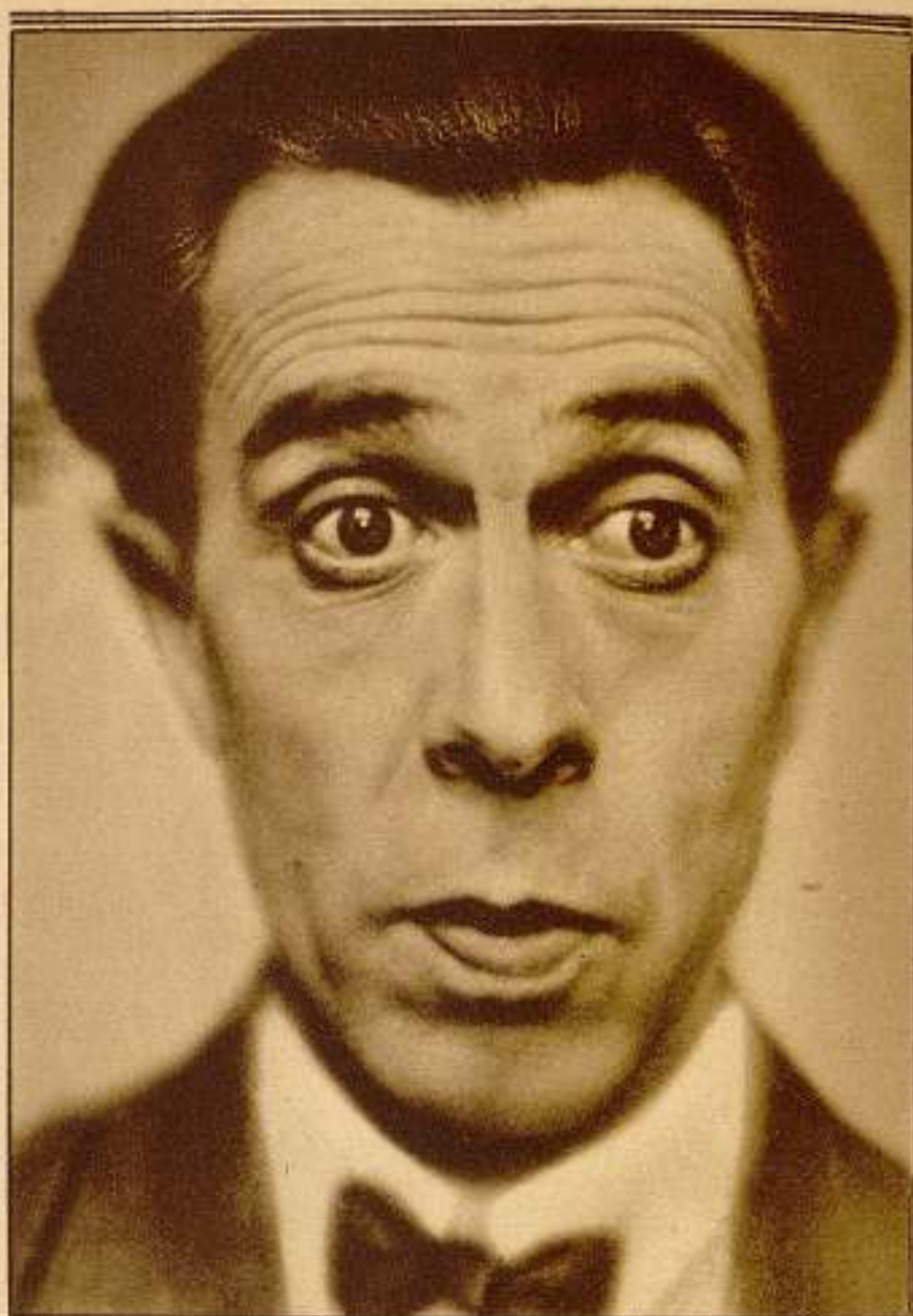
Duvallés, el gracioso actor cómico, protagonista de "El mancebo de botica", de Selecciones Filmófono.

Este film nos procura el viaje más hermoso que podríamos soñar a la Costa Azul, donde nos descubre rincones tan pinto-