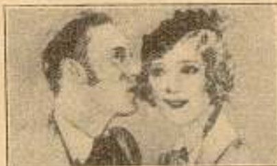
Mary Pickford y Leslie Howard en «Secretos», de Artistas Asociados.

El director Frank Borzage y sus ayudantes, setenta actores y los operarios de los estudios, se estaban preparando para abandonar al despuntar el día, cuando llegó la noticia de que por primera vez en varias semanas el cielo estaba nublado sobre el desierto. Desistir a última hora del desplazamiento y rectificar el plan de producción