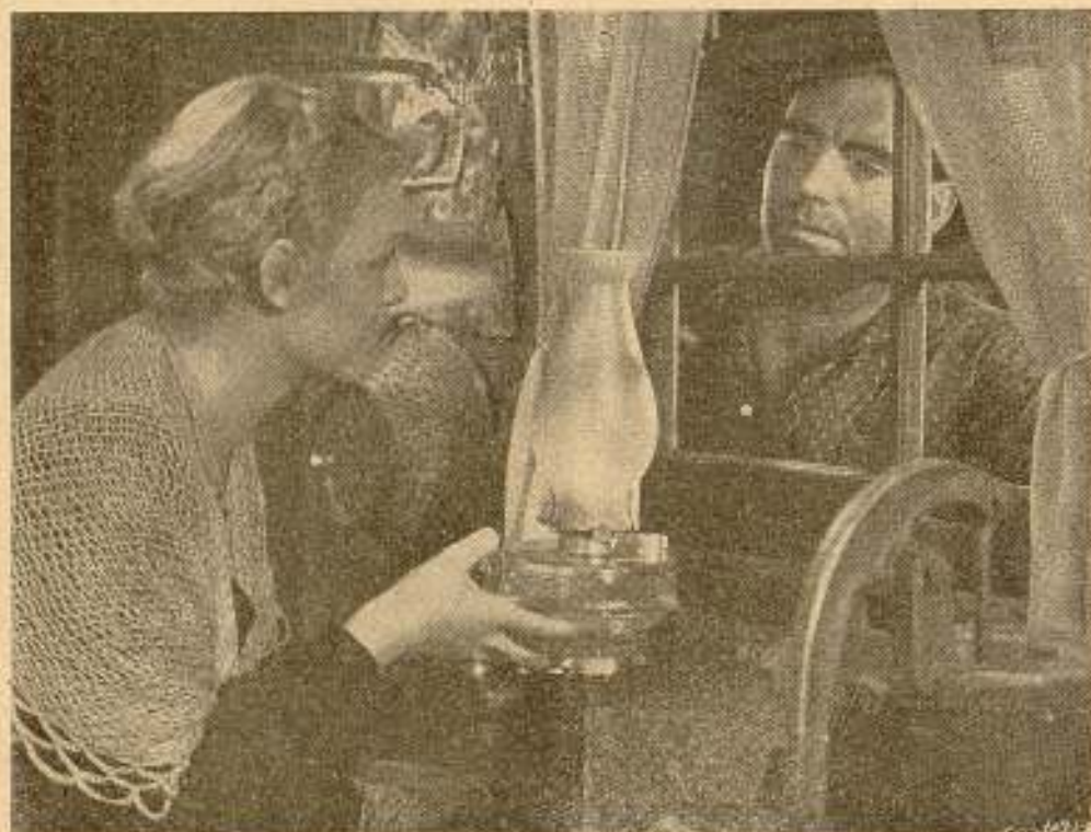
Un momento interesante de «El infierno en vida», film que presenta la Universal en el Capitol.