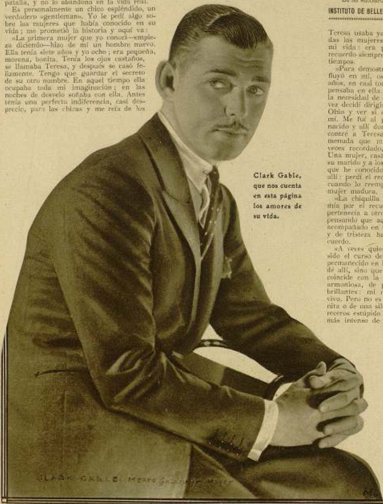
Clark Gable, que nos cuenta en esta página los amores de su vida.

«Después de estos dos años de Akron, me dirigí a Broadway. Fue un camino larguísimo que me hizo conocer una serie de ciu-