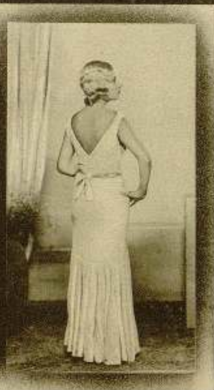
L'ESTETICA DESPRES DE LA CORRECCIO