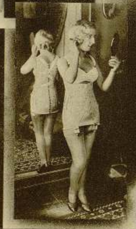
CORRECCIO AMB LA COTILLA ESPECIAL LA ESCOCESA