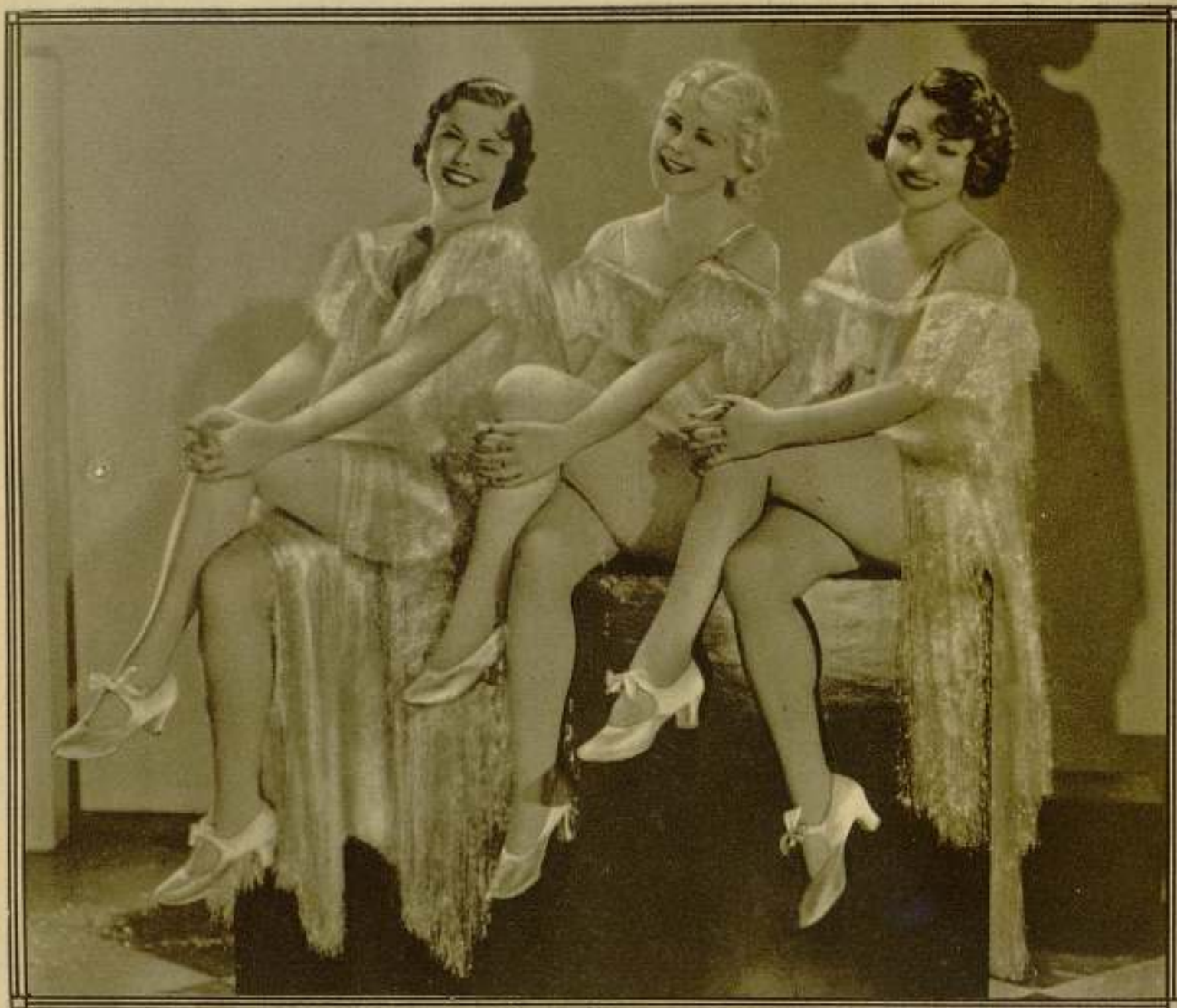
El semidesnudo también tiene su encanto. Al menos así optan estas tres bellas coristas de los Estudios M-G-M.

al corriente de cada nueva moda. Este gusto engendrò en ambos sexos dos defectos de una importancia suma, que han influido poderosamente en la moral de todas las épocas. En la mujer la coquetería y en el hombre la vanidad. Estas dos flaquezas fomentadas con un constante afán de complejidades sexualistas. Naturalmente, poco perspicaz hay que ser para apreciar en seguida que la moda de siempre ha sido y es más inmoral que el desnudo absoluto. Mil orientaciones y muchas tendencias han pesidido los derroteros de todos los aspectos, a cual más diversos,