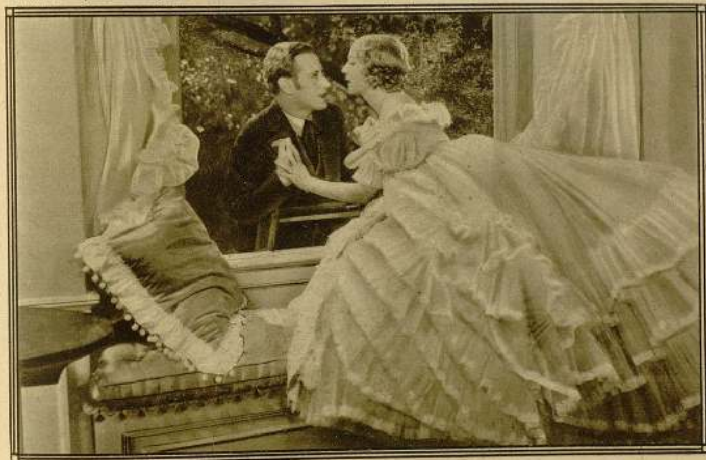
Mary Pickford y Leslie Howard en una escena amorosa de «Secrets», el film de Artistas Asociados, estrenado con éxito recientemente.