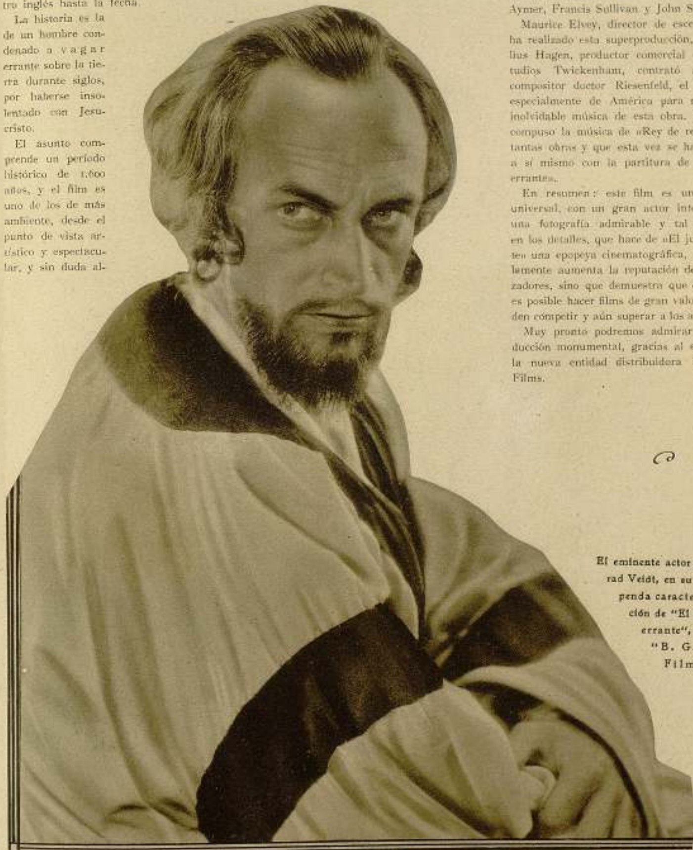
El eminente actor Conrad Veidt, en su estupenda caracterización de «El judío errante», de la «B. G. K. Films».

Muy pronto podremos admirar esta producción monumental, gracias al esfuerzo de la nueva entidad distribuidora B. G. K. Films.