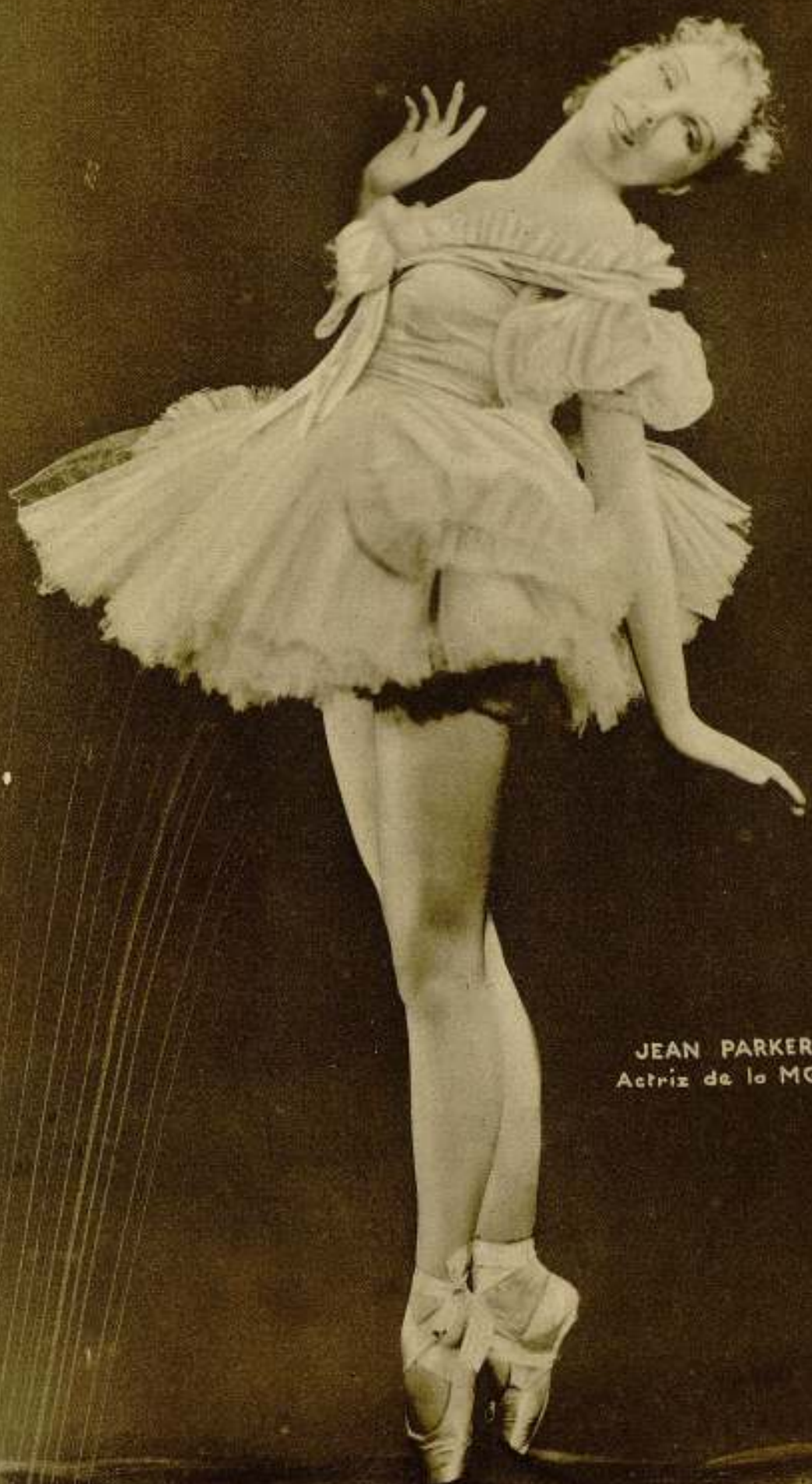
JEAN PARKER Actriz de lo MGM.