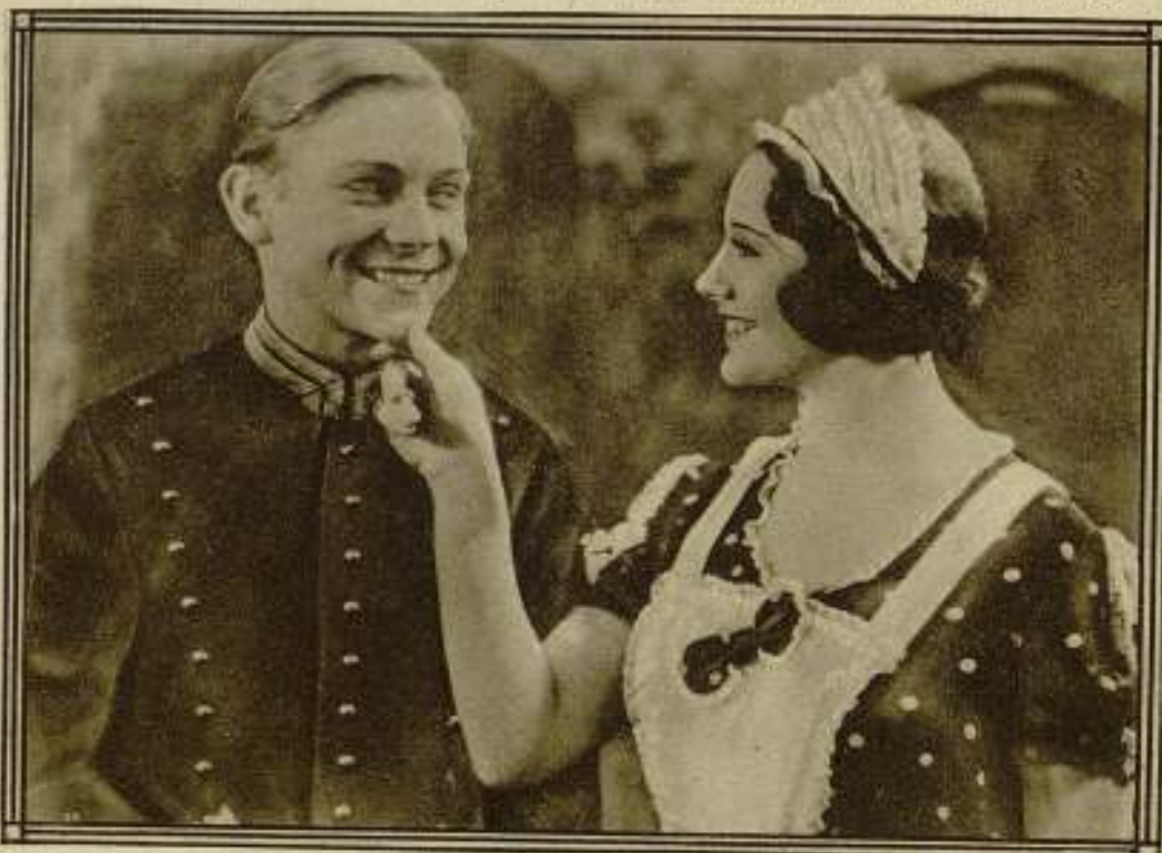
Una escena de "Paprika" (Granito de sal), de las Exclusivas Febrer y Blay.

Es húngara, no solamente de nacionalidad, sino por la gracia del film, representando una de esas mujeres fatales, interesantes, seductoras y sensuales a un tiempo: una vampiresa de las que no se veían en el cinema alemán desde el descubrimiento de Marlene Dietrich. Lo que la diferencia de Marlene—compartiendo en ella el «sex-ap-