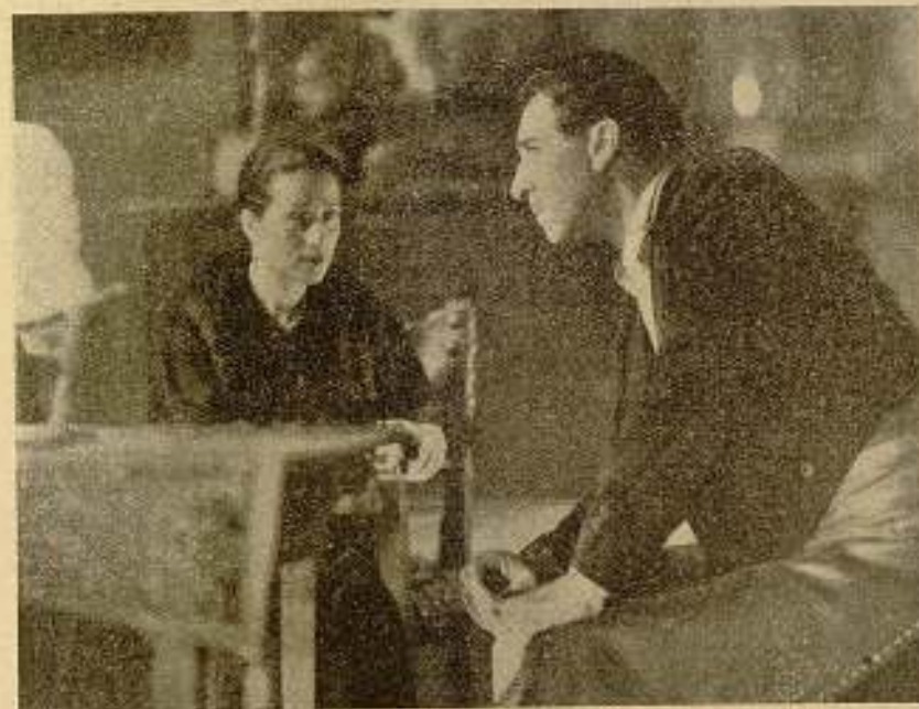
Otra escena de "Sierra de Ronda".

«Sierra de Ronda», exclusiva de Selecciones Capitolio, pasará bien pronto a los salones de estreno, y el público español podrá entonces apreciar que el esfuerzo de los realizadores ha cuajado en una película digna, bella, admirable, que puede competir con ventaja con las que del extranjero pasan por nuestras pantallas.