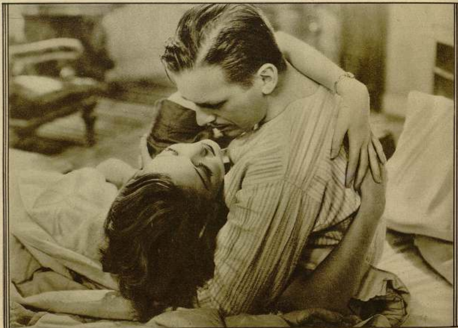
Douglas Fairbanks Jr. y Loretta Young, en "Su última pelea", de la Warner Bros.

—Bien, vamos a besarnos otra vez para que yo pueda averiguar cuál de las dos influencias pesa más sobre mí.