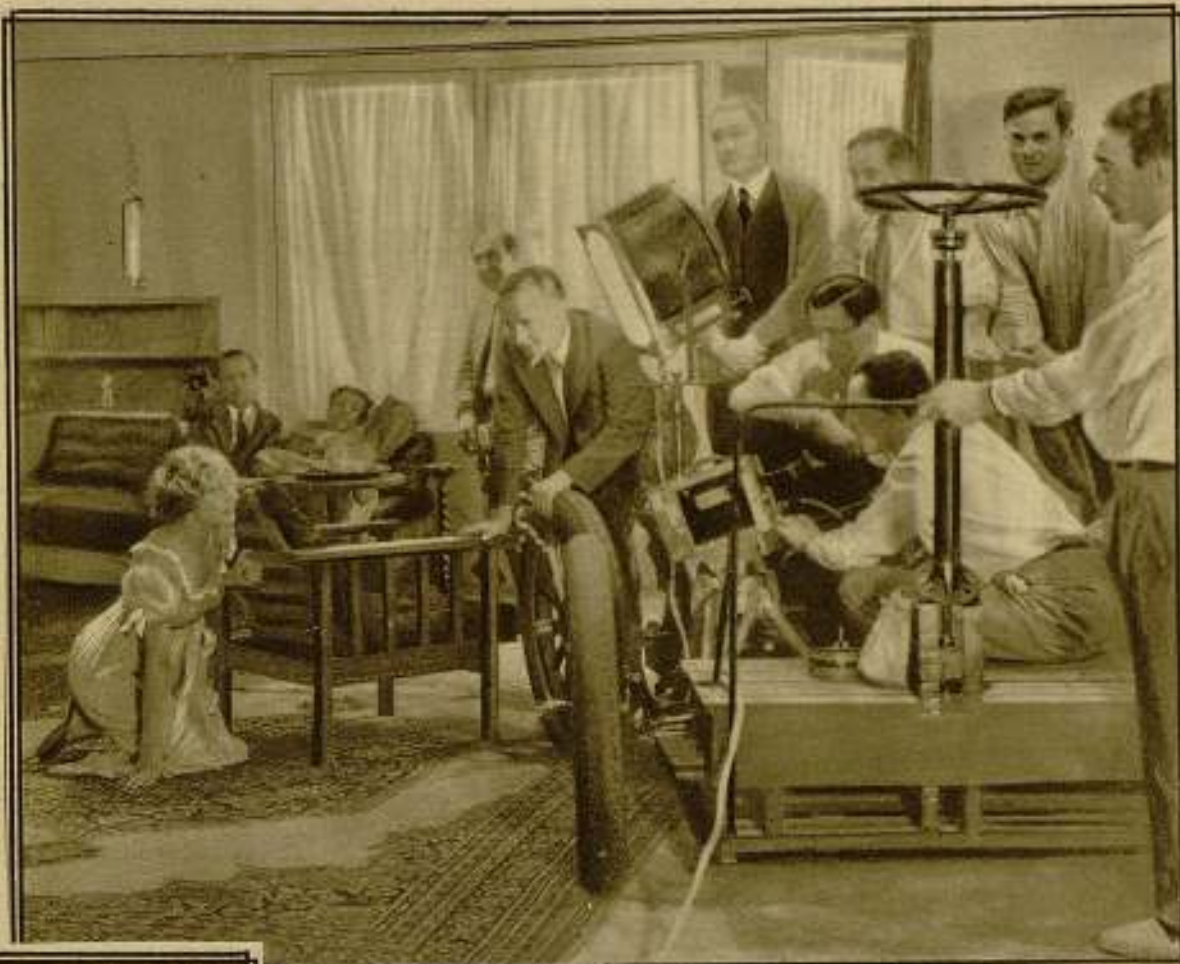
Una fotografía obtenida durante la toma de vistas, en los Estudios de la Orpheo Film, de «Susana tiene un secreto».