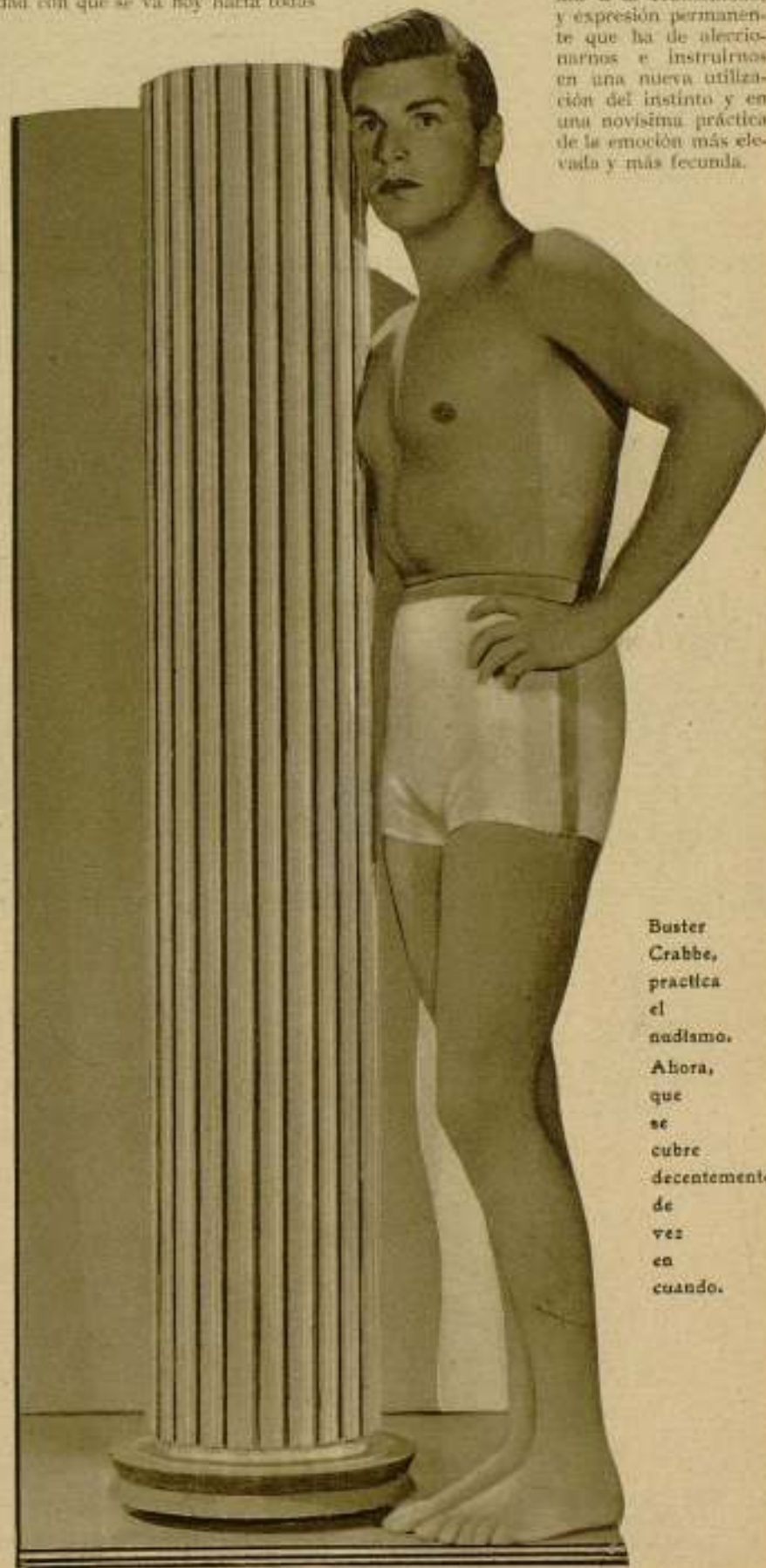
Buster Crabbe, practica el nudismo. Ahora, que se cubre decentemente de vez en cuando.

Sea nuestro nudismo manifestación de doctrinas sanas, fundamento de toda una moral que ha de redimir a la Humanidad, y expresión permanente que ha de aleccionarnos e instruirnos en una nueva utilización del instinto y en una novísima práctica de la emoción más elevada y más fecunda.