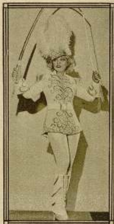
Mae West, la nueva y brillante "estrella" de la Paramount.

El encanto de Mae West está en los antipodas del indiferentismo disfrazado de superioridad, de la enfermiza languidez que son las armas habitua-