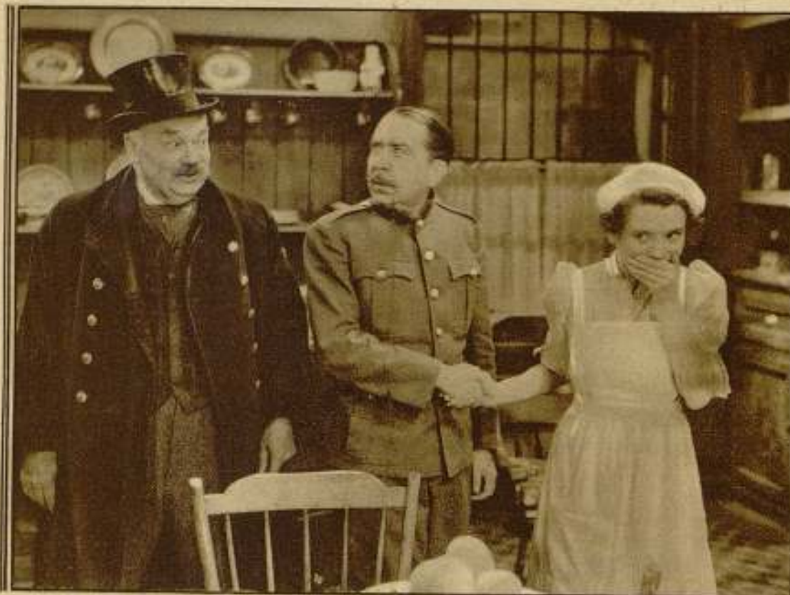
Interpretan esta gran produc- ción