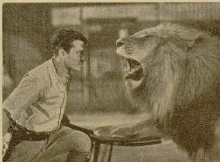
Una escena de "El gran domador" de la Universal, que se estrenará muy pronto en el Salón Cataluña.