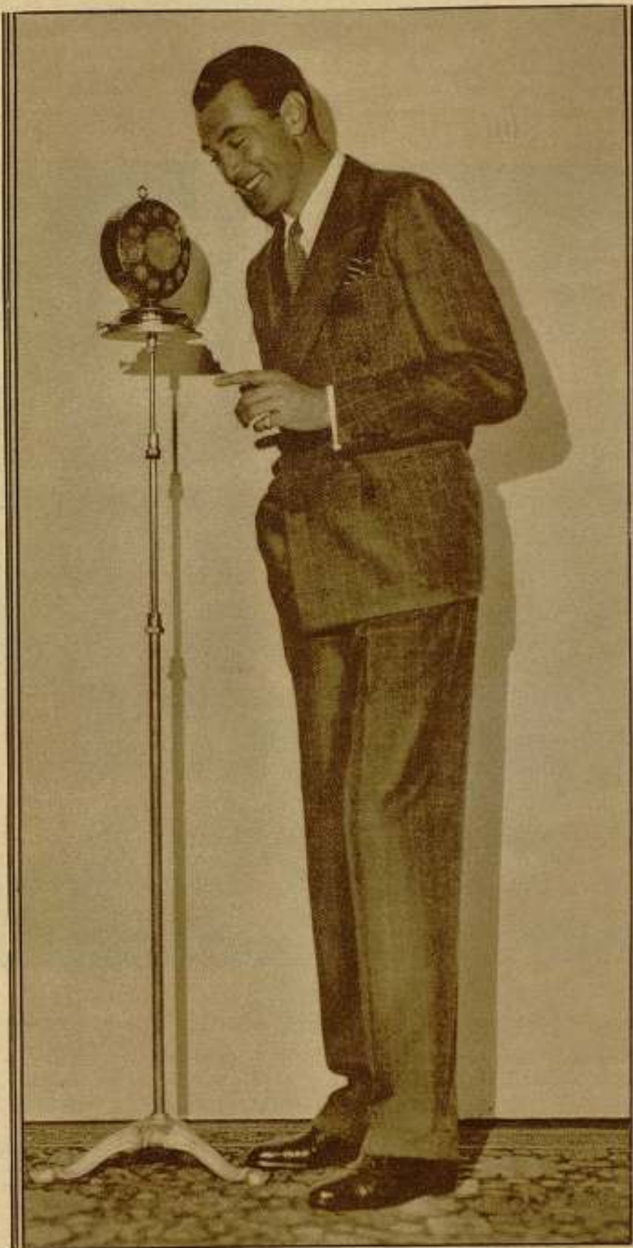
Gary Cooper, el astro de la Paramount, anuncia por el micrófono que una vez tramitado el divorcio de Carole Lombard con William Powell, piensa casarse con la bella rubia... ¡el luego no cambia de parecer alguno de los dos!

corista de cine, habían de ser más o menos de la misma estatura y del mismo grueso, como asimismo poseer una cultura esmerada.»