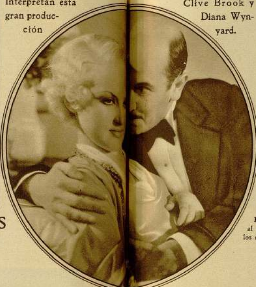
Clive Brook y Diana Wyn- yard.