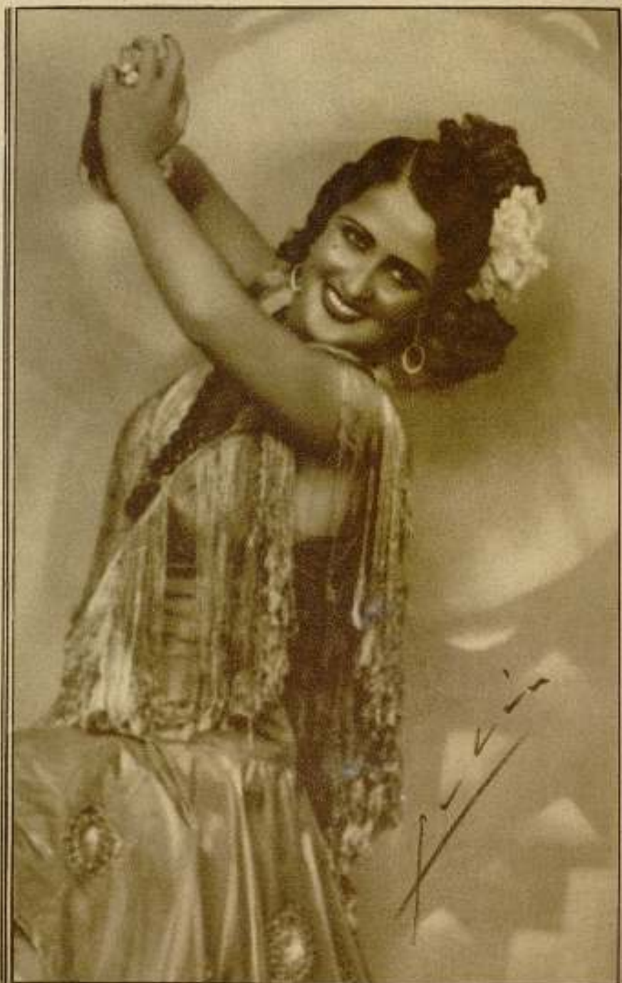
Estrellita Castro, sugestiva, airosa, bonita, da prestancia a la producción...