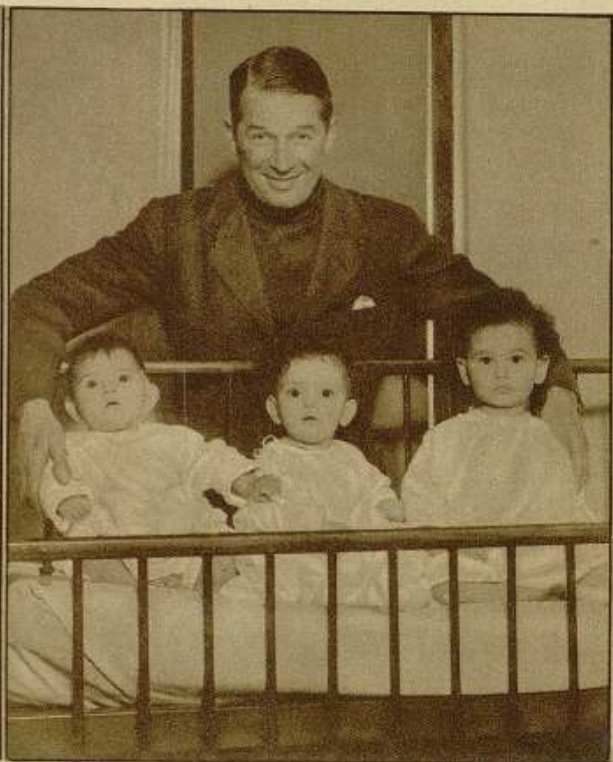
Maurice Chevalier cuida — es un decir — de estos tres bebés, de entre los que se seleccionó el que figura en su película "Soltero inocente".

conduce a tocar los tímbrs de todas las viviendas y echar a correr cuando vengan a abrirnos. Las ganas tan irreprimibles que nos entran cuando vamos en el tren, de tocar también ese timbre de alarma que vemos por todos lados a nuestro alcance, con la indicación insistentemente pueril de que no se toque. El sibaritismo de gustar un peligro por una futilidad que nos haga cerrar los ojos,