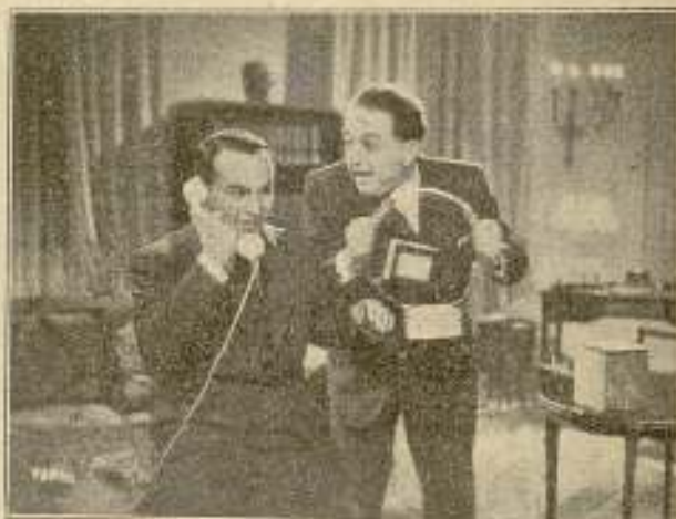
JAN KIEPURA, el tenor de la voz maravillosa, junto con el simpático y gracioso actor Lucien Baroux, en una escena muy cómica de la película «TODO POR EL AMOR», que presentará la casa UFILMS, próximamente, en el Fantasio.

Hamilton se separó de la Paramount cuando empezó el cine parlante. Lo mismo que en el silencioso, conquistó en éste gran renombre. Antes de la que ahora se dispone a interpretar, había hecho recientemente para dicha editora, «La nave del terror».