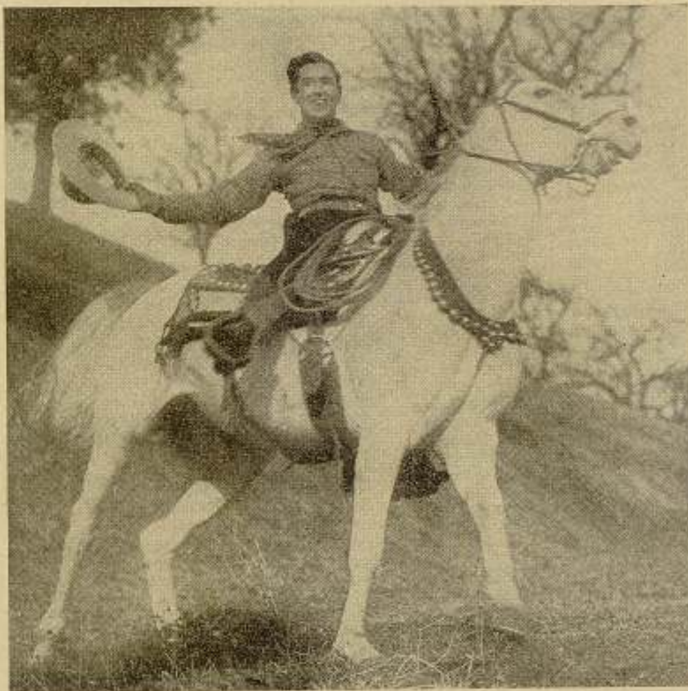
John Mack Brown, en el tipo del bandido del Oeste, "Billy", de la película "Montana Moon", de la que Joan Crawford es protagonista.