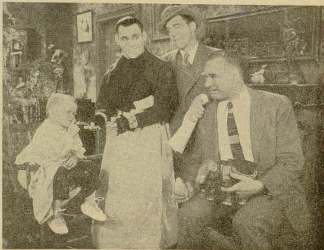
Lon Chaney ama de cría, verdadera creación del insigne artista, que con tanta fidelidad interpreta el personaje que si en esa traza pasara por la Plaza de Cataluña, causaría tremenda y amorosa conmoción entre los soldados de caballería.

Hace seis meses Buster Keaton sólo conocía una palabra de la lengua castellana. «La digo o renuncio a avergonzarme al delicioso humorista? (El lector por lo bajo: «Que la diga, que la diga») Pamplinas sólo conocía la palabra «sombrero». Y no se la dió a conocer su señora, no. Se la reveló Tom Mix cierto día que le hizo el regalo de un magnífico chambergo de «cow-boy». Los