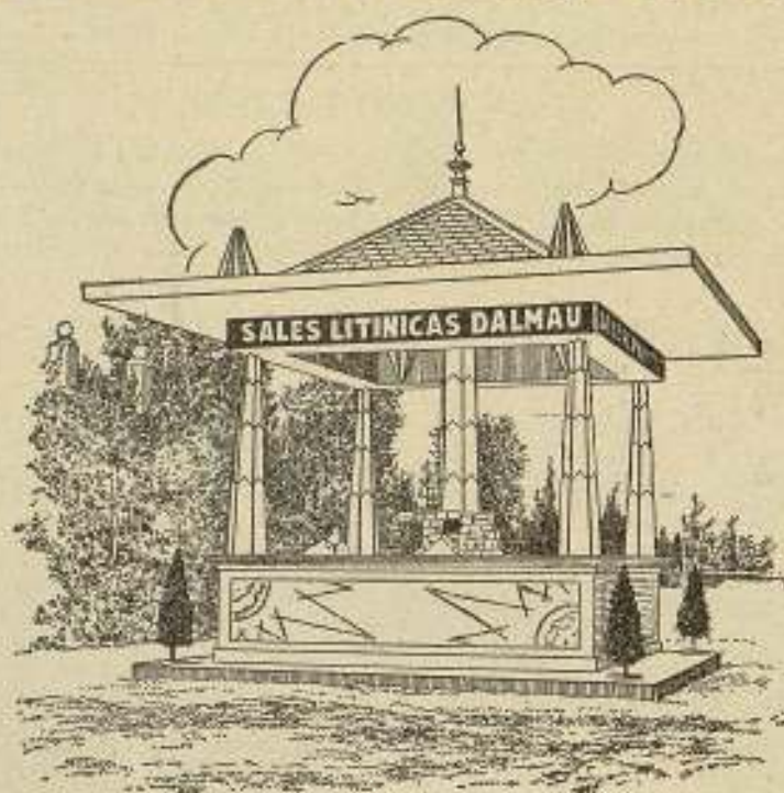
Pabellón de las Sales Litínicas Dalmau

NO DEJE de visitar el Pa- bellón instalado en el Mirador del Palacio Nacional, en donde podrá apreciar las excelentes cualidades de las