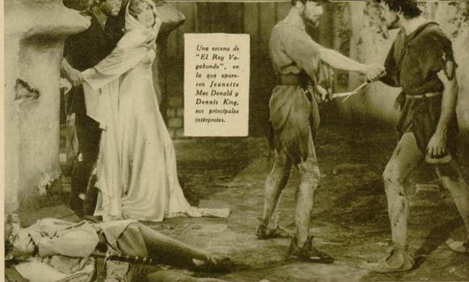
Una escena de "El Rey Va- gabundo", en la que apare- cen Jeanette Mac Donald y Dennis King, sus principales intérpretes.