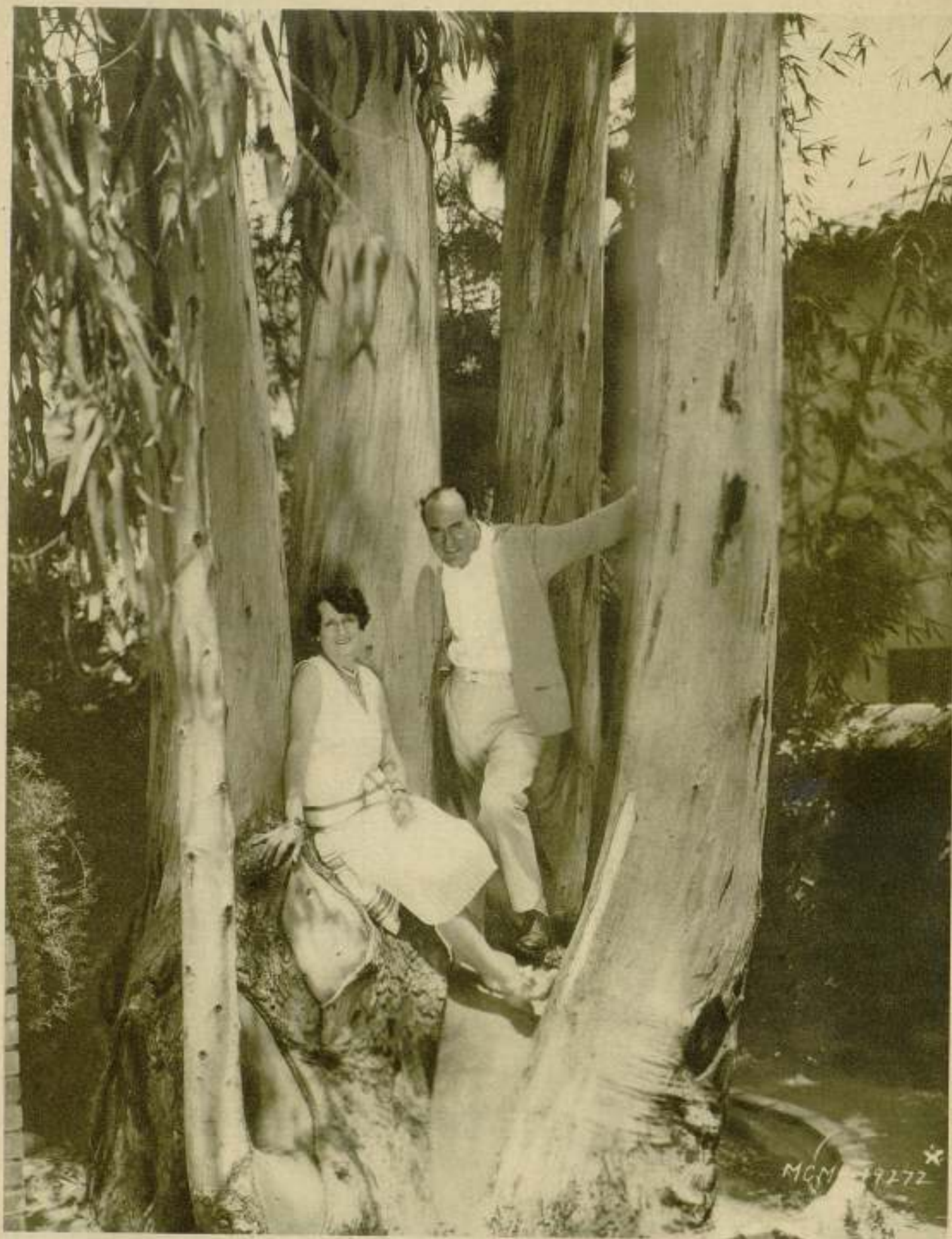
Ernest Torrence, veterano y reputado actor de la M.-G.-M., y su esposa, retroceden a la edad romántica en medio de este paisaje de árboles gigantescos, que forman una selva en miniatura en los parques de su residencia, que se alza en las colinas de Hollywood.