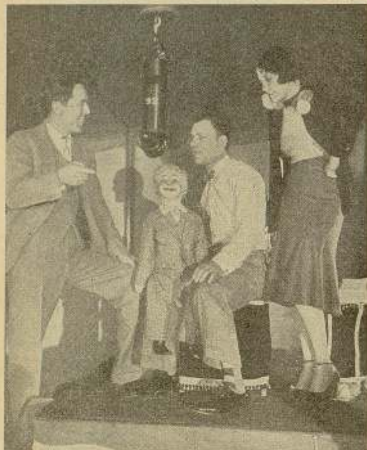
Lon Chaney haciendo poderosos esfuerzos para pronunciar la palabra "ventrílocuo" en español.

«cow-boys» que suelen ser los tipos más castizos de Norteamérica, si se exceptúa a los pieles rojas, jamás denominan a su