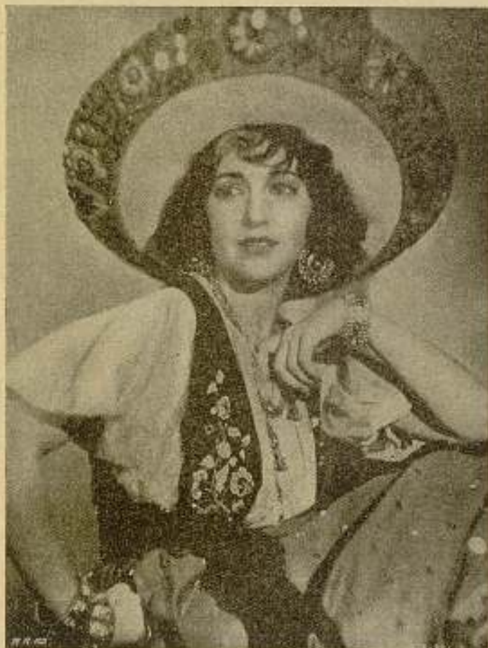
Bebé Daniels, en "Rio Rita".

Allí Norma y Natalia Talmadge, Joan Crawford, Dolores del Río, Raquel Torres, Clara Bow, Janet Gaynor, Mary Duncan, Anita Page, Esther y Jacobina Ralston, Mary Brian, Dorothy Sebastian, Norma Shearer, Alice White, Colleen Moore, Renée Adarée, Vilma Banky, Grete Garbo, Dolores Costello, Billie Dove, Laura La Plante.