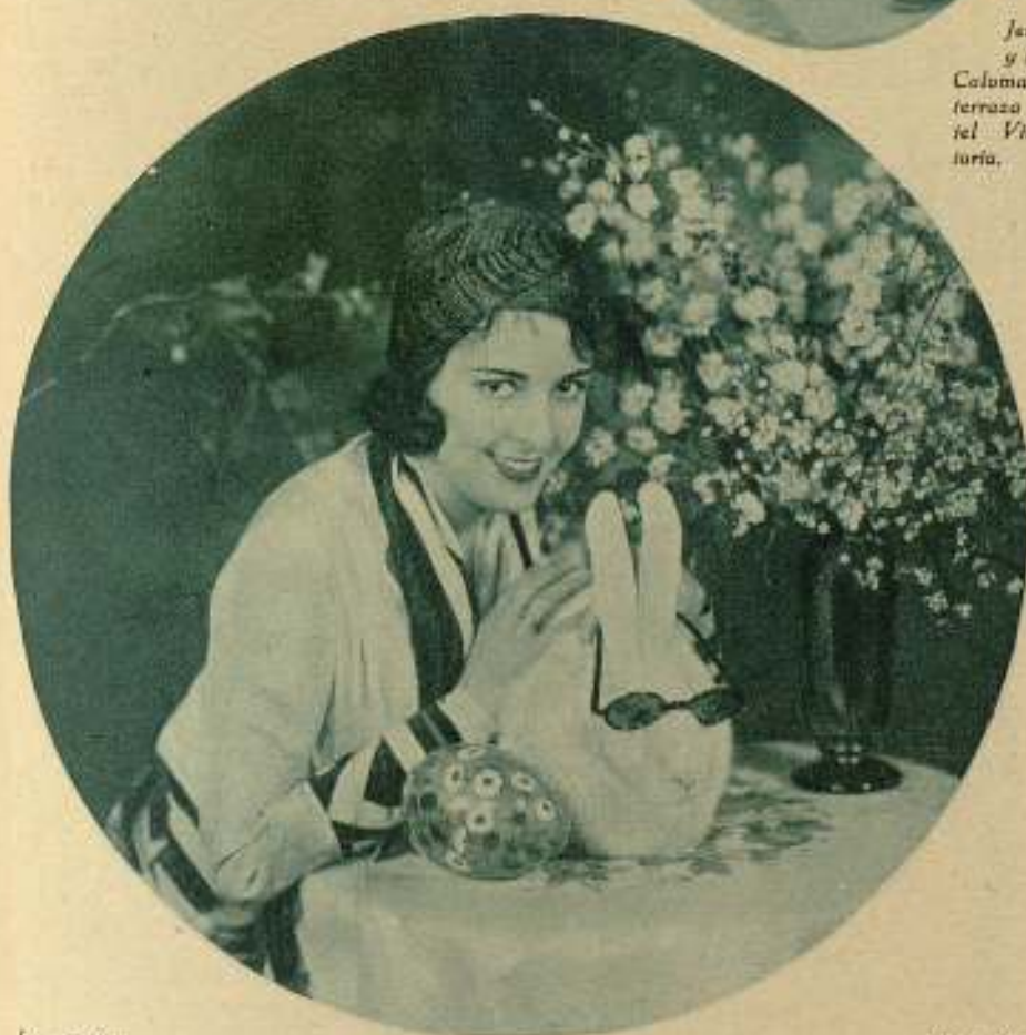
La preciosa artista de la pantalla