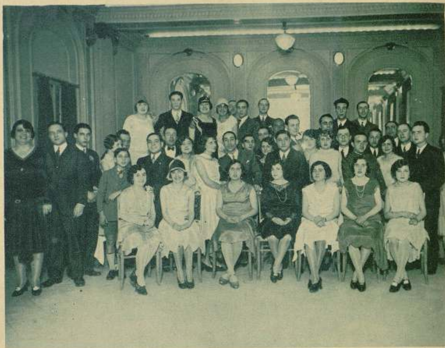
Concurrentes al banquete, que organizado por la Metro-Goldwyn-Mayer, se celebró hace unos días en el Hotel Majestitz