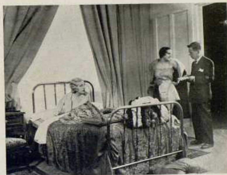
Una escena del film Madrid se divorcia

Werner Kraus, actor de gran talento, interpreta la figura del emperador con la dignidad que históricamente se merece.