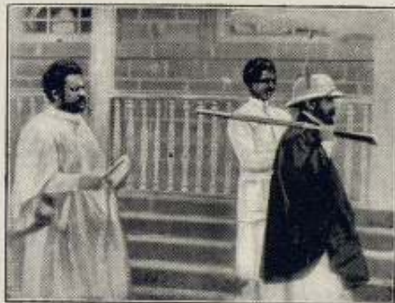
El Emperador de Abisinia dirigiéndose a revisar sus tropas