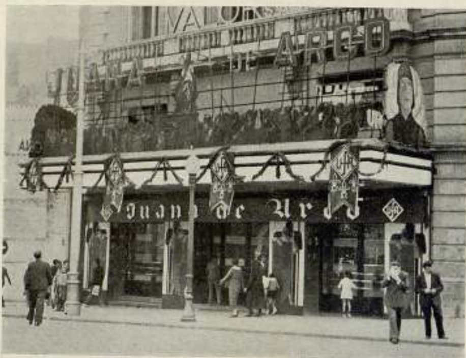
La fachada del Urquinaona durante los días que se proyectó Juana de Arco , la superproducción de arte «U. F. A.»

Film espectacular e histórico. No es una biografía de la Santa; es una recopilación de los episodios más relevantes de su vida, como son la reconquista de Orleans, la coronación de Carlos VII, y su condena a morir en la hoguera