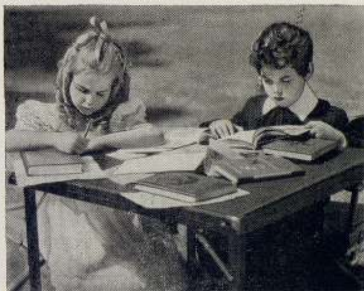
El ser famosos actorcillos de cine no excusa a Virginia Weidler y Dickie Moore de tener que aprenderse las lecciones y hacer las tareas, ni más ni menos que cualquier otro niño de escuela. Aquí los ven ustedes: a ella, resolviendo un problema de aritmética; a él, repasando la geografía. Y esto ocurre en Pasadena (California) durante uno de los entreactos de la película de la Paramount Peter Ibbetson .