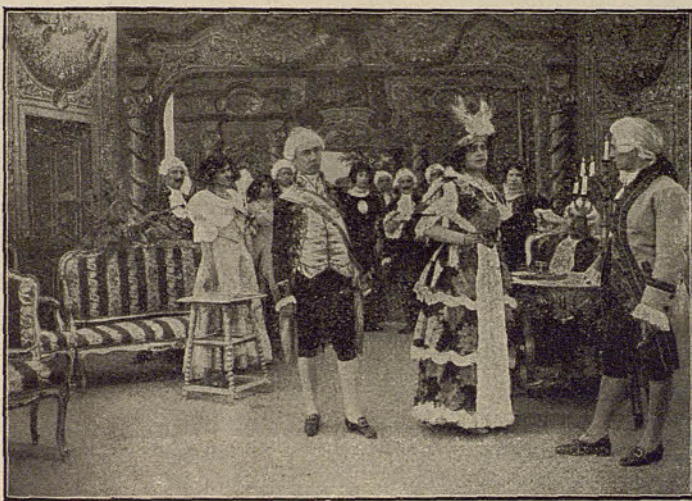
PATHÉ FRÈRES. - Luisa Miller

Asediada por el conde y lady Clarence, Luisa Miller consiente al fin en renunciar á Ferdinand, haciéndole creer que ya no es digna de ser su esposa.