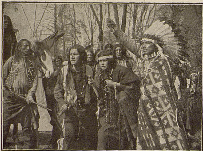
PATHÉ FRÈRES. - La india blanca

le robaron... Se ponen de acuerdo, y favorecidos por las sombras de la noche, se fugan del campamento indio. Una diligencia los espera; pero perseguidos por los indios, bien pronto la White Squaw cae de nuevo en poder de aquéllos. Regresados al campamento, los indios intentan poner á su amiga en lugar más seguro; pero en estos acontecimientos, llegan unos cow boys, que vencen á la tribu.