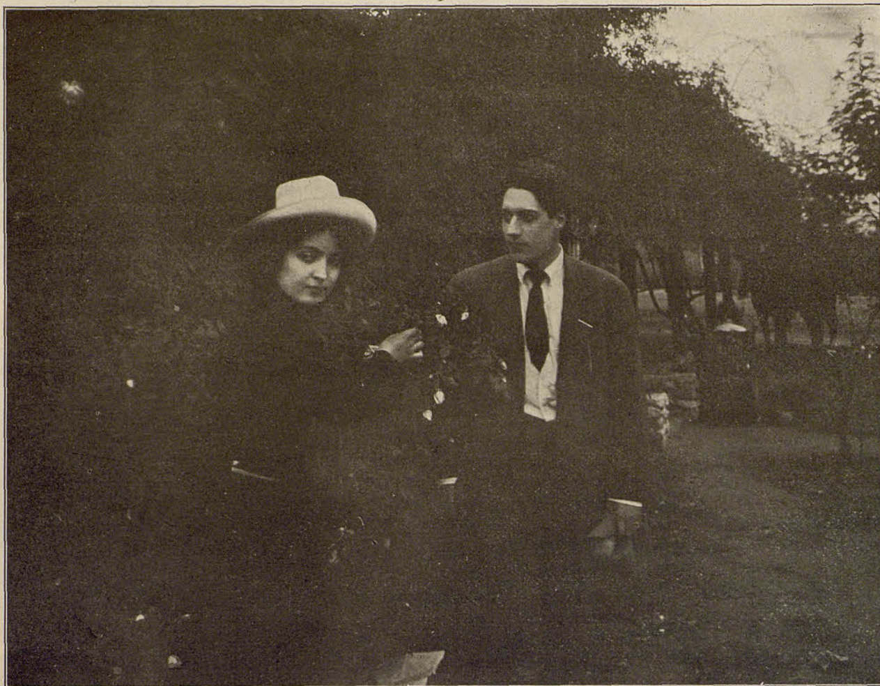
CALEM CO. INC.—El camino torcido

hacendado, quienes lo recogen y lo adoptan después de saber su triste historia.