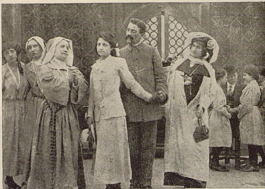
MILANO FILM.—El despertar de un corazón

¡EL DEMONIO DEL JUEGO! ¡Cuántos obreros, sin acordarse del hijo que pide pan, se han jugado su jornal!