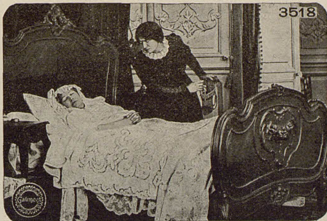
GAUMONT.—Aventurera ó la dama de compañía

Se ha sentado á la mesa de un café una pareja. La mujer, una señora alta y morena, frunce el entrecejo, el hombre tiene el aspecto de un granuja. Está leyendo el periódico; de momento hace un gesto y pasa el diario á su mujer señalándole un anuncio. Se trata de una señora