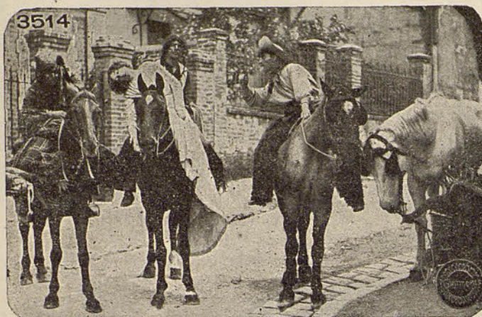
GAUMONT.—Aventura de tres pieles rojas en París

Sus caballos estaban dispuestos, pusieron atravesados