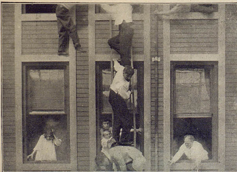
SELIG POLYSCOPE & CO.- Corazón de cobarde

El viejo Rey ha muerto y el Príncipe heredero y los próximos parientes se encuentran afligidos al rededor del lecho de muerte. Al ceñir la Corona Real sobre la cabeza del Príncipe, manifiesta á su pueblo que ha hecho colocar una campana de plata á la entrada de Palacio, á la que hará tocar cada vez que se sentirá feliz y venturoso reinando á su pueblo, haciéndole comprender así su felicidad. Con brillante arrogancia vemos al joven soberano de pie ante su trono rodeado de los grandes y gentiles hombres del Reino, los que se regocijan de ver como se le ama, quien sintiéndose en aquel momento extremadamente feliz, quiere hacer tocar la campana. Se abren las puertas del Palacio, y vése una gran multitud