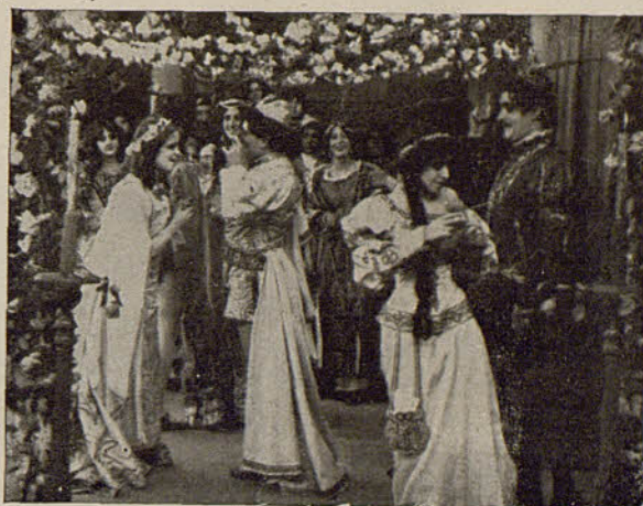
AMERICAN BIOGRAPH Co.—Amor de antaño

Durante el encuentro, un guardia entra, y la muchacha le esconde en un sombrío departamento. El padre es