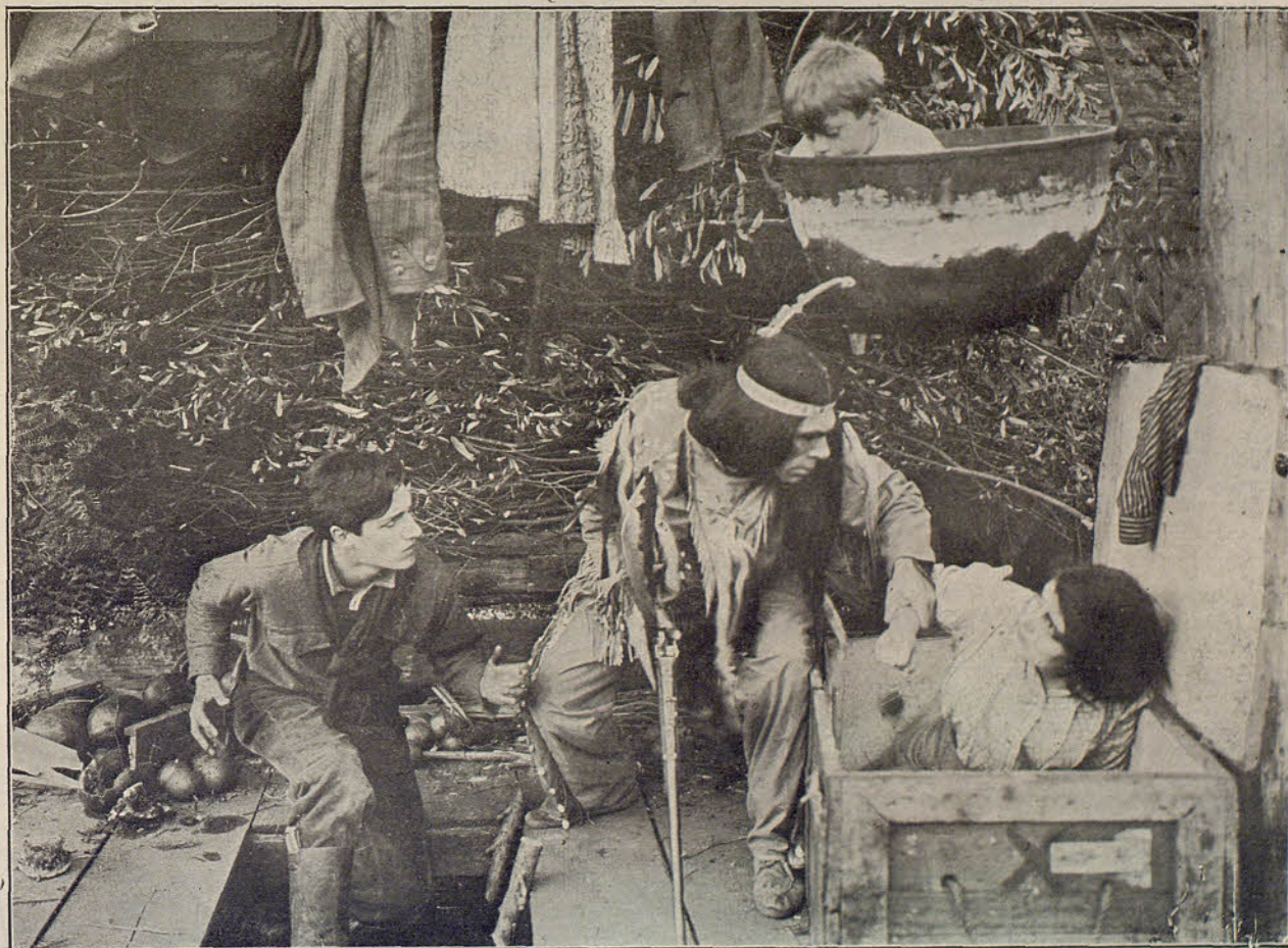
CALEM CO. INC.—El lazo perdido

En el placer de su amor propio satisfecho, reconcilianse el señor Procopio y la señora Leblanc con gran satisfacción de sus hijos, que con una sustitución de páginas de música han calmado la cólera de sus respectivos padres.