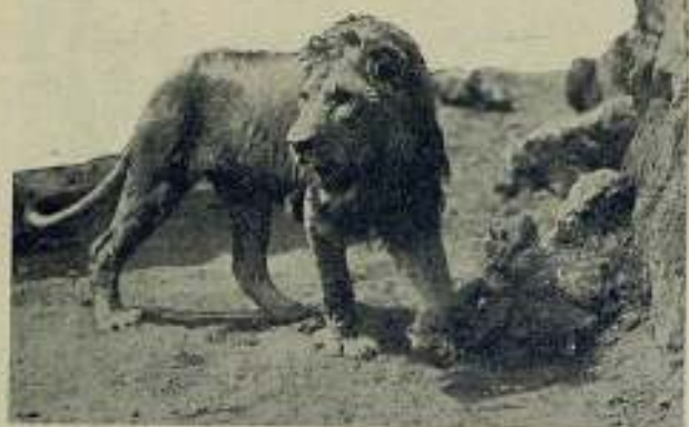
De la película Tierra de Expiación

oído decir, si bien no podemos asegurar que ello sea cierto, una de sus sucursales, la primera de todas, ha sido ya abierta en Berlín. En tal caso no sería extraño que