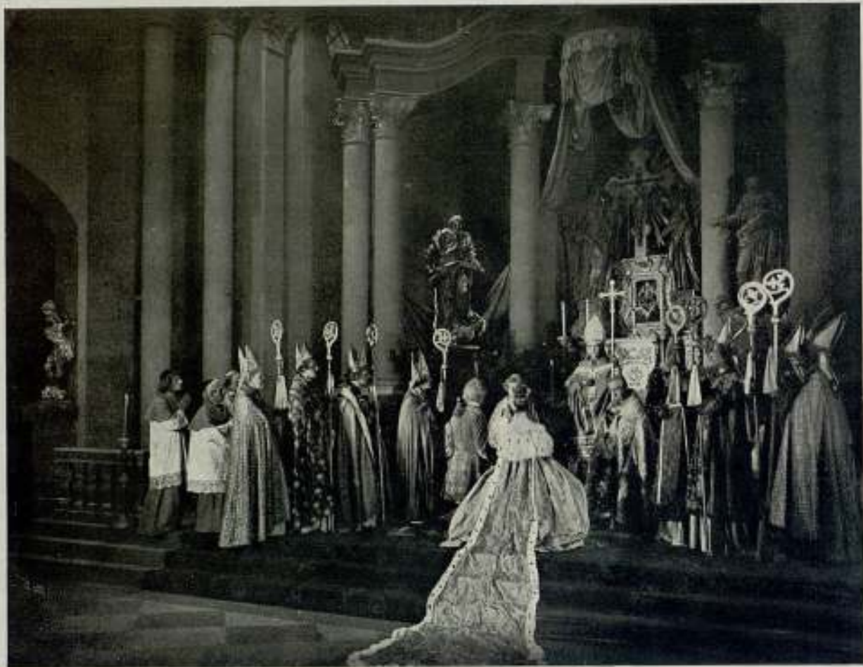
UNAS ESCENAS DE LA OBRA