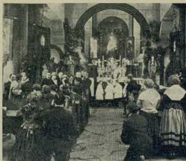
Dois persones de la obra Los amores de Euzara Ubalá , exclusiva de la «Cinemanud Film, S. A.»

vayan produciéndose en todo el mundo. No careciendo, como no carecen, de ninguno de los elementos necesarios, es de esperar que todos sus planes en ese sentido se realicen. Desde luego puede ya apuntarse un acierto la naciente Sociedad, el cual