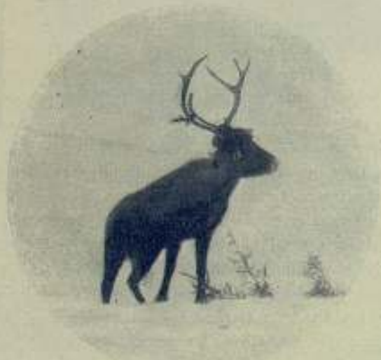
Algunas escenas de Desierto Blanco

El Desierto Blanco , dos cine dramas que unen al interés de su argumento, verdaderamente emocio-