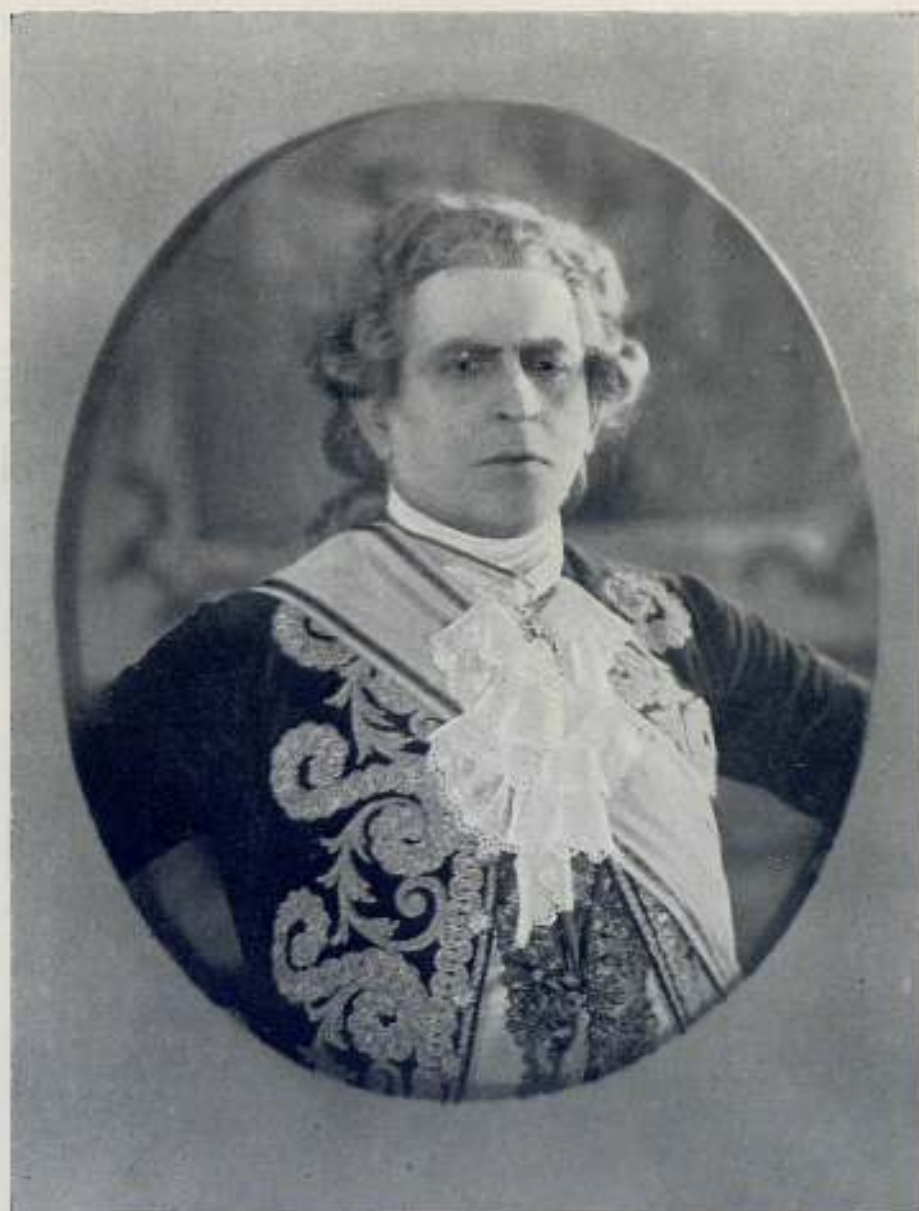
LUIS XV