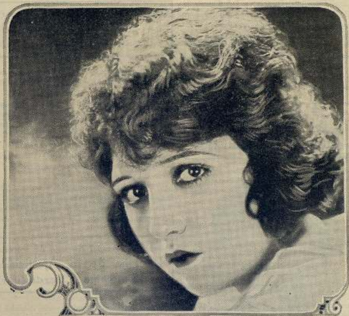
BEBE DANIELS starring in Paramount Pictures