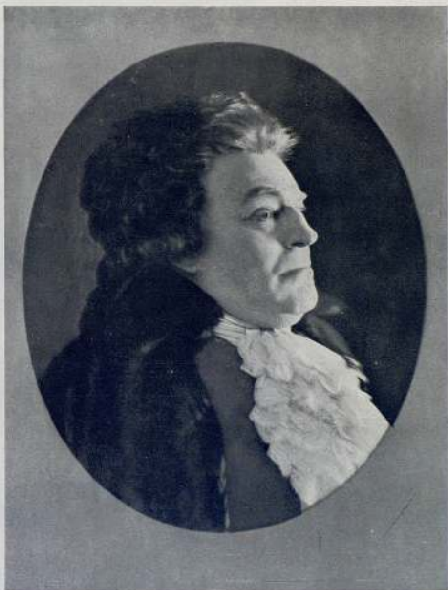
MIRABEAU (H. Valentin)