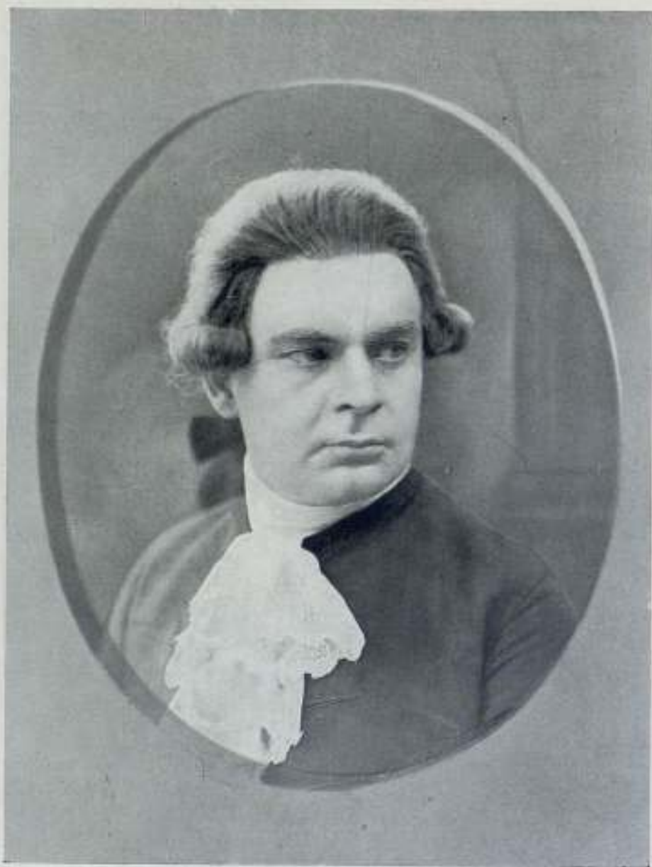
LUIS XVI