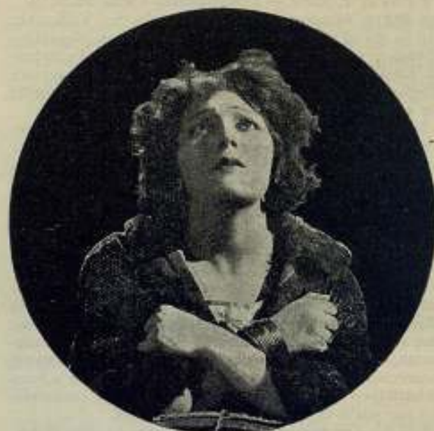
La cantante nacionalista RAQUEL MELLER en su última producción cinematográfica Los Oprimidos

Felicitemos sinceramente a D. José M. a Bosch y de veras deseamos que el éxito corone su gran esfuerzo, pues, tanto por su capacidad como por la forma de instalación, estos nuevos laboratorios están a la altura de los mejor instalados del extranjero.