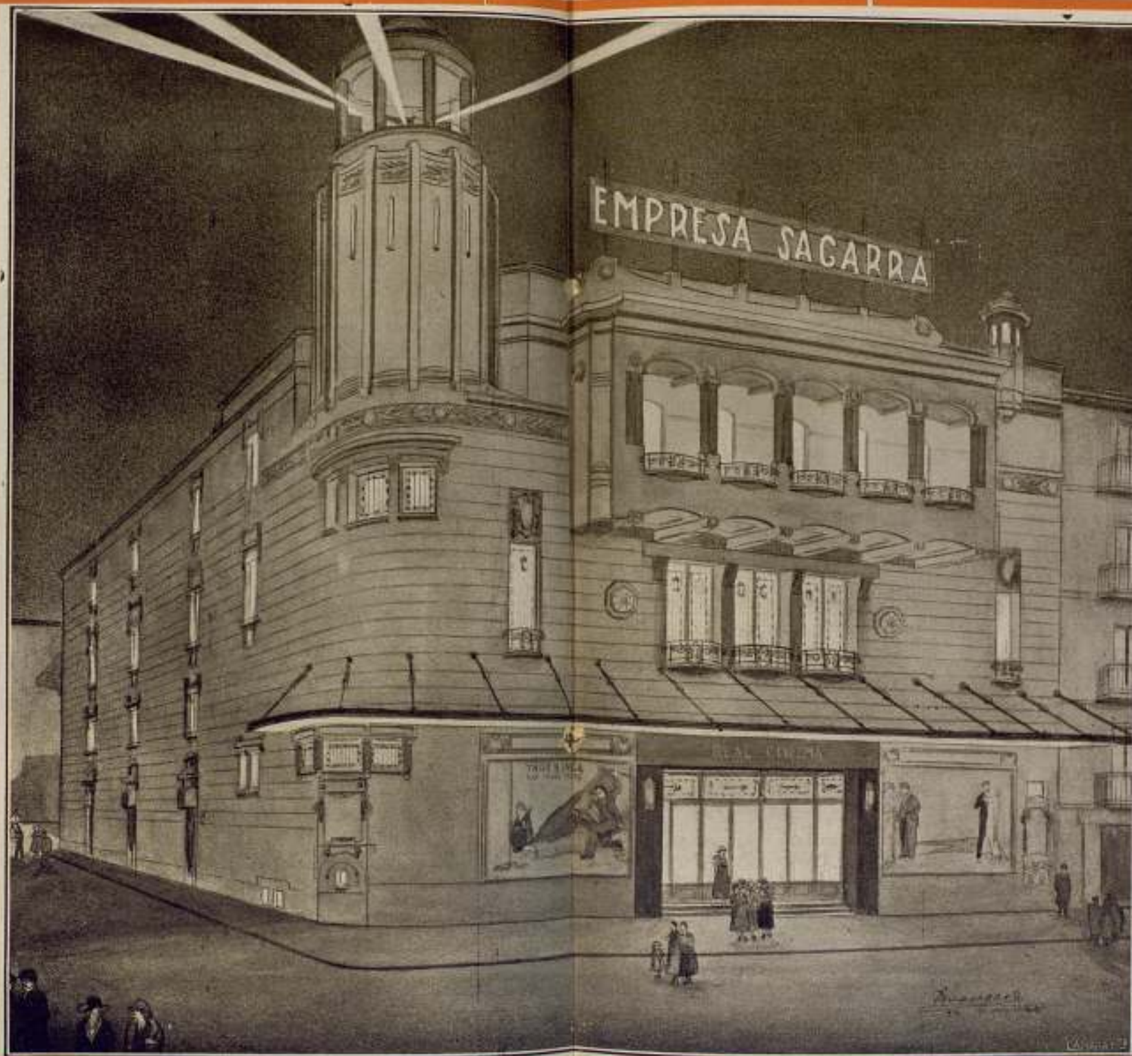
Vista general del REAL CINEMA, de Madrid, grandioso cinematógrafo propiedad de la Empresa Sagarra (S. en C.), que se construye en la Plaza de Isabel II.—Este cinematógrafo, el mejor de España, servirá de modelo para las construcciones sucesivas de locales para espectáculos.

La vista general de la sala del Real Cinema producirá, seguramente, una impresión indescriptible.