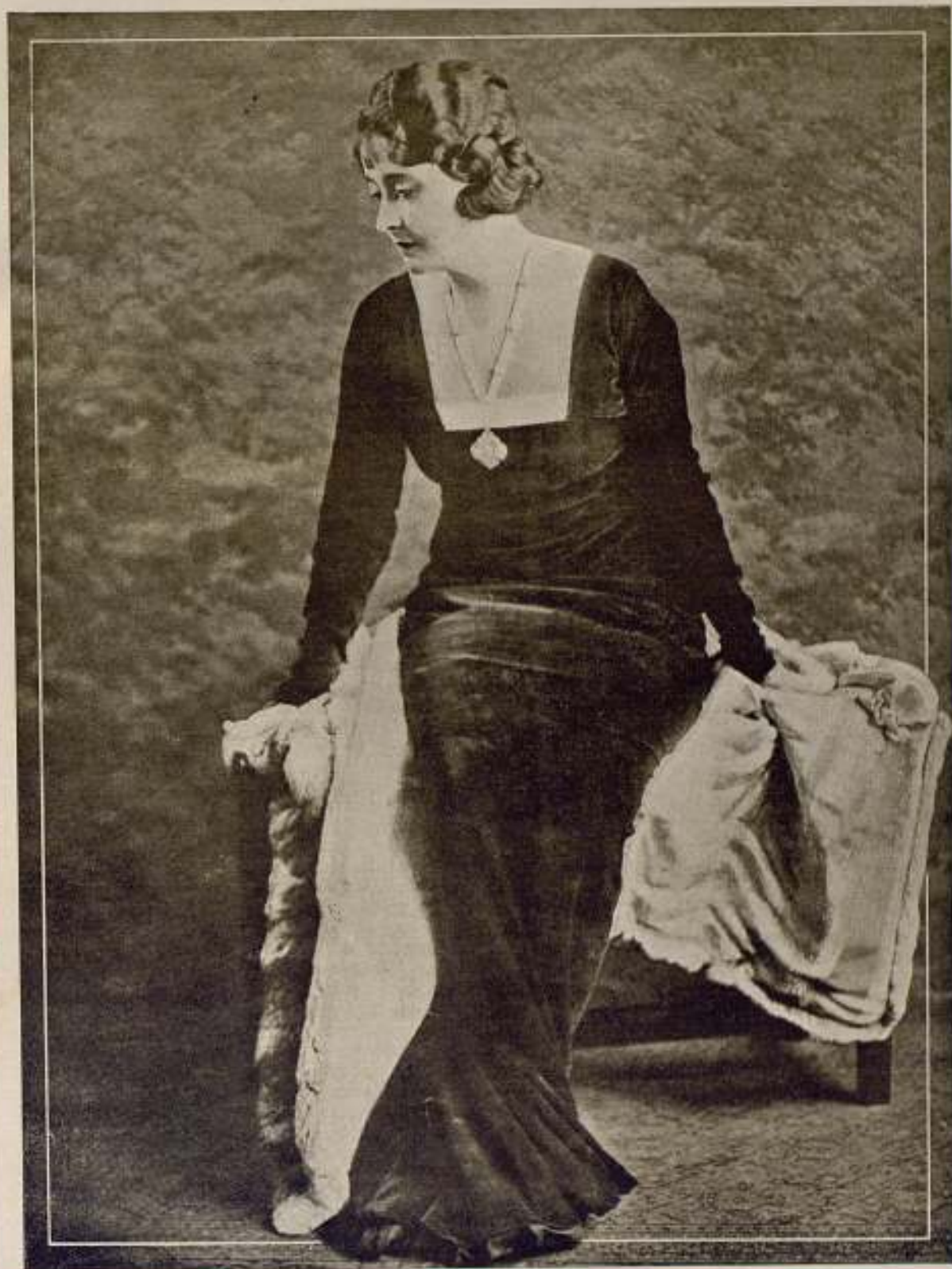
CLARA KIMBALL YOUNG

Una de las más interesantes estrellas de la "SELECT PICTURES"