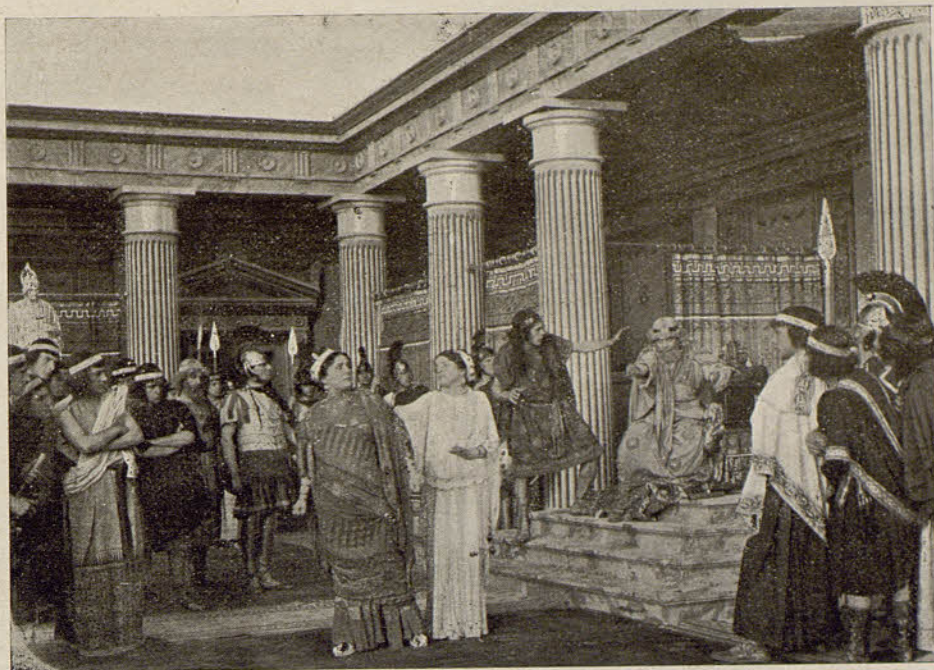
CINES. — Antigone

su pobre violín á Linda, como recuerdo de la aventura de aquel día. Tito propone á María y su hermana de ir personalmente á dar las gracias á Linda, pero las dos muchachas para salir, se ven obligadas á vestir los trajes de las señoritas.