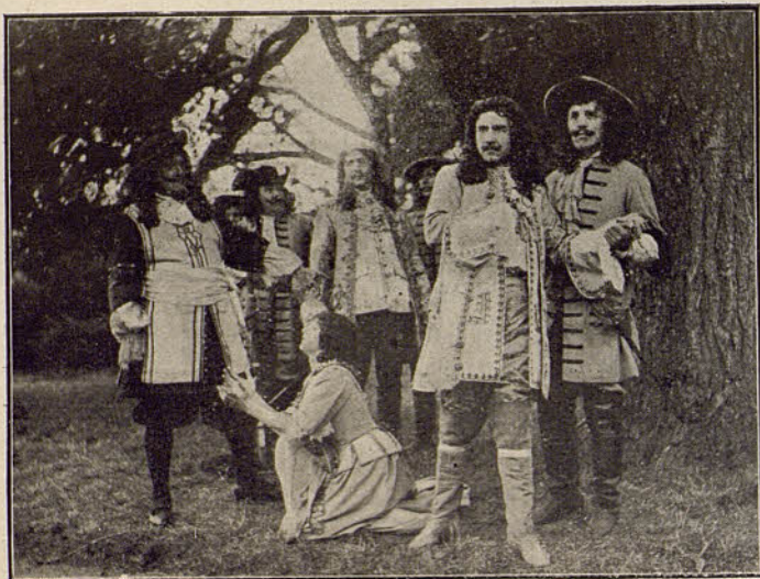
PATHE FRERES - El impostor

Esta oruga, que solamente vive en los campos de zanahorias, es de un color que le facilita mucho poderse confundir entre las plantas. Avanza por medio de seis patas, cerca de la cabeza, y doce ventosas en la parte trasera.—Para defenderse está provista de dos cuernos, que segregan un líquido tan mal oliente, que obliga á retirarse á sus enemigos.—Se alimenta de las hojas de la zanahoria, sin que sea por esto un animal temible para la agricultura.—Cuando está ya desarrollada del todo, se cuelga por medio de fibras y se transforma en crisálida; cuarenta y