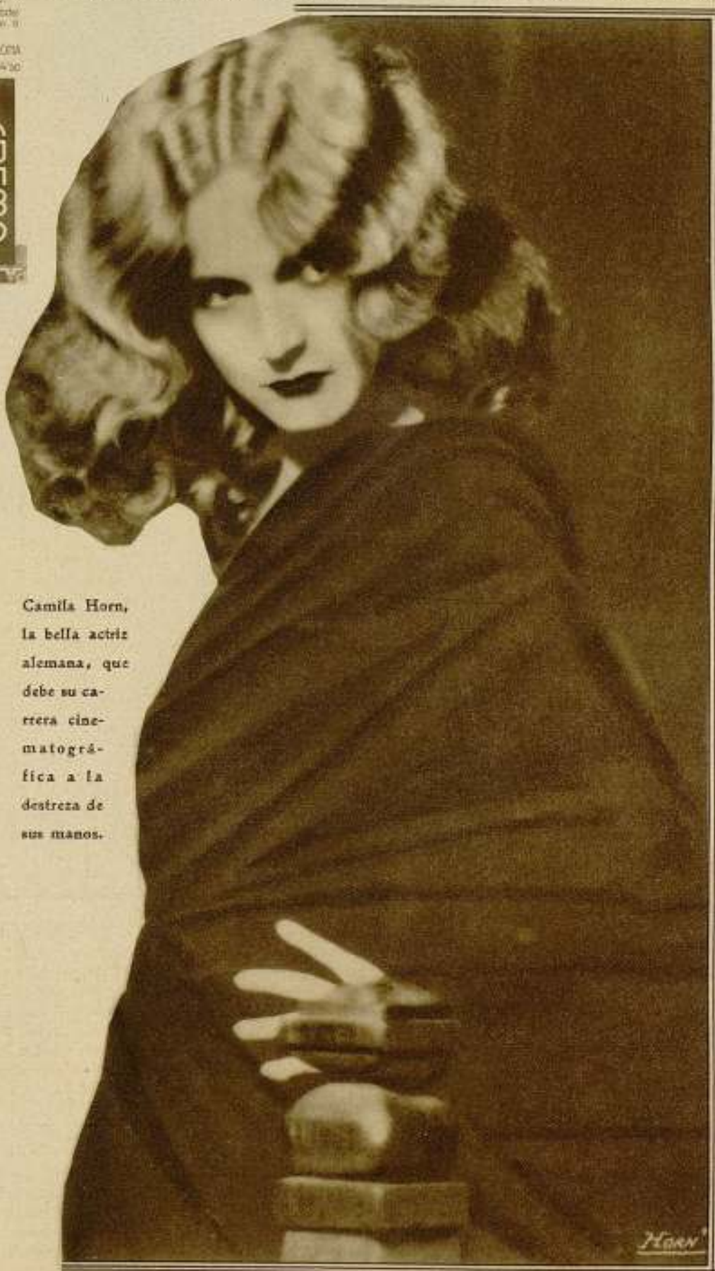
Camila Horn, la bella actriz alemana, que debe su carrera cinematográfica a la destreza de sus manos.