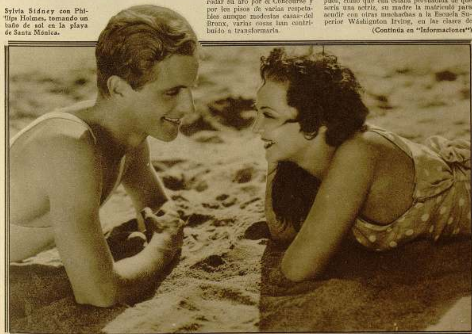
Sylvia Sidney con Philip Holmes, tomando un baño de sol en la playa de Santa Mónica.

politano de la casa de vecindad de piedra por donde se sirve de fondo a la obra.