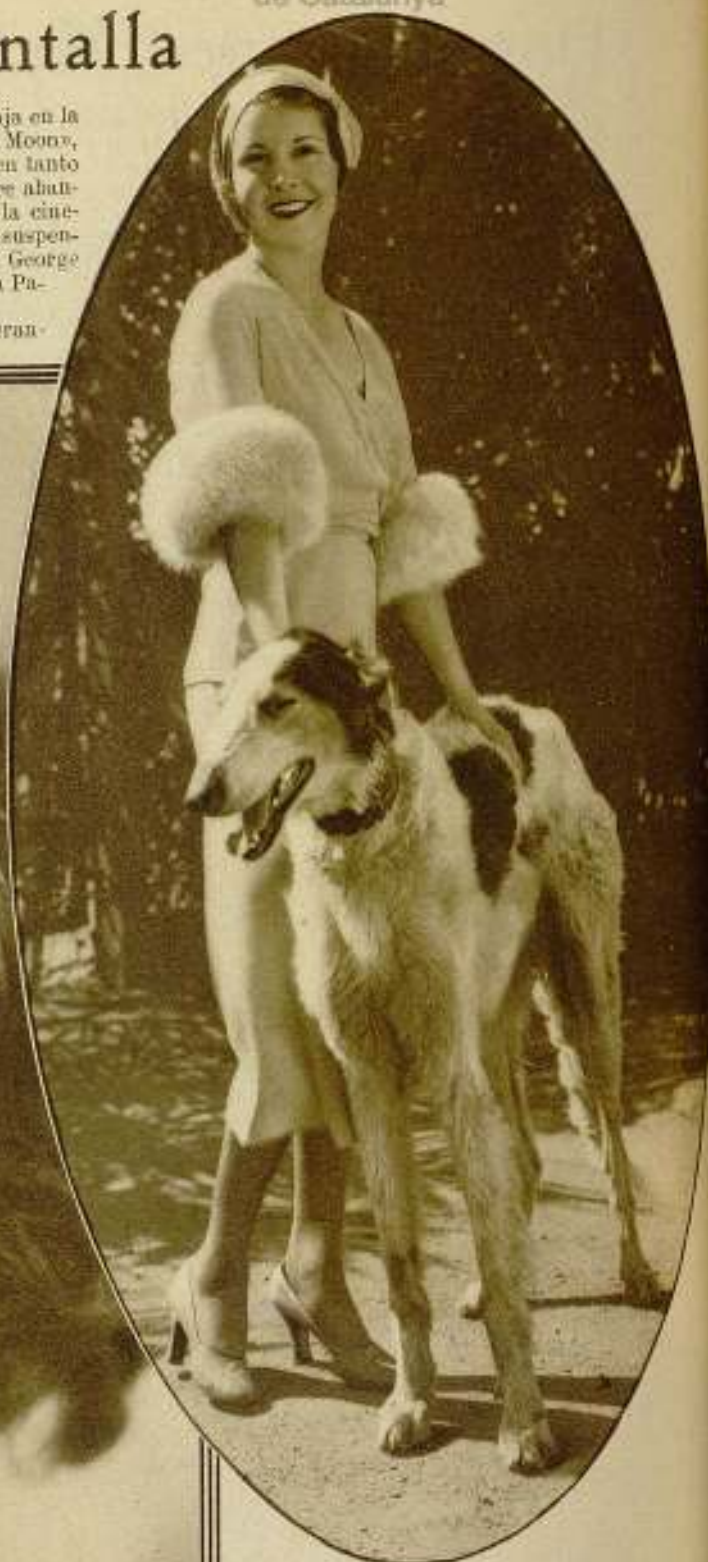
Frances Dee, la bellísima actriz de la Paramount, con su perro favorito, en los jardines de su chalet.

cia de los actores y procedentes de los templos de Minerva, sobre las actrices, de la siguiente manera: Como quiera que los actores masculinos son generalmente de edad más madura, pueden esperar a concluir sus estudios para ingresar en la cinematografía, en tanto las muchachas tendrían que esperar a concluir su carrera... para llegar demasiado tarde.