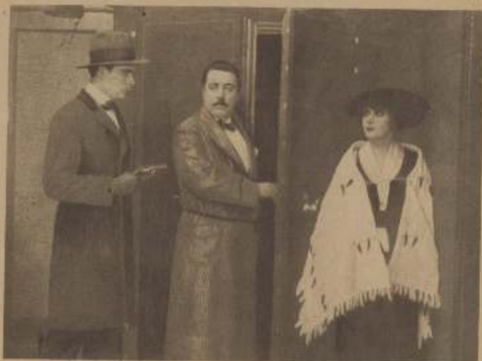
Dans l'un Palace n° 10.

SOUS LE MENACE DU REVOLVER DE SANKARA, CARSLAKE OUVRE SON COFFRE-FORT.