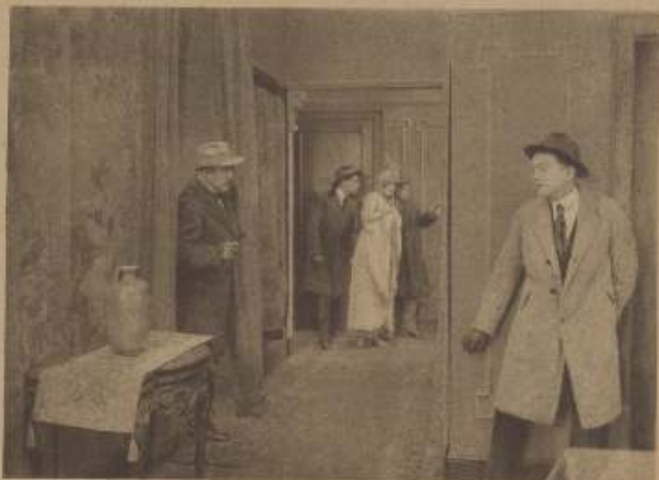
Photo d'un film récent.

CARLISLE SURVEILLE LE GROUPE DES HINDANS SANS SE DOUTER QU'IL EST LUI-MÊME ÉPIÉ PAR CARLTON.