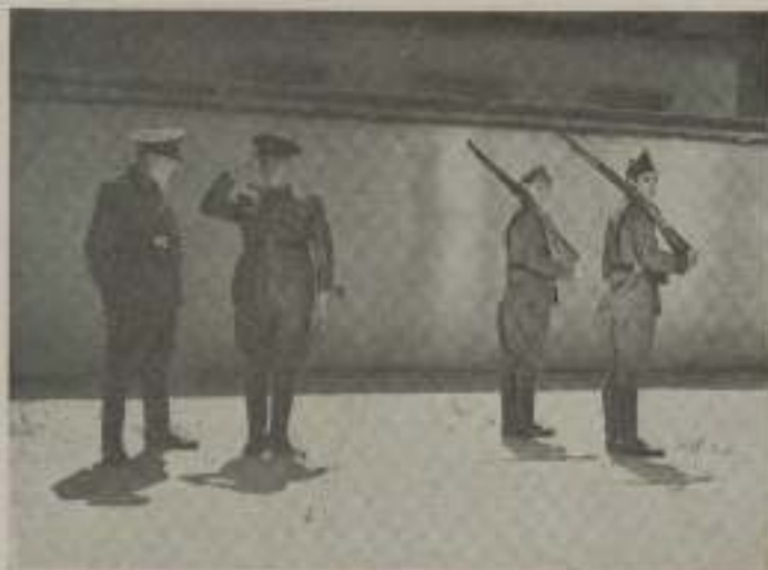
- Señor sub-oficial, le concedo ocho días de arresto para que se aprenda usted...