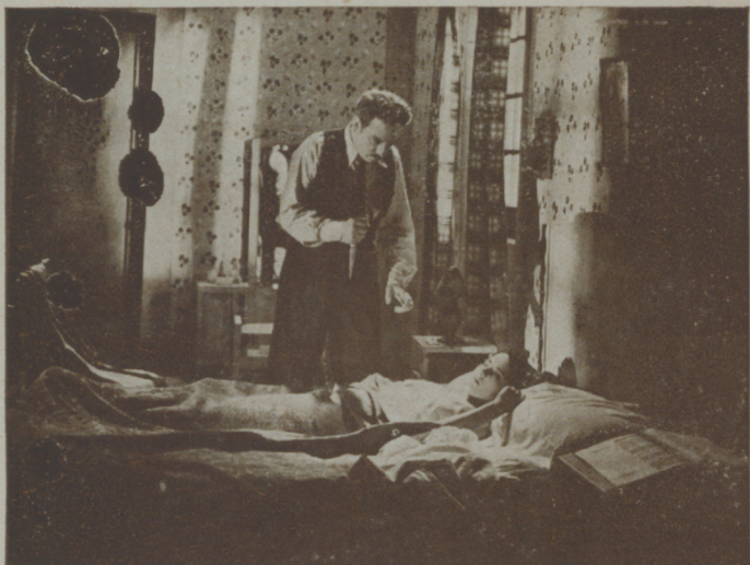
Se fué al lecho de su hija y cuando levantó el cuchillo...