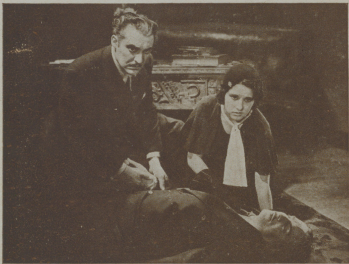
Uno de aquellos ataques cardíacos que sufría cortó el hilo de su vida.