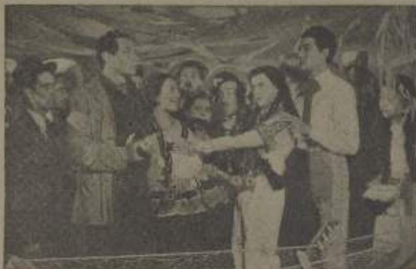
Muchos se habían dado cuenta de que Gloria había cambiado de pareja.