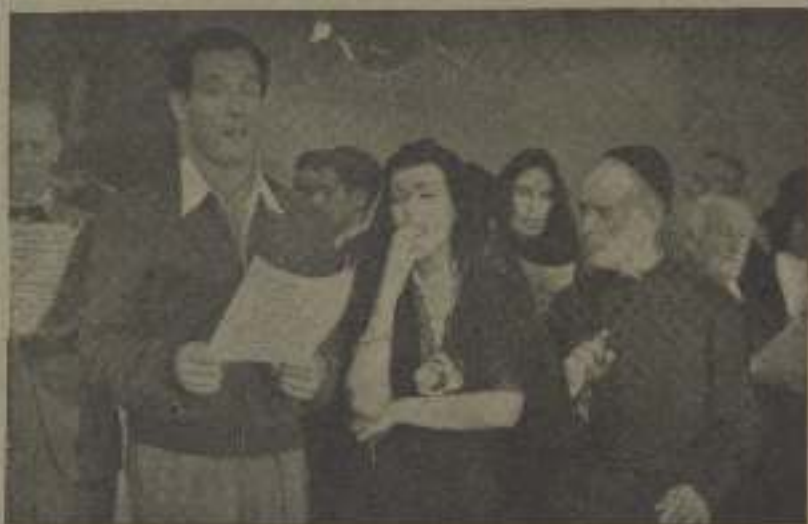
Todas las muchachas e- peraban a los señores