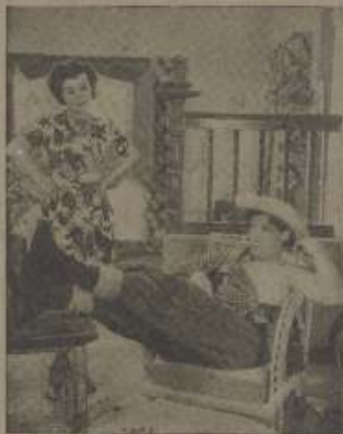
—He cumplido con mi deber cuidándole.