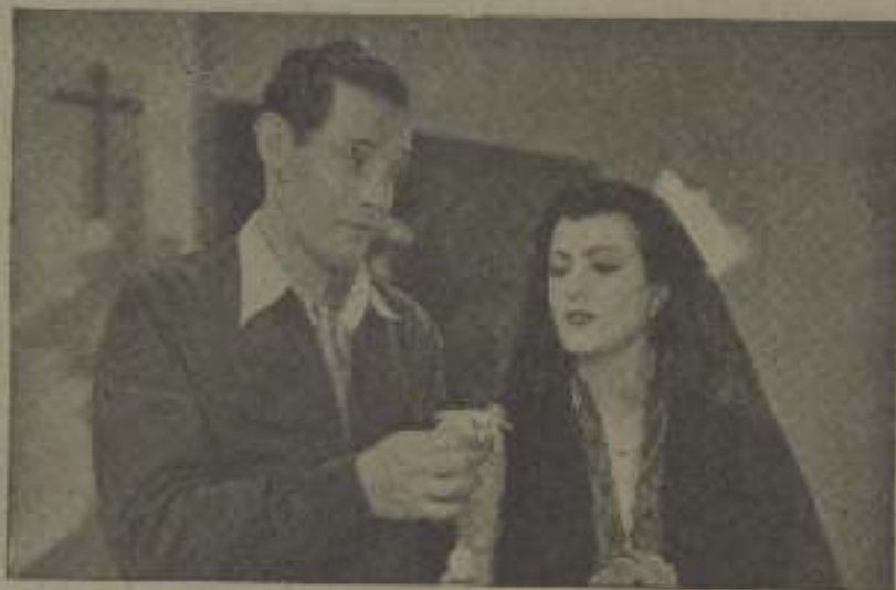
"Gloria tuvo de la margari- ta y dejó el Nola