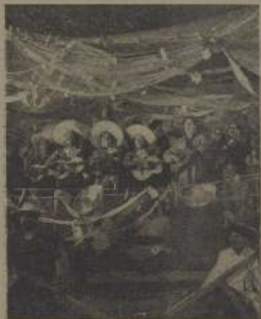
La canción había sido coreada por todas las orquestas.