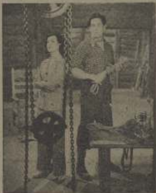
—¡No esperaba su visita!