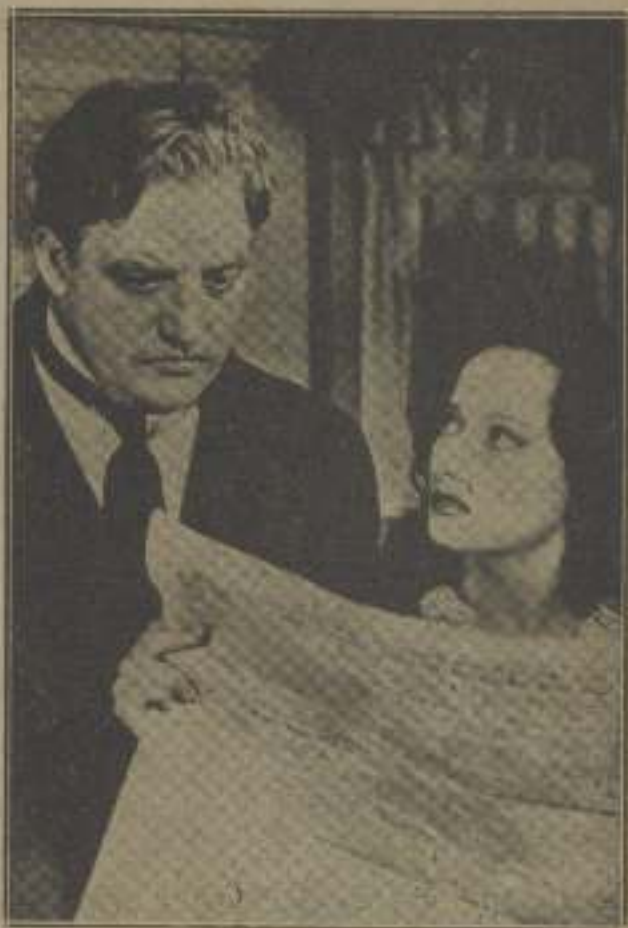
Eludió la voz por encima de su hombro.