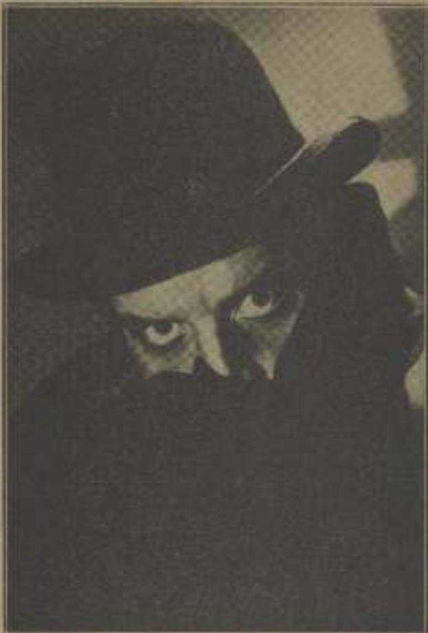
Los emboscado y sus ojos reflejan el terrorismo.