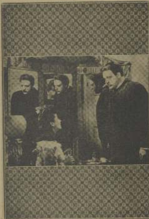
El sapo se reflejaba tres veces la inmensurable persona de Glade.