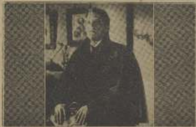
El desconocido se portó de una manera extraña.