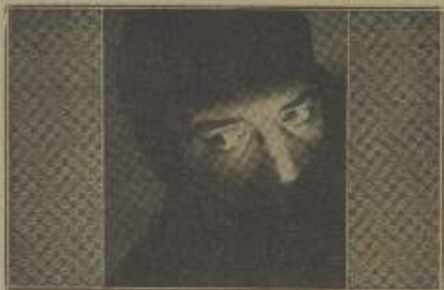
Y él solo caminaba hacia abajo.