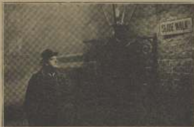
Un hombre corpulento, que momentos antes había estado avanzando el extremo de una calle...