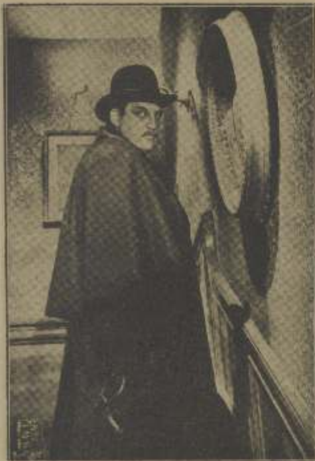
El Inquilino había sigilosamente sus cuarteros...