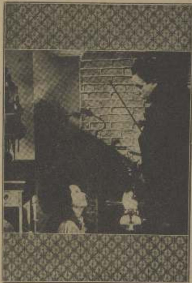
Kitty estaba bellísima y Linda levantó el visor sobre ella.