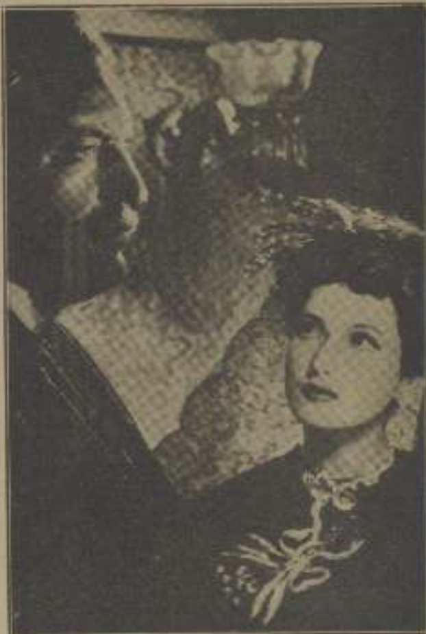
Kitty le miró con curiosidad.