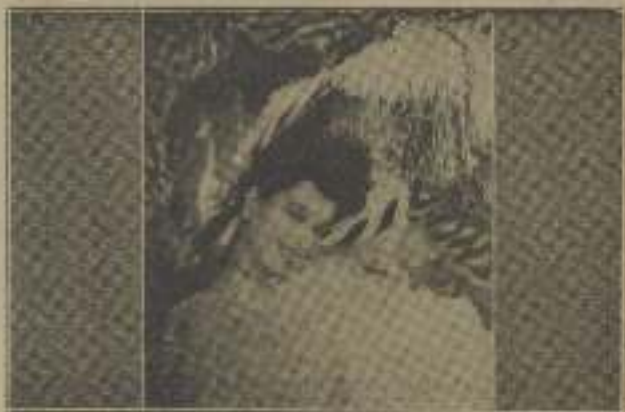
Kitty, una hermosa y madura con su elegante estilo.