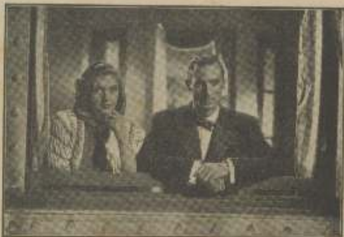
—¿También es usted sentimental?—preguntó Mary. Y en su voz no se sabía si había un chispazo de burla o un latido de emoción.