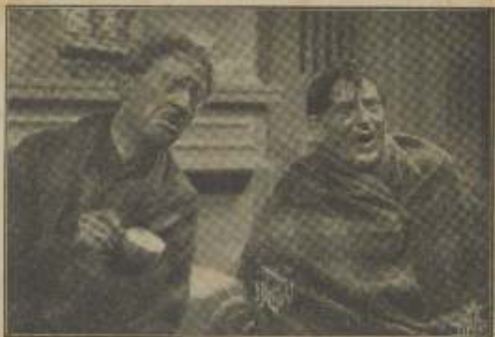
Les ampararon en montañas, dándoles bebidas calientes para hacerles entrar en reacción.