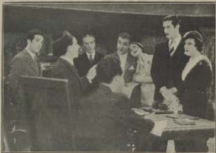
Puede usted casarnos, señor Juez.