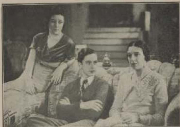
—¿Que estás decidida a casarte, madre?