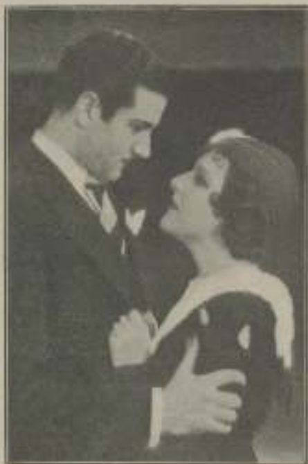
—¿Es verdad que fue al convento todos los días para verme can- tar?