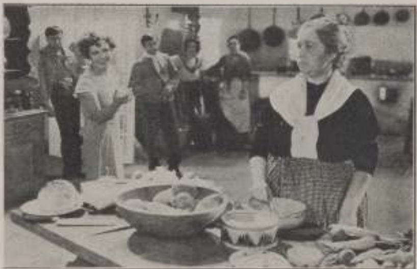
—A las once, toma la señora un caldo...