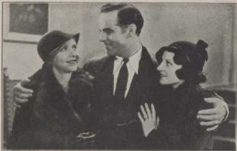
—Has rejuvenecido desde el otro día.