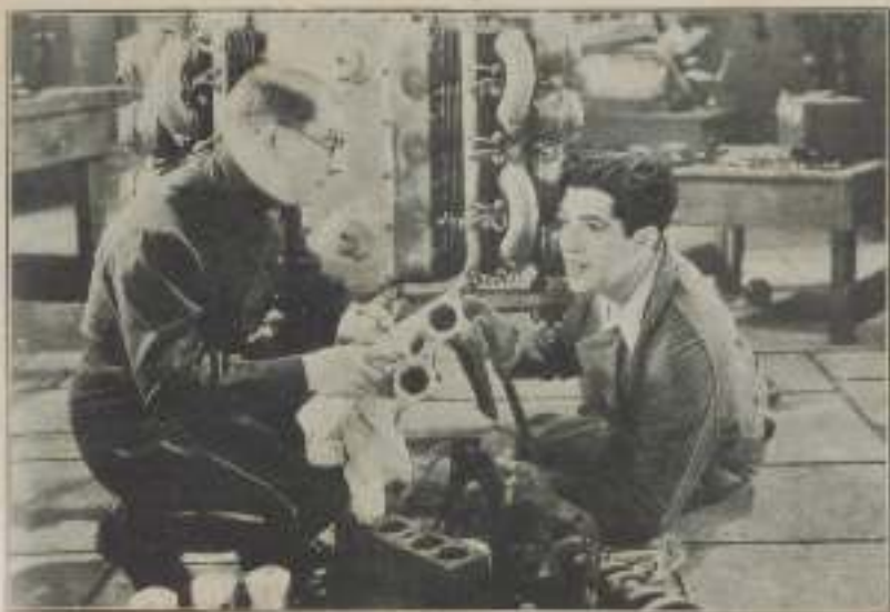
— ¡Los glances! Olígame.