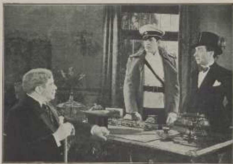
— ¿Estás satisfecho de su infante?