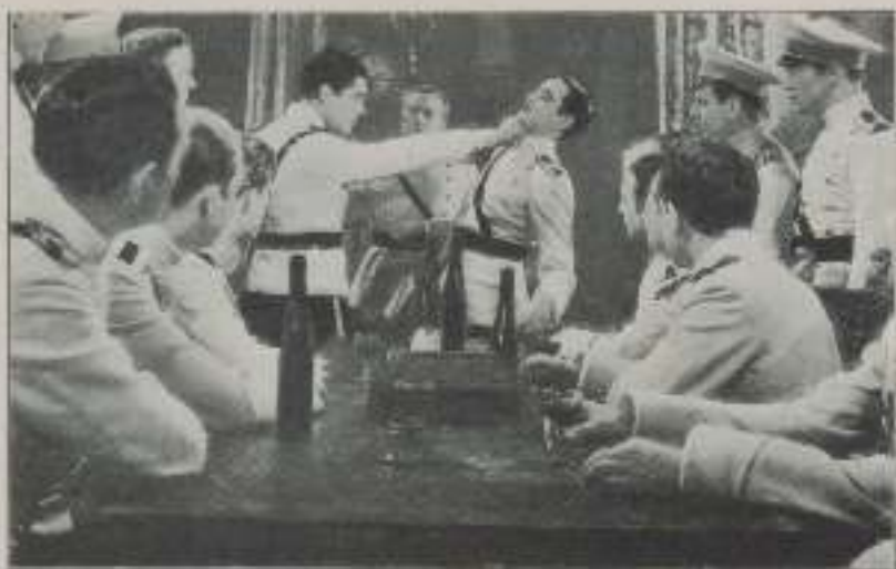
Acto seguido, le dió un formidable directo en la barbilla.