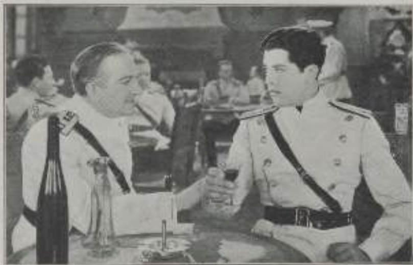
— No te tome tan a pecho su Alteza.