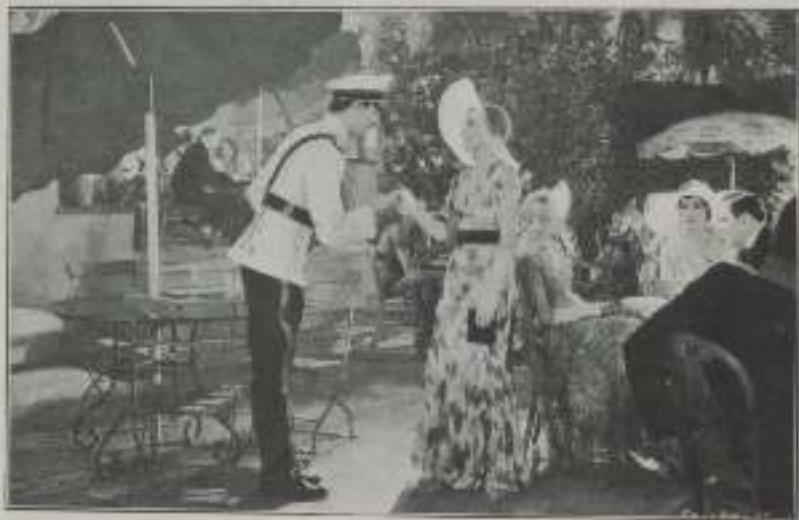
— Señorita ...