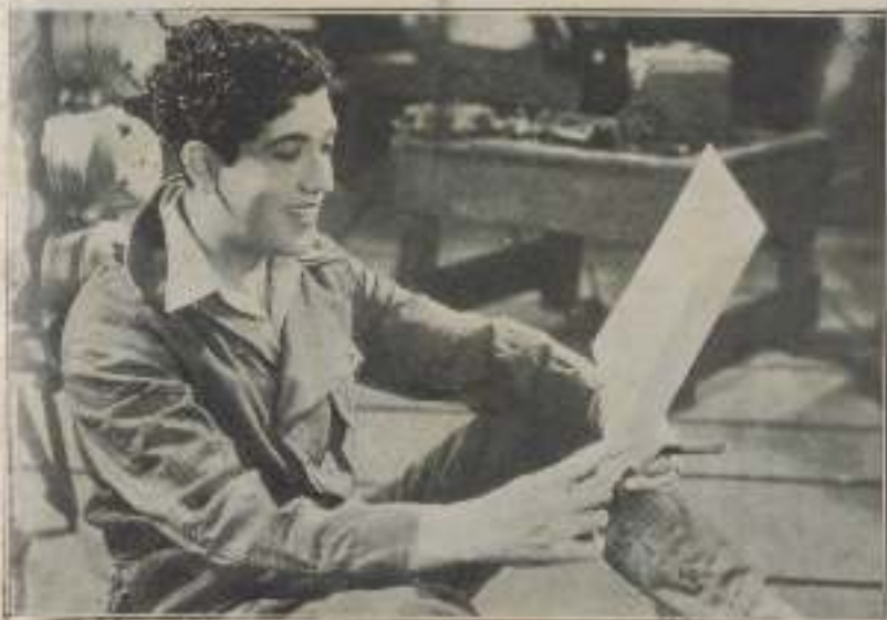
Pero ¿esto es una condessa?