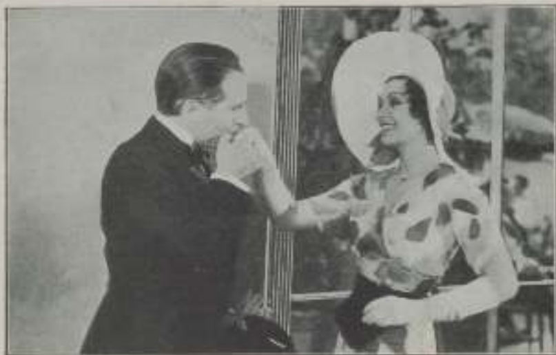
— ... Ella usó escaladora.