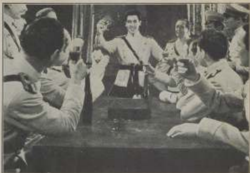
— ¡Por las mujeres!