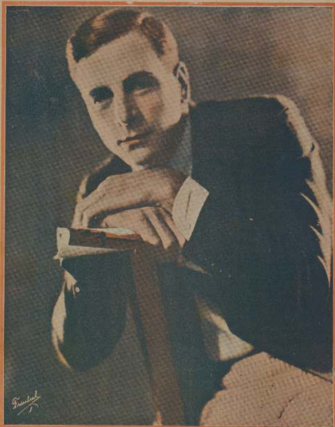
MILTON SILLS, uno de los más jóvenes y famosos actores de la Universal, en la notable super- joya de dicha marca, «Una dama de calidad», estrenada en el Kursaal y Salón Cataluña con gran éxito