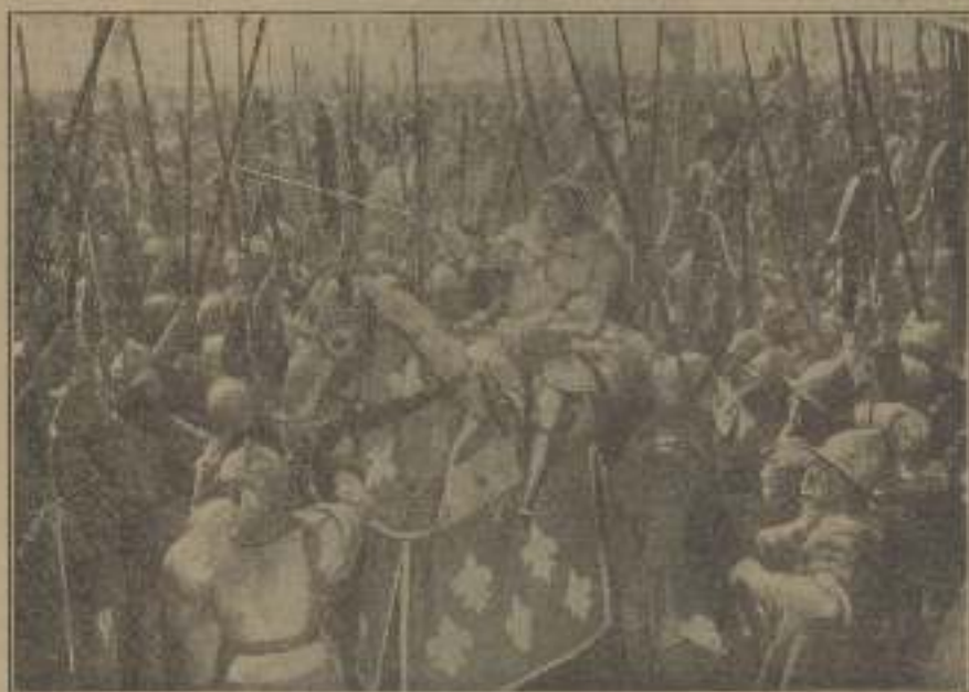
Luis XI a su alijado

mente, dándole a besar su mano, lo que no pudo obligarlo a recibirlo benévolo.