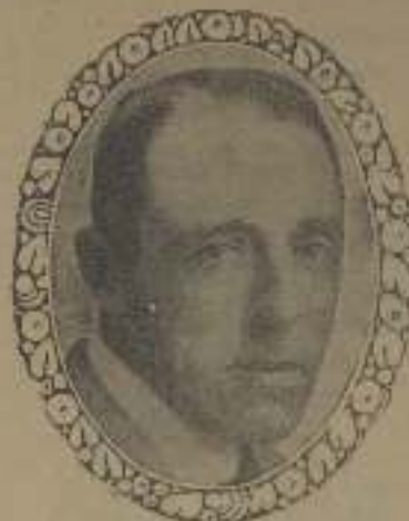
D. W. GRIFFITH