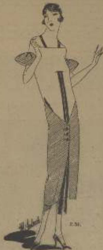
Vestido de algodón verde. La parte alta del vestido es de un verde más claro. Botones y cinta color piel.