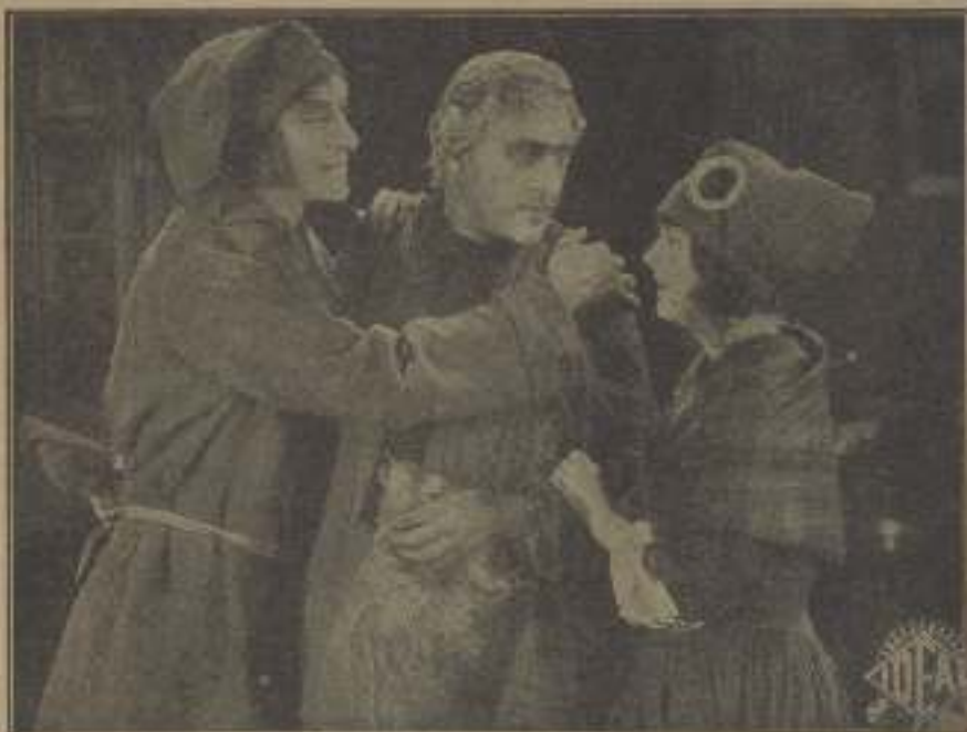
—¿Descubrió usted cómo quitamos pañuca y postiza?

La joven, que mentía, poniendo en entredicho su honra inmaculada por salvar al hombre a quien ella misma posiera en tal trance, fué sometida a juicio bajo la acusación de calumnia contra un representante del pueblo.