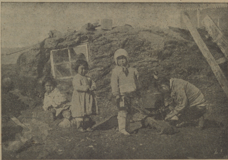
Una escena de la película de excepcional interés «La última expedición al Polo Norte de Knud Rasmussen», extraordinariamente curiosa y típica, que se proyectará en breve en los cines de esta capital

En lengua inglesa aparecerá próximamente el libro de poesías escrito por Rodolfo Valentino y titulado «Sueños de día». Auguramos al editor un espléndido negocio.