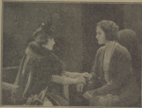
Una interesante escena de la grandiosa película «De mujer a mujer»

Las «Selecciones Capitolio» han añadido con «De mujer a mujer» un nuevo y legítimo lauro a su corona de éxito y de prestigio.