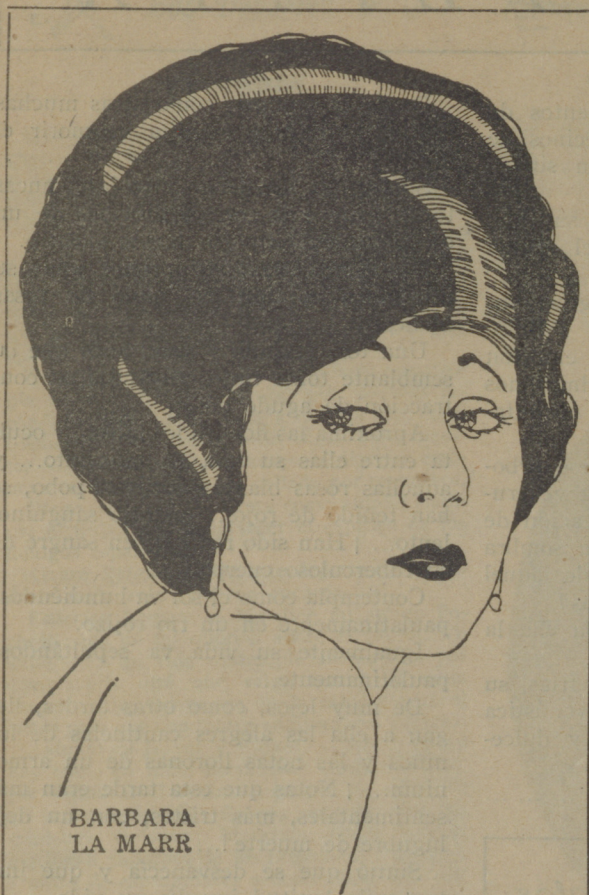
BARBARA LA MARR

la estupenda actriz cinematográfica a la que pronto veremos en la gran producción «La mujer que supo resistir», perteneciente a Selecciones Capitolio