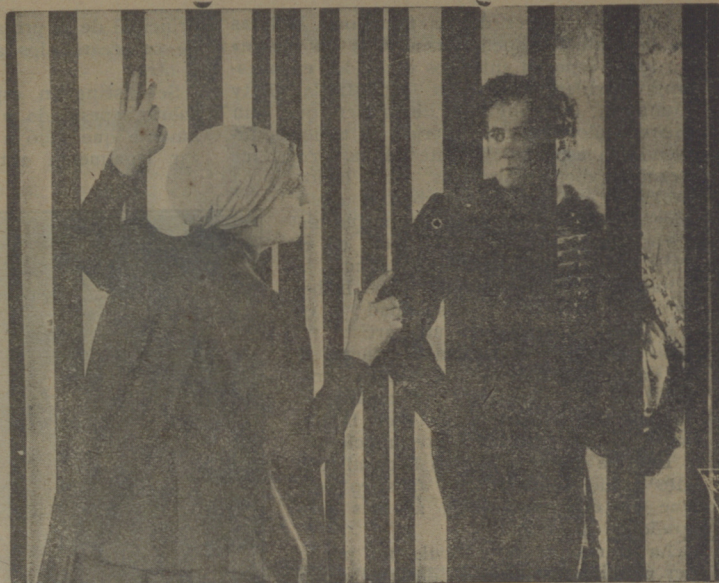
Unos días después la visitó Berville en la prisión...

María apareció entonces con el niño y lo entregó a Clara, diciéndole: