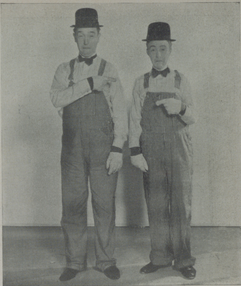
A STAN LAUREL le ha salido un imitador. He aquí con el gran cómico al muchacho que ganó el concurso de dobles

** Se dice que Lupe Velez y Johnny Weissmuller han reñido de nuevo y que una vez más ha sido presentada la demanda de divorcio... pero ello no quita para que los dos cenén amigablemente en el Trocadero o en el Vendome.