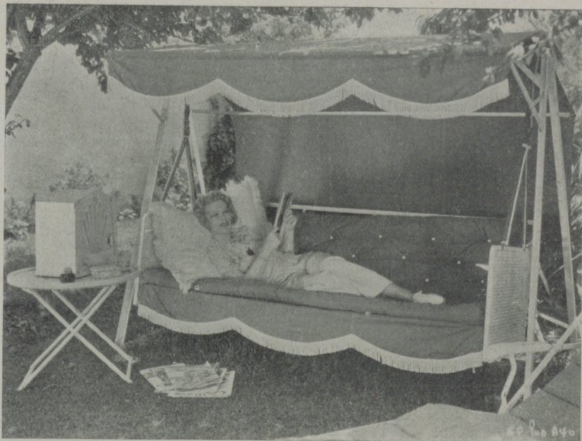
GLENDA FARRELL descansando de las fatigas del estudio en su casa de campo.

** Luis Alonso continúa siendo el predilecto de Constance Ben-