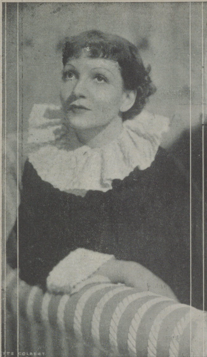
CLAUDETTE COLBERT, "estrella" de la Paramount, hoy una de las artistas más queridas del público.