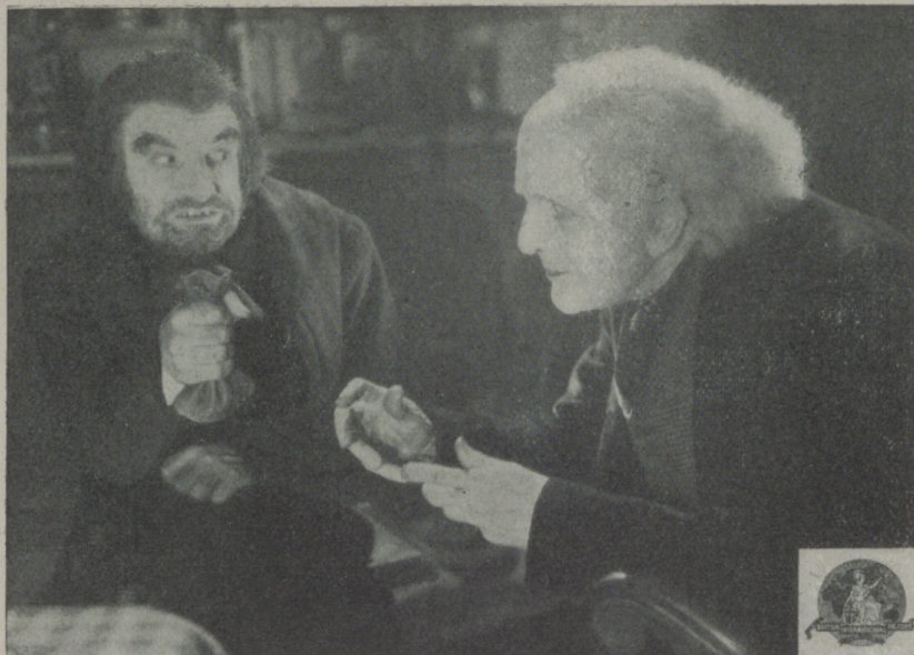
Una escena de "La tienda de antigüedades" que distribuye Cifesa

Sirviéndose de la novela de Carlos Dickens titulada "La tienda de antigüedades" la productora inglesa British International Pictures ha hecho un film, con el mismo título de la más alta calidad cinematográfica dentro de lo extraordinario