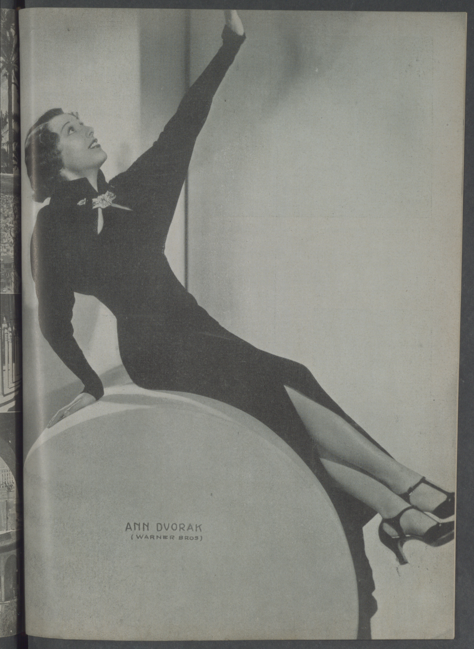
ANN DVORAK