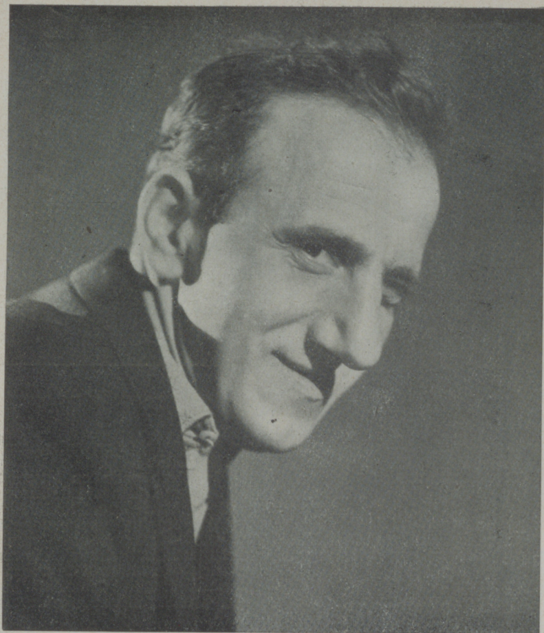
JIMMY DURANTE el hombre de las narices descomunales, que es a la vez un buen cómico.

** Max Baer está furioso porque la Paramount no ha determinado que película darle y el muchacho hace ya cuatro meses que cobra sin trabajar y esto lo tiene furioso porque le entusiasma actuar en la cámara.