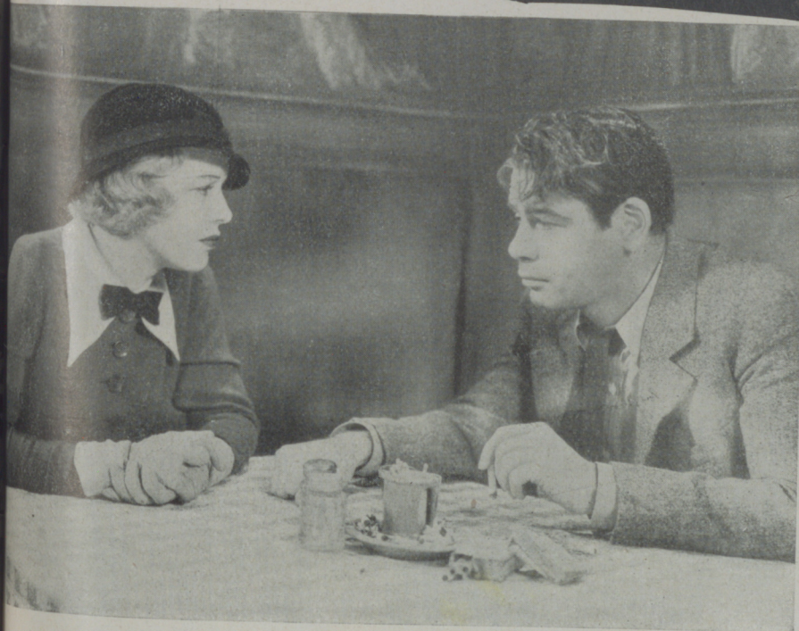
PAUL MUNI y GLENDA FARRELL, en una escena de "¿Qué hay Nelli?" de la Warner donde acusa una personalidad extraordinaria.

—En la cinematografía es muy difícil seguir el curso psicológico de un personaje por la sencilla razón de que la obra se hace sin hilación alguna. Yo me maravillo, después de interpretar una obra lo bien ligada que queda, pues hemos de tener en cuenta que, a lo mejor, se comienza por el fin y se acaba por el principio. En el teatro todo es liso y llano. El actor puede ir enterándose a medida que avanza la obra porque viviente en sí el ser que plasma éste tira de él con fuerza extraordinaria. En el cine es todo lo contrario. La obra se hace a trozos y el actor, que no ha vivido la acción inmediata, se encuentra con serias dificultades para hallar la situación más conveniente. Mi larga experiencia teatral me ha hecho conocer muy bien el tinglado artístico y ahora río cuando recuerdo aquellos días de mi infancia en Austria en que con mis padres y nuestra humilde barraca de feria recorriamos los caminos de Dios ganándonos el sustento. Aquello me hizo apreneder mucho,