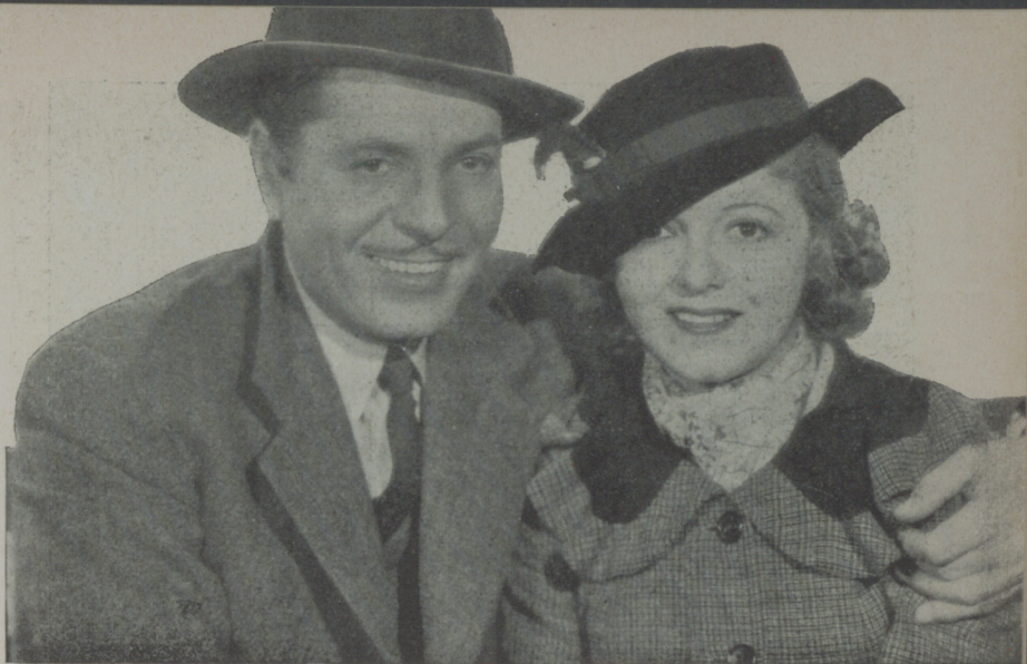
JANET GAYNOR y WARNER BAXTER en "Compañeros de Crisis" de la Fox

El forastero no cesa de buscar a Trent, y, tantas veces como tiene la pista, la pierde, no obstante la ayuda que le presta el joven Kit que le ayuda siempre. Kit es arrestado y encerrado en la cárcel por una intriga del usurero Quilp que quiere