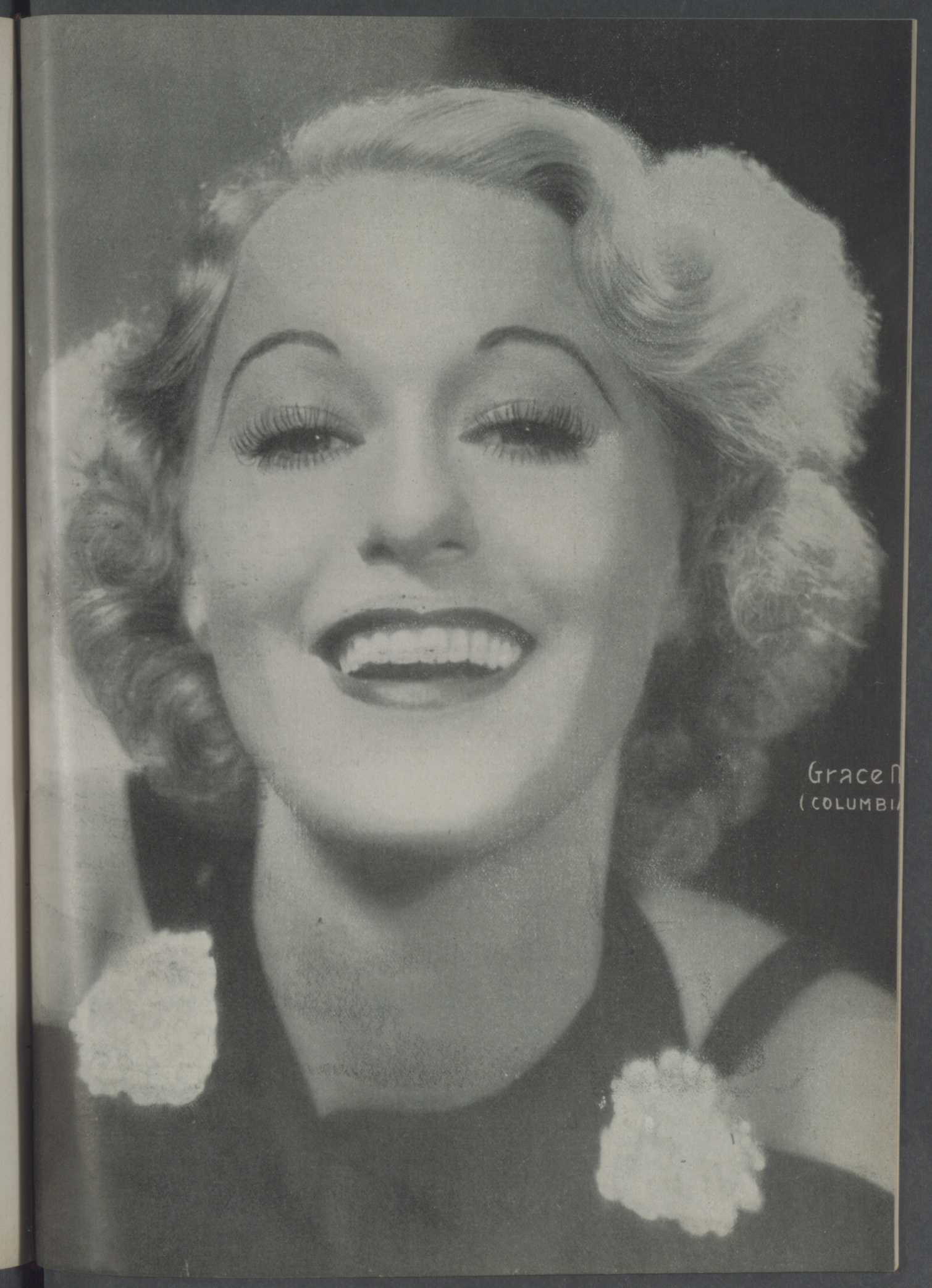
Grace Kelly (COLUMBIA)