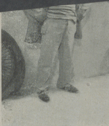
El admirable Castrito, en "Poderoso caballero..." de Ibérica Film.