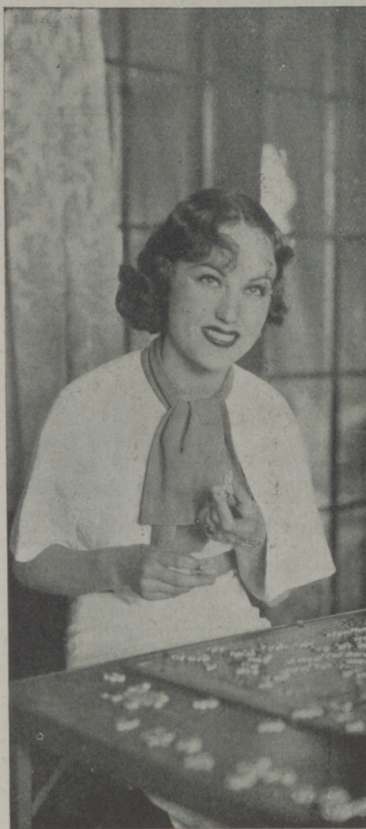
FAY WRAY, la exquisita actriz que vuelve a imponerse en las películas

La batalla entre la experiencia y la juventud, de momento, no da signos de llegar a un armisticio.