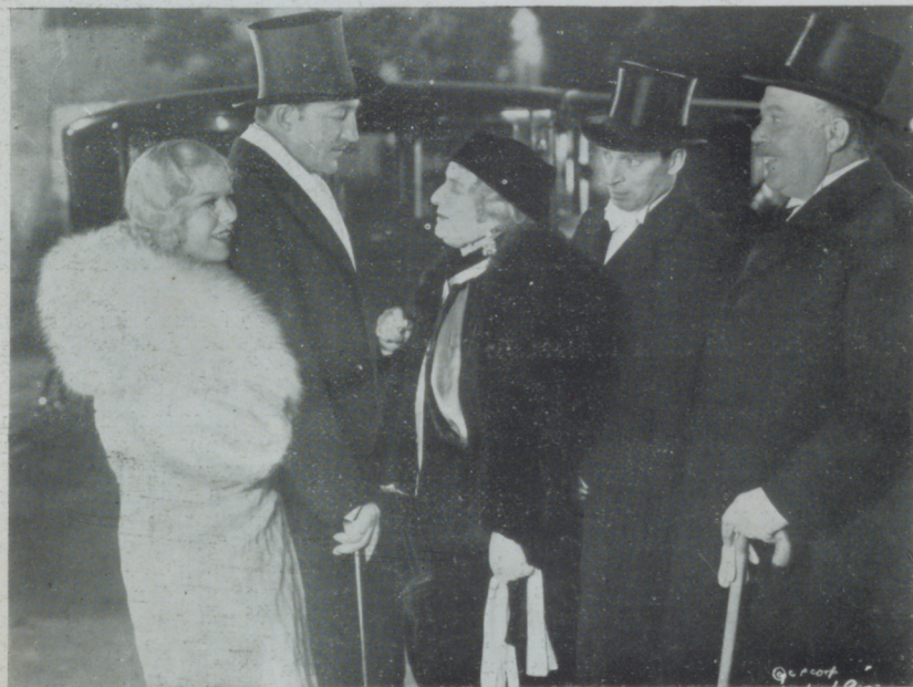
WARREN WILLIAM protagonista de "Dama por un día" de Cifesa, en una escena de la misma.

Nuestra más sincera felicitación a la distribuidora valenciana que a partir de ahora, ha convertido en la primera editora nacional.