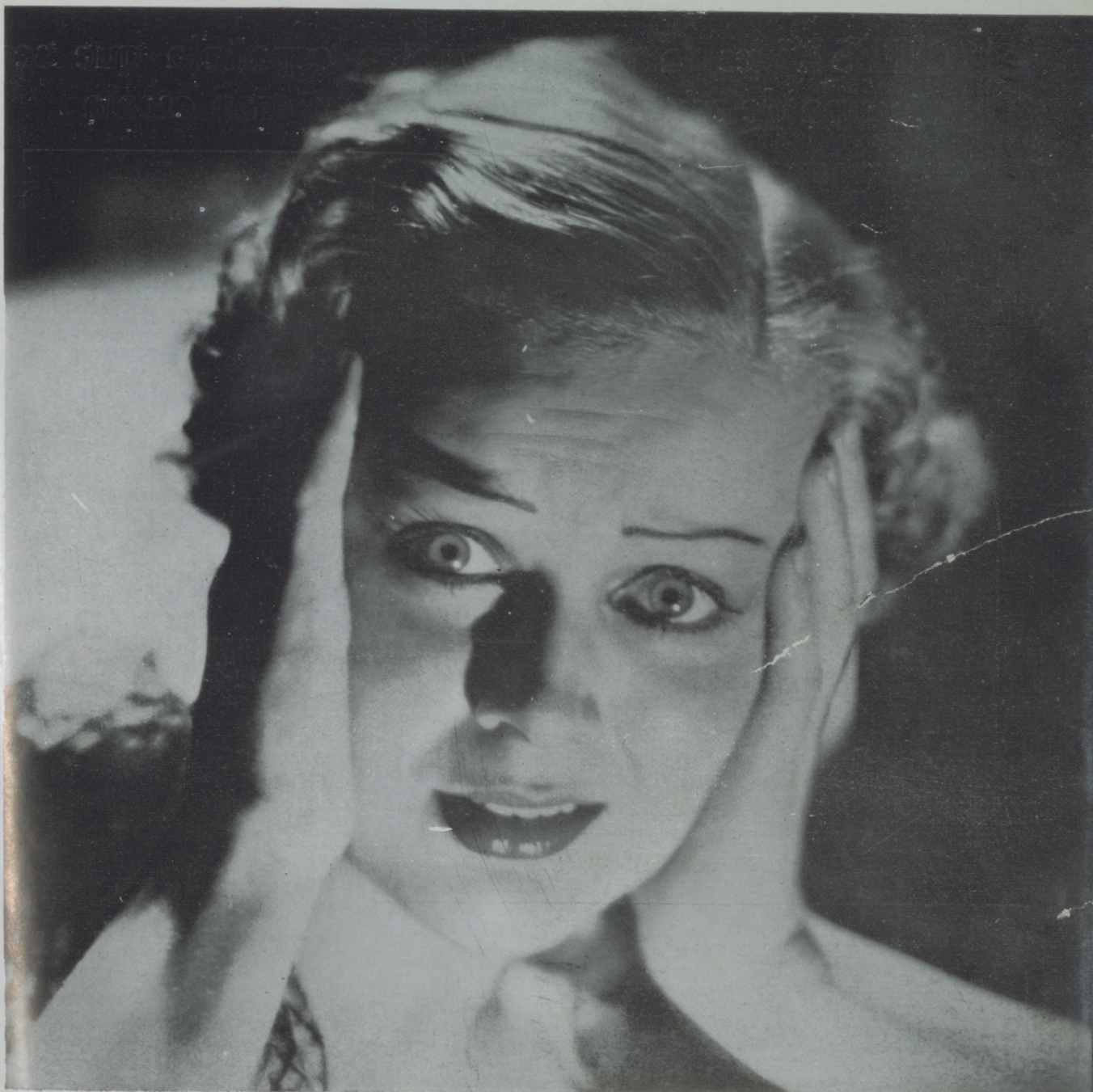
Una expresión de afán reconcentrado característica de GLORIA STUART, que en poco tiempo ha conseguido escalar los más altos lugares de la fama.

determinado nos desilusionó al comprender que sus caricias tenían ya un dueño. Por eso dudamos aun de lo cierto en que pueda hallarse Gloria Stuart al opinar de tal manera.