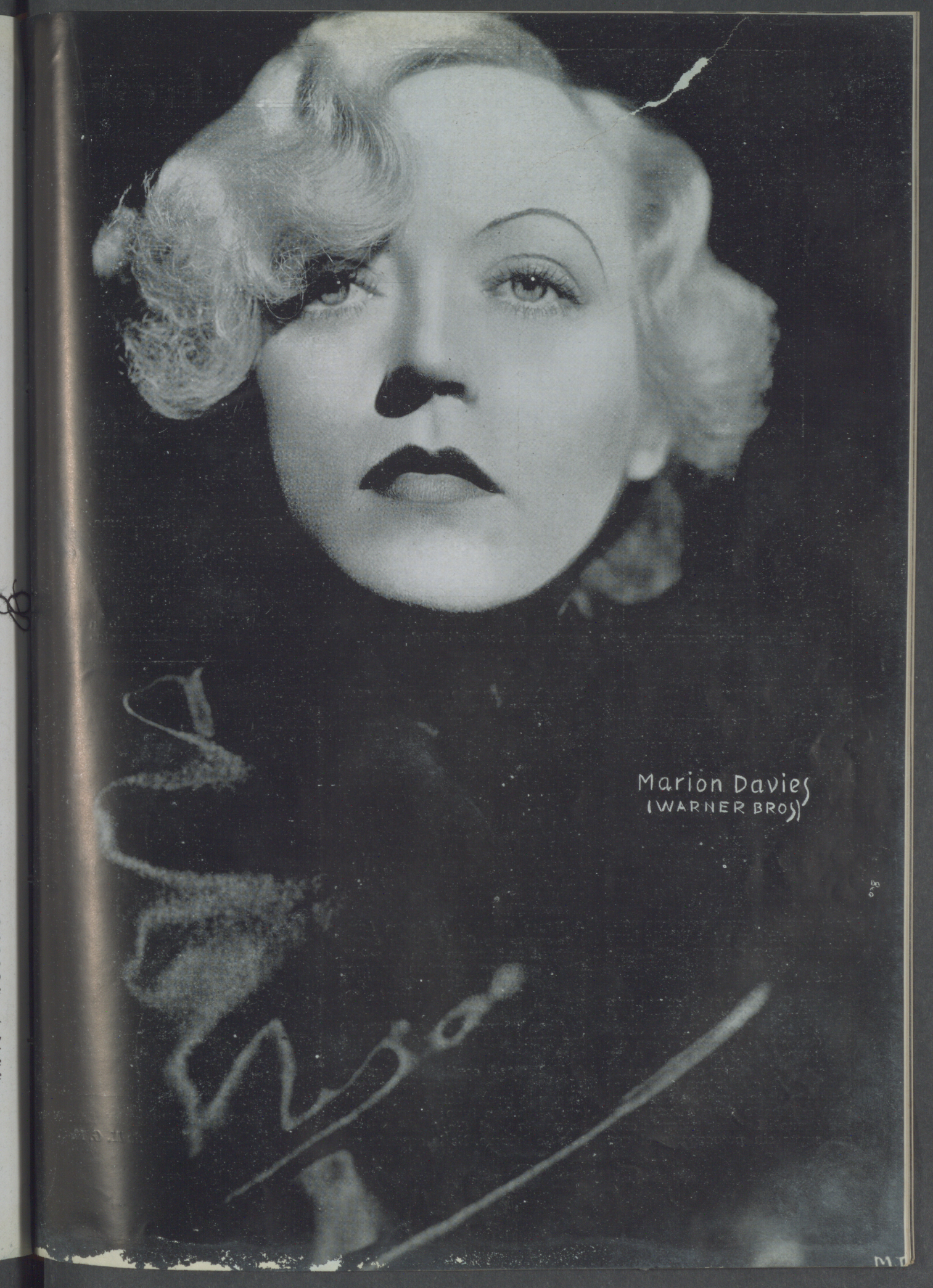
Marion Davies