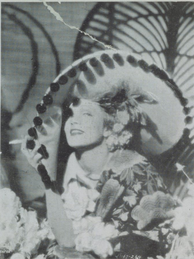
MARLENNE DIETRICH, la mujer más peligrosa de la pantalla en una escena de "Tu nombre es tentación" de la Paramount