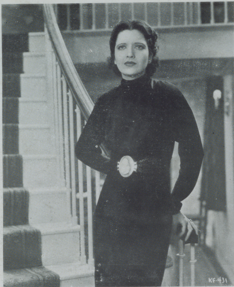
KAY FRANCIS, considerada en Cinelandia como la mujer más elegante de Hollywood, en su casa posando exclusivamente para los lectores de EL CINE

El caso no es singular, no tan raro que haya de ser desconocido por el público. Los aficionados al cine, lo han comprobado en muchos casos y los nombres de Marie Dressler, Janet Gaynor, Lilian Gish y Greta Garbo, son recordados por todos, que conocemos las excelencias de su arte y admiramos a pesar de que sus rostros, sus figuras, carecen de esas condiciones fotogénicas de que tanto se ha hablado.