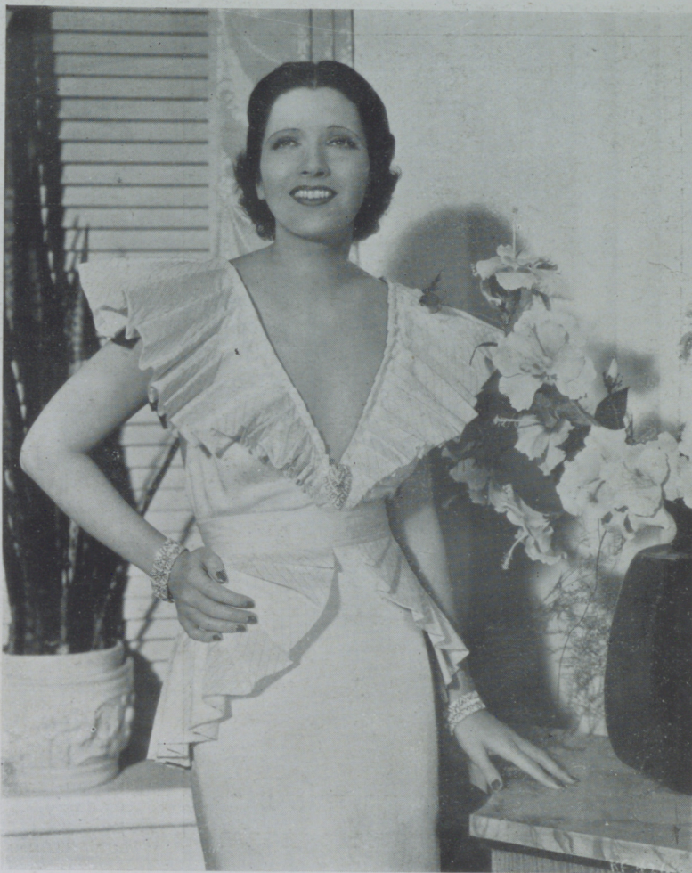
La sonrisa de KAY FRANCIS, sonrisa suave, de tristeza, contrasta con la alegría del conjunto

fama suavemente y por sí misma, sin que los cropeles de una publicidad vocinglera haya lanzado su nombre a los cuatro vientos.