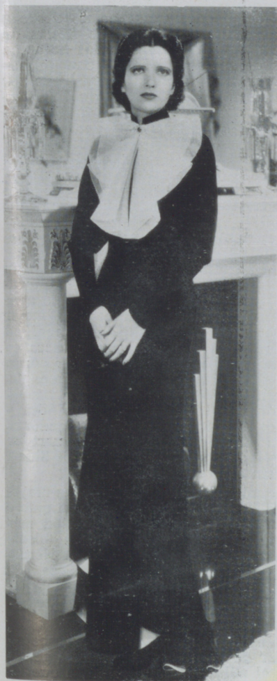
Aquí tenemos a KAY FRANCIS ante la chimenea del comedor.

Actualmente es Kay Francis la actriz que destaca con más firmeza. Desde su primera actuación en "Gentlemen of the Press", hace ya muchos años, hasta ahora, la carrera de Katherine — verdadero nombre de la Francis — ha sido lenta y aunque desde el principio diera muestras de su fina sensibilidad ha ido escalando los peldaños de la