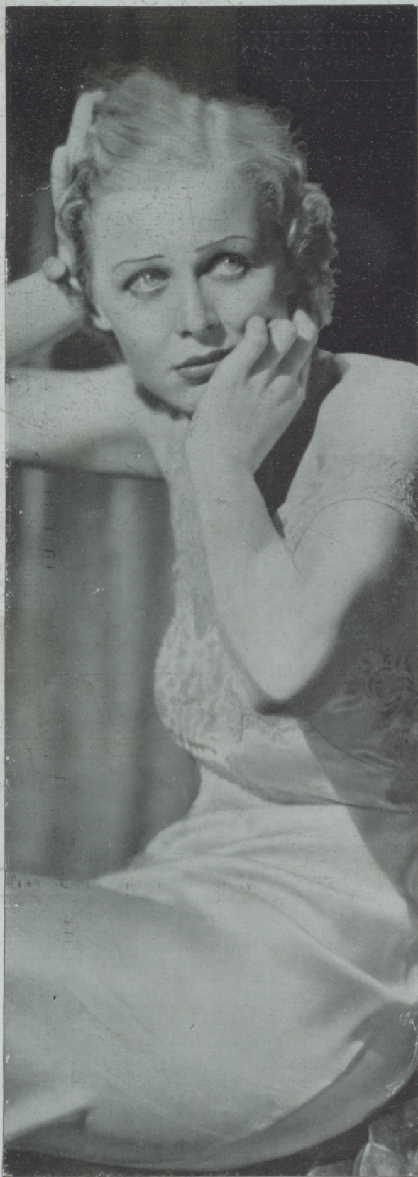
GLORIA STUART, estrella de positivo valor, parece mirar al vacío con ojos tristes, que apesar de su tristeza no dejan de ser bonitos.