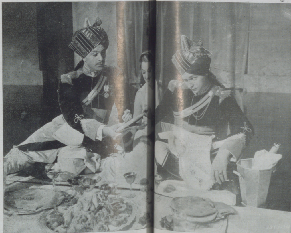
¿Cuál de los conquistadores saldrá triunfante de amorosa lucha? ¿Cuál será el predilecto de KATHLEEN BURKE? ¿GARY COOPER o FRANCHOT TONE?

Pero, mientras la vida se desliza por el cauce que le va trazando cada día la oculta fuerza que la dirige, el pensamiento del hombre se complace en acariciar, unas veces los recuerdos que lo devuelven a horas dichosas y ya pasadas; otras, los proyectos con que anticipa en la imaginación las horas que en lo