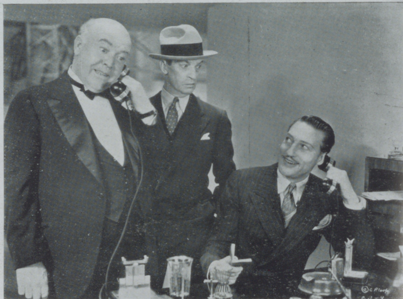
Una escena de la divertida comedia de Cifesa "Dama por un día"

En varias ocasiones hemos hablado en estas mismas páginas abogando por la formación de sociedades que pudieran garantizar una producción cinematográfica firme y continuada. Los hechos aislados de edición de películas jamás podrán beneficiar a nuestra joven industria y comprendiéndolo así, Cifesa, que ya desde su formación alimentó el deseo de producir por su cuenta, prepara para la temporada a venir de siete a diez películas realizadas por nuestros di-