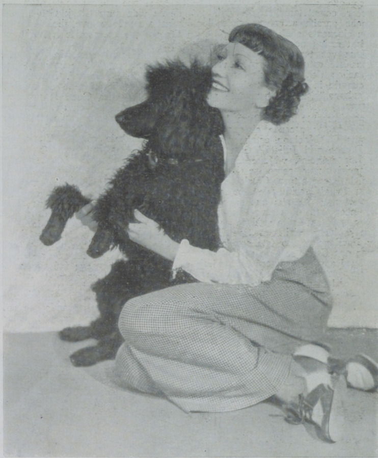
CLAUDETTE COLBERT, deseosa de demostrar la belleza de su perro, posa sonriente ante el fotógrafo para que... le admiremos nosotros.