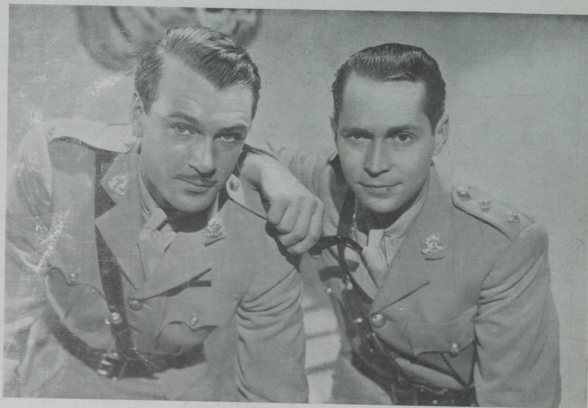
GARY COOPER y FRANCHOT TONE en "Lanceros de Bengala" miran sorprendidos las evoluciones de una mujer, que aunque no se ve, es maravillosa

venidero se promete. Así Gary Cooper, durante los ratos de silencio, frecuentes en quien, como él, parece atento a la plática interior que el hohbre hecho a los amplios y silenciosos horizontes del campo o del mar se habitúa a sostener consigo mismo, causa la impresión de quien busca con la mirada algo que flotara allá lejos, en el término donde quedan desvanecidos los años del ayer, o en el que ofrece los años que traerá el mañana.