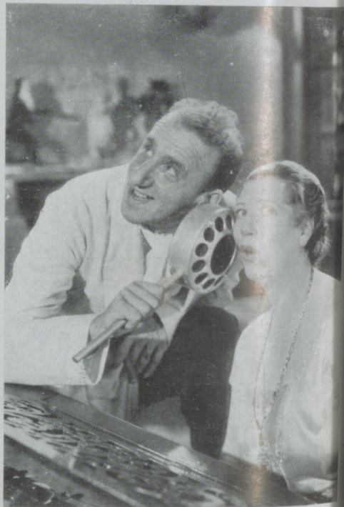
JIMMY DURANTE y POLLY MORAN en Hollywood Party de M. G. M.