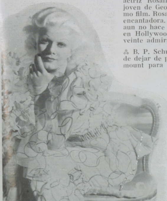
JEAN HARLOW la exquisita platinada de M. G. M.

✱ Hay rumores de que Ernst Lubitsch será quien dirija el primer film americano de Jean Kiepura. Este ya se ha casado con la deliciosa estrella húngara, Martha Eggerth, por lo cual es muy posible que ella también marche a Hollywood cuando él lo haga a primeros del mes de mayo.