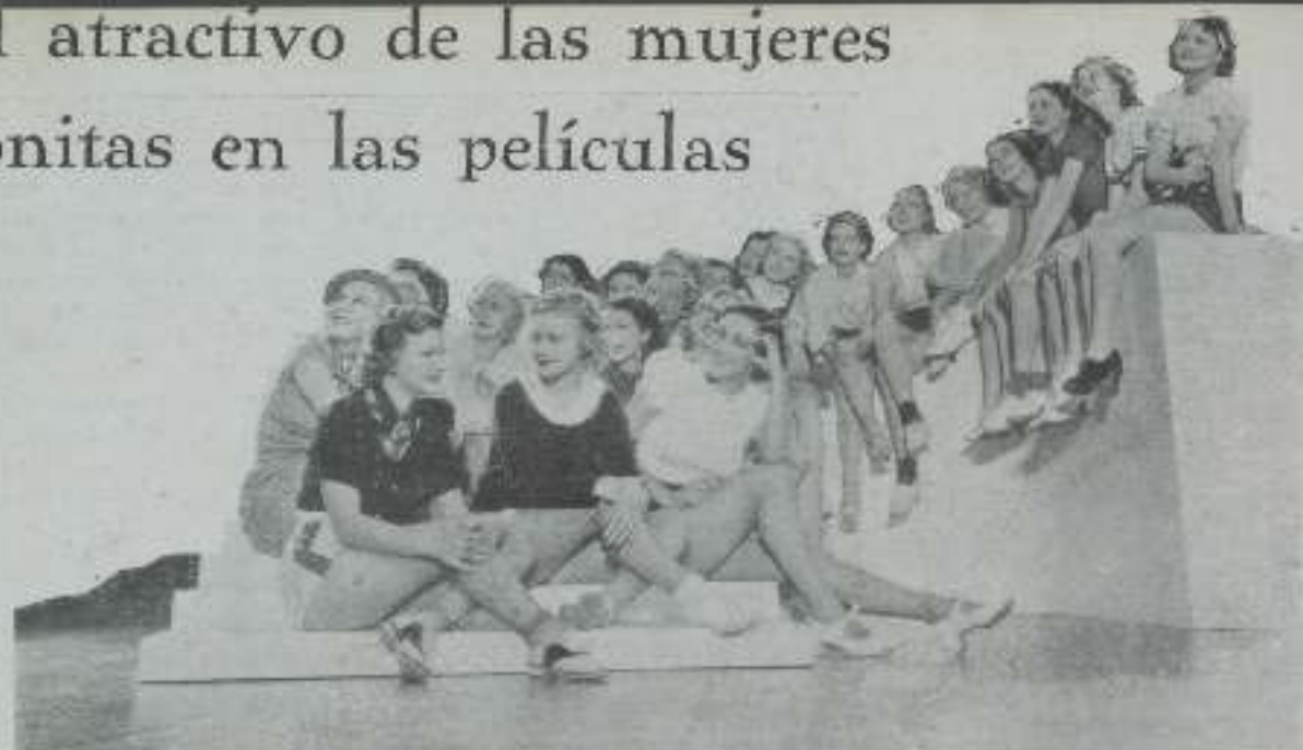
Un grupo de las más atractivas muchachas de Hollywood, en un momento de descanso durante el ensayo de un baile de una de las películas Metro Goldwyn Mayer

Las mujeres bonitas son a la pantalla como la corona al santo. Si no fuera por ellas, no tendría el cinematógrafo gran atractivo, ya que al entrar la expresión por los ojos, una dentadura nitida, una boca sonriente y una postura graciosa, además de un rostro bello, llega al espectador con mucha más fuerza que cualquier frase por muy intensa que ésta sea.