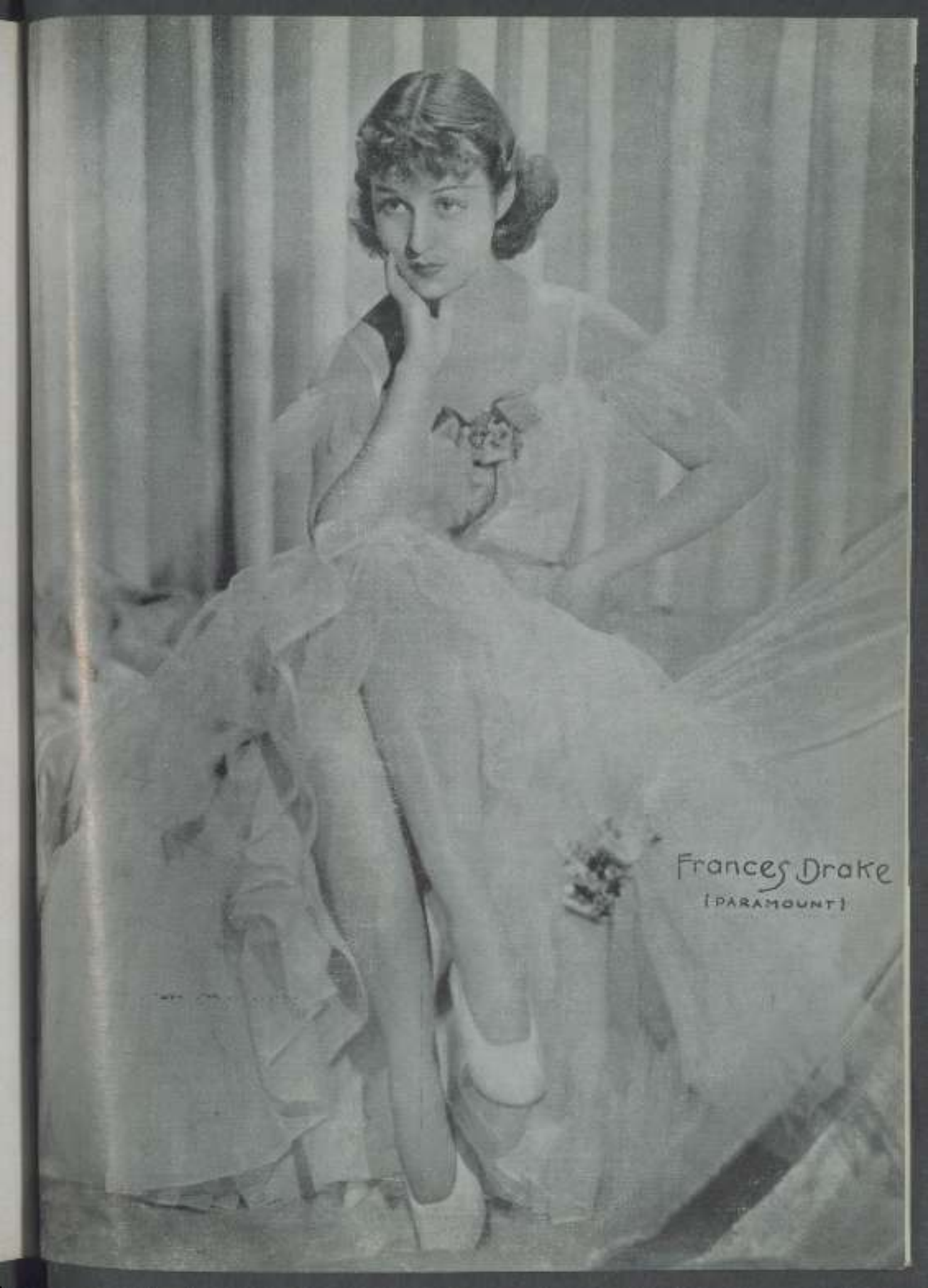
Frances Drake