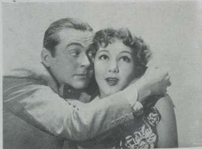
JEAN PARKER y JAMES DUNN en un momento culminante. A Jean le gusta el abrazo por lo que se refleja en su cara

Δ Vivian Gaye ha regresado de sus largas vacaciones en el desierto y Randolph Scott vuelve a ser su acompañante más asiduo.