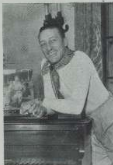
WARREN WILLIAM sonriendo con el optimismo que le caracteriza.

Tiene el tipo de un gran actor, pero no tiene rastro de temperamento en la superficie.