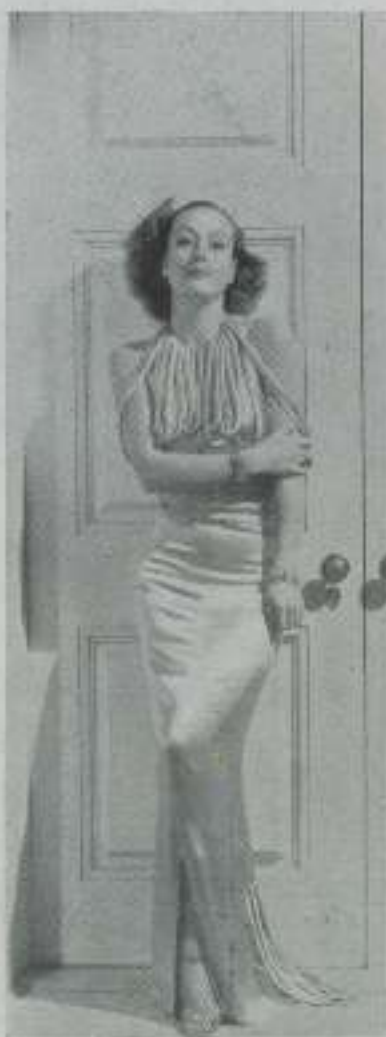
JOAN CRAWFORD la admirable mujer de encantosos lineas que es cada vez más interesante por su belleza y por su experiencia de la vida.