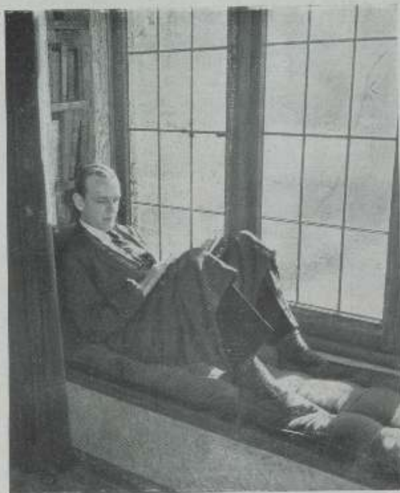
FRED ASTAIRE, el gran bailarín convertido en actor cinematográfico por Radio Film

Δ La Garbo se ha vuelto asidua concurrente del Trocadero y ahora todas las demás estrellas han desertado el popular restaurante.