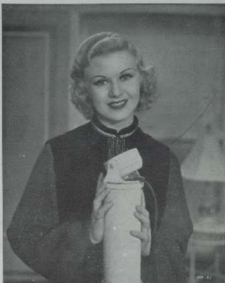
GINGER ROGERS, mujer guapísima y estrella atengente en su carrera cinematográfica es cada vez más firme.

Su voz fresca, bien modulada y agradable, producía una sensación extraordinaria entre los espectadores. Al observar esta reacción del público ante su voz aterriopelada, Ginger Rogers entró seguidamente a formar parte de las musicales.