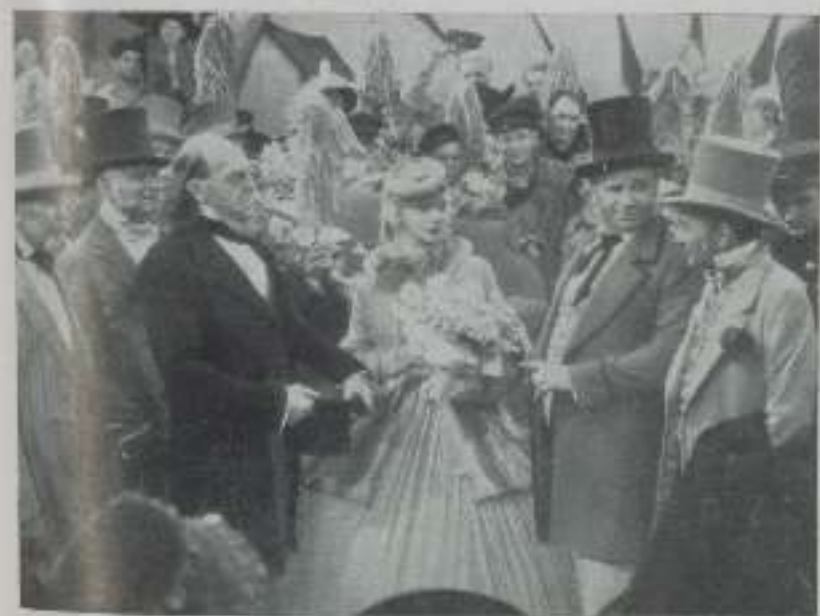
WALLACE BEEERY, en una escena de la nueva película de Artistas Unidos, "The Mighty Barnum".

Johnny Farrow ha marchado al encuentro de Fairbanks padre con el fin de estudiar con él las posibilidades de rodar una película en las Islas Virgenes.