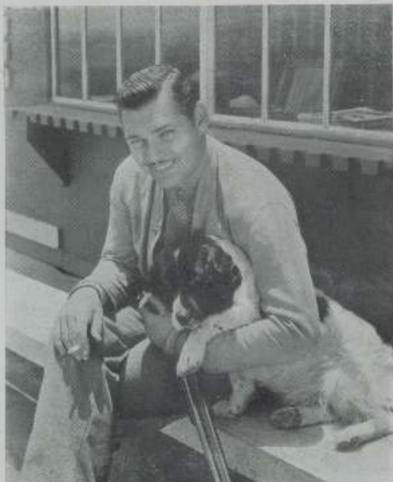
CLARK GABLE preparado para lanzarse por las montañas a practicar su sport favorito: la caza

Llegó la hora amarga de despedida; fue en Butte, Montana, y era el mes de marzo. Como la primavera tardaba en llegar a aquellos distritos norteños, hacía un frío terrible. El finero que la compañía poseía se había agotado, y Clark se puso a contar lo que tenía en