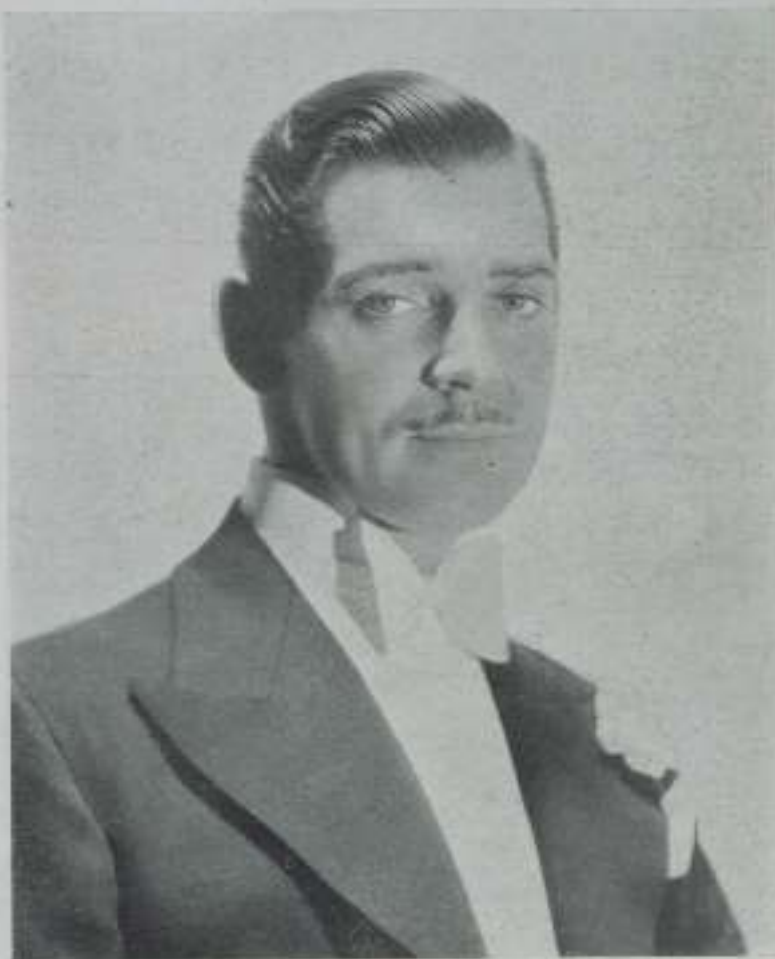
Mirada serena, apuesto y elegante. Este es el CLARK GABLE que aplaudimos en la pantalla

Un día tuvo ocasión de actuar en frente del objetivo, a pesar de que no fue gran cosa. Estaba a punto de abandonar la sala de espera de uno de los estudios cuando le llamaron con varios otros hombres altos como él, y los hicieron entrar en una sala pequeña. Luego apareció uno de los sub-directores, que examinó a los hombres, escogiendo a diez. Clark fue elegido entre ellos. Durante tres días tuvo que vestirse en uniforme de granadero colocándose con sus compañeros al fondo de una escena que entonces se estaba filmando.