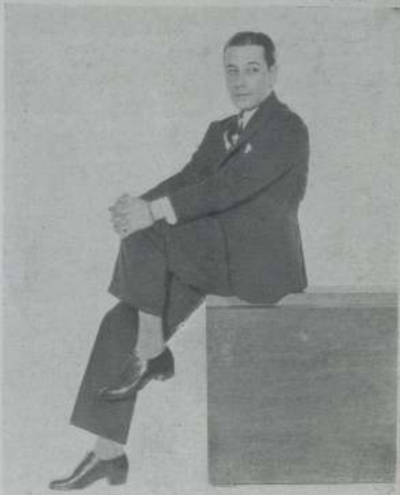
GEORGE RAFT, el celebrado actor de la Paramount que ha consolidado su prestigio en la actual temporada.

La menuda Janet Gaynor es la más reciente víctima de la gripe. A consecuencia de ello la linda estrella no podrá volver al trabajo hasta dentro de ocho o diez días. Ni que decir tiene que su inseparable amiga, Margaret Lindsay, pasa al lado de Janet todas sus horas libres.