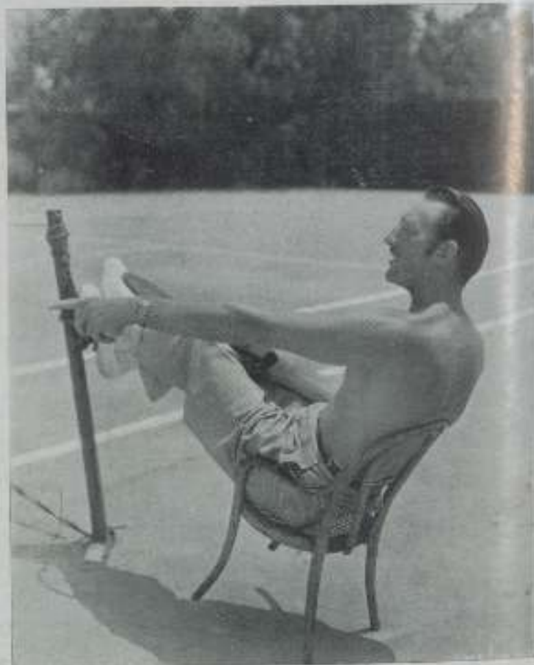
Gran aficionado a los deportes, el actor de la Warner sigue con entusiasmo el curso de un partido de tenis.

Le molestó considerablemente esta comparación y muchos pueden imaginar lo extraño que estaría del alegre tumulto de Hollywood,