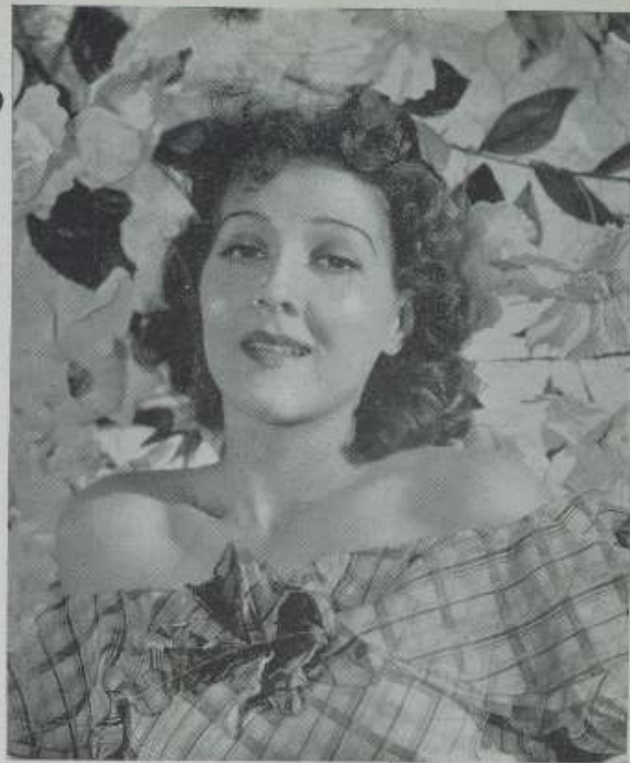
Es difícil encontrar unos ojos que expresen mejor la melancolía que invade el corazón de la diáfana y encantadora JEAN PARKER. No obstante, todo el mundo cree a JEAN, la muchacha más feliz de la tierra.