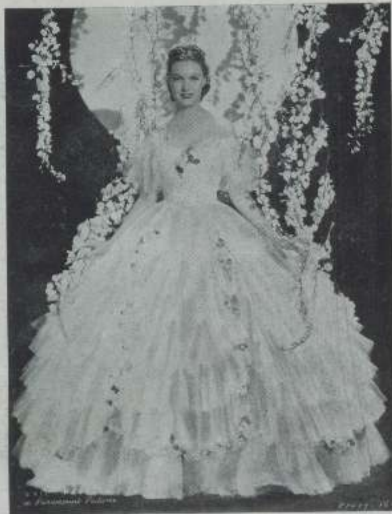
GAIL PATRICK, guapísima aspirante a estrella cuya belleza puedes admirar los lectores sin reparos.