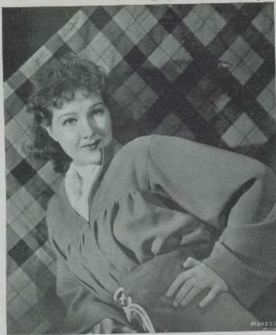
JEAN PARKER es hoy una de las profetas del cine americano. En ella tienen ya los ojos puestos millares de mujeres que imitan sus gustos en el vestir, peinar y maquillaje. Es este un signo de nacimiento de popularidad.

Así lo afirma Jean Parker, esa florecilla espléndida que ha llegado al cine, envuelta en el exquisito perfume de su belleza incomparable.