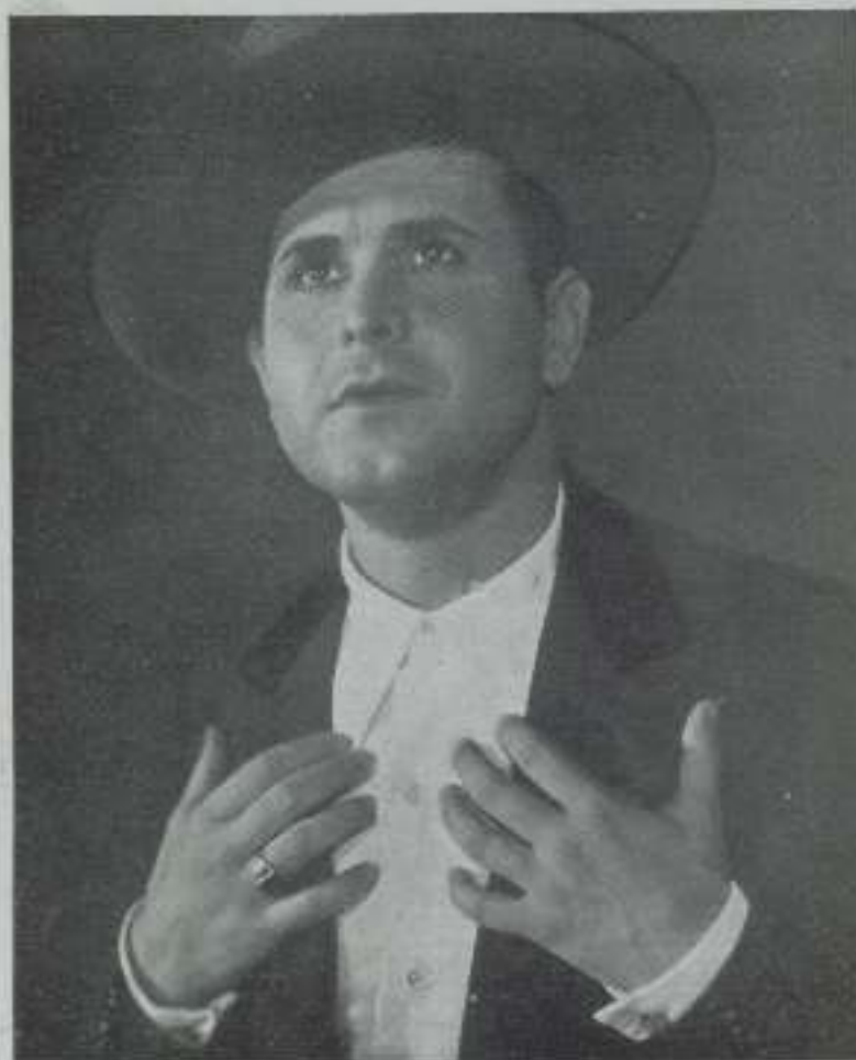
RAFAEL NIETO en una escena de la película "Yo canto para tí" en que se revela como formidable galán cómico, que aun no ha sido explotado en la pantalla.

actor de teatro, recitador, "cantautor" y actor de cine