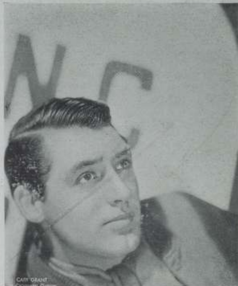
CARY GRANT, actor de la Paramount.

le oportunidad para crear un tipo cómico, en el que yo creo que le sería facilísimo conseguir una creación definitiva.