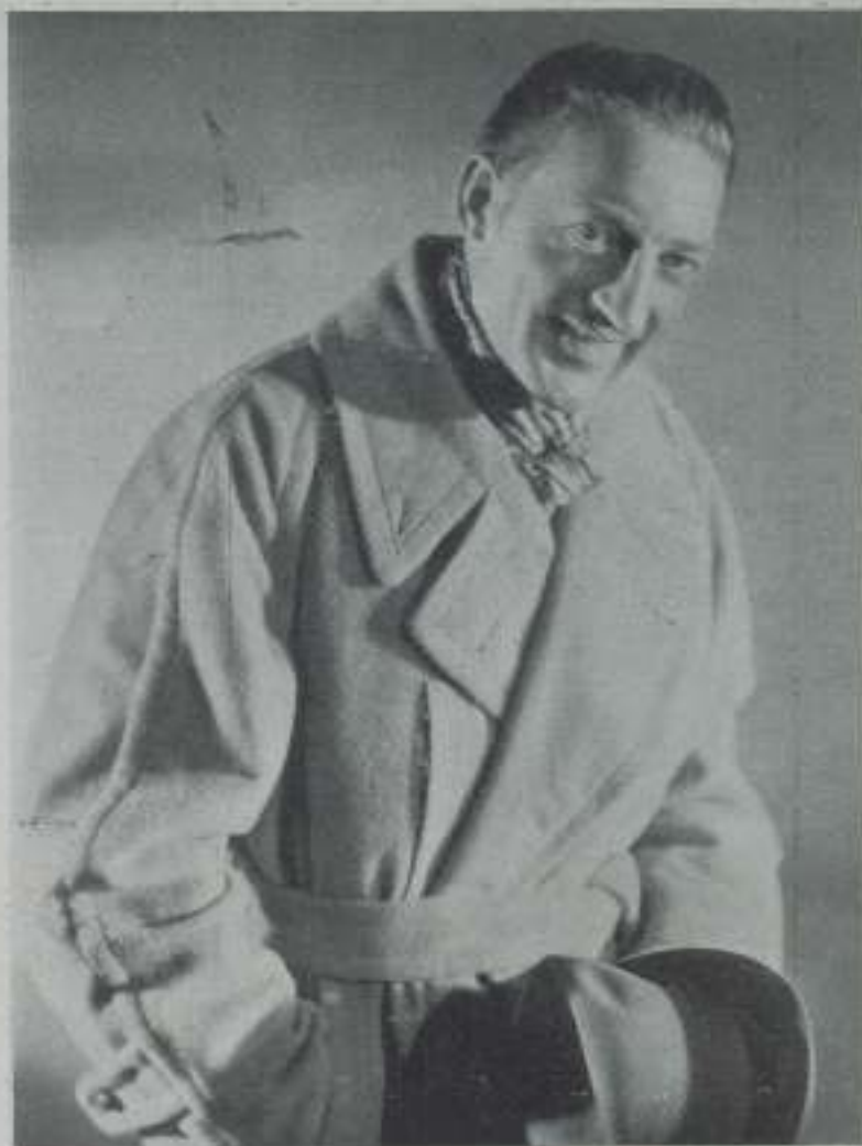
WARREN WILLIAM, que ha conseguido consolidar su prestigio esta temporada

Vive muy sencillamente con la mujer con quien se casó hace dos años, una rubia, pequeña y atrevida que con su ingenio y determinación ha ayudado en la mayor parte a William.