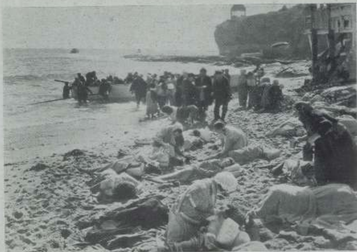
Una escena de la gran película que distribuye Efeza "Lo que los dioses destruyen"