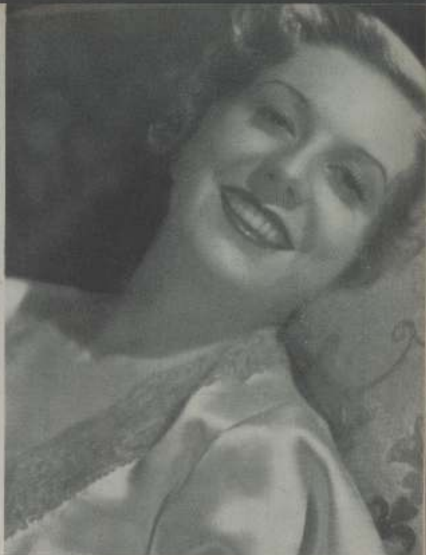
LOUISE LATHINER, actriz de la Universal de expresiva belleza y contrastagradable, que ha destacado en los films de esta temporada.

Obras que tengan alma que hagan vibrar las fibras sensibles al gran público serán las que tengan éxito. El reír no llega al alma de nuestros ciudadanos no intelectuales, porque no comprenden el humorismo de los últimos.