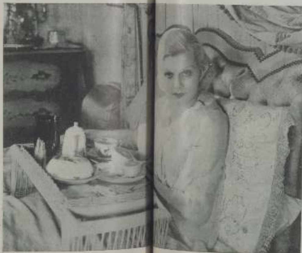
En el recogimiento de un hogar la platinada mira al objetivo fotográfico cual si le hiciera una pregunta. Y es la Metro mira al objetivo fotográfico cual si le hiciera una pregunta. Y es la platinada sola para estar alegre.

Antes de llegar a los veinte años, Jean Harlow había vivido tanto que podía contar en su haber con una