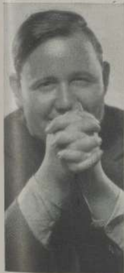
CHARLES LAUGHTON, actor admirable a quien veremos pronto en "Las vírgenes de Wimpole" de la Metro.

✧ Joan Crawford y Norma Shearer asistieron a la prueba privada