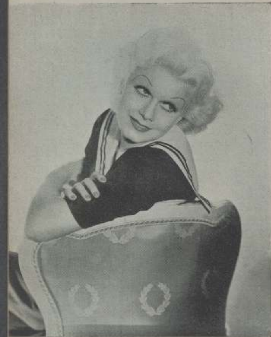
JEAN HARLOW, la mujer más admirada de Hollywood y cuya vida particular es una sucesión de aventuras personales

Jean Harlow es una de las pocas artistas que ha sabido elevarse a la cumbre en Cinelandia.