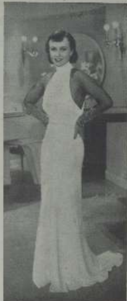
Con el vestido ajustado que realza la elegante silueta, MARGARET LINDSAY demuestra que las líneas de su figura contienen extraordinario atractivo.

Así es que yo, hasta ahora, no he tenido más remedio que conformarme con la foto. Esa sí, es a falta del original corpóreo, una foto