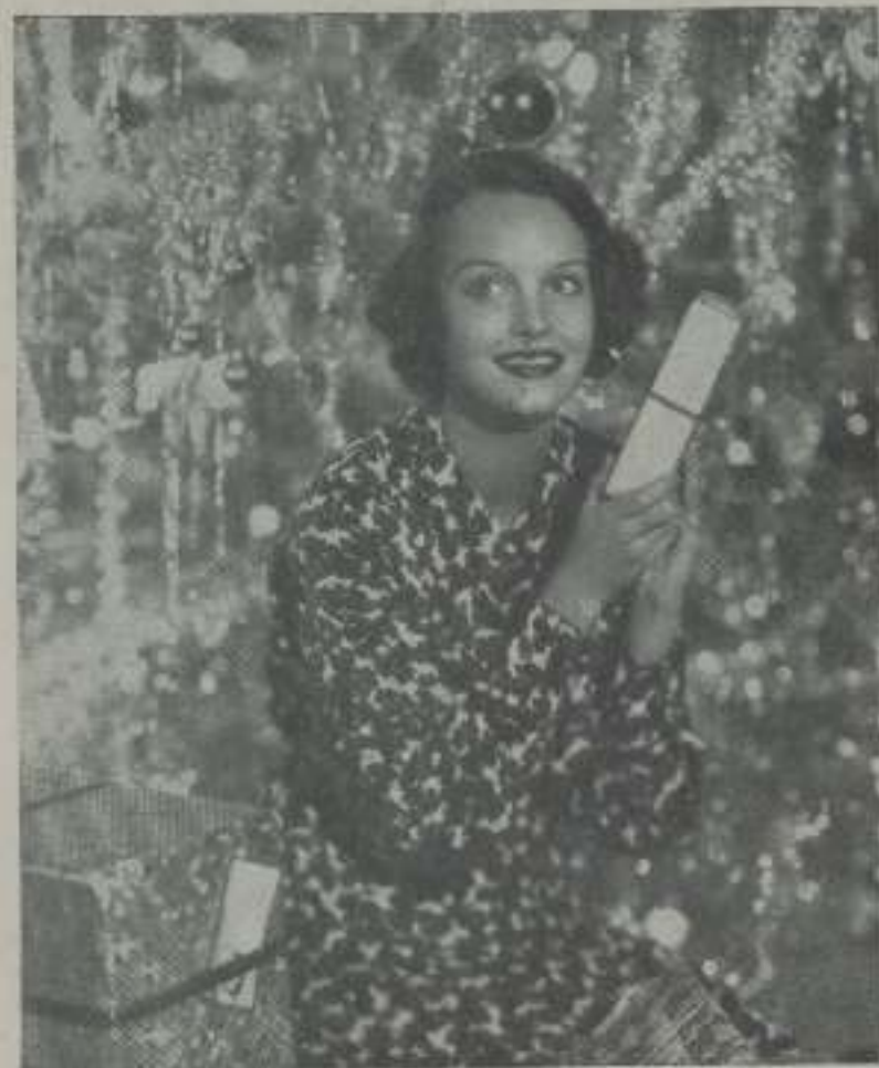
ROCHELLE HUDSON, encantadora actriz de la Fox que nos habla en este artículo de los inconvenientes de ser mujer.

Indudablemente hemos conseguido grandes mejoras en nuestras vidas. Cada día se nos abren más amplios horizontes pero, a pesar de todo, somos esclavas de nosotras mismas. Nuestra naturaleza nos hace inferiores y ese inconveniente básico nos ata y nos obliga a no olvidarnos de que nuestra misión principal en este mundo es la de haber venido a perpetuar la especie.