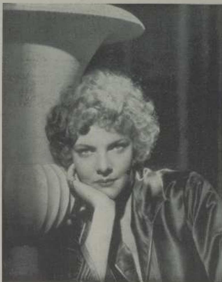
Una expresión de ELISSA LANDI de la Paramount, en la que asoman a sus ojos claros recuerdos no muy halagüeños.

En cierta ocasión le preguntó un periodista a la protagonista de "El carnet amarillo" cual era el motivo que había formado de Hollywood. Ella, con discreción suficiente para que nadie se diese por ofendido declaró que muy halagada, aunque en general se había equivocado. Aquello era muy bonito, muy distraído, pero un poco