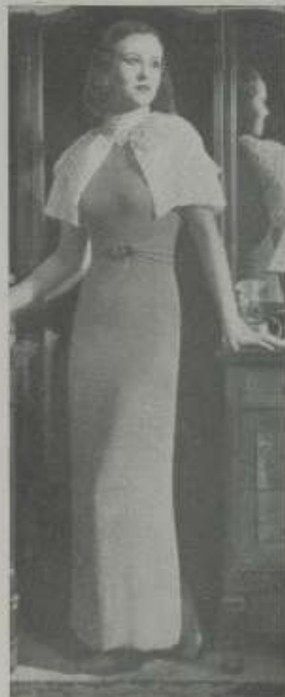
MARGARET LINDSAY sabe cómo realzar su figura, vistiendo los trajes más atractivos.

Acostumbramos a proponer condiciones y, sin embargo, jamás tenemos éxito. En cambio cuando