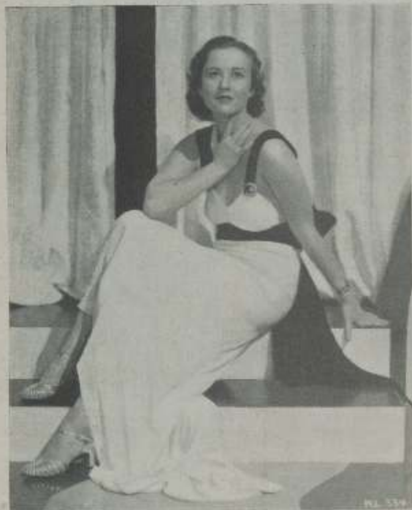
MARGARET LINDSAY, actriz de la Warner, de belleza extraordinaria y singular encanto.

Yo poseo una fotografía magnífica de Margaret Lindsay, una foto que, como tiene para mí un doble atractivo, no puedo brindársela a mis lectores, una foto, en fin, que tengo ante mis ojos en el momento de escribir estas páginas, y que me habla de esta criatura guapísima casi con tanta fuerza cual si fuera el original corpóreo.