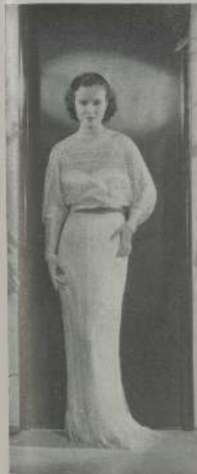
Aunque no lo pareciera, MARGARET LINDSAY, que en esta pose nos muestra un modelo de gusto exquisito, es un diablillo astuto.

—Además — me dijo—. Los sacrificios no deben hacerse sino cuando la mujer está interesada en ellos. Los hombres deben saber cuando es conveniente hacerlos y no prometer sin tener la seguridad de que van a ser bien acogidos por la interesada.