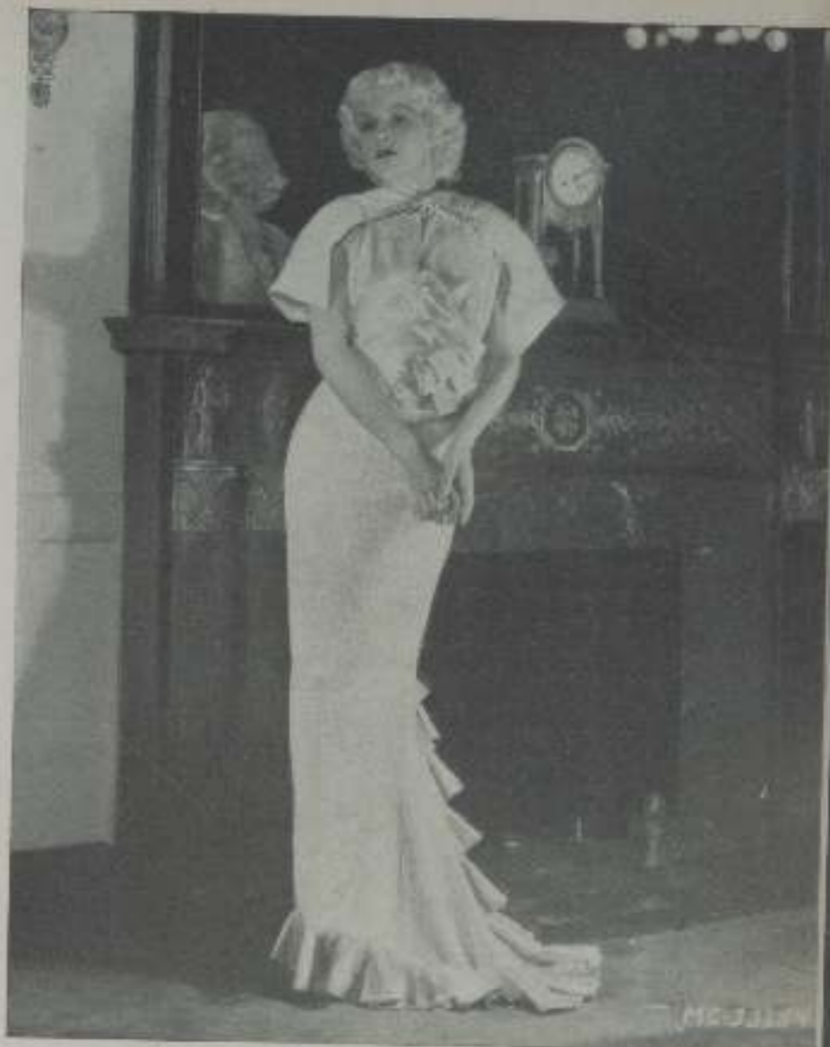
Las curvas de JEAN HARLOW, modeladas por el apretado traje, hablan de ritmo. Y es que además de excelente actriz es una mujer admirable.

fuga, un divorcio, un nuevo matrimonio, además de las riñas necesarias con su familia que motivaron fuera desheredada.