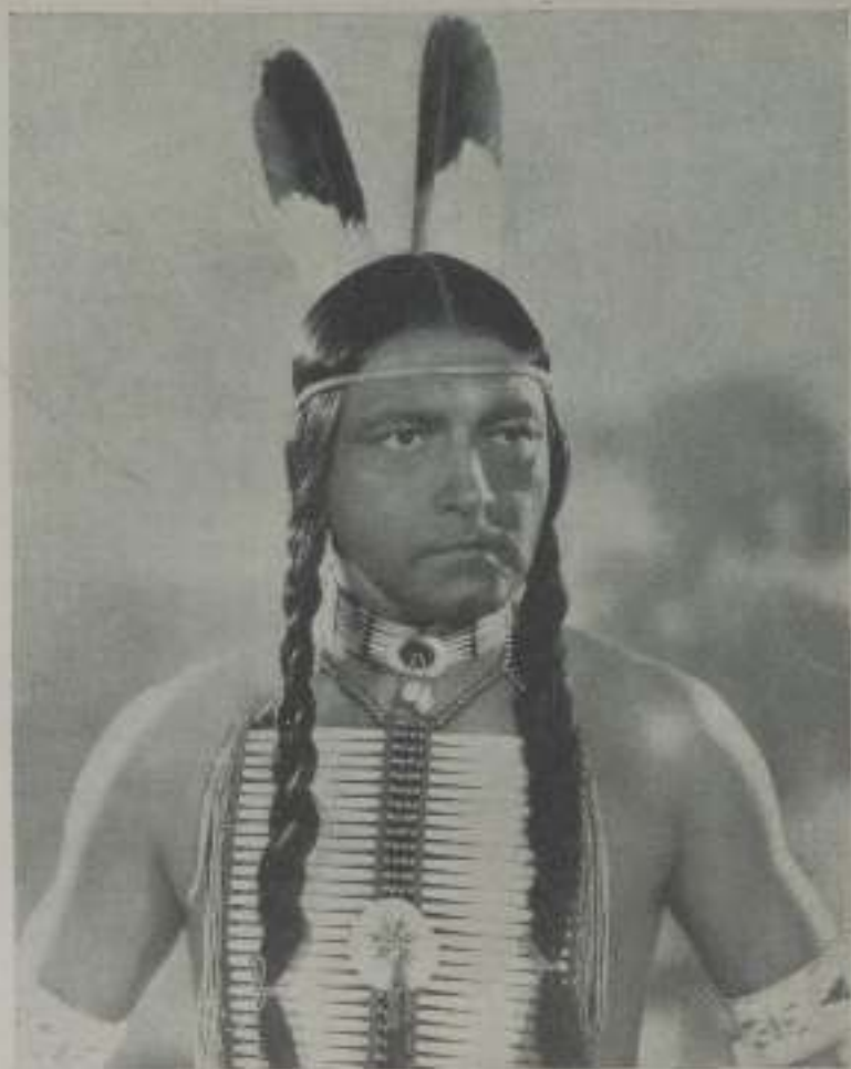
RICHARD BARTHELMES, el gran actor de la Warner en una de las escenas de "Massacre" de la ciudad muerta.

del nuevo film de Jean Harlow y las dos muchachas aseguran que Jean es una consumada actriz a la hora de hacer escenas de amor. ¿Cómo no, ¡William Powell es el galán de la cinta en cuestión!