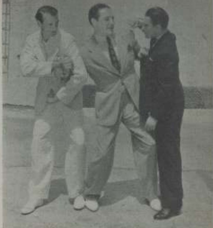
MAX BAER, protagonista de "Niños traviesos" de la Paramount con Gary Cooper y George Raft que según a pegarse.