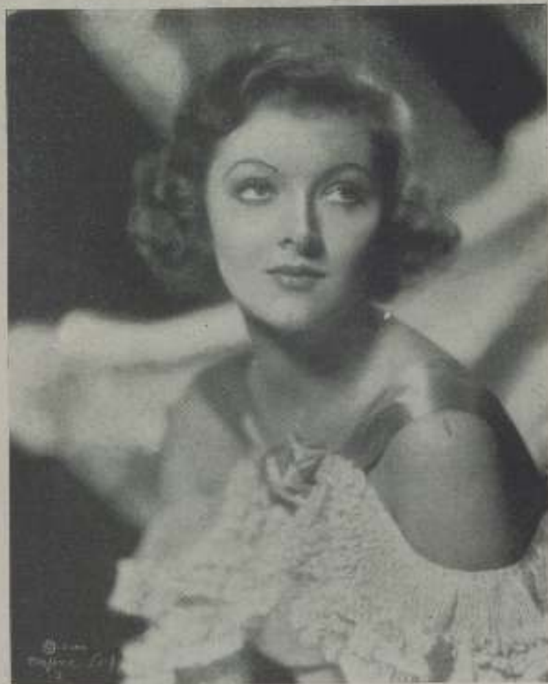
MYRNA LOY, exótica belleza y artista excelente que protagoniza "Estrictamente confidencial" de Cifesa

Día de febrero. La noche no era muy apropiada para salir de casa ya que, metida en agua, llovía sin cesar desde mediada la tarde. No obstante no tenía ganas de quedarme en casa. Sin sueño, sin ánimos para escribir, sin saber ni leer y con muy pocas ganas de hablar no podía permitirme el lujo de aburrirme tan solamente y decidí sacar del garaje mi magnífico Ford yendo a pasear mi tedio por las mejadas calles.