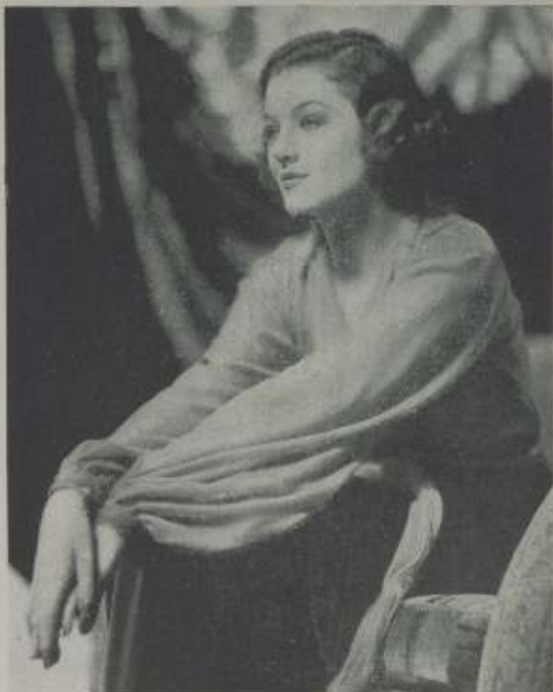
Los brazos caídos, la expresión melancólica... MYRNA LOY no sabe a qué hora confiarle en "Estrictamente confidencial" de Clifton.