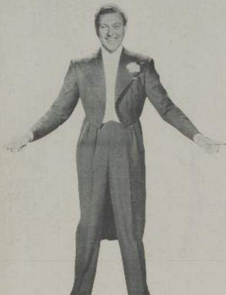
CARL BRISSON, el actor de moda en Hollywood

Helen Hayes quiere ir a Rusia para hacer una película de la cual sería su marido el director.