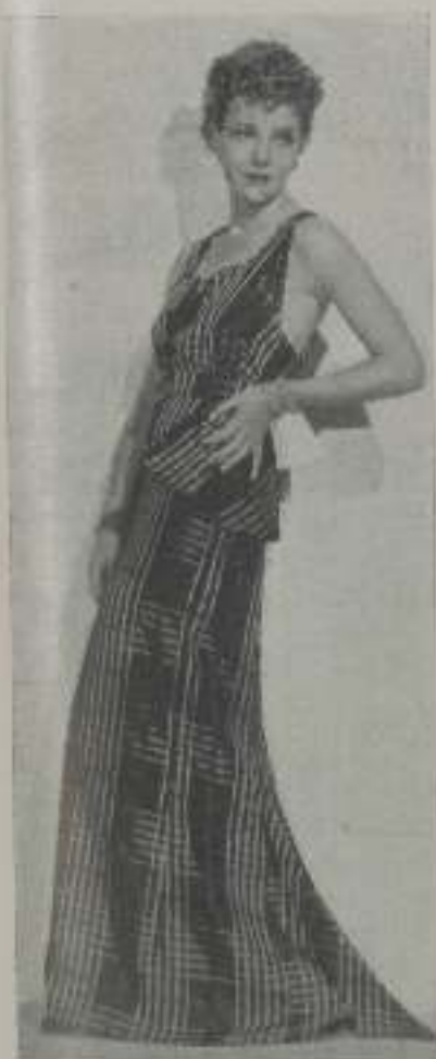
Elegante y distinguida, ELISSA LANDI sabe también componer su figura en la elegancia de un vestido

artificial, demasiado artificial quizás para tomarlo en serio.