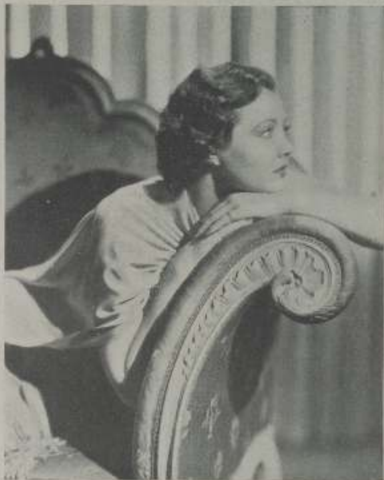
SYLVIA SIDNEY, la gentil estrella de la Paramount de la que creen sus admiradores todas las excelencias

Los visitantes se dan cuenta bien pronto de que la mayoría de las estrellas son muy simpáticas y accesibles. Entre ellos y en su trato