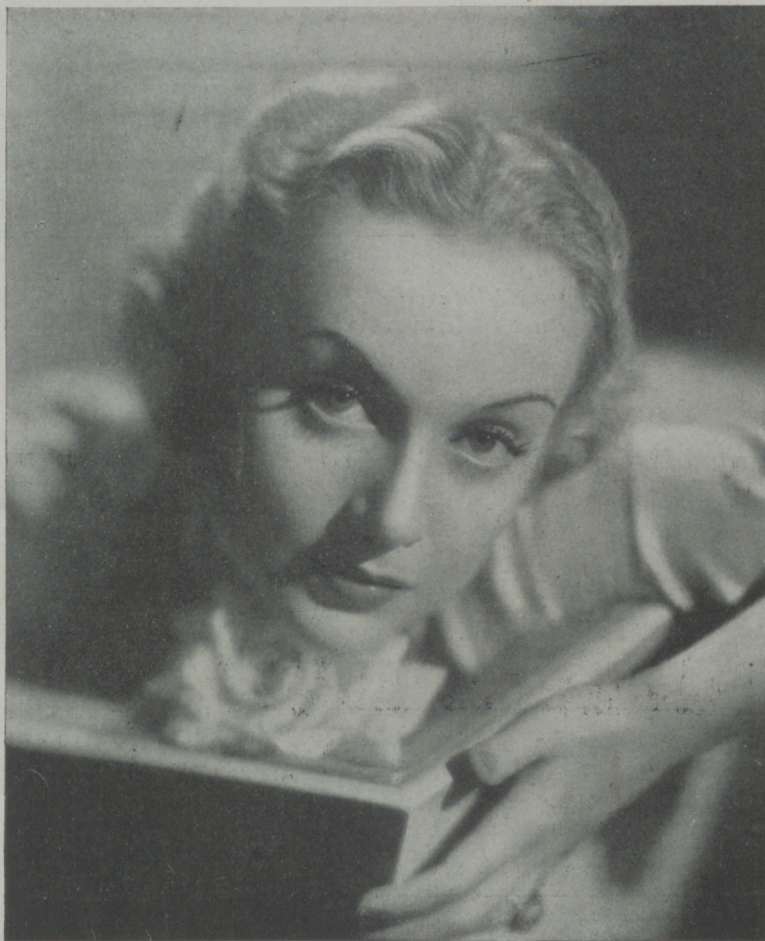
CAROLE LOMBARD, la exquisita actriz de la Paramount, que en la vida particular dista mucho de ser como la vemos reflejada en la pantalla

Pienso que solamente hay una Carol, y es aquella que se deja ver raramente por el lado de la verdadera Carol, tal como se presenta en su última en la cual dice: "Yo sé lo que quiero, pero no lo puedo conseguir". Y con una sonrisa valiente continúa: "Tomaré las cosas como mejor me vengan". Y yo creo que es lo que está haciendo exacta-