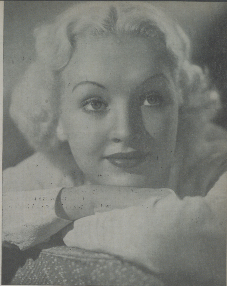
BETTY GRABLE, guapisima estrella de Radio Film, que la veremos brillar con esplendor en breve

Cuarenta años ahora hace que Lumiere consiguiera la primera proyección de imágenes; cuarenta años que las imágenes se proyectan con movimiento y en ese transcurso de tiempo, ¡cuántas variaciones ha sufrido el primer invento!