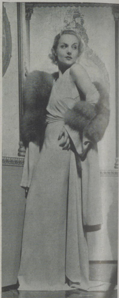
Elegante y distinguida, CAROLE LOMBARD es admirada por el público

mente con su vida. Brilla entre las multitudes. Las personas le son muy simpáticas.