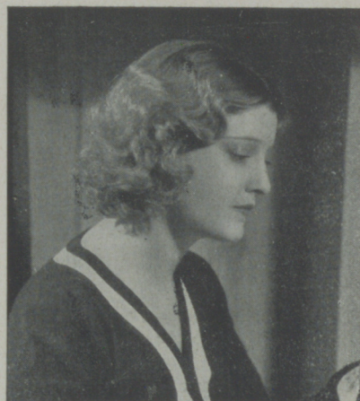
JEANETTE MAC DONALD