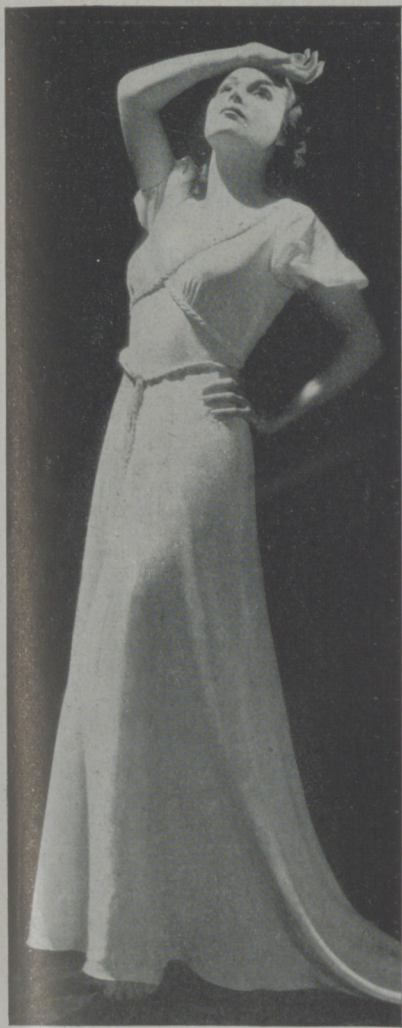
Una expresión característica de CAROLE LOMBARD

Si a veces, en un momento de descuido, se le ve una mirada de desilusión en sus ojos con la sugestión de que las lágrimas están muy cerca, hay que mirar a otra dirección.