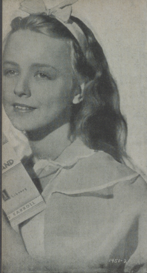
CHARLOTTE HENRY, la mu- nequita de la Paramount, que promete ser una gran estrella.