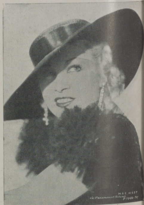
MAE WEST , la pícaro actriz de la Paramount, que confiesa que el serlo "No es pecado".

✱ La pareja Charles Farrey y Virginia Valli continúa siendo muy feliz, a pesar de los rumores de continuas desavenencias conyugales.