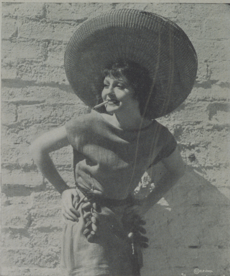
NANCY CARROLL, gentil estrella de la Cifesa, se siente perfecta mejicana en esta foto

* Douglas Montgomery ha regresado de Nueva York donde tuvo oca-