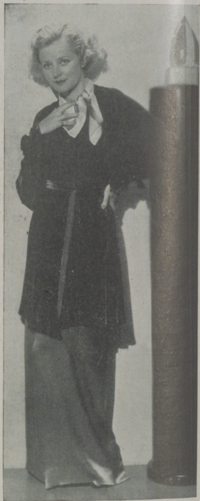
EVELYN LAYE, una criatura muy agradable y elegante en grado sumo.

—¿Es una reunión de solteras? — le pregunté a boca de jarro.