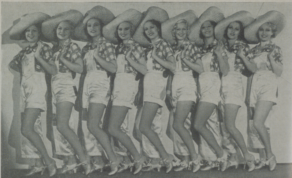
Un grupo de preciosas extras que lucen su belleza en "Seamos optimistas", de la Fox.