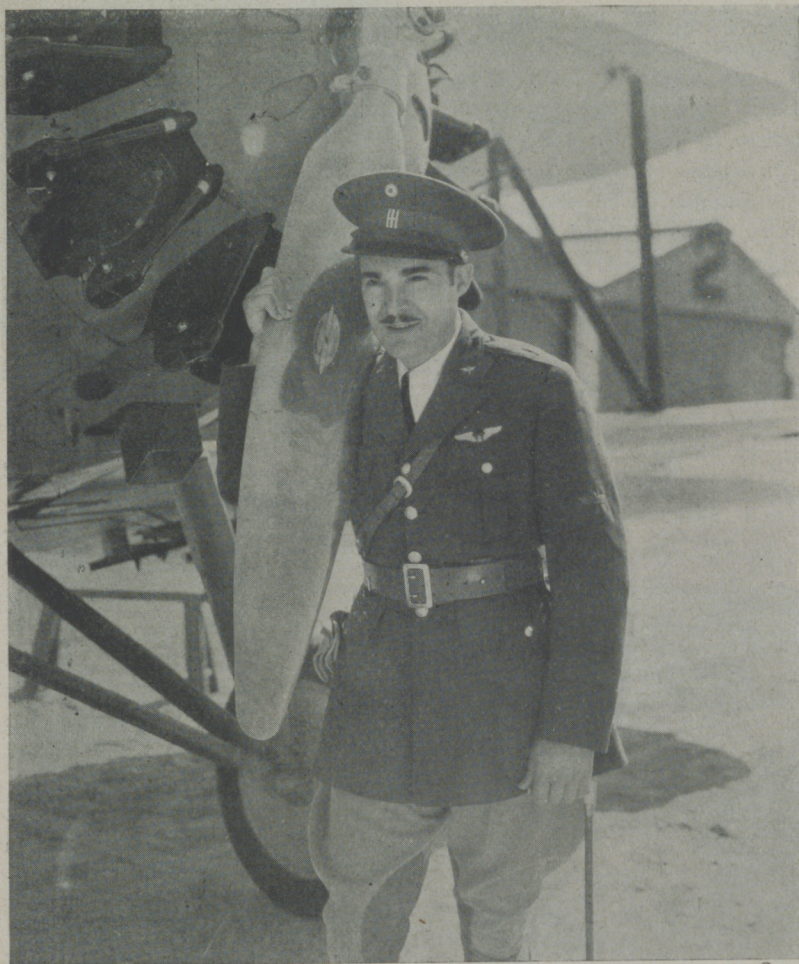
RAMON PEREDA , protagonista y director de "El vuelo de la muerte", gran película mejicana que distribuye Cifesa

Ramón Pereda, el artista español de recio acento castellano, el hombre lleno de inquietudes artísticas, ha conseguido realizar una de sus más grandes ilusiones, llevando a la pantalla un drama viril, lleno de emociones en honor de la gloriosa tragedia de la aviación hispana. Por vez primera, los estudios de Méjico, puestos a disposición de Pereda nos envían una obra en que la aviación del país, toma parte activa en la película, y aunque no es una obra esencialmente de aviación, contiene no obstante un drama intenso, profundo, donde el gran actor demuestra las excelencias de su temperamento.