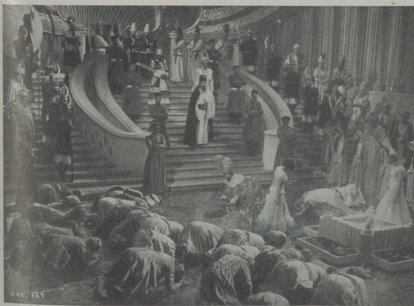
Una escena de "Chu Chin Chow", que ha obtenido gran éxito

sión de hacer la corte de nuevo a la encantadora Lois Moran que no está dispuesta aún a regresar al cine.