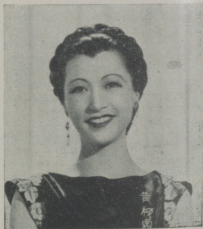
ANNA MAY WONG

La influencia de Capricornio, afecta a todos los nacidos entre 21 de diciembre y 21 de enero, e irán mejorando hasta marzo. Los nacidos en Acuario, 21 enero a 19 febrero, entre los que se hallan Ra-