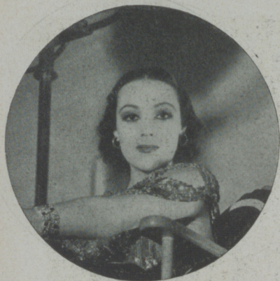
DOLORES DEL RIO, de la Warner