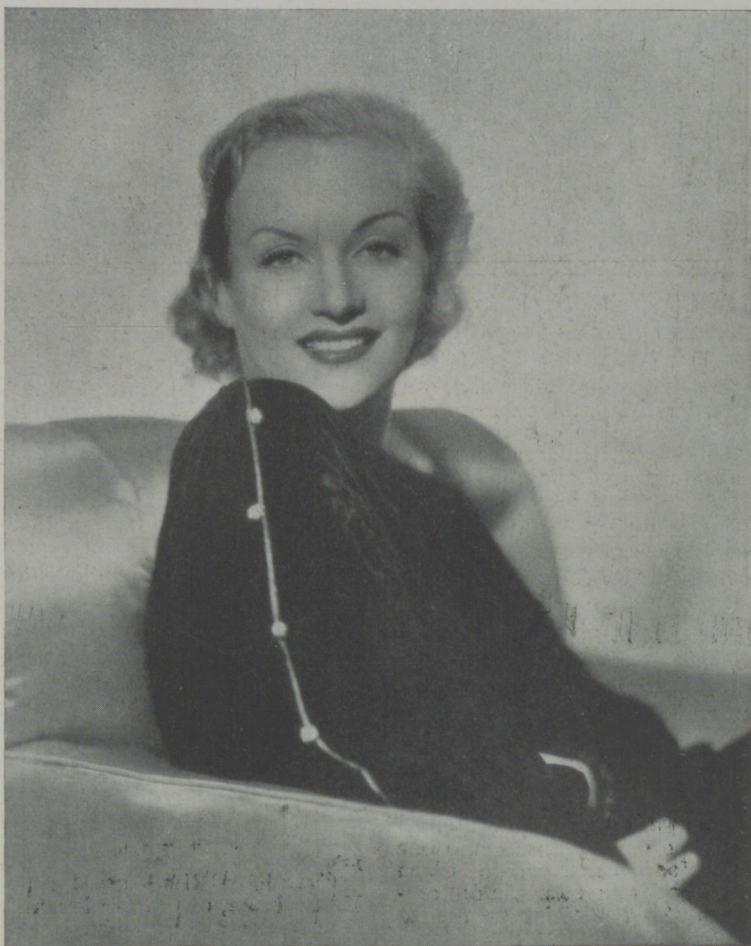
La sonrisa de CAROLE LOMBARD es un enigma. No sabemos si corresponde ya a la pregunta que van a hacerle o es complacencia a lo que se le ha dicho.

"Yo sé lo que quiero, pero no lo puedo conseguir, conqué me tendré que conformar y tomar las cosas como mejor me vengan."