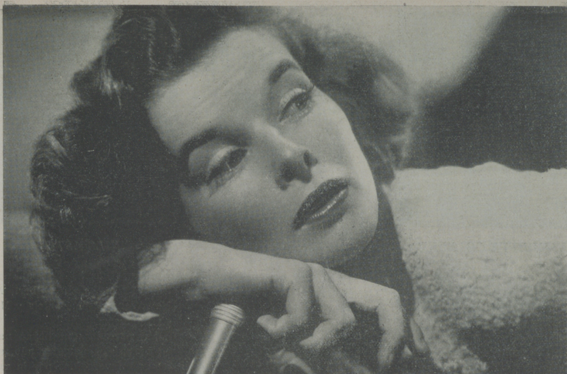
KATHERINE HEPBURN, la genial actriz de Radio Film, uno de los valores más firmes de la cinematografía americana.