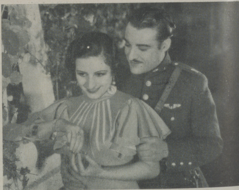
Una escena de "El vuelo de la muerte" de Cifesa

Animado por los mejores deseos para que el cine hispanoamericano sea un hecho firme, no ha reparado en sacrificios para dar a nuestra cinematografía una obra llena de emoción y en la que ha puesto todos sus entusiasmos, dando vida a un problema sentimental en que un hombre se sacrifica por un amor puro, gesto que es muy propio de nuestra raza ya que llega inclusive a morir por él.