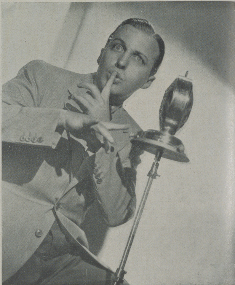
BUIG CROSBY, el artista de la Radio que en las películas Paramount ha obtenido rotundos éxitos como cantante.

Gordon y Revel son muy amigos y se entienden mejor que ninguna otra pareja de compositores de can-