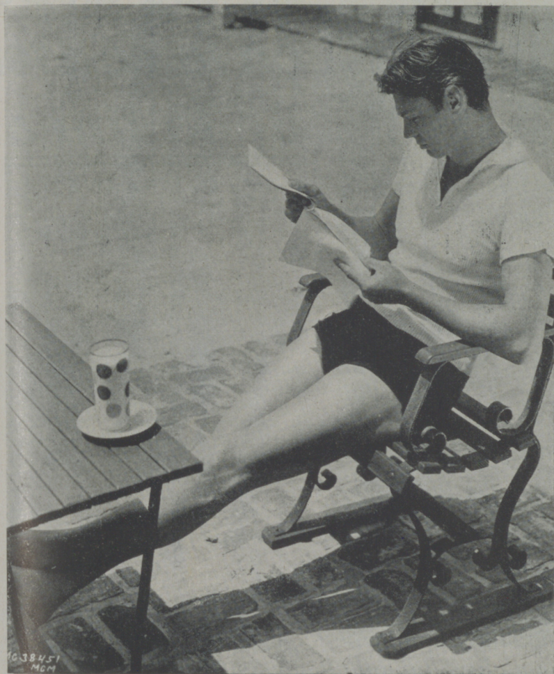
JOHNNY WEISSMULLER, el atleta que ha tenido más éxito y ha despertado más admiraciones, en sus actuaciones cinematográficas.

Es verdaderamente increíble la enorme influencia que en el espectador cinematográfico ejerce el aspecto de los artistas. Cuando un espectador ha llegado a admirar a una persona por las noticias que ha leído de ella o porque lo ha oído en la radio, se lo forja en su imaginación con este o aquel cuerpo, fea o bonita, de además amenzante, o de genio bondadoso. Es decir, el espectador espera que cada actor aparezca realmente como sus aptitudes lo revelan en su imaginación.