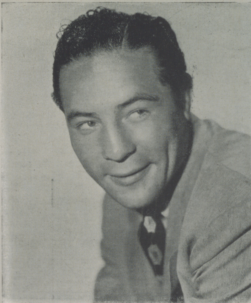
MAX BAER, el campeón del mundo de boxeo, que veremos próximamente en los films Paramount

✱ Grace Moore, la popular Señora Parera, acaba de recibir 25.000 dólares por cantar tres "soirées" en la reciente Exposición del Automóvil de San Francisco.