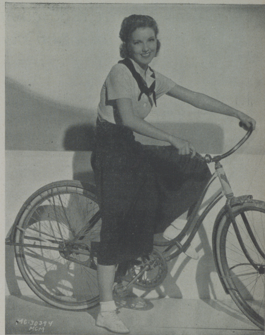
JEAN PARKER de la Metro, siente predilección por la bicicleta que la conserva dentro del peso justo.

—No, de ninguna manera — nos repuso—. He de advertirle que mi conformación no es extraordinaria pero, no obstante hago todo cuanto puedo por eliminar grasa que ni proporciona esbeltez ni es saludable. Yo, aunque no fuera artista cinematográfica, haría ejercicios pa-