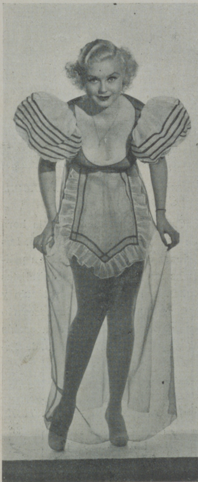
TOBY WING, bella artista de la Paramount que presume de unas piernas maravillosas.

* Marlene Dietrich cree que la notoriedad publicitaria es medio éxito y por esta razón al llegar a Hollywood el príncipe egipcio Felixe Rolo — muy conocido en su casa — ella lo acaparó de tal manera que por doquiera que se veía al Príncipe se encontraba la vampíresa. En cambio, Carole Lombard, opina que nada atrae tanto la atención de la gente como las pieles y aumenta la colección de sus abrigos con otro más de la piel más costosa y por el que ha pagado nada menos que 10.000 dólares — unas 75 mil pesetas.