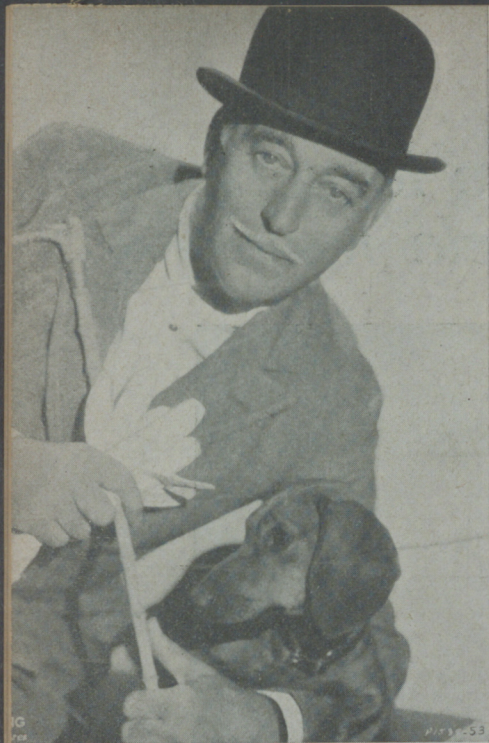
SIR GUY STANDING de la Paramount