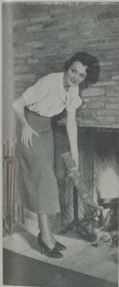
MARY ASTOR, excelente ama de casa

Todo el mundo se había vuelto al oír el grito de la niña para ver que le pasaba. Menjou, embarazado por primera vez en su vida, miró a todas partes y dijo aturdido: