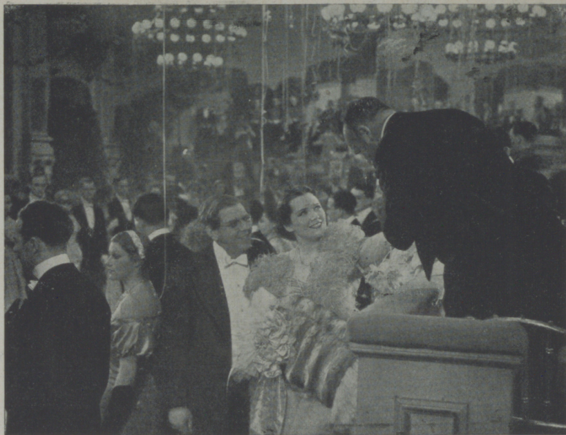
Una escena de "Mascarada" de Ufilms, una de las películas de más éxito de la temporada.

dido. En el vestibulo de la Sala de audiencias del Palacio Imperial de Viena, está Franz de Modena. Pide hablar inmediatamente con el Emperador y evitar la infamia que por motivos políticos se quiere cometer con María Luisa. Al llegar a presencia del Emperador, se encuentra frente a un hombre en cuyo semblante se refleja el abatimiento y el dolor. Franz de Modena calla y se resigna. ¡Cuánto no habrá sufrido el padre antes de decidirse a dar el consentimiento para el matrimonio de su hija...!