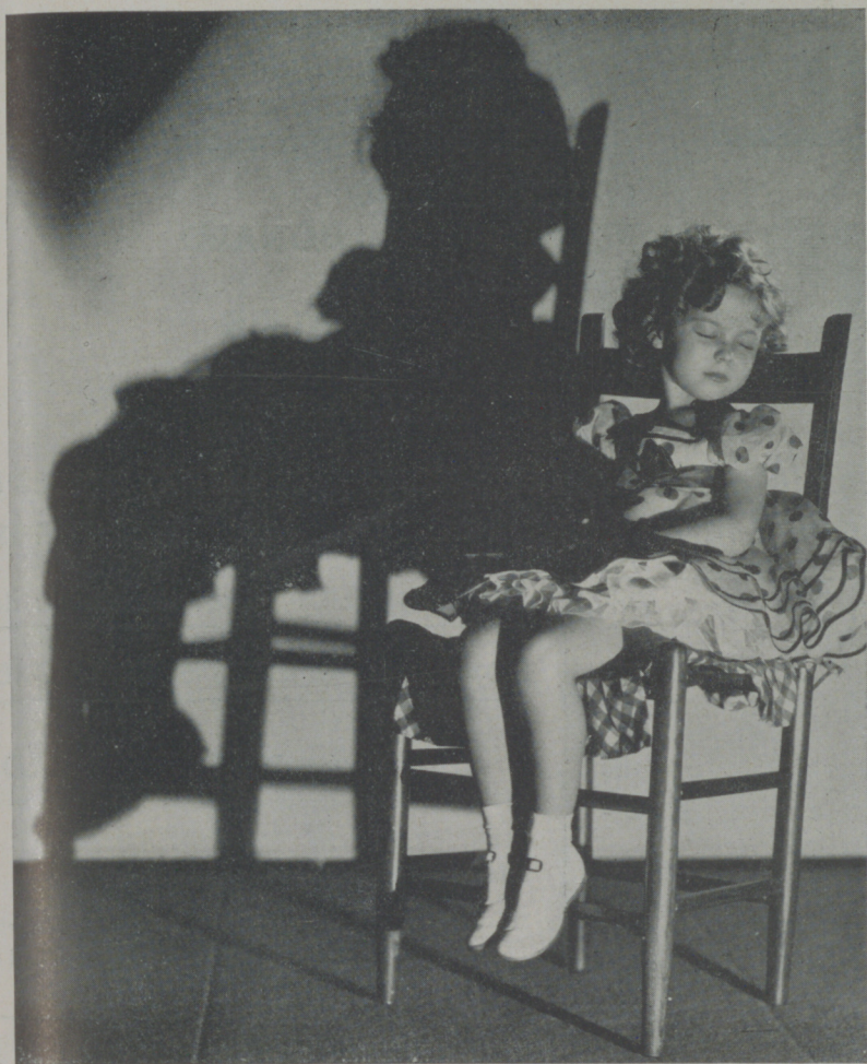
La pequeña SHIRLEY, artista de la Fox, en un momento de candor genuino en una de sus películas