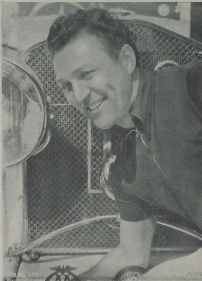
CARL BRISSON, actor de la Paramount que no se deja peinar sino por el peluquero Hjalmar.

y Hjalmar se fué camino de la calle. Diez minutos más tarde volvía a presentarse cargado de toallas, peines, cepillos, tijeras y todo cuanto entra en una cortada de pelo y afeitada de primer orden. Sin tener tiempo de protestar Nugent se encontró con una toalla anudada al cuello y al tiempo que dirigía la escena Hjalmar le recortaba el pelo. Luego le tocó el turno a Cary.