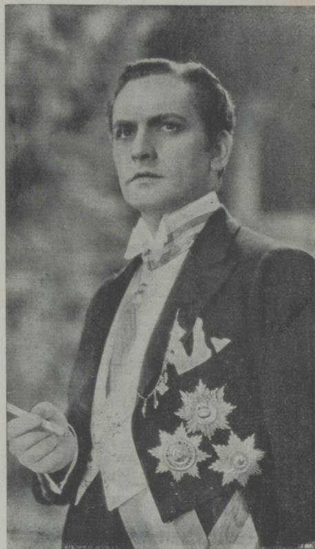
FREDERICH MARCH en "La Muerte de Vacaciones"

✱ Mady Christians, la actriz vienesa que en Europa no llegó a triunfar plenamente, ha obtenido un éxito resonante con su primera película de Hollywood.