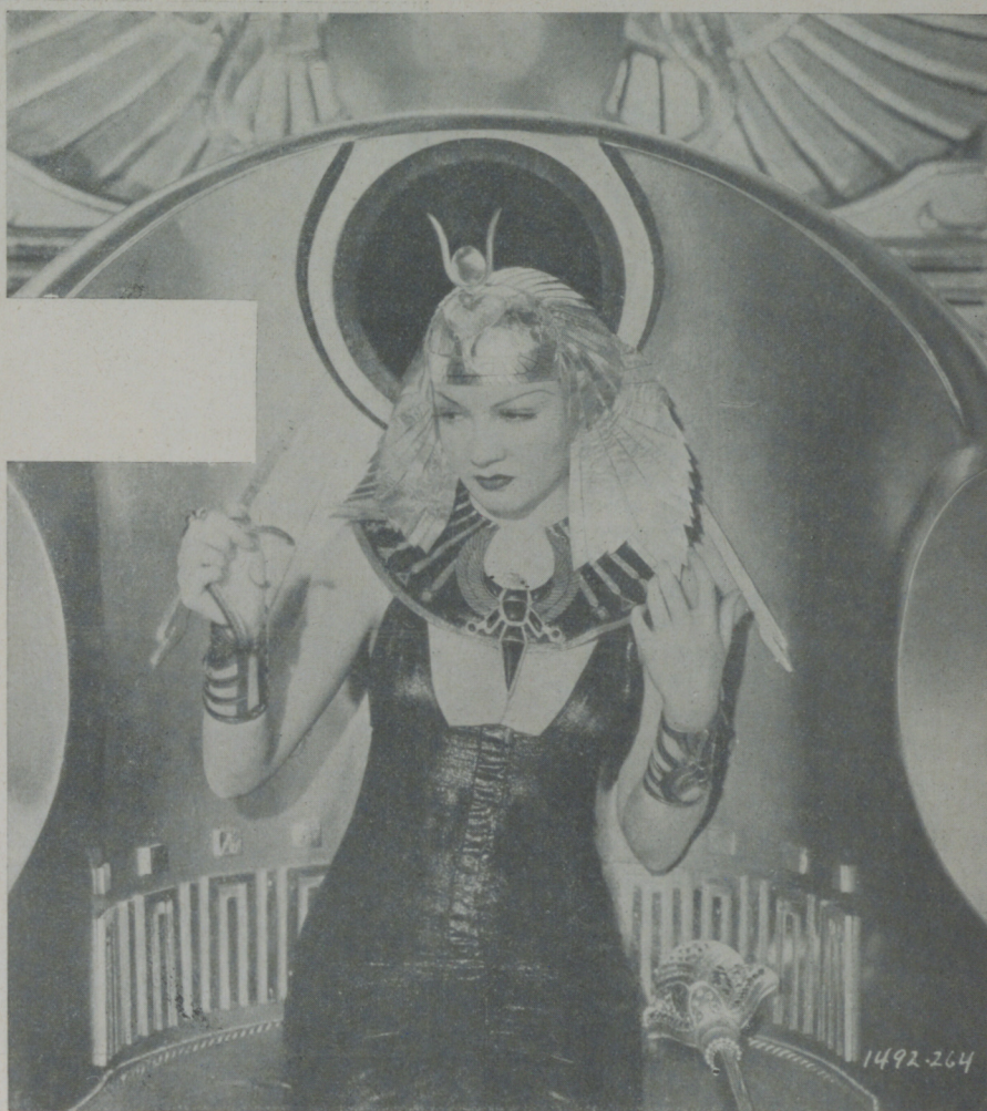
CLAUDETTE COLBERT, la bellísima actriz de la Paramount en una escena de "Cleopatra"

Hay ya empresas, netamente españolas, que se han trazado un plan de trabajos para producir un número determinado de películas en