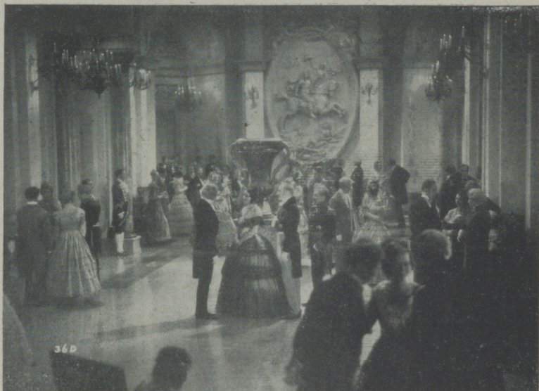
Una interesante escena de "Maria Luisa de Austria" presentada por Ufilms en el Urquinaona con gran éxito.