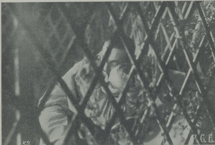
Una escena de la producción española, "La Dolorosa"

No es que nosotros tengamos predilección por lo que ya está hecho; pero si los que se dedican hoy a hacer argumentos cinematográficos no tuvieran suficiente fantasía para crear ni ser lo suficiente observadores para copiar de la vida, que busquen en nuestras obras literarias que en ellas encontrarán muchas suficientes para hacer adaptaciones que puedan ser buenas obras cinematográficas.