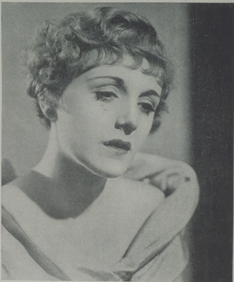
Una expresión característica de MARY ASTOR, en una de las películas filmada por la Warner.