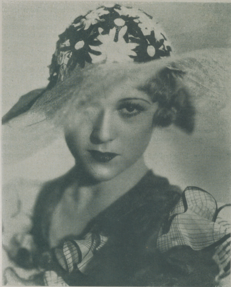
SALLY EILERS, la bellísima actriz de la Fox y una de las mujeres más elegantes de Hollywood

Contra lo que ocurría antes, el tener parecido con un actor o una actriz célebre es un obstáculo casi infranqueable para ingresar en un estudio cinematográfico.