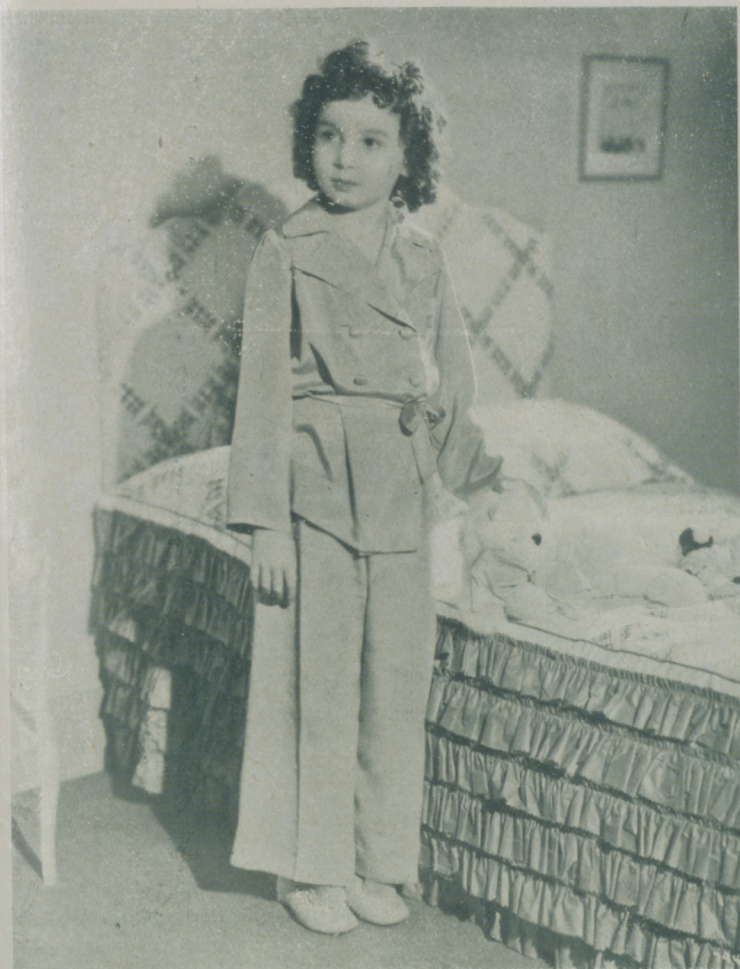
CORA SUE COLLINS, de la Metro

También están tomando parte activa en películas, Dawn O'Day, conocida por la linda Anne Shirley; Tom Brown, Dorothy Gray, etc., etc.