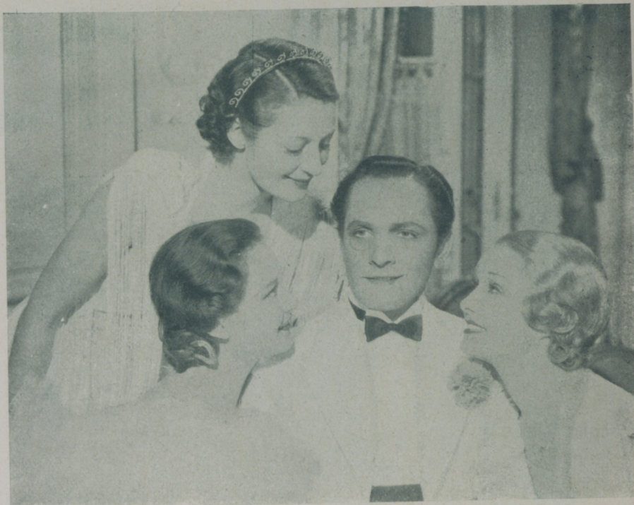
KATHERINE ALEXANDER, EVELYN VENABLE y GAIL PATRIK, rodeando a FREDRIC MARCH, en una escena de "La Muerte de vacaciones"