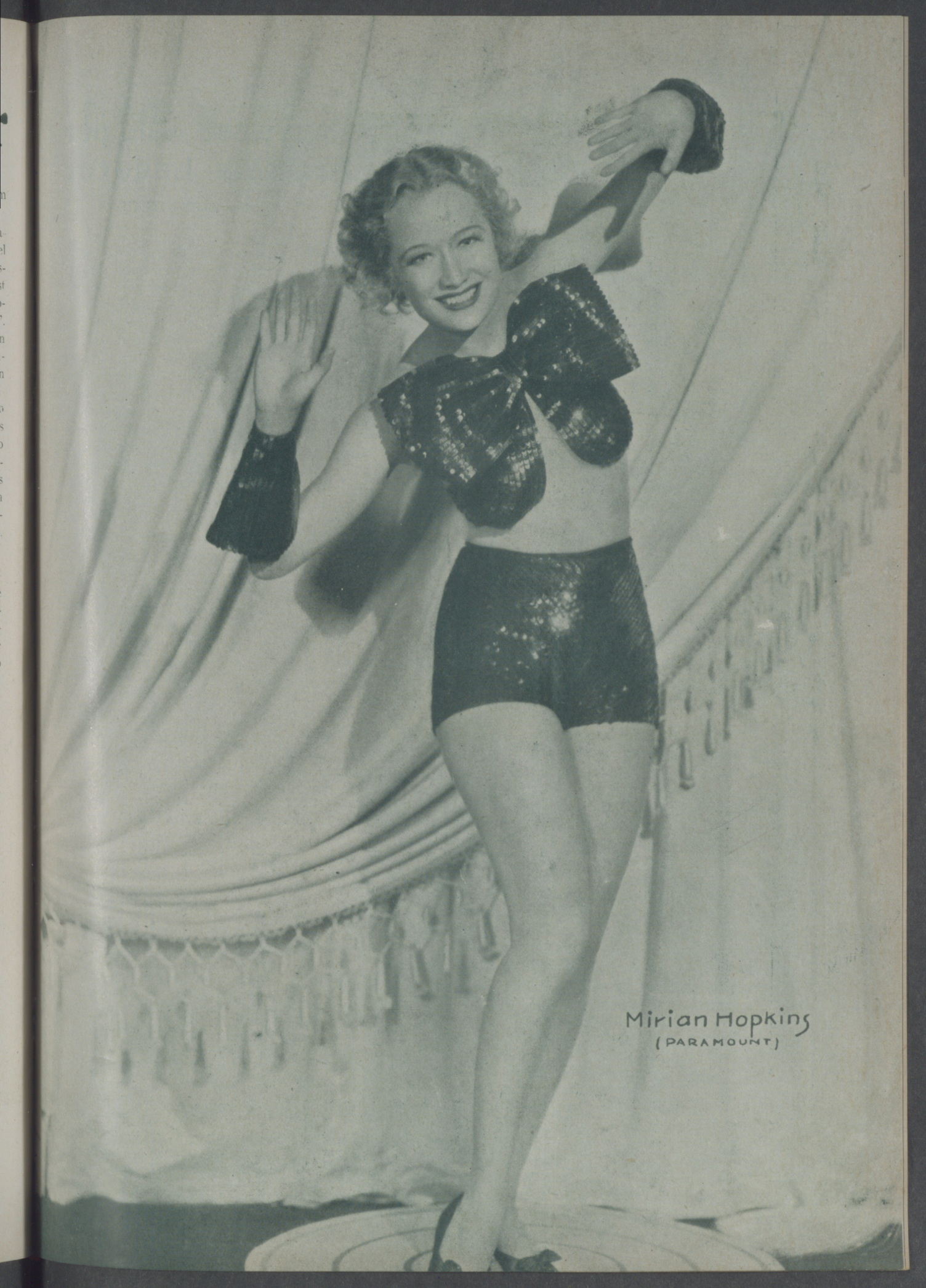
Mirian Hopkins (PARAMOUNT)