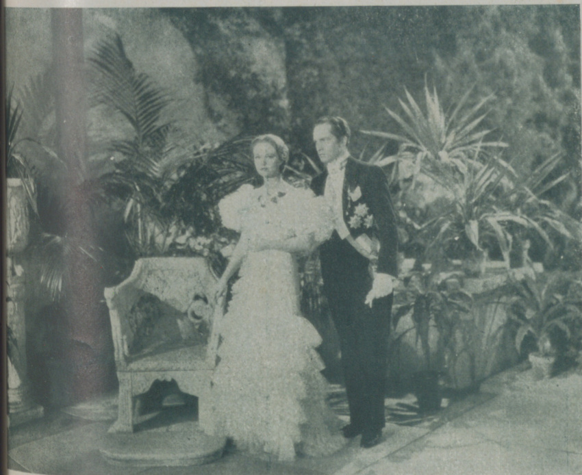
EVELYN VENABLE y FREDRIC MARCH en "La muerte de vacaciones"

¶ Norma Shearer ha terminado "María Antonieta", por lo cual le será posible acompañar a su esposo cuando éste vaya a Londres. El viaje se efectuará durante el presente mes de febrero.