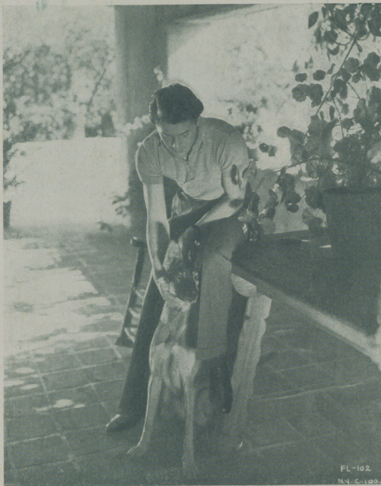
FRANCIS LEDERER, actor de Radio Films, que discierne en las declaraciones recogidas en ésta con verdadero sentido

—¡Hollywood! ¡Una tempestad en un vaso de agua!