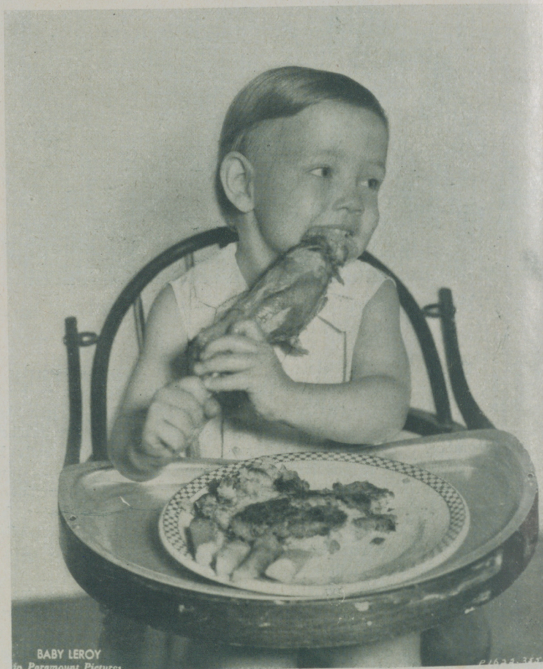
BABY LEROY in Paramount Pictures