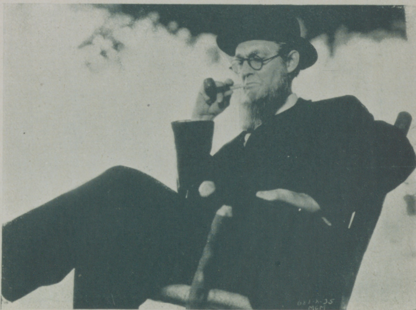
LIONEL BARRIMORE caracterizado dentro de la personalidad que requiere la obra

Aquí tenemos a Lionel Barrymore que ha interpretado infinidad de papeles que distan mucho de tener semejanza con su bondadosa manera de ser. Pero Lionel Barrymore, actor de excelencia sabe adaptarse a los personajes más en pugna con su temperamento y aunque guste interpretar vidas de seres llenos de humanidad, no duda en convertirse en personaje de psicología un tanto repulsiva si es necesario al film. Gran actor puede adaptarse a los más variados personajes.