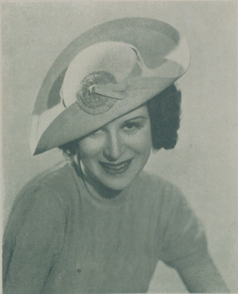
KITTY CARLISLE, nueva artista de la Paramount que está llamando la atención en América por su talento artístico

El mejor comentario que puede hacerse del buen éxito alcanzado por la artista en su primera presentación cinematográfica es observar que apenas estrenada la película "El crimen del Vautier", la editoria anteriormente citada la eligió para el rol de heroína en los dos films que Bing Crosby ha de hacer para la próxima temporada. El primero de dichos films, titulado "Fuga apasionada" ya está terminándose de rodar y el segundo "Dímelo con música" empezará a rodarse tan pronto se filme la última escena del primero.