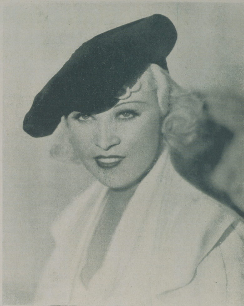
Guapa, de rostro perfecto y ojos maliciosos, MAE WEST es la mujer que más admiradores ha tenido en América

Las reuniones semanales en casa de Joan Crawford son de la más completa sencillez. Los invitados no pasan