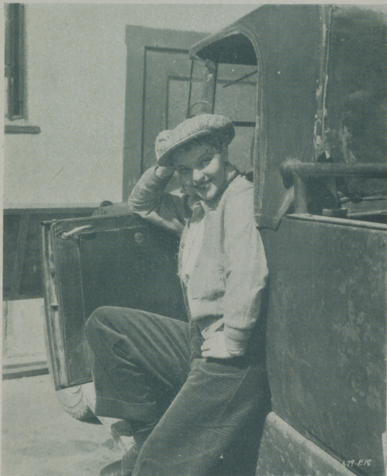
SALLY BLANE, gentil artista de la Universal

¶ La Metro ha contratado a Paul Lukas por dos años. El primer film que ha de hacer el actor europeo es un asunto de misterio e intriga.