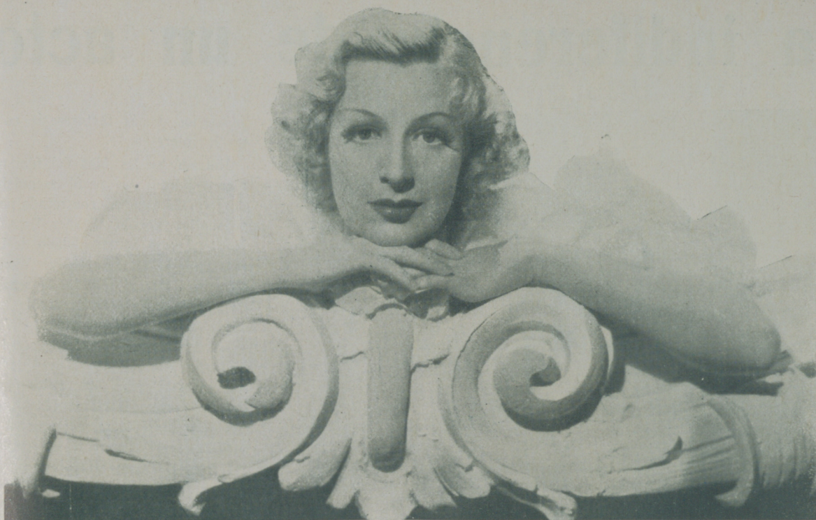
GERTRUDES MICHAEL, nueva figura de la Paramount cuya singular belleza ha despertado grandes admiraciones en el mundillo cinematográfico