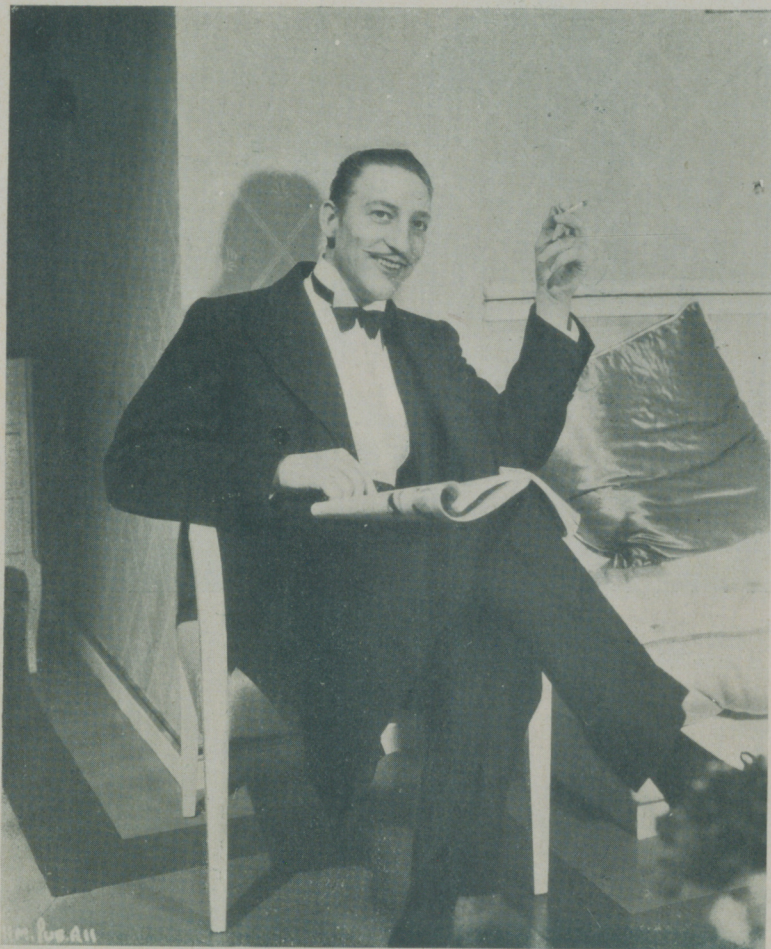
WARREN WILLIAM, actor de la Warner que debe su popularidad, no a su parecido con John Barrymore, sino a su destacada personalidad interpretativa

Dos años y medio de constante trabajo en los estudios cinematográficos no han logrado despertarle de su absoluta indiferencia por todo cuanto a él se refiere. Trabaja con entusiasmo en los films, pero le son en absoluto indiferentes el asunto, el rol que desempeña, el escenario en que se mueve y las actrices que con él comparten su trabajo. Sólo le interesa actuar ante la lente; no le importa en qué, ni dónde actúa.