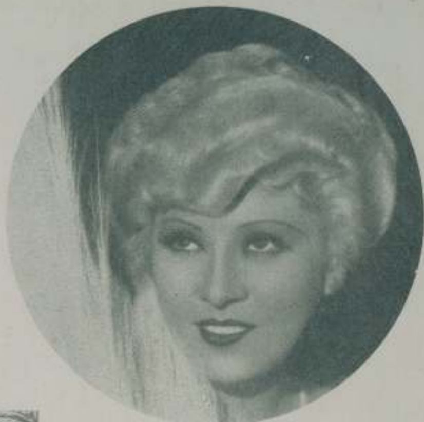
Expone la sensual y con ella que pocos pudo ser una MAE WEST: la vida y otras.

Le gusta más irse de tiendas que comer... y hoy que ver lo que le gusta comer! La ropa interior bucila, victoriosa y llena de agujeros.