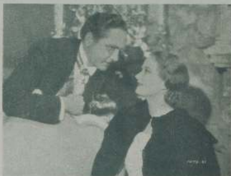
EVELYN VENABLE y FREDRIC MARCH en "La Muerte de vacaciones" de la Paramount.

—Cierto es que Hollywood ha resultado para mí un lugar que agrada y que muestra de cuando en cuando. No niego que Hollywood le guste y fustigara la impresión de ser una de las poblaciones más adigarr-