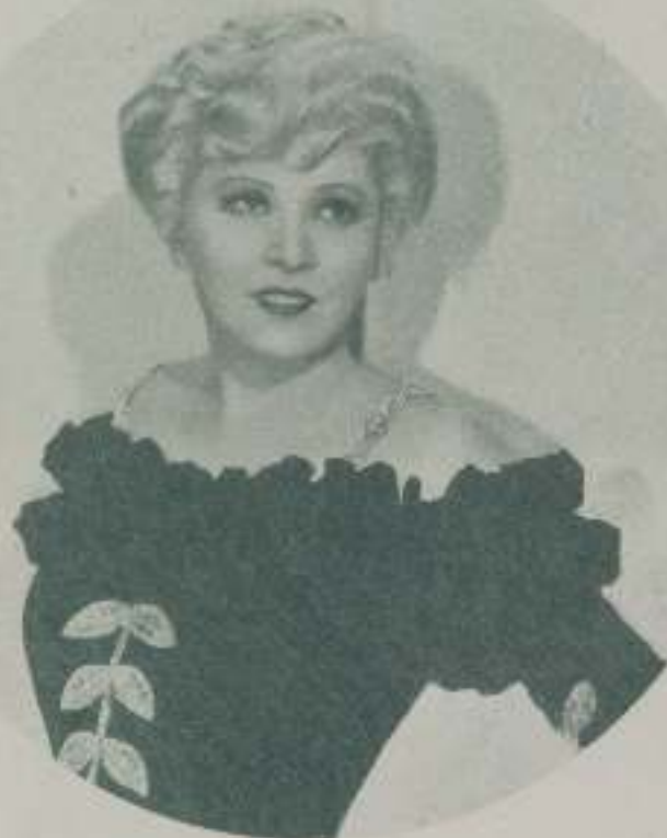
MAE WEST, la mujer de líneas plásticas y belleza magnífica que no quiere que la envada se apodere de ella por el espíritu de la línea.

El mundo suena acun a Mae West de ser una mujer en extremo caprichosa, pero ella en cambio, jamás ha acusado a ningún hombre de nada, ni los ha culpado de cosa alguna: ella ha sabido y sabe defenderse en todo caso; siempre tuvo atinada contentación para todo, y a ese desparpajo acertado debió su celebridad en su principio.