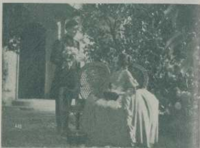
Una escena llena de ambiente de “El último Vals de Chopin”

rosas e ilimitadas palabras de alabanza para el artista. George Sand Musset, con el instinto de amante coloso ha alfitado el rival. Pero esta apasionada mujer puede dejar de lado sin imitarse y sin ningún remordimiento, el destino de otra persona, cuando se le presenta una nueva y más fuerte aventura... Elner y Chopin se encuentran en varias partes ante meritas cerradas. ¿Es que esta estrella ha de perder tan pronto su fulgor? — Vestida de hombre, la escritora se cruza en el camino del desazonado compositor Fila. Ella, cuyo verdadero nombre es Aurora Dufevant, se vio obligada en un tiempo a adoptar un disfraz y un nombre masculino, para poder llevar entrada en los cerrados y opulentes círculos de sus compañeros de profesión. Sin imaginarse con quién está hablando, Friedrich Chopin hace una severa y dura crítica de sus novelas, a las que falta luz y sol, no estruendo más que oscuras problemáticas... y luego se entera por el camarero del restaurante de artistas de qué es la persona en cuestión. — George Sand, sin embargo, no se ha dado por ofendida. Justamente con Franz Liszt, que acaba de regresar a París después de una brillante tournée, cambian acébil para el joven compo-