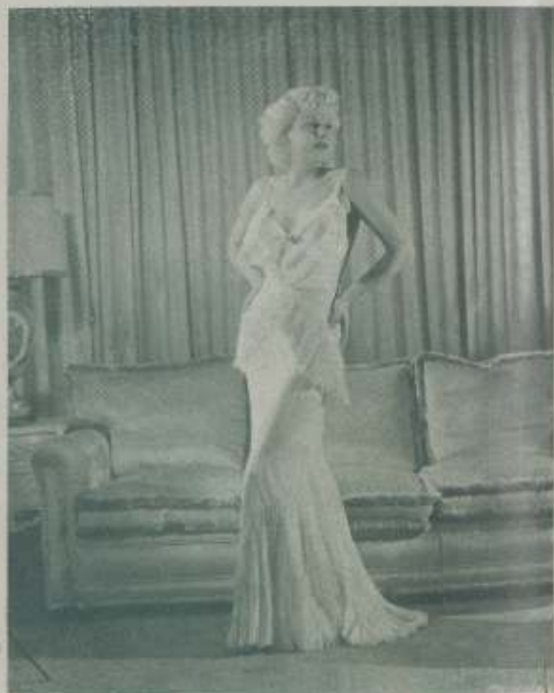
JEAN HARLOW es tan solicitada, que a veces no hay media de encontrarla cuando la necesitan en los estudios