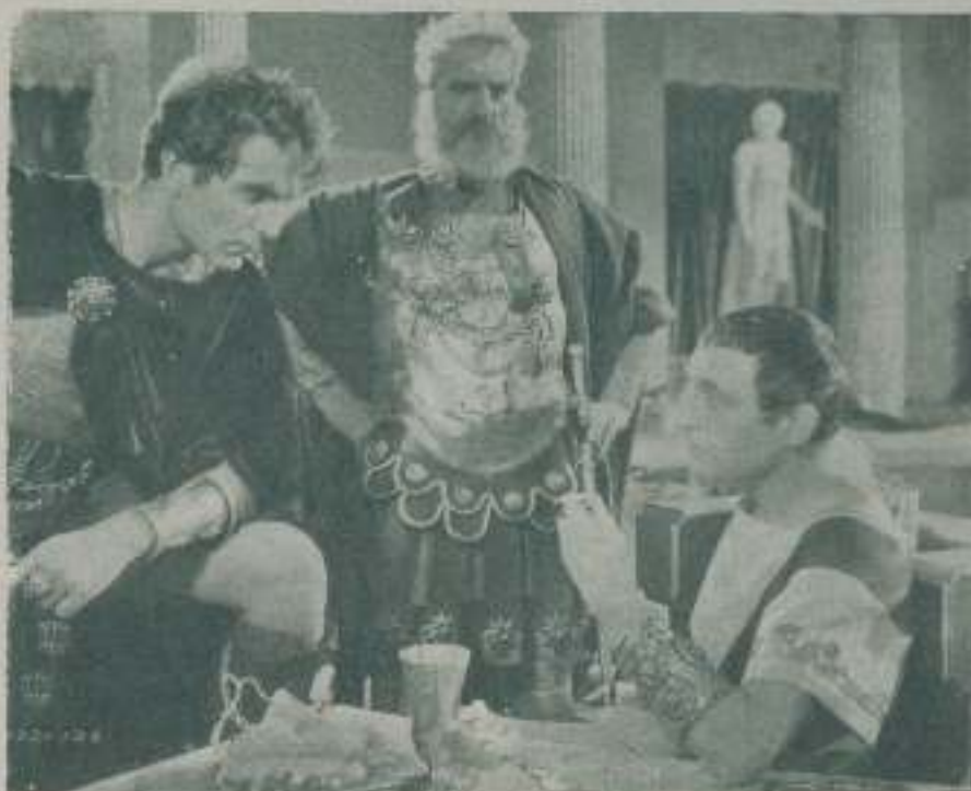
Una escena de "Cleopatra", la gran película de la Paramount que va de éxito a éxito.