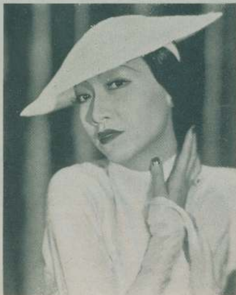
ANNA MAY WONG la celebrada actriz china que asegura que sus compatriotas no necesitan besarse para expresar sus sentimientos amorosos

Según la bellísima estrella china Anna May Wong, el beso y otros medios demostrativos de amor que emplean los occidentales cuando quieren captarse el afecto de una persona, no tienen la menor aceptación en China por falta de sutileza y artificio que revela su brusquedad.