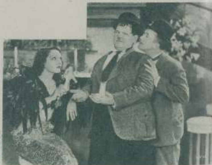
STAN LAUREL, OLIVER HARDY y LUPE VELAZ en una escena de "Fiesta en Hollywood", de M. G. M.