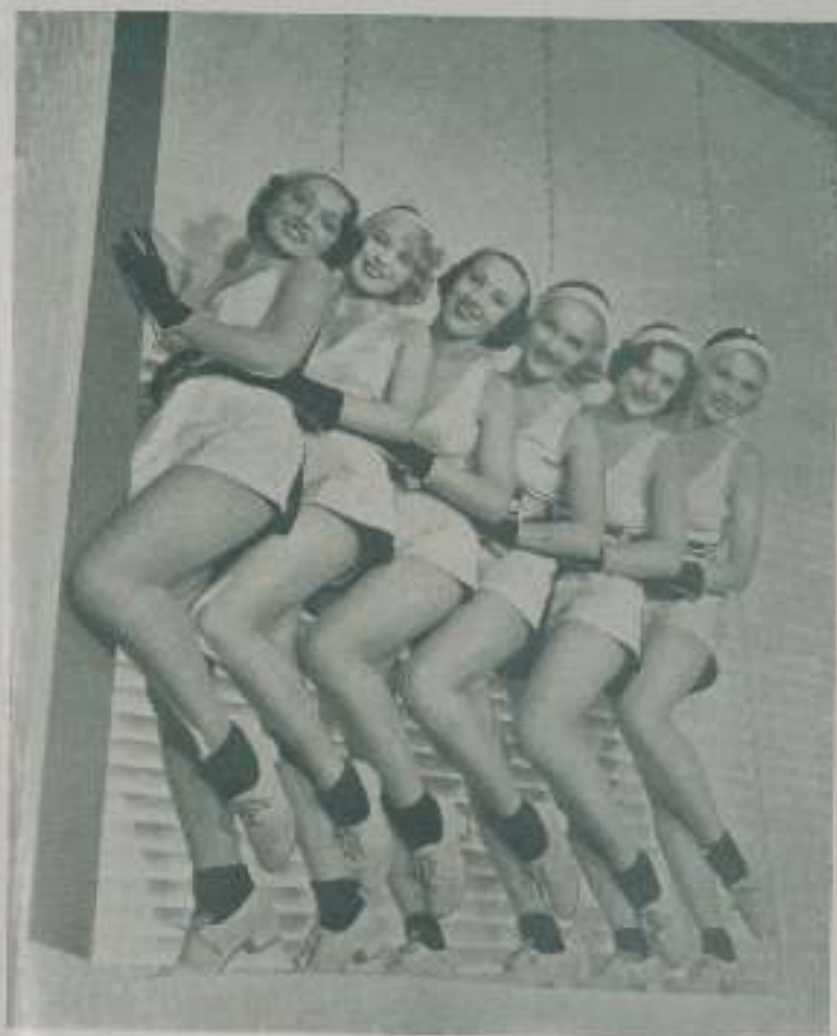
Mujeres maravillosas, extras de belleza extraordinaria que componen los conjuntos de las comedias musicales

Pero el principal encanto, las verdaderas protagonistas son esas mujeres admirables que bailan maravillosamente, que poseen una belleza exquisita y que componen los conjuntos Extras, poco se ha hablado de vozetas y no obstante son el principal motivo de las revistas, por nuestra juventud y por el entusiasmo que ponéis para que las obras adquieran relieves notorios.