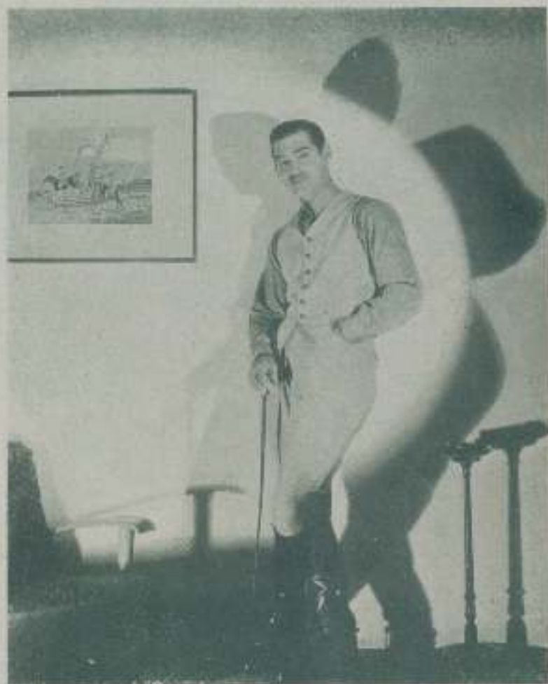
CLARK GABLE, el galán favorito del público femenino, y que no tiene enemigos entre el masculino

Para alcanzar el codiciado galardón de estrella de la pantalla, no basta como muchos suponen, con firmar un contrato y traspasar las puertas de algún estudio.