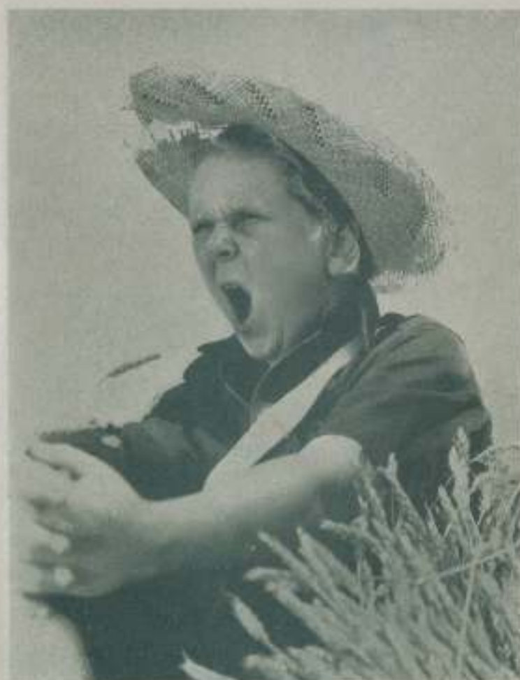
JACKIE COOPER que también acostumbra a perderse en la oscuridad de los cinecámaras