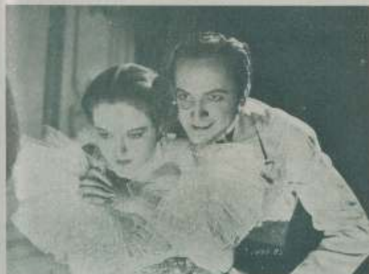
Una escena de "La Muerte de vacaciones", admirablemente interpretada por EVELYN VENABLE y FREDRIC MARCH.

Y con esto la maravillosa actriz nos dejó plantados en la estación, e indicó al taxista la dirección del nuevo hogar Evelyn Venable-Hal Mohr que deseamos sea uno de los más felices y duraderos de Hollywood.