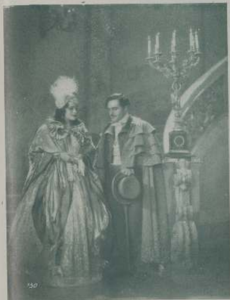
Una escena de la gran película de Ufima "El último Vals de Chopin"

El claro sol de un hermoso día de primavera lanza sus cálidos y suaves rayos sobre las verdosas torres de la vetusta ciudad de Varsovia. De la ventana de una burgesa casa salen los acordes de un fogoso vals, que se elevan hasta el purísimo cielo azul anunciando el ardiente amor y la futura fama del joven polaco, genio de la música: Friedrich Chopin. — Su maestro, el viejo y bondadoso profesor Elsner, no logra retener a su discípulo para el estudio del seco contrapunto. Con arreglo a leyes propias, que son nuevas a mejor dicho, revolucionarias, ha terminado una obra. Hoy celebra el día de su cumpleaños su adorado Constantia, y presuroso va a felicitarla y a ofrecerle como regalo la obra que acaba de terminar. Lo que la boca del joven músico no se ha atrevido a expresar, lo ha hecho su canción. Es-