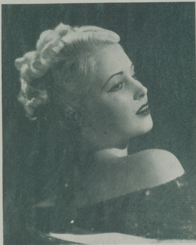
JUNE LARRY gentil y bellísima actriz de la Fox, una de las mujeres más atractivas de Hollywood

June Larry es una mujer bonita. Una mujer llena de todos los atractivos que pueden radicar en una criatura de estos tiempos que, además de moderna posee ese don particular de levantar admiraciones a su paso.