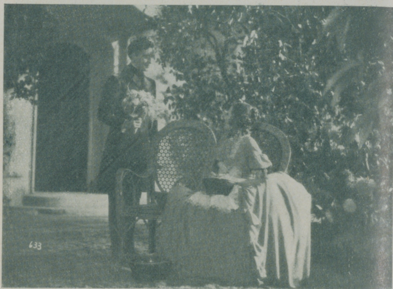
Una escena llena de ambiente de “El último Vals de Chopin”

rosas e ilimitadas palabras de alabanza para el artista, George Sand. Musset, con el instinto de amante celoso ha olfateado el rival. Pero esta apasionada mujer puede dejar de lado sin inmutarse y sin ningún remordimiento, el destino de otra persona, cuando se le presenta una nueva y más fuerte aventura... Elsner y Chopin se encuentran en todas partes ante puertas cerradas. ¿Es que esta estrella ha de perder tan pronto su fulgor? — Vestida de hombre, la escritora se cruza en el camino del descorazonado compositor. Ella, Ella, cuyo verdadero nombre es Aurore Dudevant, se vió obligada en un tiempo a adoptar un disfraz y un nombre masculino, para poder lograr entrada en los cerrados y orgullosos círculos de sus compañeros de profesión. Sin imaginarse con quién está hablando, Friedrich Chopin hace una severa y dura crítica de sus novelas, a las que falta luz y sol, no tratando más que oscuros problemas... y luego se entera por el camarero del restaurant de artistas de quién era la persona en cuestión. — George Sand sin embargo, no se ha dado por ofendida. Juntamente con Franz Liszt, que acaba de regresar a París después de una brillante tournée, combina auxilio para el joven compo-