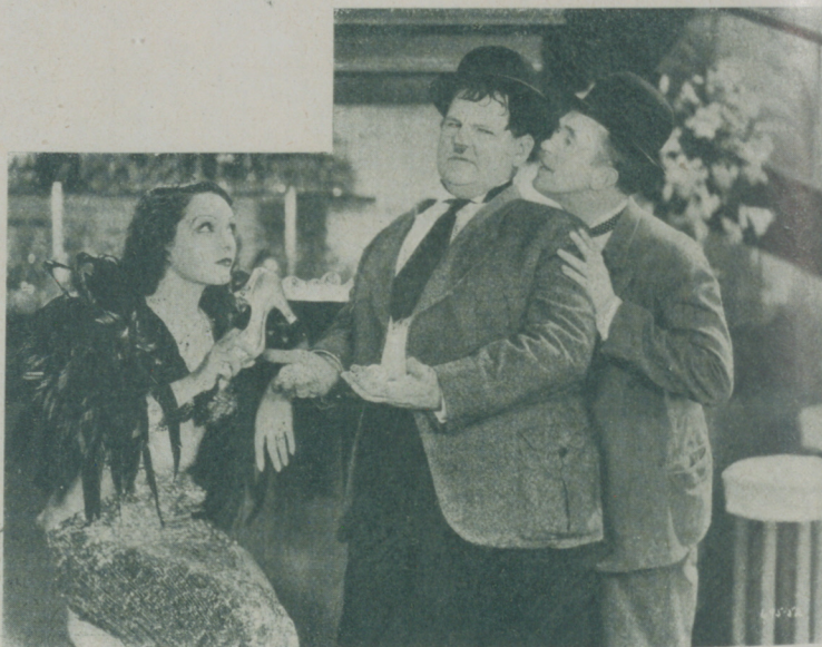
STAN LAUREL, OLIVER HARDY y LUPE VELEZ en una escena de "Fiesta en Hollywood", de M. G. M.,

tando a varias celebridades de la pantalla, entre ellas a Elissa Landi, Clau-