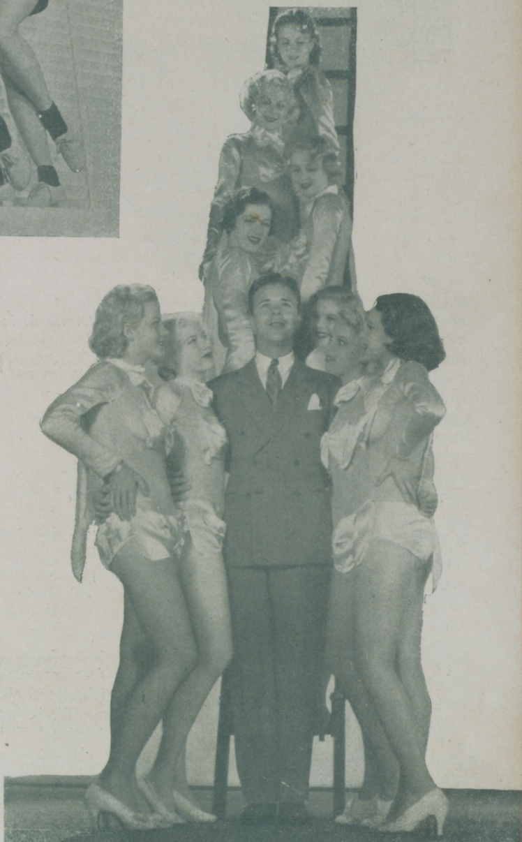
DICK POWELL rodeado de un grupo de extras en "Música y mujeres" de la Warner