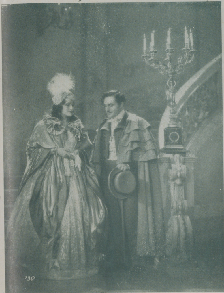
Una escena de la gran película de Ufilms “El último Vals de Chopin”

El claro sol de un hermoso día de primavera lanza sus cálidos y suaves rayos sobre las verdosas torres de la vetusta ciudad de Varsovia. De la ventana de una burguesa casa salen los acordes de un fogoso vals, que se elevan hasta el púrisimo cielo azul anunciando el ardiente amor y la futura fama del joven polaco, genio de la música: Friedrich Chopin. — Su maestro, el viejo y bondadoso profesor Elsner, no logra retener a su discípulo para el estudio del seco contrapunto. Con arreglo a leyes propias, que son nuevas, o mejor dicho, revolucionarias, ha terminado una obra. Hoy celebra el día de su cumpleaños su adorada Constantia, y presuroso va a felicitarla y a ofrecerle como regalo la obra que acaba de terminar. Lo que la boca del joven músico no se ha atrevido a expresar, lo ha hecho su canción. Es-