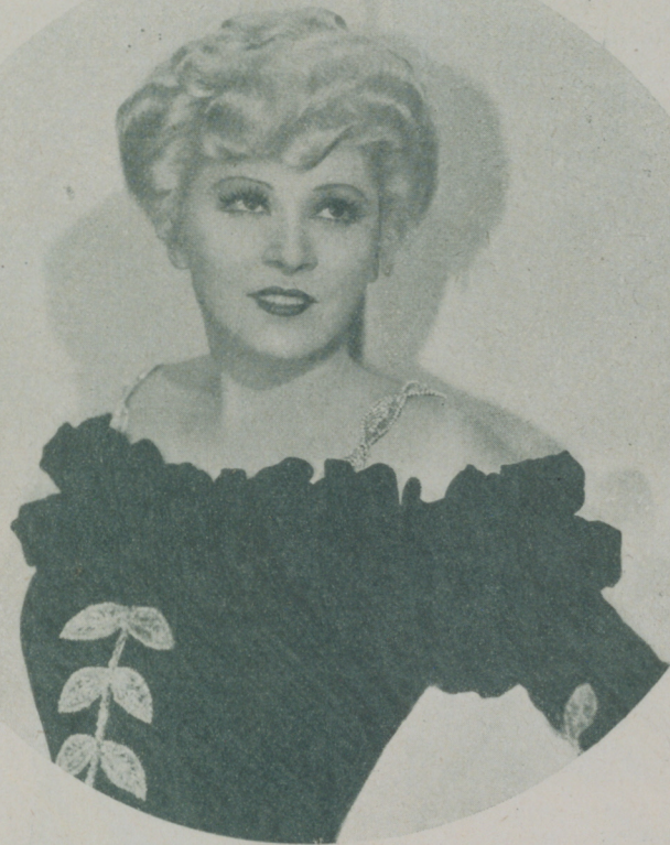
MAE WEST, la mujer de líneas plétóricas y belleza magnífica que no quiere que la anemia se apodere de ella por el prurito de la línea

El mundo entero acusa a Mae West de ser una mujer en extremo caprichosa, pero ella en cambio, jamás ha acusado a ningún hombre de nada, ni los ha culpado de cosa alguna; ella ha sabido y sabe defenderse en todo caso; siempre tuvo atinada contestación para todo, y a ese desparpajo acertado debió su celebridad en un principio.