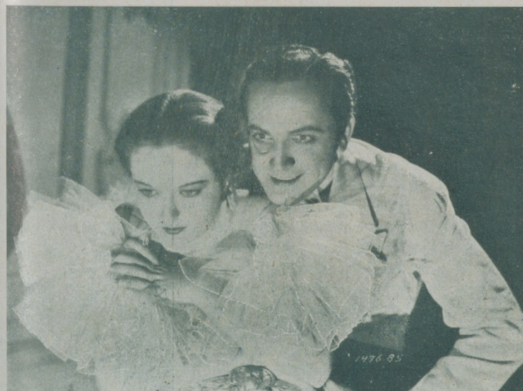
Otra escena de "La Muerte de vacaciones", admirablemente interpretada por EVELYN VENABLE y FREDRIC MARCH