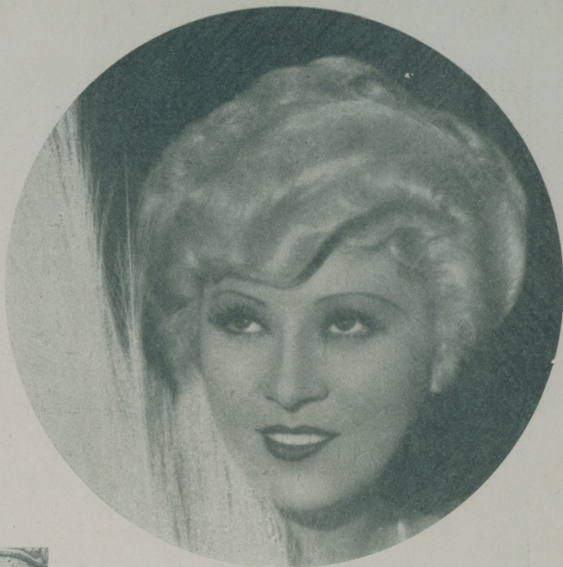
Expresiva la sonrisa y con ojos que parecen pedir ternezas MAE WEST fascina y atrae

Le gusta más irse de tiendas que comer... ¡y hay que ver lo que le gusta comer! La ropa interior bonita, vaporosa y llena de encajes