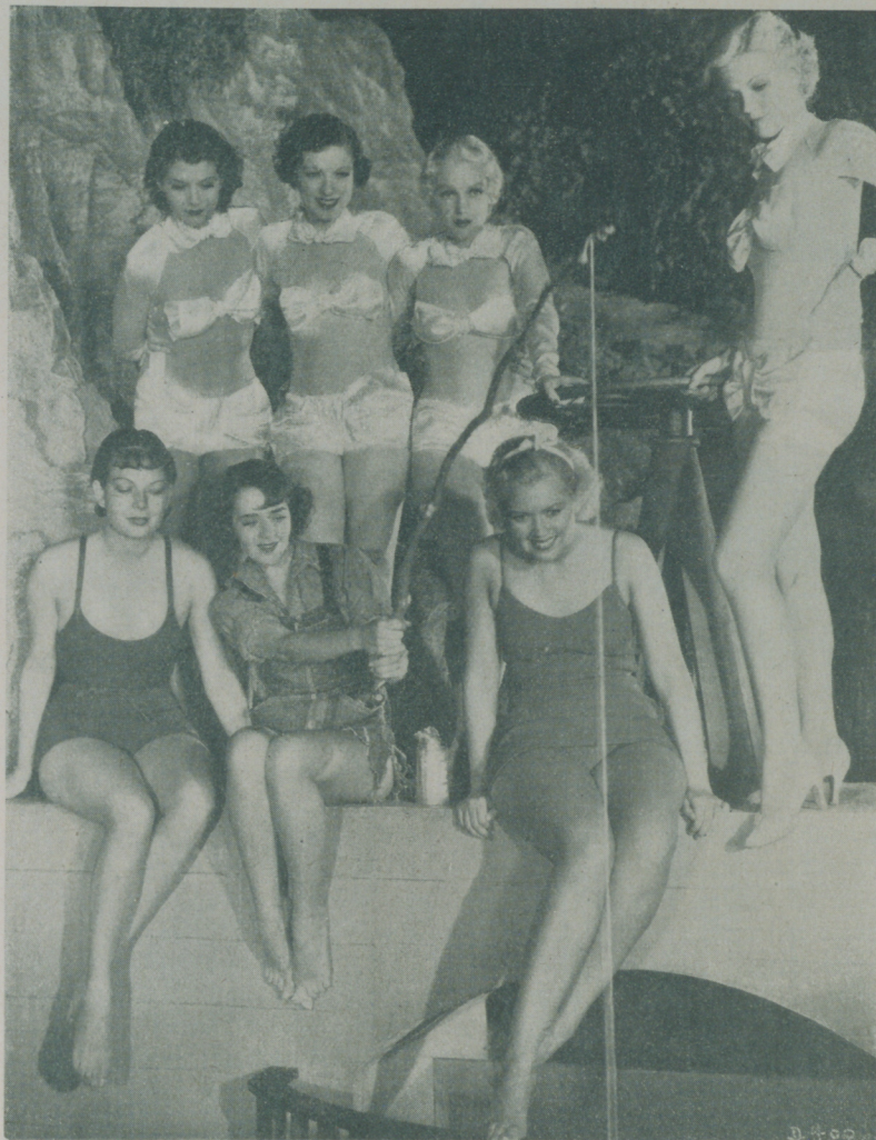
RUBY KEELER rodeada de "extras" de extraordinaria belleza, en la gran comedia musical de la Warner, "Música y Mujeres"

bra. El gran público gusta más de lo nuestro que de lo que no es nuestro. Ha llegado la hora de editar películas y estamos completamente convencidos de que en el próximo año cinematográfico nuestra producción actual habrá sido duplicada.