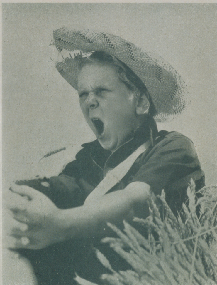
JACKIE COOPER que también acos tumbra a perderse en la oscuridad de los cinema tógrafos