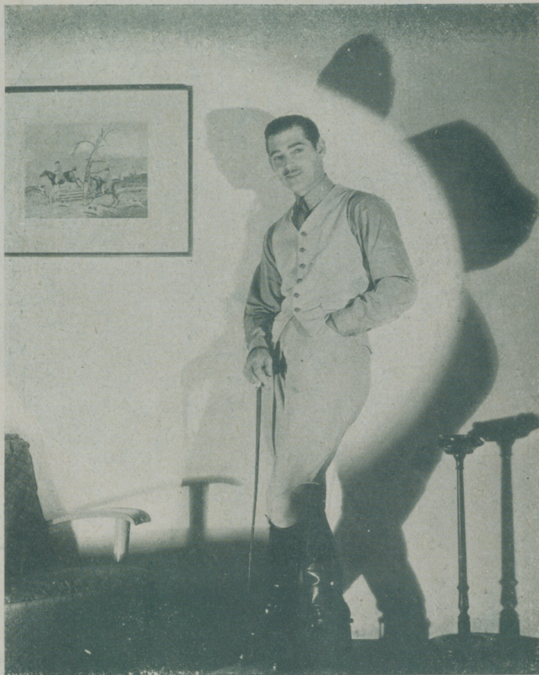
CLARK GABLE, el galán favorito del público femenino, y que no tiene enemigos entre el masculino

Para alcanzar el codiciado galardón de estrella de la pantalla, no basta, como muchos suponen, con firmar un contrato y traspasar las puertas de algún estudio.