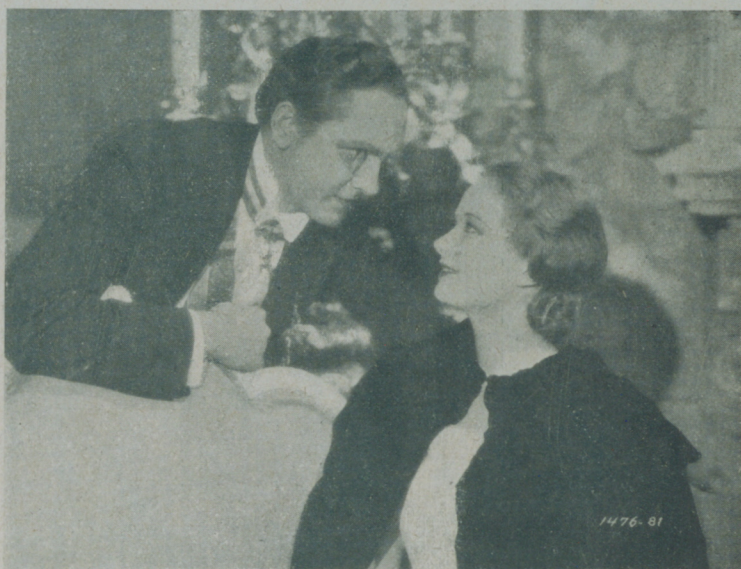
EVELYN VENABLE y FREDRIC MARCH en "La Muerte de vacaciones" de la Paramount

Y con esto la monísima actriz nos dejó plantados en la estación, e indicó al taxista la dirección del nuevo hogar Evelyn Venable-Hal Mohr que deseamos sea uno de los más felices y duraderos de Hollywood.