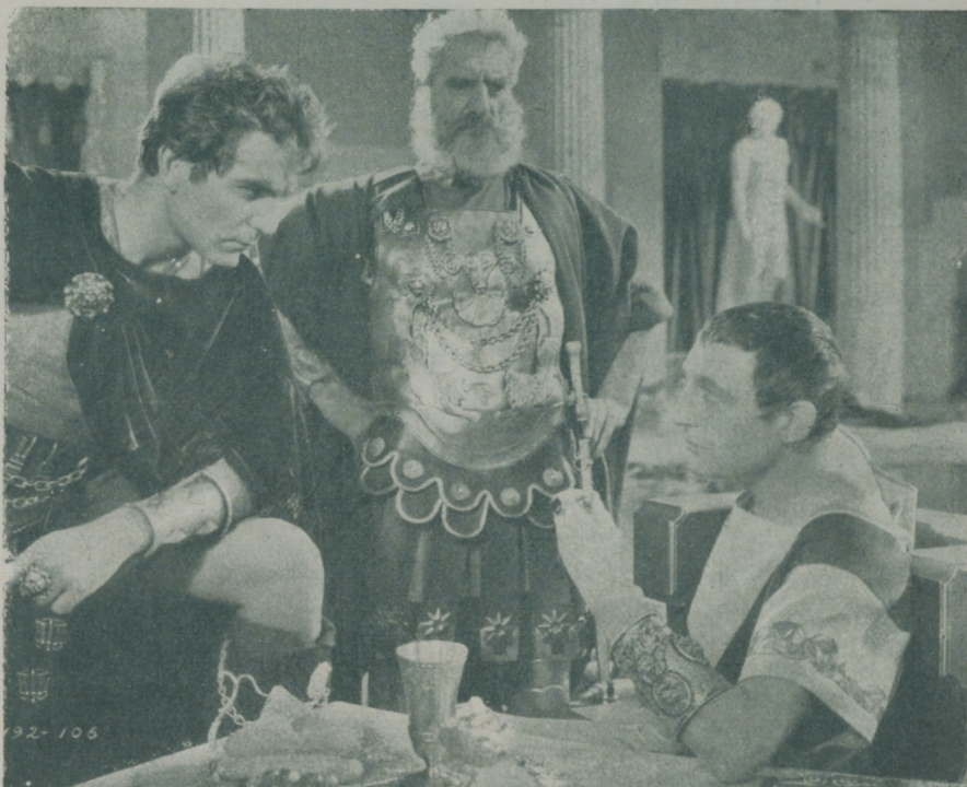
Una escena de "Cleopatra", la gran película de la Paramount que va de éxito a éxito

¶ Virginia Valli Farrell ha obsequiado a su maridito con un fantástico Alvis, esmaltado en gris y rojo, y Charlie ahora causa la admiración del Boule-