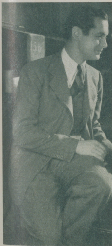
ROBERT MONTGOMERY de Metro Goldwyn Mayer

¶ Arline Judge y su esposo, el director Wesley Ruggles han marchado a Palm Springs sin el hijito de ambos. La inauguración del nuevo hogar fue algo apoteósico, grandioso, y los dos opinan que tienen derecho a un pequeño descanso antes de volver al mismo y al trabajo.