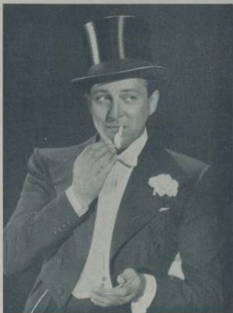
CARL BRISSON que se impone en Hollywood por su elegancia y simpatía

—Ha venido a hacer películas para la Paramount, no a divertirme — dijo — Además, ¿qué objeto hay en que vaya a las fiestas una mujer como yo que no fuma ni bebe ni tan siquiera sabe jugar a las cartas? Cuando quiere pasar un rato entretenida, lo con-