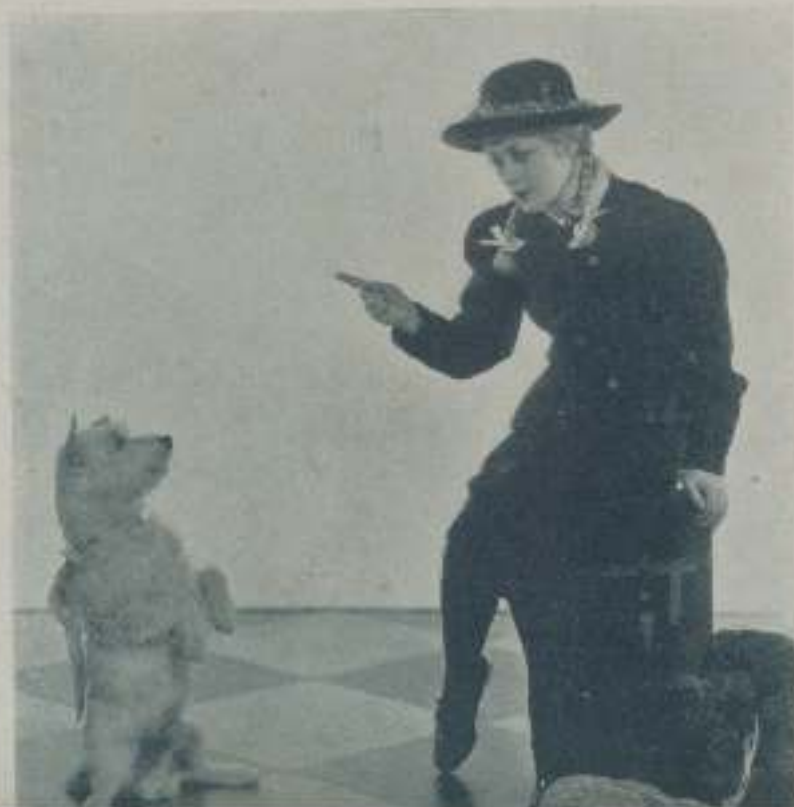
MARION DAVIES de M. G. M. extraordinariamente avanzada entendiéndose en arrastrar a su perro Michael