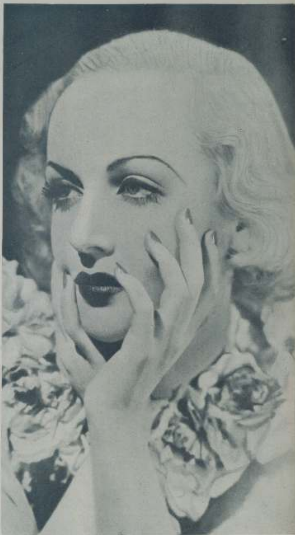
CAROLE LOMBARD la actriz de la Paramount que forzosamente ha de encontrarse con su ex marido William Powell y al que necesariamente ha de recordar

Y hay miles de casos como estos en los reales de Hollywood. De continuar la lista se haría interminable, por lo cual pongo punto final porque no quiero cansar a mis amables lectores.