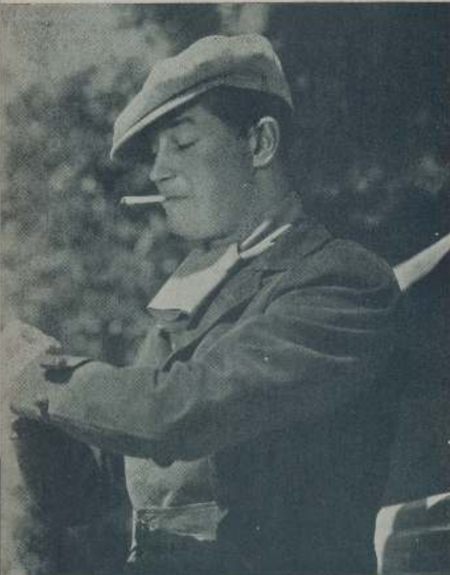
MAURICE CHEVALIER el hombre de la sonrisa pícaro del pilluelo parisino

Chevalier, nos dice una señora entrada en años, pero que aun conserva la juventud en sus ojos brillantes y la lozanía en sus mejillas.