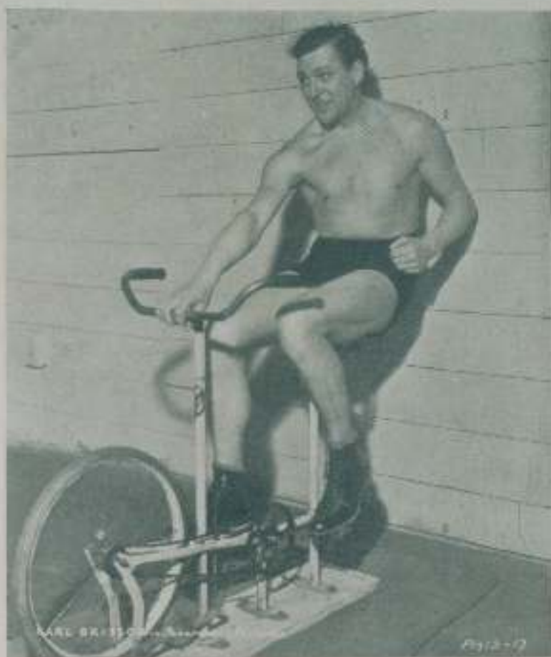
CARL BRISSON, el actor irlandés de la Paramount nos asegura estar exento de preocupaciones.