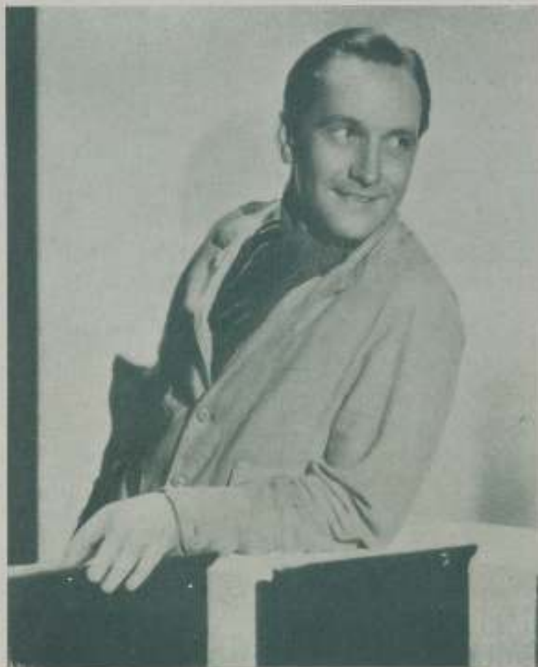
FREDERIC MARCH, el admirado actor, asediado actualmente por la más divulgadora popularidad

Como dije anteriormente, yo era un muchacho tremendo. Cierta es que en las fiestas infantiles de la localidad más recitar versos o hacer discursos, pero no deja de ser bueno cierto que a los seis años de edad mi padre me dió una soberana paliza porque me había permitido el lujo de hacer un recibo de un poder notario que no podía dar un peso de