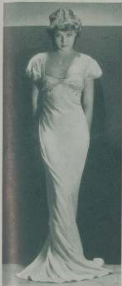
JEAN PARKER modelando por a su lindo traje que acaricia el perfecto ritmo de sus líneas.

les de que tal sucediera, había pensado hacerme artista. Pero la idea del cine nunca me pasó por la imaginación.