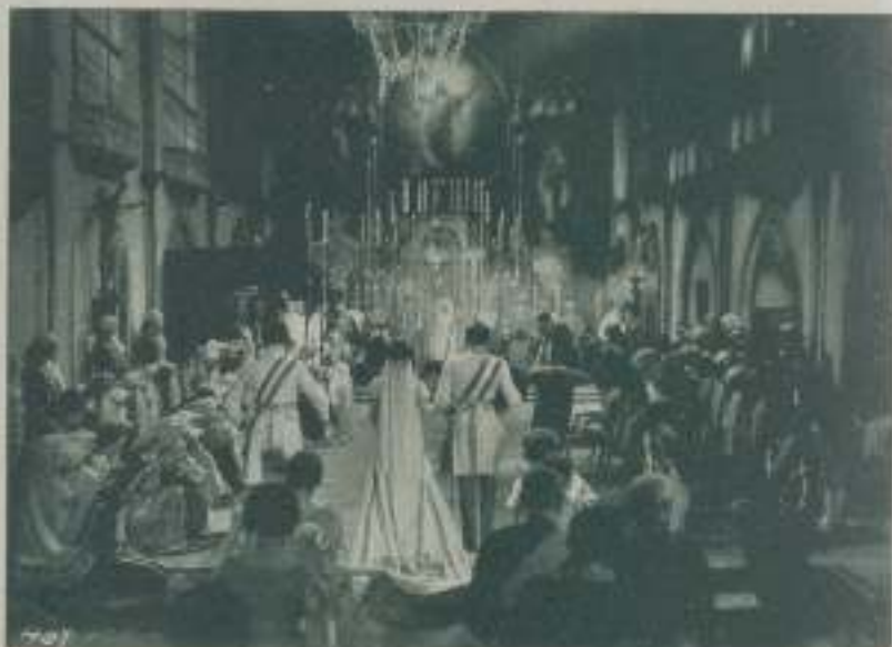
Una escena de la espectacular película "María Luisa de Austria"

le plazca, y manifiesta a Metternich que Ludovica, oía a Napoleón. — ¿Cómo va María Luisa a pronunciarse libremente por su matrimonio con el Emperador de Francia? — Metternich reflexiona. Algún día que indice a María Luisa y a la Emperatriz en favor de Napoleón. Es lo posible una personalidad inflexible — la mejor y más intimada un pariente de la Emperatriz Ludovica. — Y haciendo estas reflexiones piensa Metternich en el Duque de Pras de Moderna, hermano de la Emperatriz. El joven Duque vive una vida como la mayoría de los otros príncipes desposeídos de Napoleón. Sin dinero y sin regimiento su ocupación favorita es asistir a las bañeras del balneario imperial. En uno de esos ataques se presenta, como casualmente, Metternich. Después de breve conversación, el asunto diplomático queda perfectamente orientado. El Duque necesita dinero. Metternich pone sus fuertes suma a su disposición y le ruega, al mismo tiempo, que vaya a Hungría a visitar a su hermana y a preparar los lazos para el proyecto del matrimonio de María Luisa con Napoleón. La película sigue el mismo rumbo descriptivo y las escenas se van sucediendo llenas de colorido. La belleza de la actriz que encarna el papel de María Luisa es sorprendente. Los detalles como decorados y ambientes están admirablemente logrados y no dejamos más al lector para que pueda extraer el jugo del film cuando vaya a ver la película.