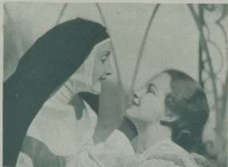
Una interesante escena de "Concén de casa" interpretada por DOROTHEA WIECK y KATHLYN VENABLE

* Robert Douré es el actor más solicitado del momento. Después de su triunfo en "El conde de Montecristo" todas las grandes editoras le han ofrecido contratos ventajosos, pero el francés aún ha firmado contratos sencillos para un film. Hasta la fecha sólo ha firmado con Alexander Korda y Paramount, pero es muy posible que haga "Beau Brummel" para la Reliance.