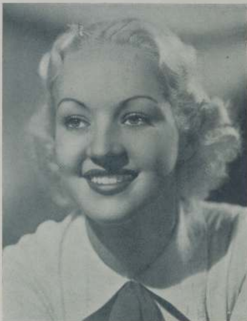
BETTY GRABLE, bellísima actriz de la Radio Films

¶ Robert Dunat continúa triunfando y consiguiendo buenos contratos. La Warner lo ha contratado para hacer la versión sonora de "Capitán Blood".