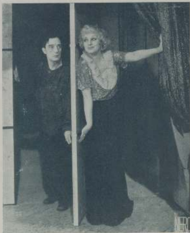
BUSTER KEATON, el actor cómico excelencia en una escena de "El rey de los Campos Elíseos" de Ufilms