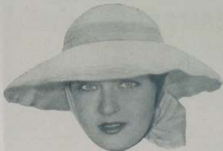
EVELYN VENABLE un nuevo descubrimiento estelar de la Paramount

¶ Otra buena noticia es la del regreso de Alice Pringle al teatro, contratada por la Metro.