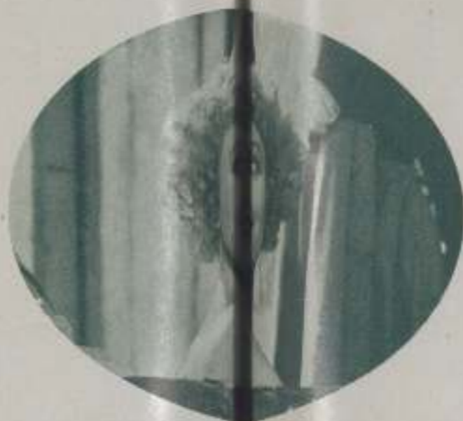
ANNA NEAGLE gentil artista que encarna el personaje de "Nell Gwyn" que se ve en México