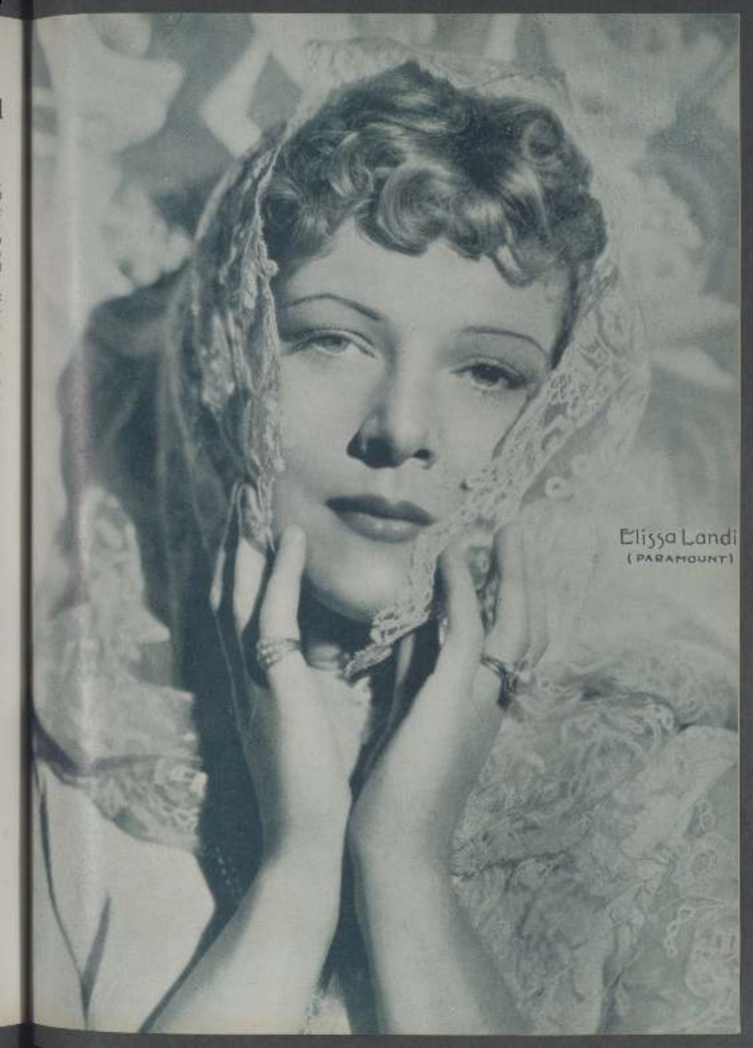
Elissa Landi