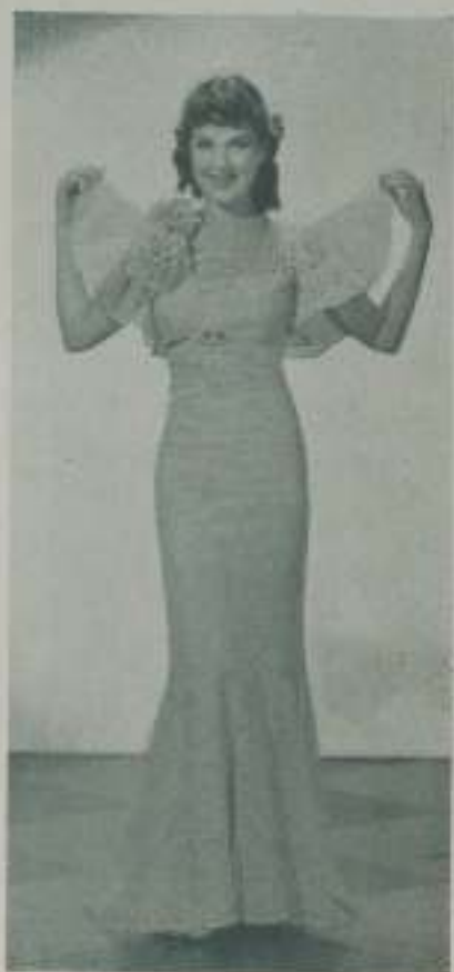
Elegante, delicada y bella JEAN PARKER es una de las muchachas que ha llevado al cinematógrafo con pie excelente

"Naturalmente, me gustan las fiestas de sociedad", nos dice, "y me encantan los lindos trajes vaporosos que en ellas se usan. A veces, creo que ya viví en otra época muy lejana, porque adoro los volantes, los encajes y el delicado olor de la alhucema... Sin embargo", agrega con cierta melancolía, "muy pocas oportunidades encuentro de ponerme vestidos así... Casi siempre tengo que usar trajes de sport".