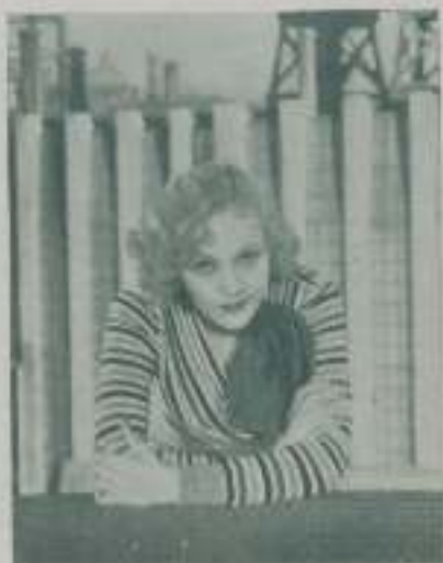
Tres expresiones de SHEILA TERRY, de la Warner, que posee una gran sensibilidad artística