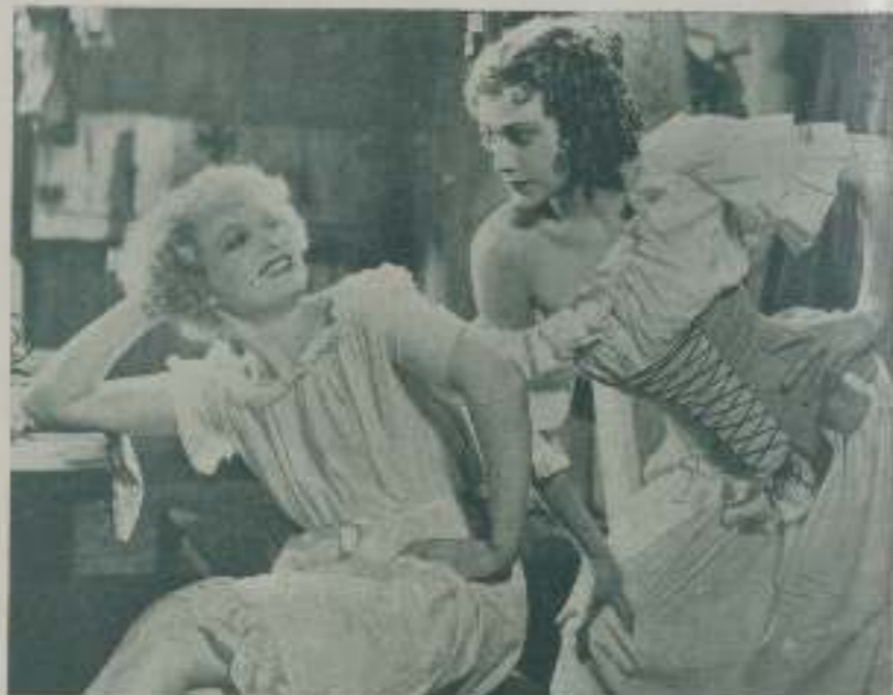
Una escena de "Nell Gwyn" gran belleza de la British distribuida por Mexor Film

Anna Neagle ha sido un verdadero descubrimiento. Mujer de exquisito temperamento, hecha a la lucha artística, incansable siempre, antes de llegar a ser la principal actriz de "Nell Gwyn" había recorrido todos los teatros de Londres cosechando laureles y recogido aplausos en los tablados de Broadway newyorkino. Y en cuanto a su elegancia innata, bien demostrada está en el transcurso de la obra, pues si al principio viste con sencillez los trajes no muy correctos del pueblo, más tarde la vemos destilar llena de desenvoltura ante nuestros ojos vistiendo las guayas galas de la corte y tocada la cabeza con un sombrero que mide muy cerca de dos metros de diámetro.