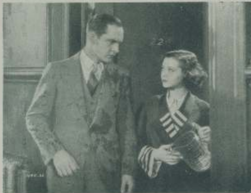
FREDRIC MARCH y SYLVIA SIDNEY, dos grandes artistas que expresan con perfección lo que sienten los personajes que interpretan.

con cuñetas. Poco después empezamos a formar una pandilla los muchachos de mi barrio y antes de que hubiera pasado un año ya existían varios clubs en las orillas del Lago Michigan. Para construir y mantener nuestros clubs teníamos que robar con mucha frecuencia y para mantener el prestigio de los miembros utilizamos ardidillos a pelear los miembros de un club contra los de otro, empleando para armas todo cuanto caía en nuestras desafiadas manos. Las autoridades del pueblo aseguraban que terminaríamos todos en un reformatorio, y en parte no se equivocaron, puesto que en efecto, más de la mitad de los muchachos que pertenecían a mi club acabaron por dar con sus huesos en reformatorios y cárceles. Solamente, gracias a la protección de mi familia y a los buenos consejos que continuamente me daba mi madre pude salvar mi pellejo de ir a la cárcel. De haber continuado por aquel camino nada de extraño hubiera tenido que yo acabase de miembro de las bandas de Al Capone o cualquiera de los otros gangster de renombre.