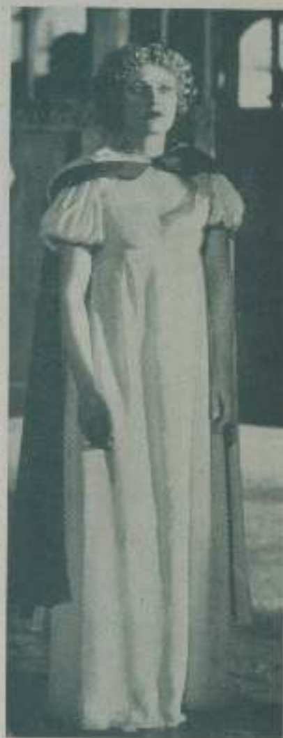
ANNA NEAGLE bellísima actriz que se revela como artista de excepcional belleza en "Nell Gwyn"

Herbert Wilcox que, como ya hemos dicho, es el creador de la obra, acredita su personalidad directiva,