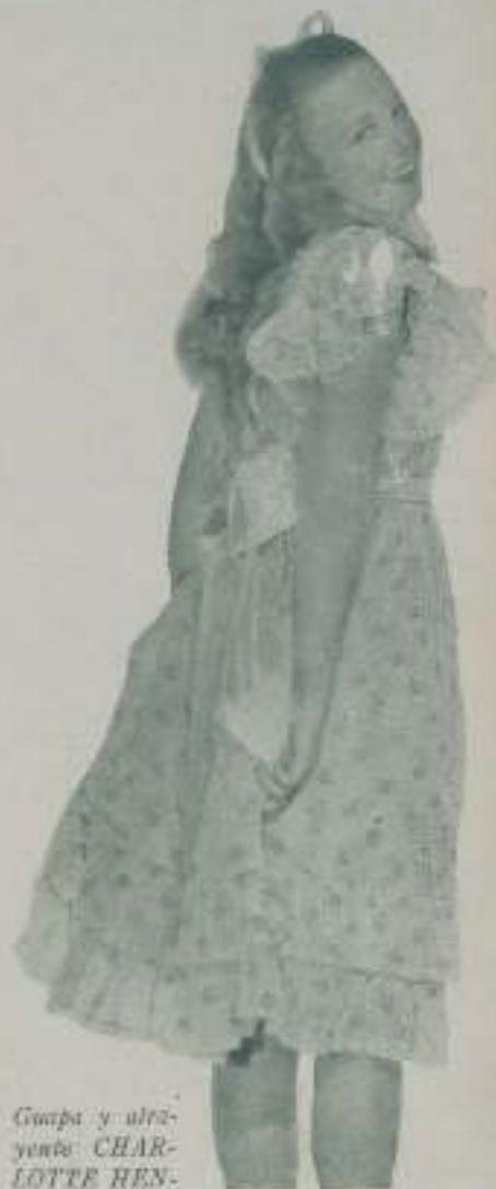
Guapa y ultrayoung CHARLOTTE HENRY será una de las mujeres mimadas del público