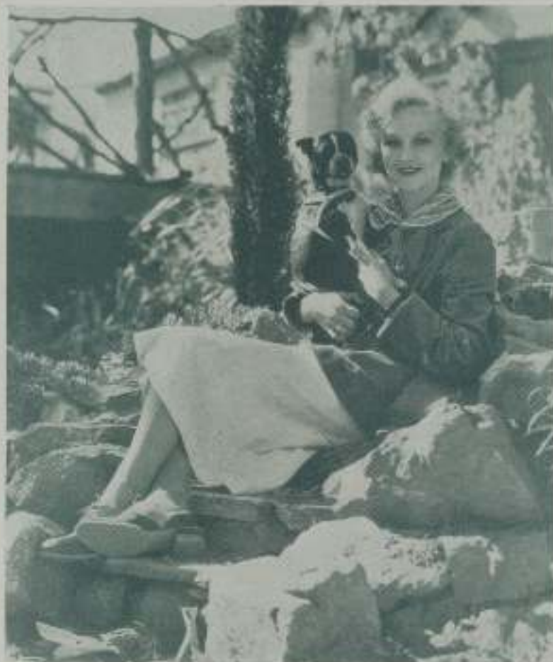
SHEILA TERRY, artista excelente que ha interpretado para la Warner Bros. "El espejo de la vida"

¿Sheila Terry? ¿Kay Clark? Dos personalidades bien distintas encerradas en una sola persona que ha sabido mantener el desdoblamiento de su personalidad con una gran perfección, digna de un Mr. Hyde. Sheila Terry es la muchachita bella y graciosa, artista de cuerpo y alma, que ruge ante el público del cinema. Kay Clark es la burguesita, hija de burgueses acomodados, que vive una vida totalmente disoluta de su otra yo, la actriz de la pantalla.