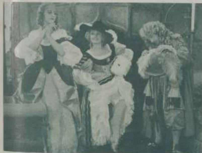
Una escena de "Nell Gwyn" en que las ilusiones de la protagonista le hacen sonreír, mientras se viste para aparecer en escena

En la memoria de los ingleses está aún el recuerdo de la que fue amante de Carlos II. Las obras que por su iniciativa fueron ejecutadas hablan al pueblo de su influencia y buenos sentimientos y el célebre cuadro que de ella pintara Sir Peter Lely da idea a sus contemporáneos de su exquisita belleza. Ahora le ha tocado el turno a la cinematografía para que el mundo conozca una de las más bellas páginas amorosas de la Corte de Carlos II y le ha tocado en suerte reenactuar a la favorita a Anna Neagle, quien con sincero fervor, con grandes deseos de que el histórico personaje no sufriera detrimento alguno ya en contenido, ya en contenido, ha realizado la interpretación más acertada que pudiera pedirse, dándose por entero al personaje que vive en ella nuevamente los momentos más emotivos de su historia.