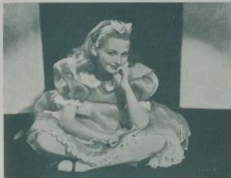
CHARLOTTE HENRY, criatura agradable que triunfa plenamente en "Alicia en el país de las maravillas"

Cuando nos acercamos a Charlotte Henry, después del éxito obtenido en su primera película, aun no se le había quitado el nerviosismo que la tuvo tramante durante varios días. El primer triunfo habíala emocionado y no tiene nada de extraño cuando según lector lo que es esta mujercita.