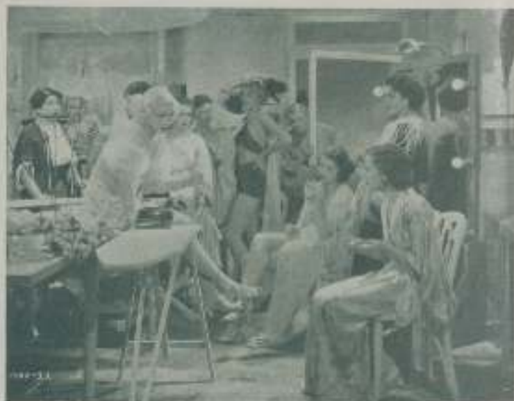
Conjunto de muchachas de admirable belleza que actúan en "El crimen de Vanities"

* Muy a pesar de ser día y de una fama de que le gusta extraordinariamente la bebida, King Vidor muestra su esnobismo con la admiración y el amor de dos bellotas que se pasan la vida