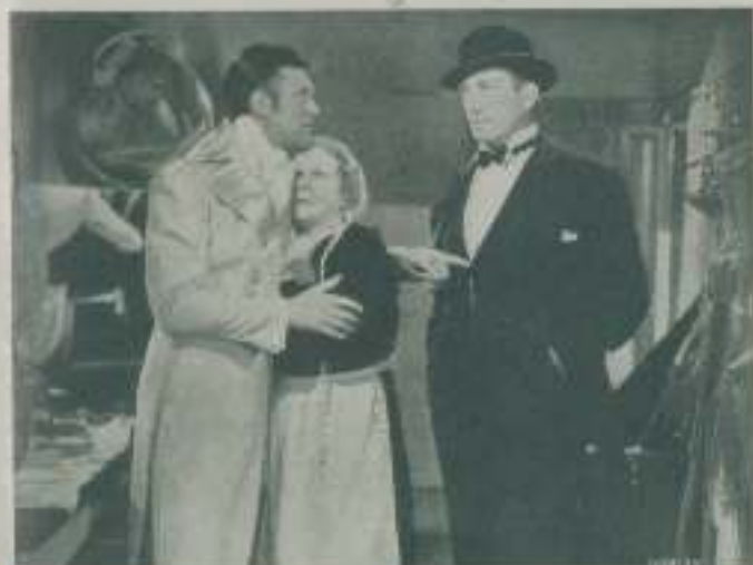
CARL BRISSON y VICTOR MC LAGLEN en "El crimen del Vanities"

Carole Lombard se gusta tanto con el cabello oscuro que alinea una peluca negra, pero no creemos que le dure mucho la "locura" puesto que William Powell le ha dicho que a él no le gusta en lo más mínimo.