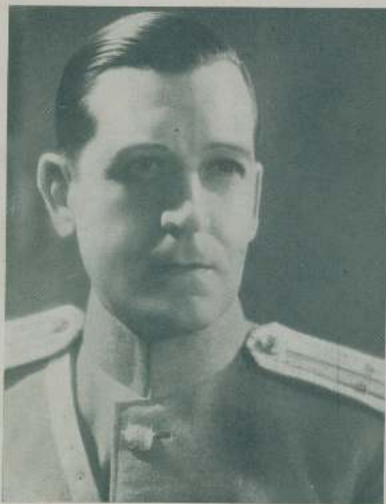
ALBERT PREJEAN, el gran actor francés, protagonista de "Volga en llamas" que será estrenada próximamente en Barcelona

Es por ello, por lo que sigo a Albert Prejean. Lleva aparejadas consigo cualidades excelentes, tales como temperamento, arrogancia y simpatía, y no es de extrañar que siendo mujer, me sea en la necesidad de admirar a ese hombre que sabe colocarse en los diversos papeles que interpreta, lleno de veracidad y precisión.