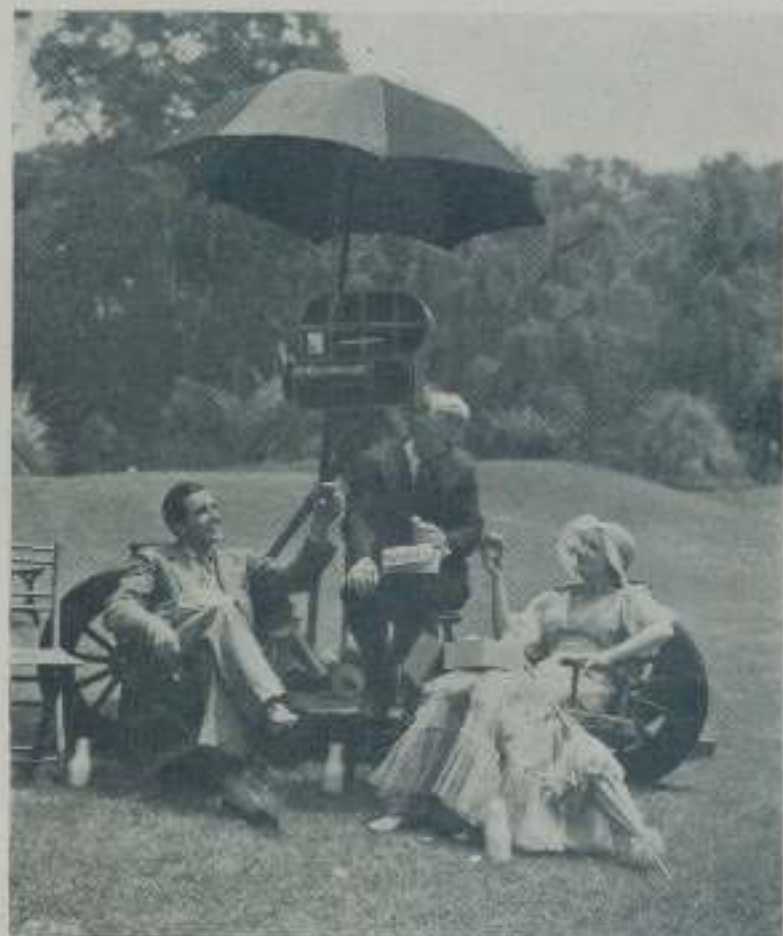
JOHN BOLES y JANE WYAT de la Universal, en un descanso de filmación

✦ No nos extraña la actitud de Clark Gable. Nunca lo habíamos visto tan contento y feliz, y ello es debido a que la Metro ha renovado su contrato por diez años, debiéndole su sueldo antiguo al tal hacer.