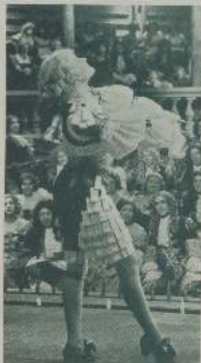
Vendedora de naranjas primera, actriz después, NELL GWYN, no tardó en convertirse en la favorita de Carlos II.

La película histórica, viene siendo en estos últimos tiempos el caballo de batalla de las grandes editoras cinematográficas y es Inglaterra, precisamente la que más se ha aficionado a tal clase de films — que dicho en honor a la verdad — los realiza con toda amor y gran respeto al pasado. Nell Gwyn, la amante de Carlos II, ha sido la última producción de la British, producción que además de estar valorada por la propiedad del ambiente, contiene un descubrimiento interpretativo que se recordará con satisfacción y que es Anna Neagle, joven actriz, que procedente de las tablas ha pasado al cinematógrafo, para dar vida a la pantalla a Nell Gwyn, la vendedora de naranjas que llegó a ser adúltera, admirada y envidiada en la corte de Carlos II al haberle sido su favorita. Herbert Wilcox el director de la película, ha sido el que ha descubierto, cinematográficamente, a la genial artista que con una sensibilidad exquisita, con una gran noción de la época en que transcurre la acción, ha sabido adaptarse al personaje de la insidiosa vendedora de naranjas, significándole en su trabajo histórico con admirable propiedad,