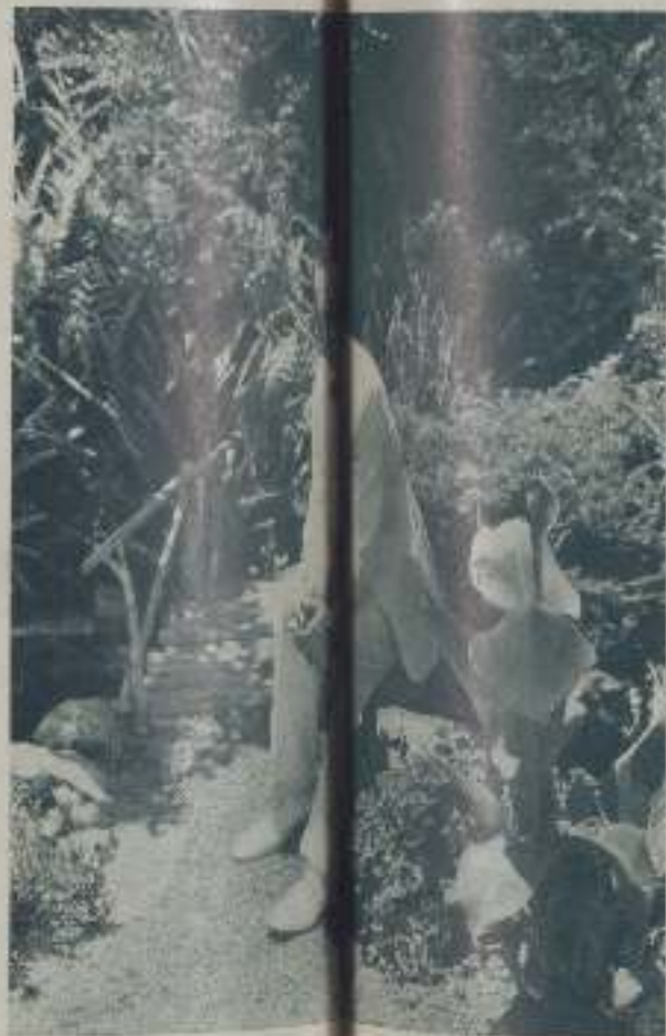
MAURICE CHEVALIER protagonista de "La Viuda Alegre" de la

Además, en eso no creo que haya nadie que difiera, es su simpatía, esa actitud desbordante que capta al oírle escuchas, la que le ha valido la popularidad de que goza. Chevalier es único en su trabajo, nadie le ha imitado ni es fácil que pueda imitarle