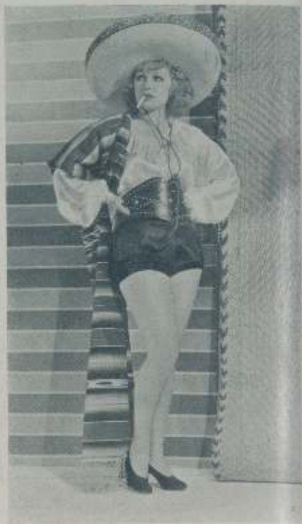
FRANCES DRAKE , cuya característica principal es, a nuestro juicio, la perfección de sus líneas

Y a semejanza de estos favoritos, muchos son los que deben gran parte de su fama a un distintivo personal que los distingue y separa de los demás favoritos de la pantalla.