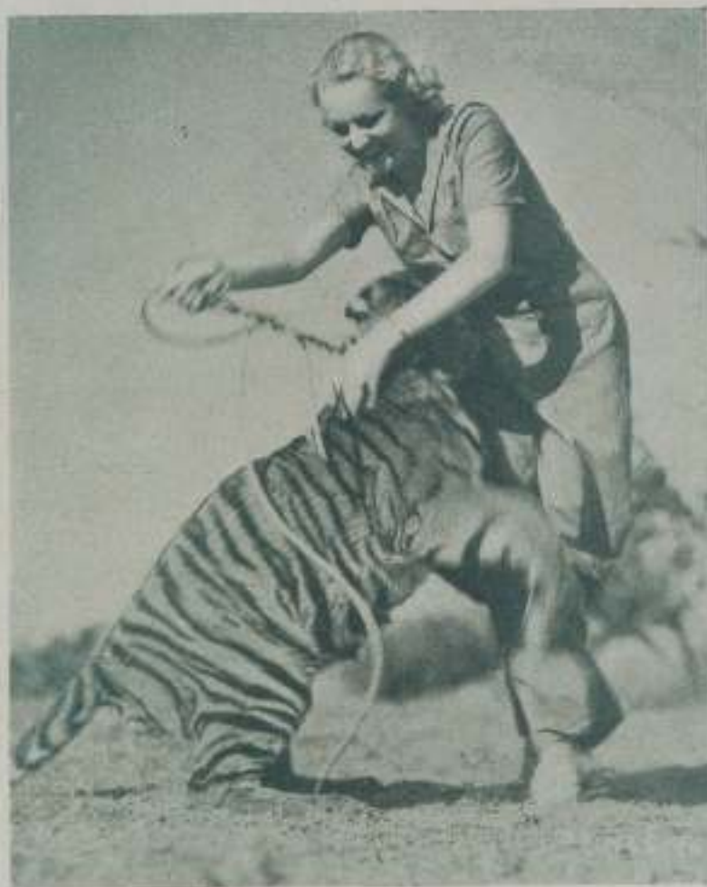
BETTY GRABLE de la Radio Films se atreve con las fieras y asegura que es preferible tratar con ellas que con los hombres.

Y en cambio que manso y juguetero estaba con ella. ¡Tendrán razón, bástame tales animales! Lo ignora es lo cierto. Lo único que sí es que en brazos de una mujer bonita hasta las fieras son mansas.