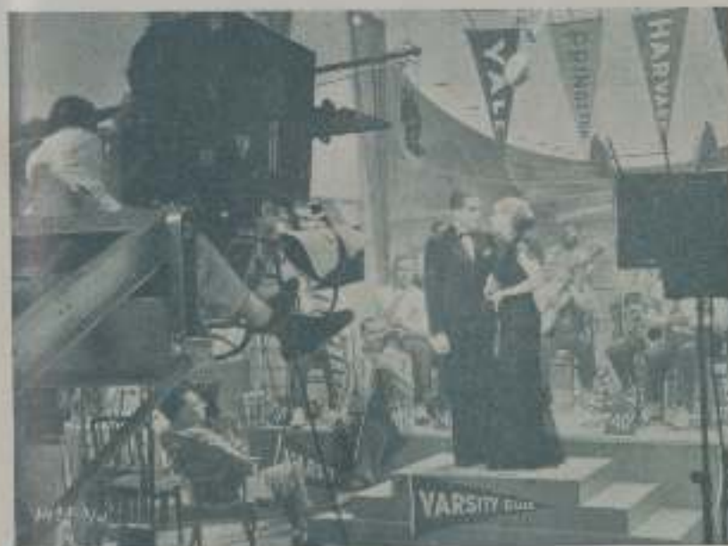
Una escena de "Música muchachos" de la Paramount

puesta a sacrificar este placer aunque le cueste su carrera cinematográfica.