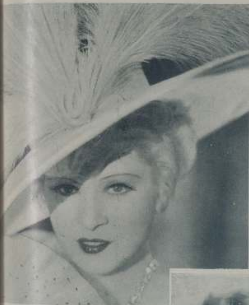
MAE WEST continúa siendo la mujer caparrosa que no pierde ocasión de divertirse

haciendo compras en uno de los grandes almacenes de Los Angeles y John llevaba siete u ocho paquetes' bajo los brazos.