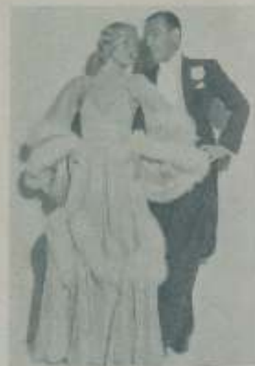
GEORGE RAFT y CAROLE LOMBARD en "Bolero" de Paramount

* Hay rumores de que John Barrymore y Dolores Costello se separan para divorciarse, pero nosotros nos resistimos a creerlo hasta que no en un hecho.