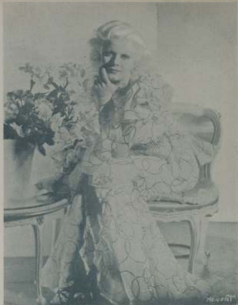
...estrellas de su carrera artística que ha sido una de las máximas de Hollywood

Pocas personas se detienen a pensar lo que las estrellas tenemos que gastar en impuestos. Y además los mil gastos ocultos; la comisión reglamentaria de mi agente, el sueldo de mi manager, de mi secretaria, la cuenta mensual