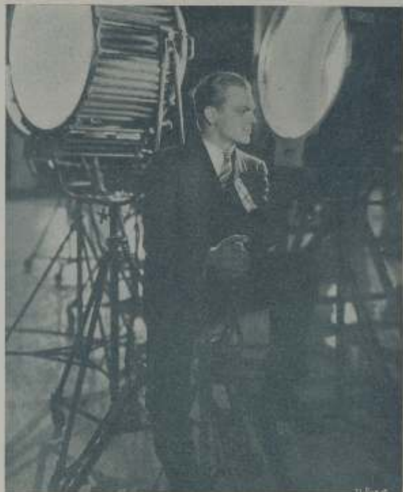
JAMES CAGNEY, el astro de la Warner contempla a sus víctimas oculto en la penumbra que dejan tras sí los potentes reflectores

Todos rieron, incluso el propio Cagney que encontró divertidísimo que si sus hermanas escogieran de antemano las flores que, en desagravio, les haría que mandar después de la comedia estrenada.