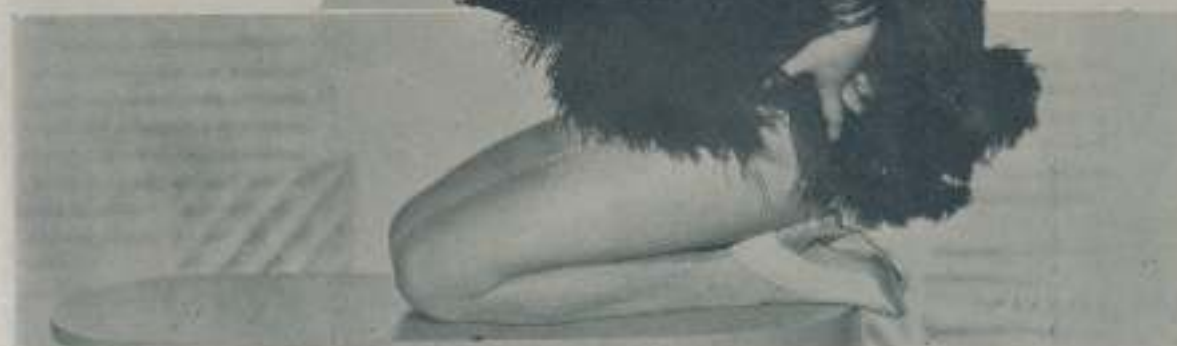
GINGER ROGERS, de esbeltas líneas y belleza espléndida, temerosa en su expresión de que el ligero vestido pueda des- cubrir sus atractivos

Para sus miradas admiradas ojos una mujer alta, esbelta, magnífica, que lleva en los suyos reflejados un sin fin de miradas apenas cubierta su belleza con unas ligeras plumas que al ritmo de los movimientos trata de elevarse hacia el cielo. Es Ginger Rogers, una espléndida mujer de admirables líneas que sabe el valor que un cuerpo bonito tiene ante sus admiradores.