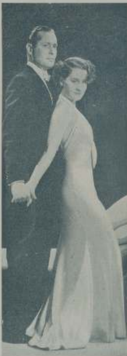
NORMA SHEARER y ROBERT MONTGOMERY en "Desires" de M. G. M.

* Ray Wray ha embarcado con rumbo a Inglaterra. Hará un film para la British Gaumont antes de regresar a Estados Unidos.