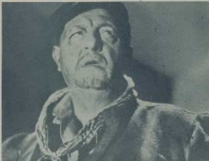
HENRY BAUG protagonista de "Los miserables" de Eclair, en la interpretación de Jean Valjean

Claro que hay muchos empresarios de películas por exhibir de calidad muy dudable pero hasta ahora no podemos quejarnos. Nos quejaremos cuando los empresarios no sepan defender sus intereses y el prestigio de su local mostrando películas de valor nulo. Hasta ahora, hay unos cuantos que no cesan en su propósito de exhibir ante sus clientela programas dobles que tienen la virtud de llenar el local y mientras sigan así que no se preocupen de si la gente acude o no a los salones de estreno. Son éstos los que tienen la obligación de no desacreditarse dándole al público superproducciones que no pasan de ser malas comedias. Cuando la obra es buena ya acude la gente. Lo que sucede es que tras una buena llegan varias malas y nadie quiere invertir el dinero en lo que está seguro ha de aburrirle.