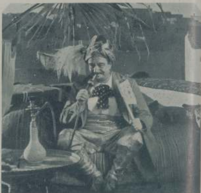
Una escena de "Tartarin de Tarascon" interpretada por el gran Rainaldy que se exhibe con gran éxito en el Tivoli, distribuida por Cinesa

Ahora bien, ¿la gente no acude a los cines... de estreno? ¿Por qué? ¿Quién lo sabe! Quizás porque después parece ver las mismas cintas a precio mucho más barato; quizás porque se estrenan muchas películas semanalmente que carecen de méritos para pagarlas caras. Pero eso no significa que la gente no vaya al cine, pues se está dando el ca-