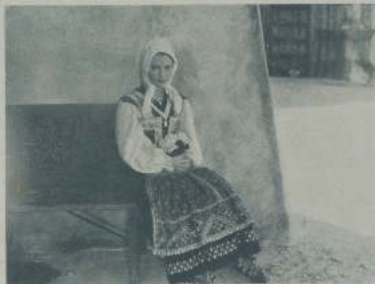
DOROTHEA WIECK en una escena de "Canción de amor" de la Paramount

No hace mucho lo encontró del brazo de su actual esposa, la ex-estrella de Cine Dolores Costello, y no le visto hombre con expresión de mayor felicidad que la suya. Estaba