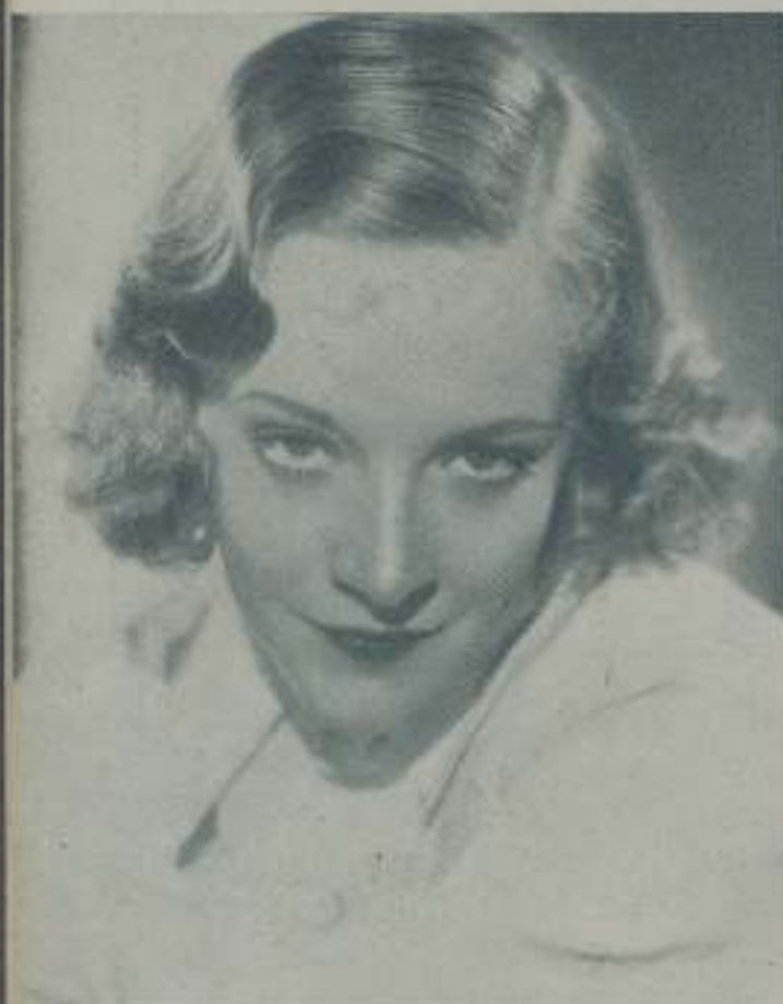
ROSEMARY AMES, protagonista de "Mujeres peligrosas" de la Fox, en donde se revela como actriz de fino temperamento