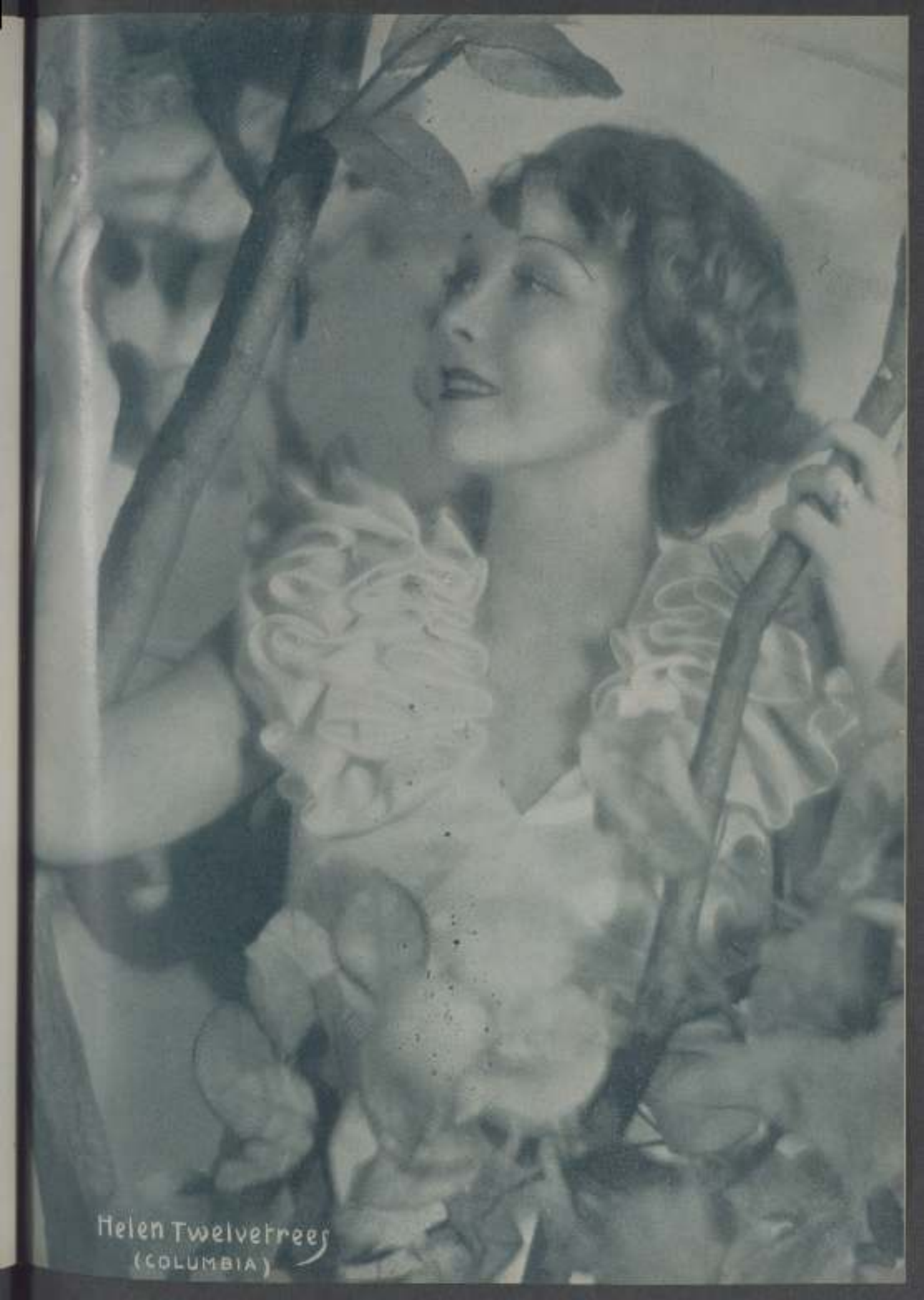
Helen Twelvetrees (COLUMBIA)