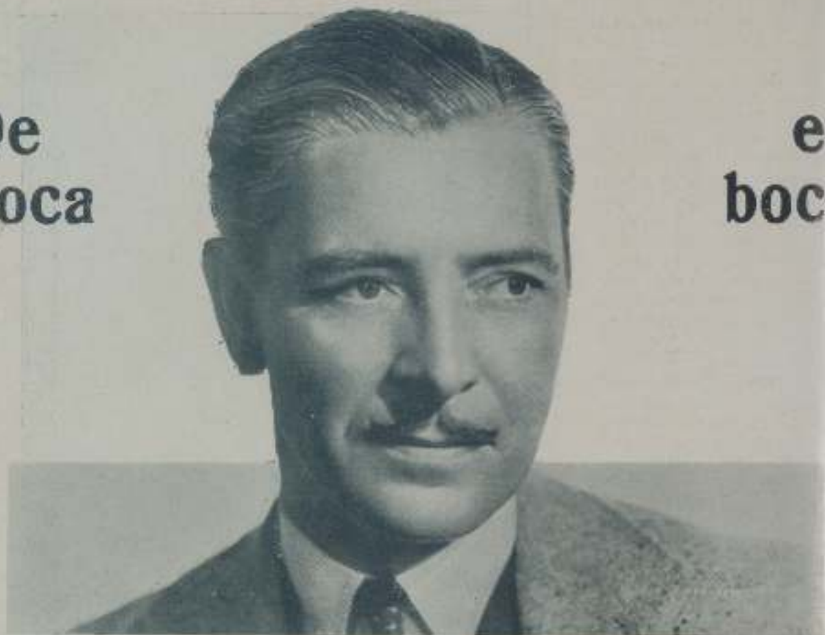
RONALD COLMAN protagonista de "La última aventura de Drummond" de Artistas Asociados

Lionel Barrymore acaba de celebrar su sesentaquinta aniversario de actuación en la película "La Isla del Tesoro". Este aplaudido actor ha trabajado en más de 200 obras entre teatrales y películas. Su primer triunfo fue desempeñando un papel en "The Computer" en 1906. Ese mismo año hizo su debut en el cine en la película de D. W. Griffith "Amigos", primer drama filmado.