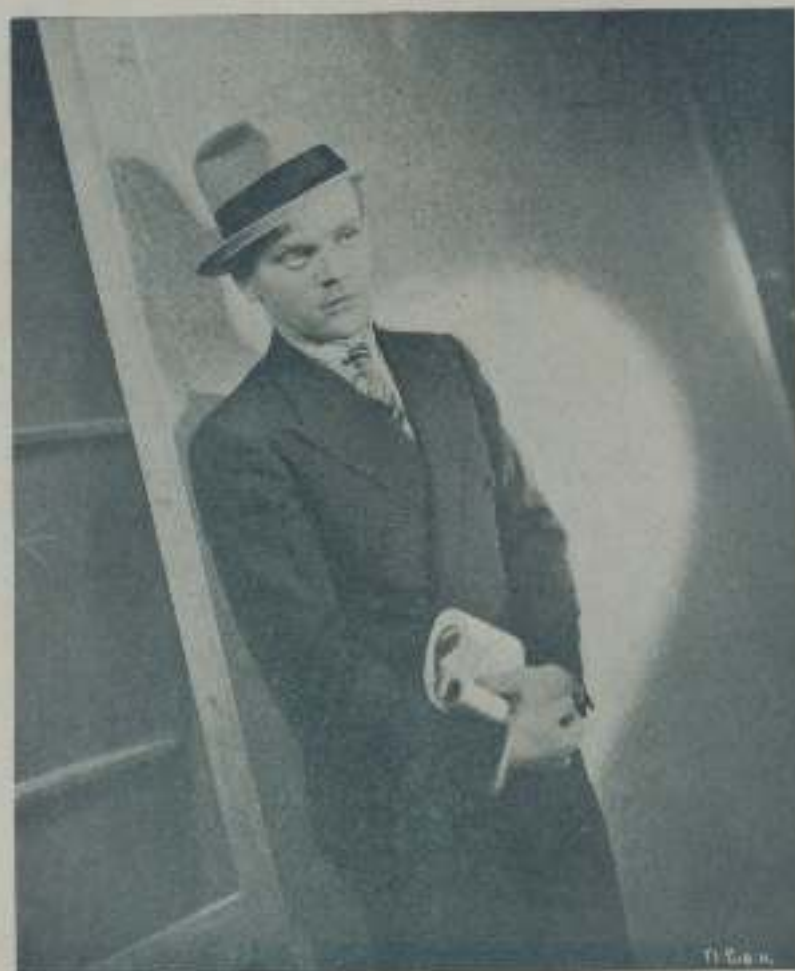
JAMES CAGNEY el prototipo americano cien por cien, dinámico y juerguista

James Cagney no quisiera encontrarse en el caso de insultar y maltratar a una mujer. Es una acción que nunca ha comprendido y que aborrece con toda su alma. No sabe como puede en el mundo haber hombre capaz de hacer daño a esos pedacitos de carne encantadora que subyuga y atrae ni siquiera se explica que pueda uno maltratar a su propia suegra por fea y mala que sea, ya que, por el solo hecho de ser mujer, le merece respeto y consideración sino amor, como suele sentir por las heroínas de sus producciones que acostumbran a ser todas deliciosas.