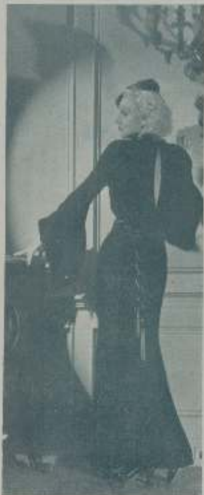
El gusto exquisito de que JEAN HARLOW hace gala, se afirma en sus vestidas, todas ellas de un corte agradable que se ajusta con precisión a sus contornos proporcionados.

No hago esto por falta de "temperamento artístico" o por falta de carácter, como algunos piensan, sino por-