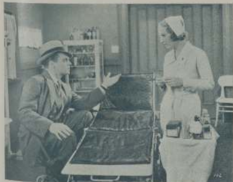
JAMES CAGNEY y MADGE EVANS en una escena de "Por el mal camino" de la Warner