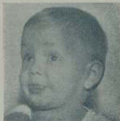
BABY LE ROY

con rumbo a Francia. Estará en Europa hasta primeros de febrero. El asegura que el viaje es de descanso y placer, pero hay quien dice que el joven Laemmle aprovechará su larga estancia en Europa en buscar nuevas estrellas y argumentos para la temporada que viene.