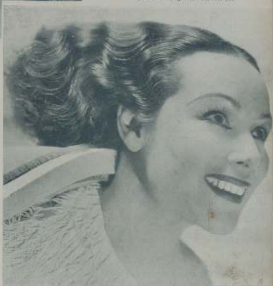
DOLORS DEL RIO, una de las mujeres más festejadas por la popularidad que el transcurso del tiempo le ha proporcionado grata enseñanza