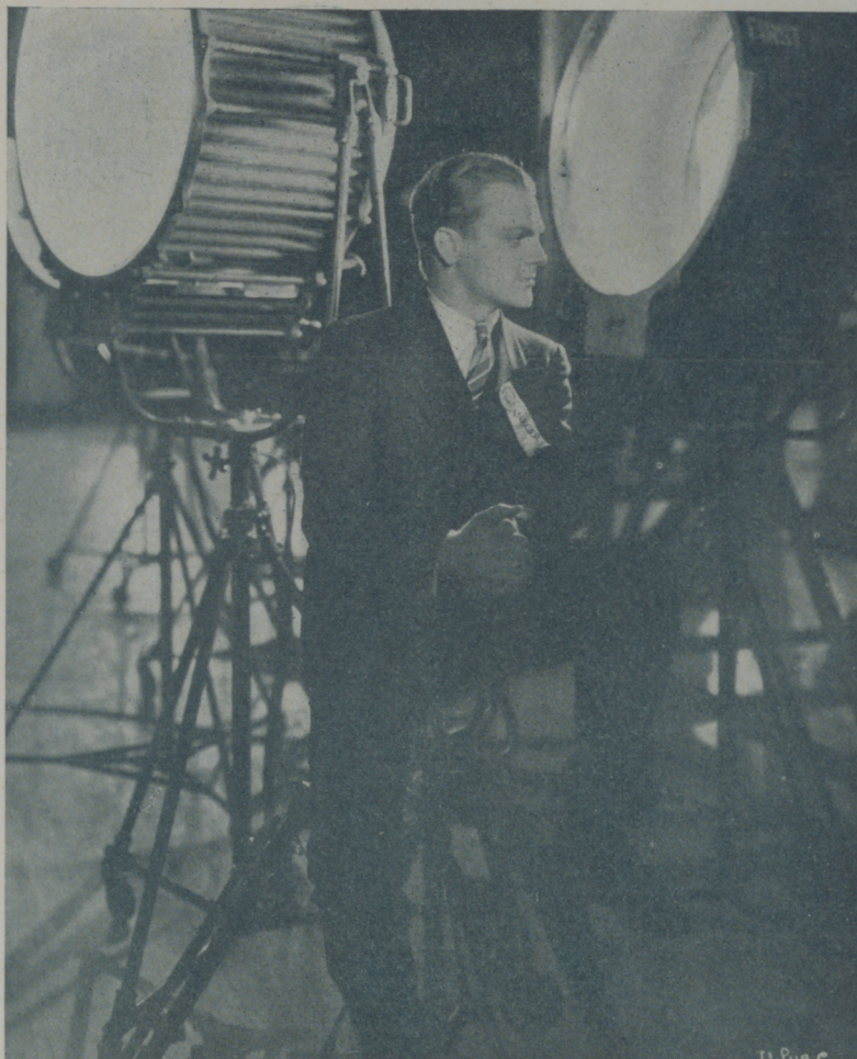
JAMES CAGNEY, el astro de la Warner contempla a sus víctimas oculto en la penumbra que dejan tras sí los potentes reflectores

Todos rieron, incluso el propio Cagney que encontró divertidísimo que ya sus heroínas escogieran de antemano las flores que, en desagravio, les tendría que mandar después de la conocida escenita.