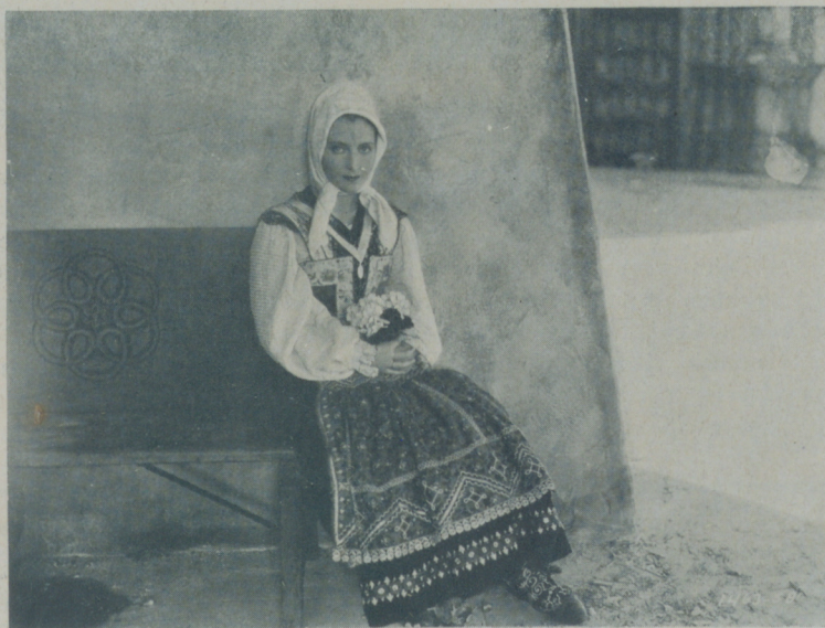
DOROTHEA WIECK en una escena de "Canción de cuna" de la Paramount

No hace mucho lo encontré del brazo de su actual esposa, la ex-estrella de Cine Dolores Costello, y no he visto hombre con expresión de mayor felicidad que la suya. Estaban