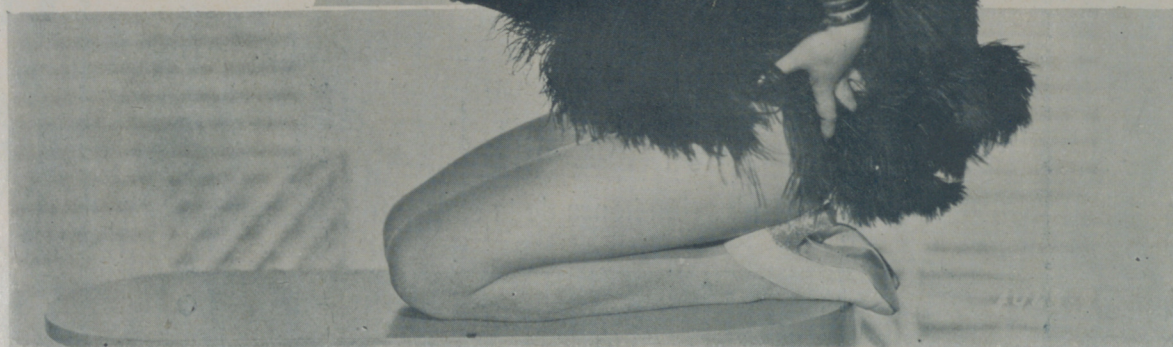
GINGER ROGERS, de esbeltas líneas y belleza esplendente, temerosa en su expresión de que el ligero vestido pueda descubrirnos todos sus atractivos

Pasa ante nuestros admirados ojos una mujer alta, esbelta, magnífica, que lleva en los suyos reflejados un sin fin de picardías apenas cubierta su belleza con unas ligeras plumas que al más suave de los movimientos trata de elevarse hacia el cielo. Es Ginger Rogers, una espléndida mujer de admirables líneas que sabe el valor que un cuerpo bonito tiene ante sus admiradores.