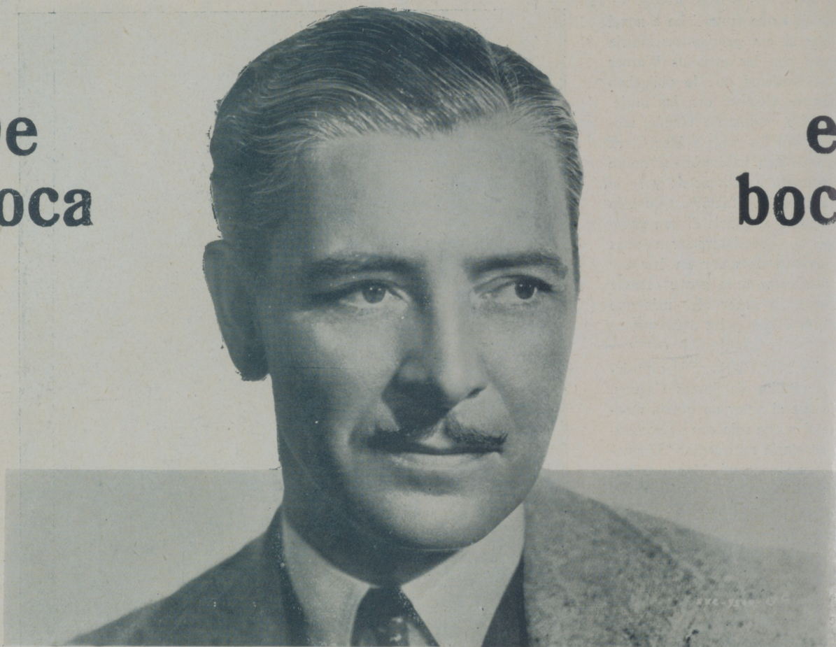
RONALD COLMAN protagonista de "La última aventura de Drummond" de Artistas Asociados

Lionel Barrymore acaba de celebrar su vigésimoquinto aniversario de actuación en la película "La Isla del Tesoro". Este aplaudido actor ha trabajado en más de 260 obras entre teatrales y películas. Su primer triunfo fue desempeñando un papel en "The Copperhead" en 1909. Ese mismo año hizo su debut en el cine en la película de D. W. Griffith "Amigos", primer drama filmado.