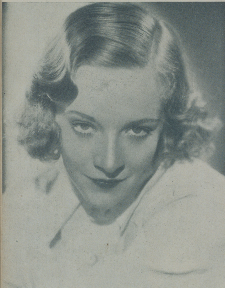
ROSEMARY AMES, protagonista de "Mujeres peligrosas" de la Fox, en donde se revela como actriz de fino temperamento