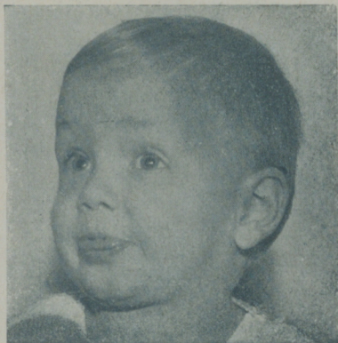
BABY LE ROY

con rumbo a Francia. Estará en Europa hasta primeros de febrero. El asegura que el viaje es de descanso y placer, pero hay quien dice que el joven Laemmle aprovechará su larga estancia en Europa en buscar nuevas estrellas y argumentos para la temporada que viene.