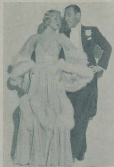
GEORGE RAFT y CAROLE LOMBARD en "Bolero" de Paramount

¶ Hay rumores de que John Barrymore y Dolores Costello se separan para divorciarse, pero nosotros nos resistimos a creerlo hasta que no sea un hecho.