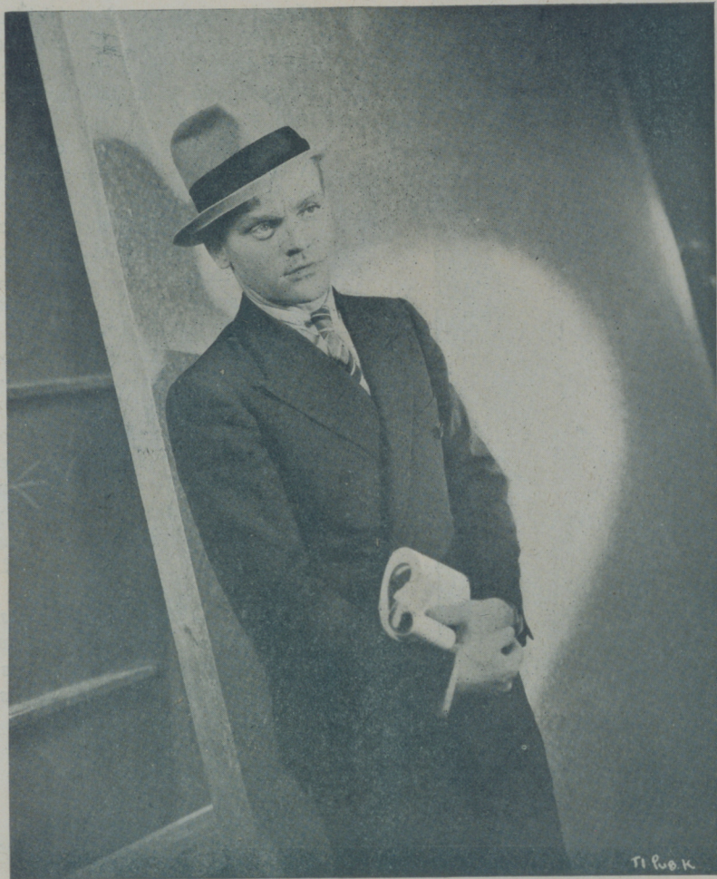
JAMES CAGNEY el prototipo americano cien por cien, dinámico y juerguista

James Cagney no quisiera encontrarse en el caso de insultar y maltratar a una mujer. Es una acción que nunca ha comprendido y que abomina con toda su alma. No sabe como puede en el mundo haber hombre capaz de hacer daño a esos pedacitos de carne encantadora que subyuga y atrae ni siquiera se explica que pueda uno maltratar a su propia suegra por fea y mala que sea, ya que, por el olo hecho de ser mujer, le merece respeto y consideración sino amor, como suele sentir por las heroínas de sus producciones que acostumbran a ser todas delicias.