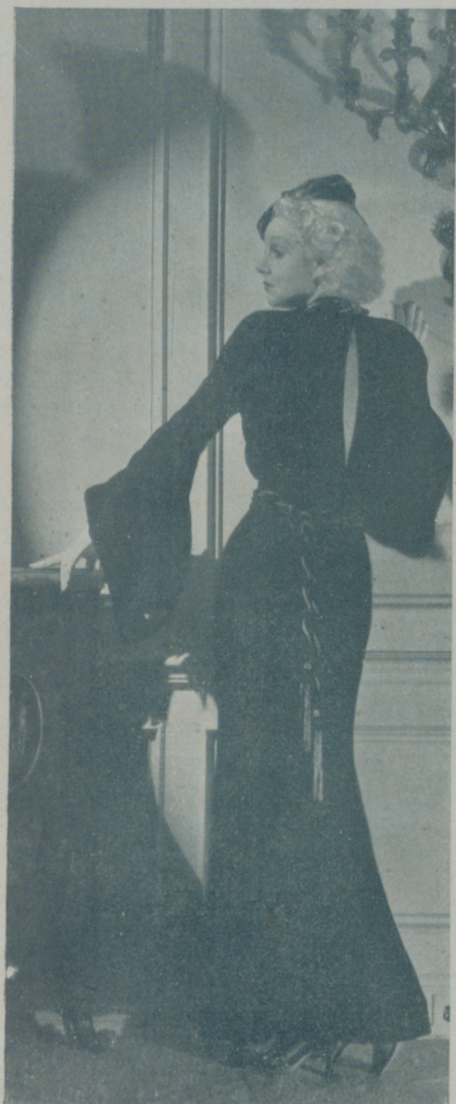
El gusto exquisito de que JEAN HARLOW hace gala, se afirma en sus vestidos, todos ellos de un corte agradable que se ajusta con precisión a sus contornos proporcionados

No hago esto por falta de "temperamento artístico" o por falta de carácter, como algunos piensan, sino por