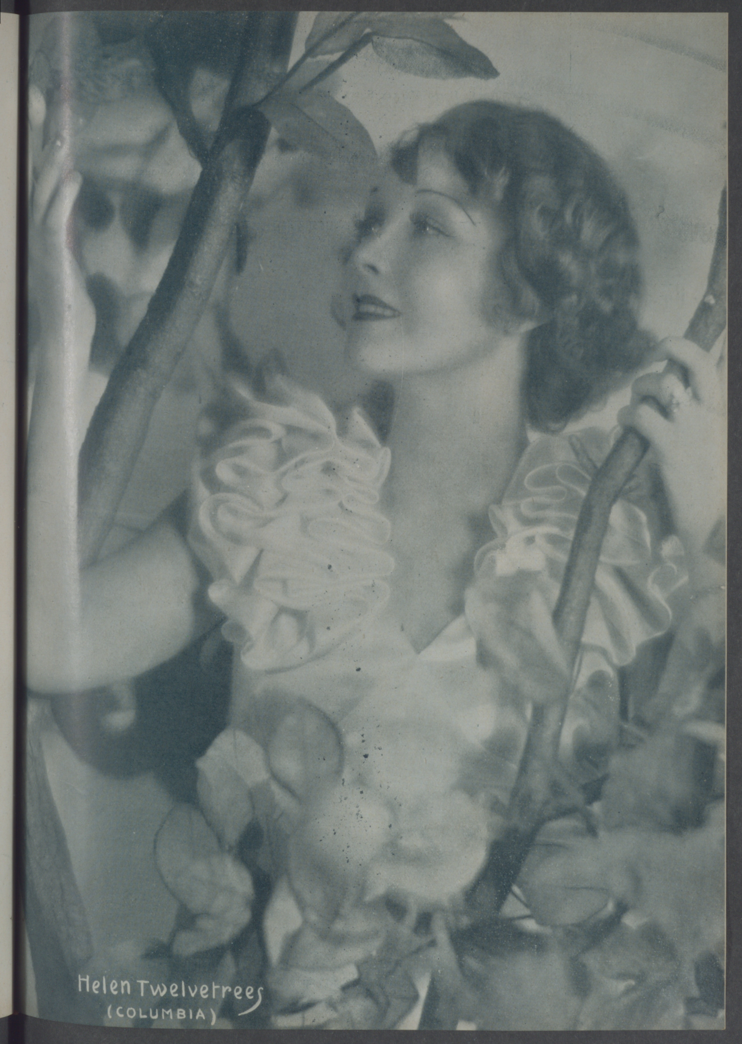
Helen Twelvetrees (COLUMBIA)