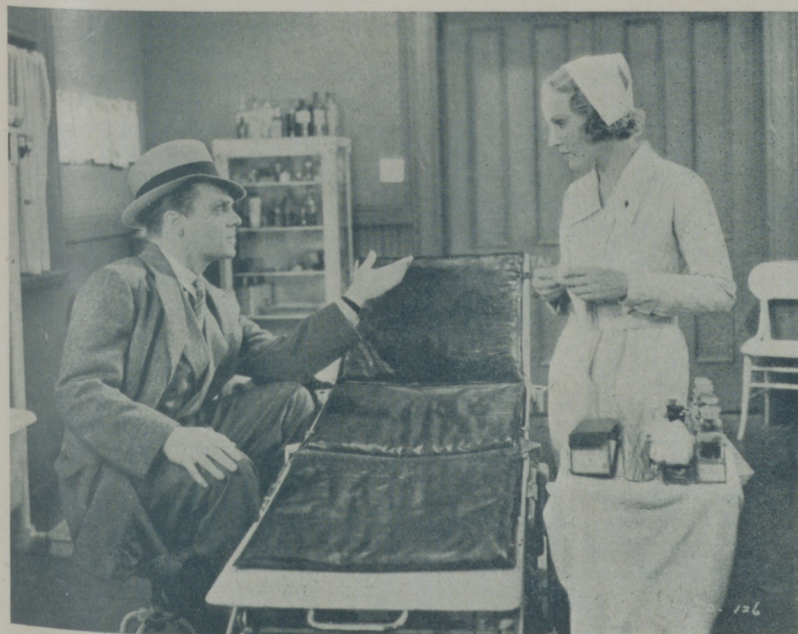
JAMES CAGNEY y MADGE EVANS en una escena de "Por el mal camino" de la Warner

Así pudo rodarse "El guapo" y así pudo James Cagney representar su papel dignamente, sin sentirse humillado, pues estaba seguro del consentimiento de su partenaire, y estaba seguro también de que con un puñado de claveles rojos desagraviaría a la linda Mae de la que gusta James Cagney quizás en demasía.