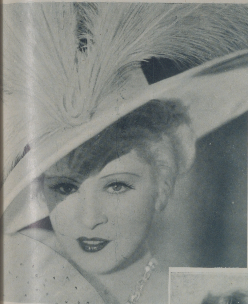
MAE WEST continúa siendo la mujer exquisita que no pierde ocasión de divertirse

haciendo compras en uno de los grandes almacenes de Los Angeles y John llevaba siete u ocho paquetes' bajo los brazos.