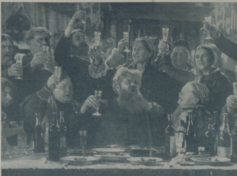
Una escena de la película "Tasarova", que distribuye Ufilms

Si miramos con ojos tolerantes a los demás seres que pueblan el universo, nuestra existencia sería mucho más fe-