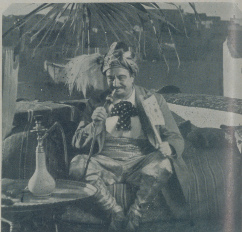
Una escena de "Tartarin de Tarascón" interpretada por el gran Raimu que se exhibe con gran éxito en el Tívoli, distribuida por Cineaes

Ahora bien, la gente no acude a los cines... de estreno. ¿Por qué? ¡Quién lo sabe! Quizás porque después puede ver las mismas cintas a precio mucho más barato; quizás porque se estrenan muchas películas semanalmente que carecen de méritos para pagarlas caras. Pero eso no significa que la gente no vaya al cine, pues se está dando el ca-