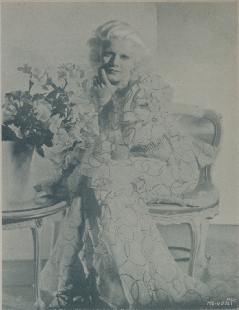
... momentos de su carrera artística que ha sido una de las más rápidas de Hollywood

Pocas personas se detienen a pensar lo que las estrellas tenemos que gastar en impuestos. Y además los mil gastos sueltos; la comisión reglamentaria de mi agente, el sueldo de mi manager, de mi secretaria, la cuenta mensual