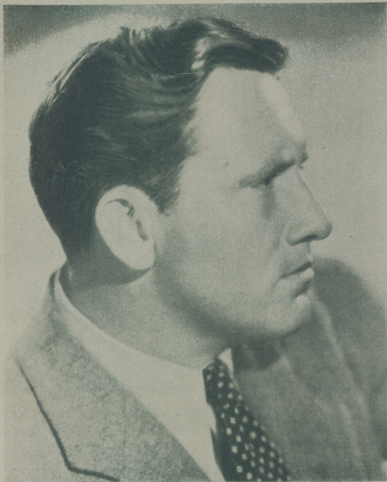
SPENCER TRACY, el gran actor de la Fox, de adusto semblante y temperamento exquisito

El gran actor de la Fox es un hombre extraordinariamente inquieto. Se multiplica en sus actividades, estudia sin descanso, se dedica por entero al ejercicio que vigoriza sus músculos y hace todo lo posible por hallarse en plena forma, en los momentos en que ha de plasmar un personaje.