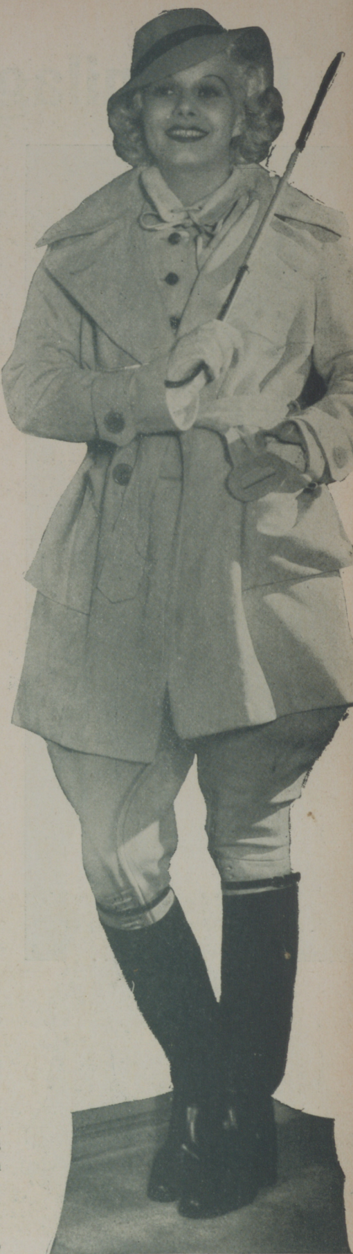
JEAN HARLOW practica el sport y de sus más favorecidos en invierno es la equitación

Tener siempre en cuenta de que vale más tener el cabello lacio pero bonito que un platino descuidado y sin lustre, que es la cosa más fea que una mujer que se tenga por limpia puede lucir.