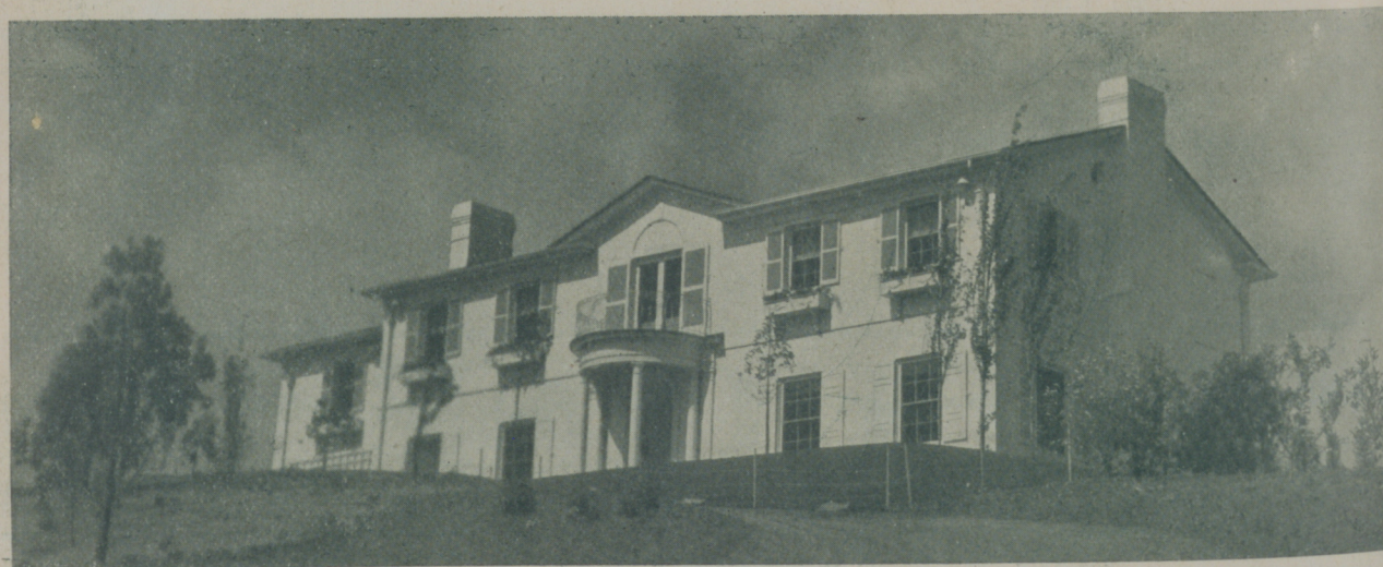
La casa de JEAN HARLOW, en la cima d una colina de Beverly Hills, donde la ascensión es costosa, pero el sol y el aire es magnífico

No obstante, no puedo negar que el hombre, muy a pesar nuestro, se conserva mucho mejor que nosotras, por no tener el desgaste mensual a que nosotras estamos condenadas por la naturaleza, lo que os puede dar una idea de lo mucho que se conservaría