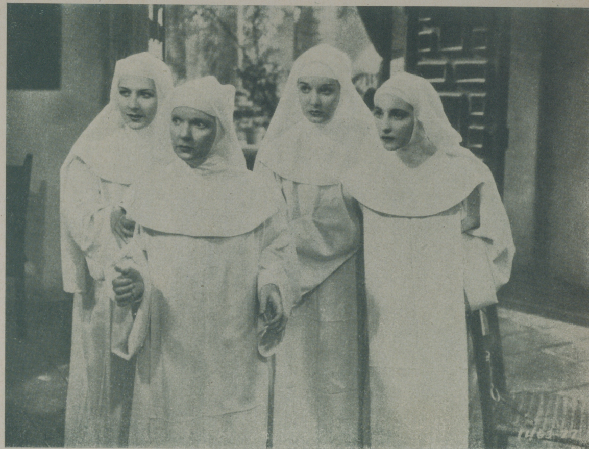
Escena interesante de "Canción de Cuna" donde las monjitas parecen asombradas por un hecho mundanal que les sorprende