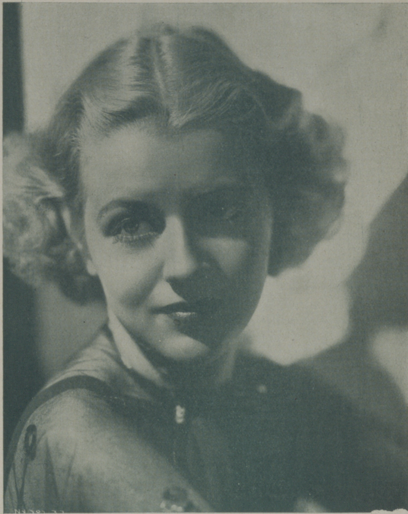
BETTY FURNES, prestigiosa actriz de la Radio que opina que el beso es la caricia que más apasiona a las mujeres