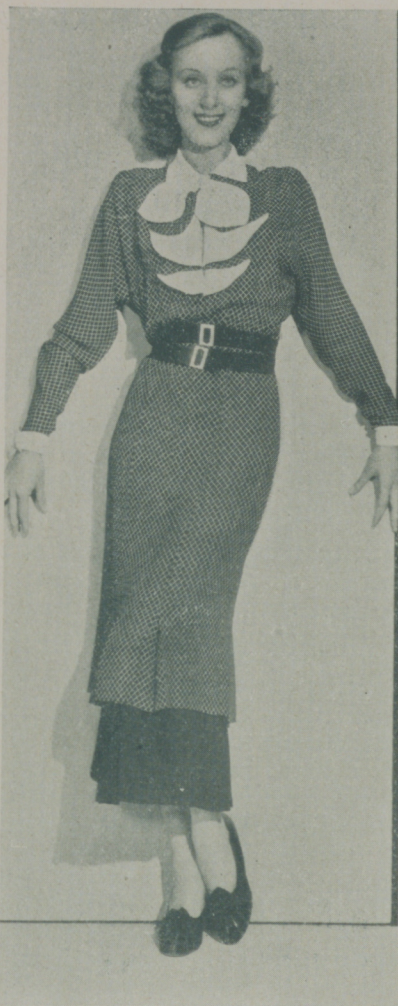
Las líneas elegantes y precisas de ANN DVORACK son uno de los atractivos más interesantes de la gentil artista de la Warner

haber renunciado a ellas. Asegura que sigue pensando lo mismo acerca del matrimonio y de la vida doméstica. Sí,