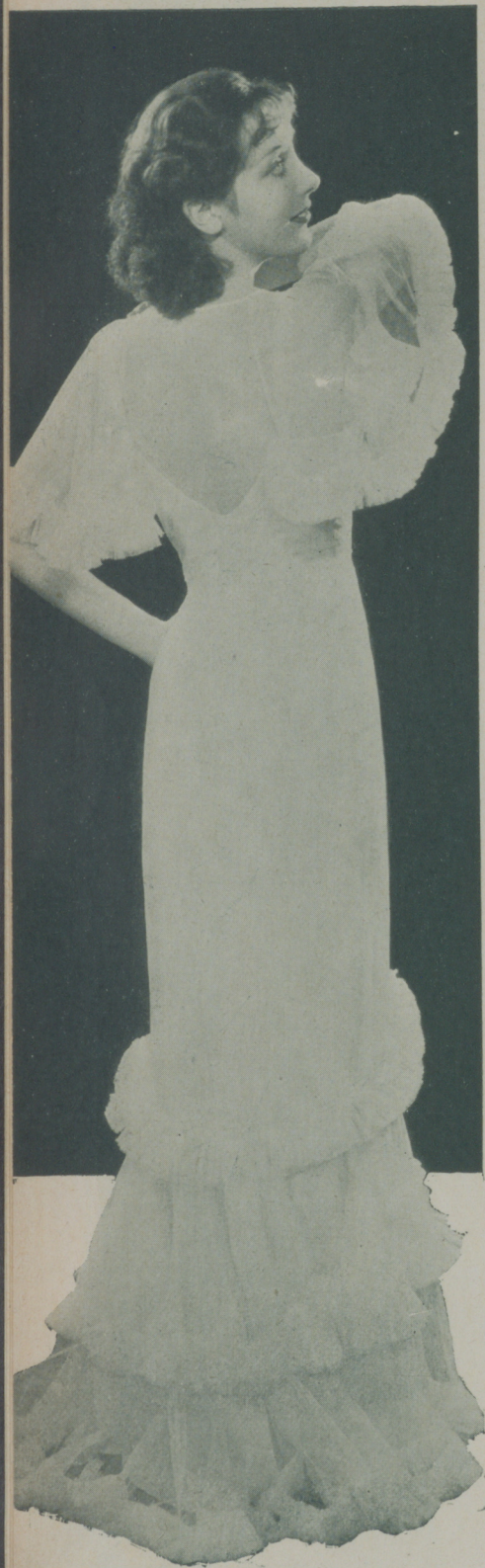
ANN DVORACK, artista de la Warner Bros, de sugestiva belleza y elegancia sorprendente

Pero la mano del destino trabaja rápida y silenciosamente conduciendo la vida de los hombres hacia derrotos jamás sospechados. Poco tiempo después Leslie Fenton fué elegido para formar parte del cuadro artístico de "Hay mujeres así", una de las creaciones más geniales de Ann Dvorack. Hubo un idilio silencioso agazapado a la sombra de la pantalla en el transcurso del rodaje de este film y, al terminarlo, Ana y Les partieron para Yuma y allí se casaron en la