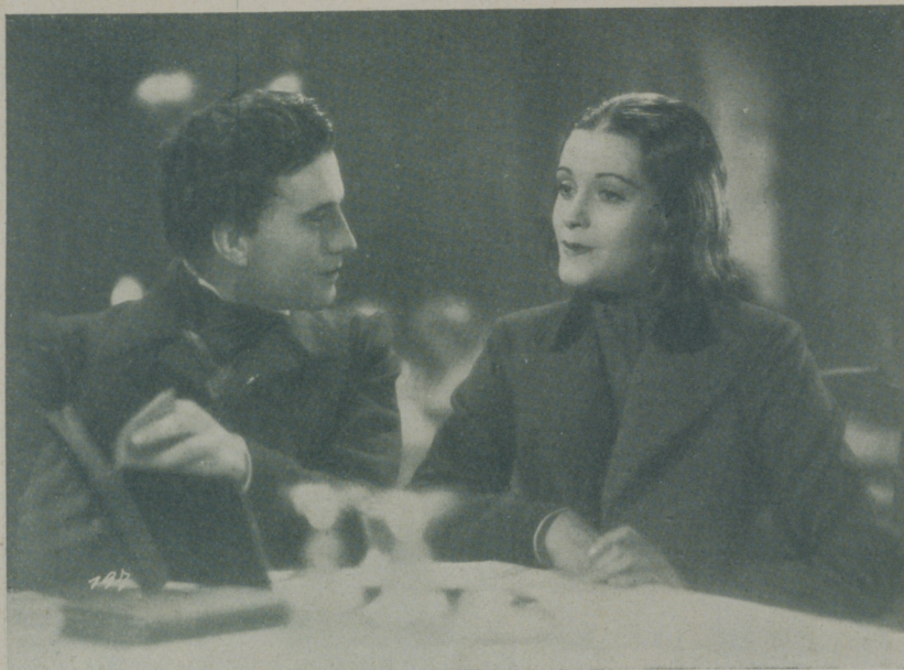
LIEBENEINER y SBILLE SCHUNSTZ en una escena de "El último vals de Chopin" interpretando los personajes del gran músico y la insigne escritora respectivamente

Chopin, George Sand, dos nombres prestigiosos unieron sus vidas llevando a la inmortalidad sus amores célebres, dos figuras dentro de la música y la literatura que nos hablan de excelsas exquisiteces.