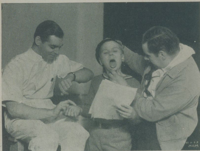
Aquí tenemos a tres favoritos de la fama: JACKIE COOPER que la conoce desde niño, el Director BOLES LAVSKY, que hoy está entre los afortunados y CLARK GABLE que ya olvidó sus penosos principios

La vida de Hollywood es tan arrolladora, tan terriblemente fascinante que sus habitantes con frecuencia se ven precisados a sufrir cambios de personalidad verdaderamente asombrosos. Claro está que si nos ponemos a pensar por un minuto, comprenderíamos en seguida que es del todo imposible arrebatar a un muchacho o a una muchacha — y las grandes estrellas de hoy eran casi todas de temprana edad cuando llegaron a Hollywood por vez primera — de su vida ordinaria y corriente y obsequiarle con las cosas amables y envidiables de la vida ordinaria y corriente y obsequiarle con las cosas amables y envidiables de la vida sin que esto afecte su carácter en absoluto.