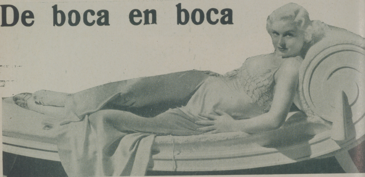
TOBY WING, una rubia encantadora de la Paramount, con diez y siete primaveras verdaderamente floridas

Ha pasado desapercibida durante su estancia de tres meses en París, la encantadora Constance Cummings. Ignoramos si tal hecho habrá gustado o disgustado a la artista.