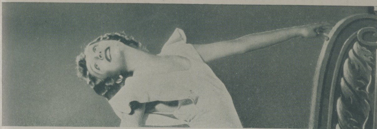
ANN DVORACK acostumbra a retratarse en poses tan extraordinarias como su belleza