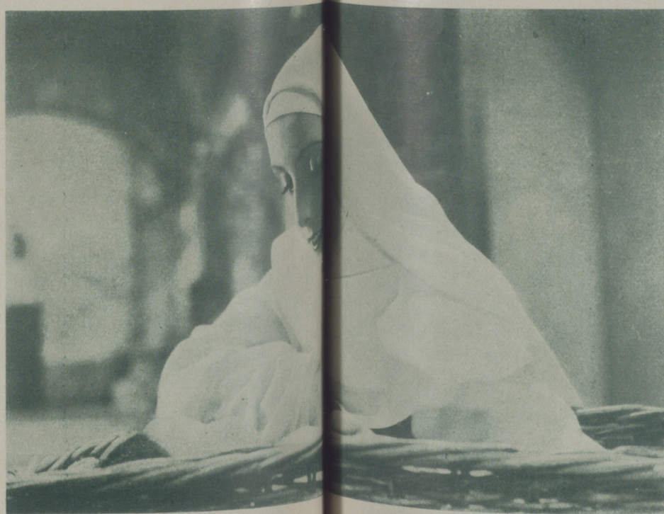
DOROTHEA WIECK, la protagonista en un momento de la gran producción "Canción de Cuna"

Prefirió a todas la Paramount, con la cual firmó el contrato que la hizo trasladarse a Hollywood desde hace varios meses.