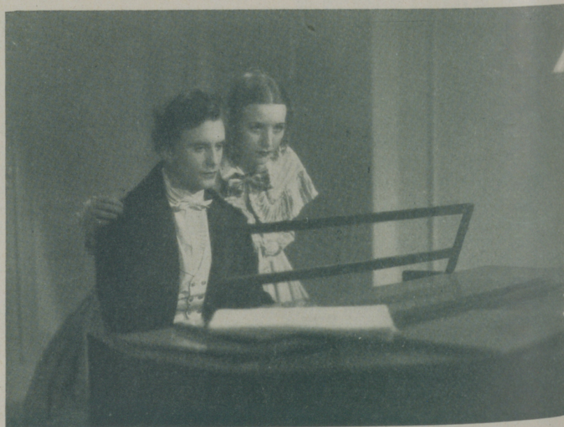
Una escena de "El último vals de Chopin" que distribuye Ufilms