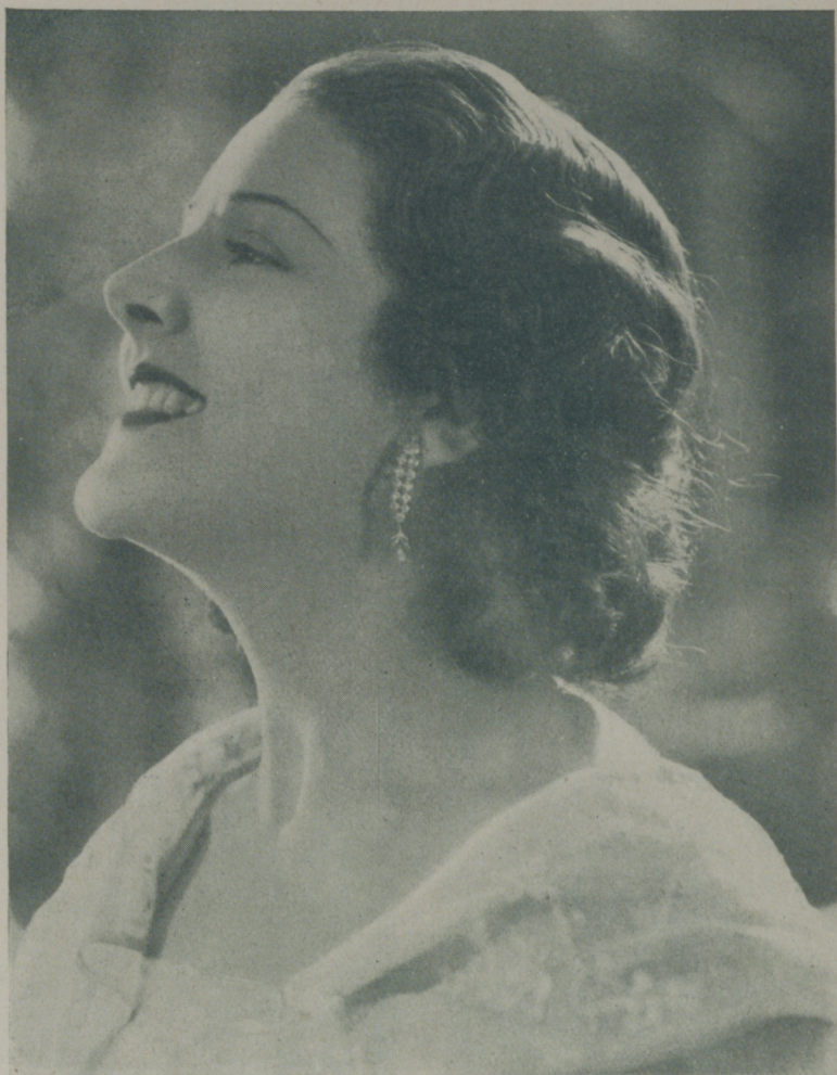
IMPERIO ARGENTINA, gentil protagonista de "La hermana San Sulpicio" sonriendo a la ilusión que llega hasta ella, en una escena de la película que distribuye Cifesa

En "La hermana San Sulpicio" personaje que no le es desconocido ya que todos guardamos el recuerdo de su interpretación muda, se ha superado en grado sumo, siendo de admirar la jovialidad y alegría que imprime a la