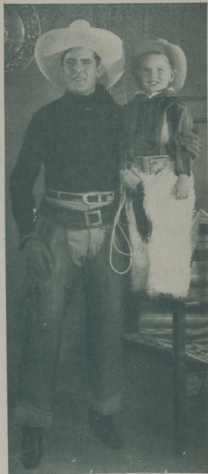
KEN MAYNARD con su primogénito a quien asesora en el manejo del lazo

En un accidente de auto fué herido levemente el conocido actor Víctor McLaglen y un niño de siete años de edad. Las heridas de ambos son de pronóstico leve, pero tendrán que guardar cama durante unos días a causa de los magullamientos y golpes recibidos.