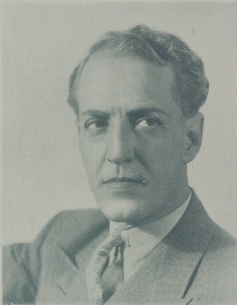
OTTO KRUGGER, actor de la Metro Goldwyn que nos habla de sus comienzos cinematográficos

Todos los artistas de las tablas deberían estudiar un curso sobre película sonora, antes de dedicarse a ingresar al cine.