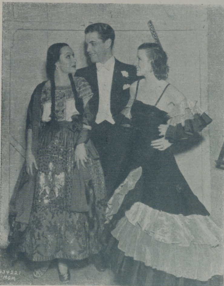
El acreditado galán RAMON NOVARRO acompañado de DOLORES DEL RIO y CONCHITA MONTENEGRO

Ramón Novarro es probablemente la estrella del cine que tiene más personas de su familia viviendo consigo.