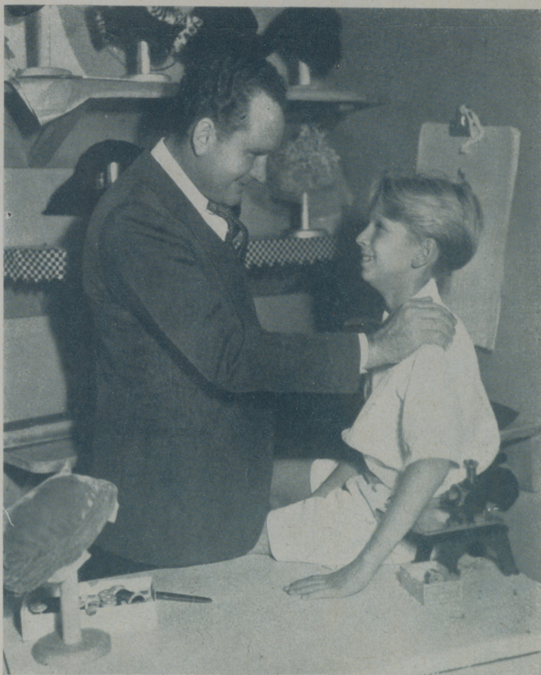
FRANK BORZAGE, el gran director de la Columbia felicitando al pequeño protagonista de la película "Hombres del mañana" que distribuye Cifesa

—Porque yo siento así la vida; porque mis constantes observaciones me han llevado a esa creencia. Creo que la mejor labor de todo director es