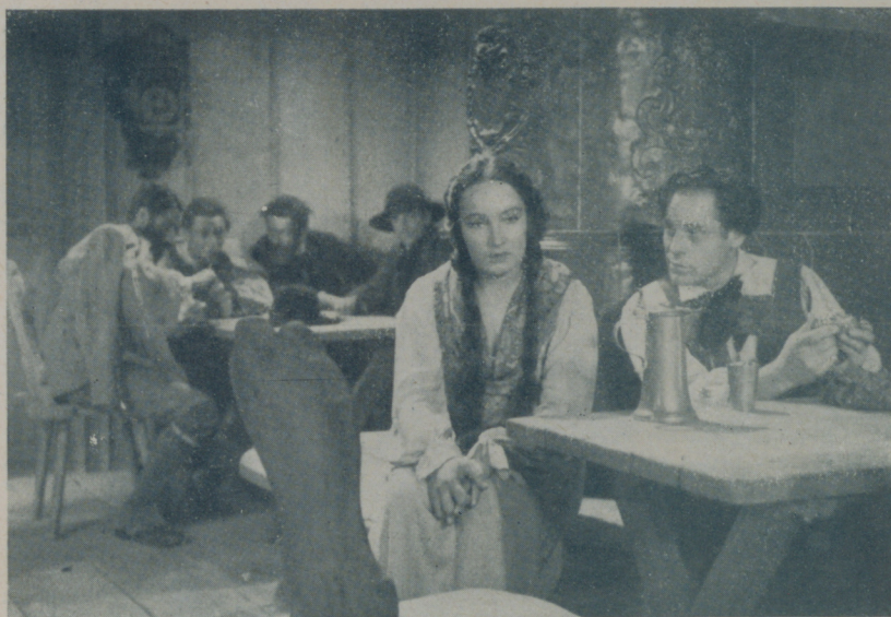
Una interesante escena de "Oro en la montaña" de Ufilms presentada en el Maryland con gran éxito

El director no perdona detalle. Sabe que el éxito de una obra está en la propiedad con que ha de ser presentada y no regatea medio. El monte