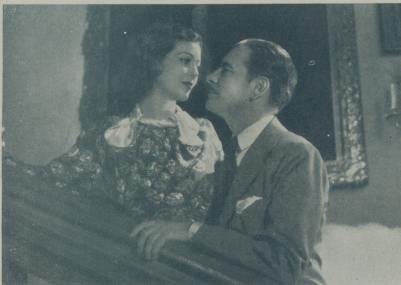
RONALD COLMAN y LORETTA YOUNG en "Una aventura de Drummond" de Artistas Asociados