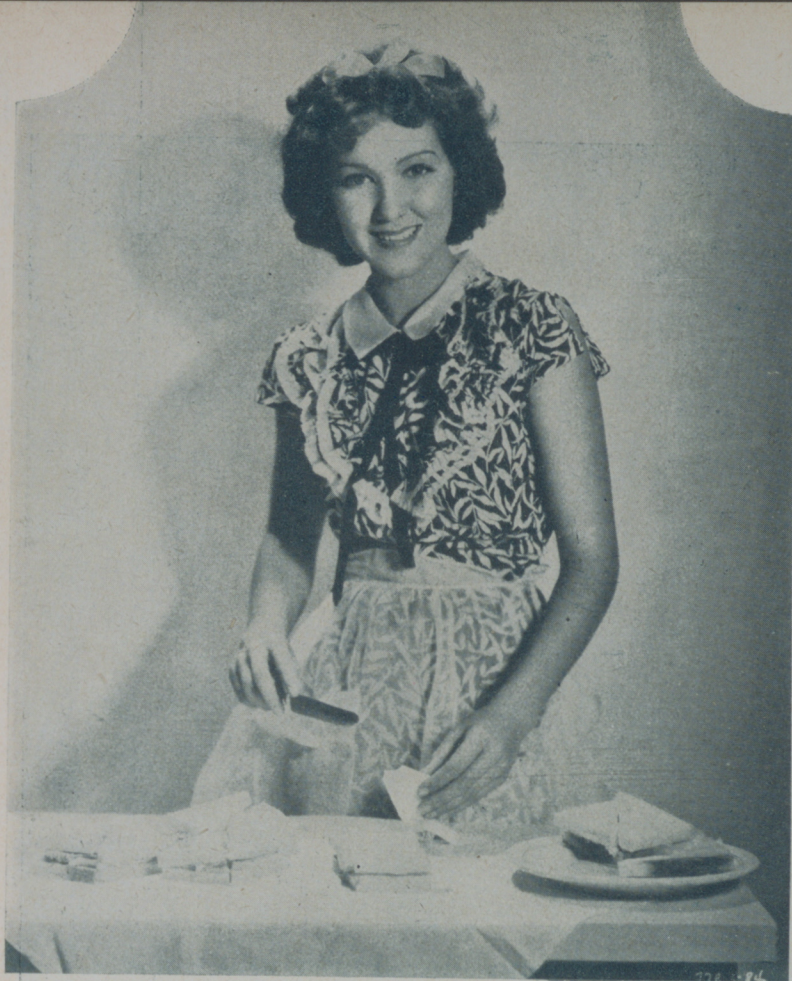
JEAN PARKER, nueva flor de aroma exquisito que adorna con su belleza las películas de la Metro

¿Y qué diremos de Jean Harlow? La rubia platinada de grandes ojos y nariz cargada de insolencia, es una de las mujeres más célebres de cine-landia. La elegancia de sus líneas es proverbial. Sus piernas son un porten-