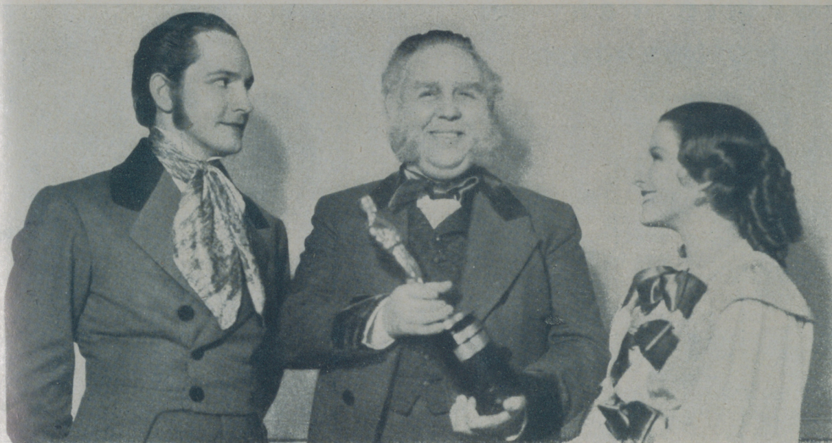
FREDERIC MARCH, CHARLES LAUGHTON y NORMA SHEARER, los tres artistas laureados por la Academia de Ciencias y Artes cinematográficas de Hollywood, que aparecerán juntos en "Las vírgenes de Wimpole" de M. G. M.