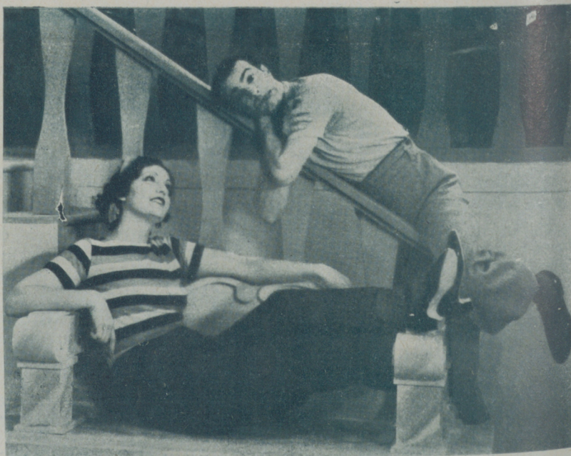
Una de las tantas escenas de "Viva la vida" que ha quedado guillotínada tras la entendida mutilación de unos entendidos