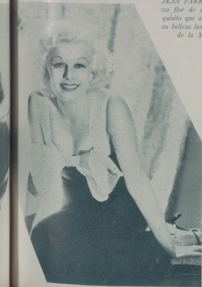
JEAN HARLOW la platina-belleza de la Metro, estrella de personalidad acusada