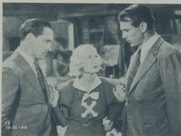
FREDRIC MARCH, MIRIAM HOPKINS y GARY COOPER en la divertida comedia de la Paramount "Una mujer para dos"