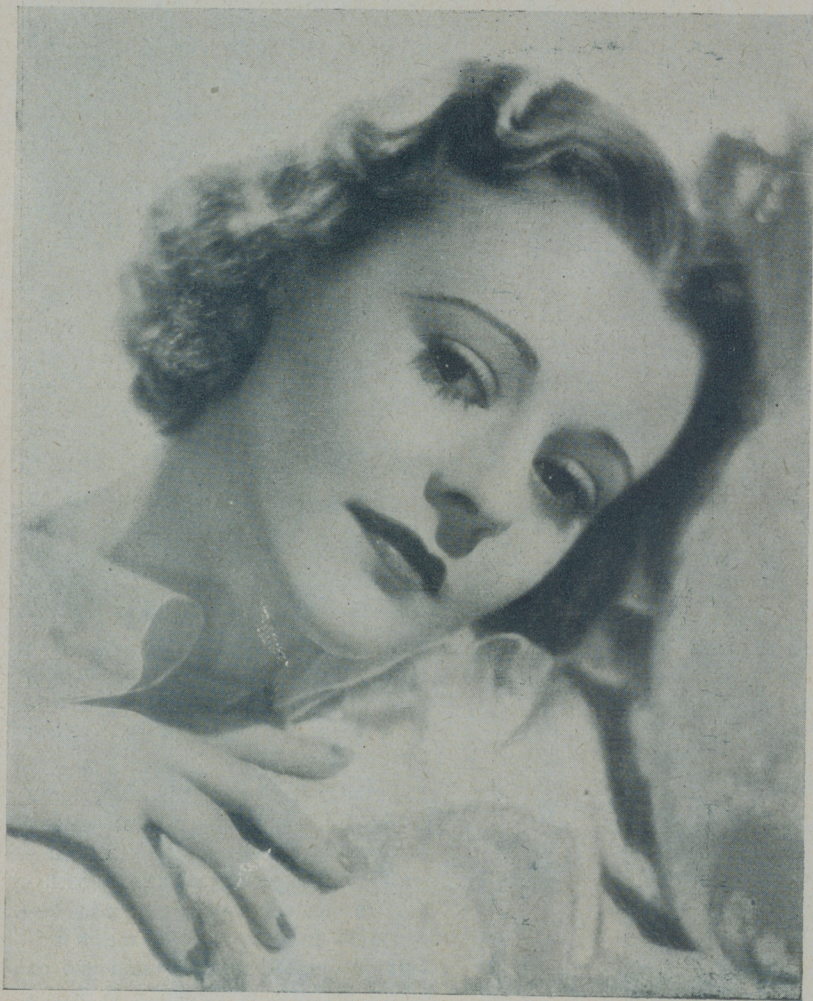
HEATHER ANGEL, exquisita artista de la Fox, cuya actuación en "La estación del amor" constituye un verdadero éxito

La temporada hallábase en pleno apogeo productivo. Los estudios Fox rebosaban. Por doquier, en las largas avenidas que lo atraviesan o en los esbeltos jardines, advertíase la presencia de las artistas, dispuestas a tomar parte en las películas que se estaban rodando.