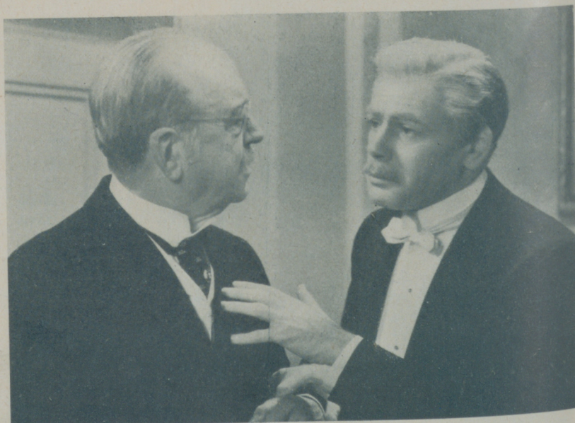
Envejecer es un arte y así lo demuestra PAUL MUNI en esta interesante escena

esos hombres que a los cuarenta quieren parecer muchachos modernos, con