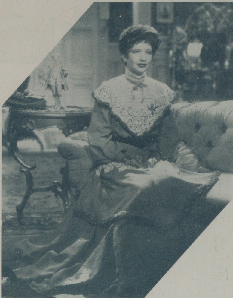
KAY FRANCIS la actriz de los grandes éxitos interpretativos, admirable y única... sabe envejecer en "La herencia" de la Warner conservando siempre los rasgos característicos de su gran temperamento

Este difícil arte ha sido cultivado de una manera exquisita por la insigne actriz de los estudios Warner Bros.-First National, Kay Francis en su última producción, en la que, después de haber sido brillante artista de cabaret, esposa amante y aristócrata de un no-