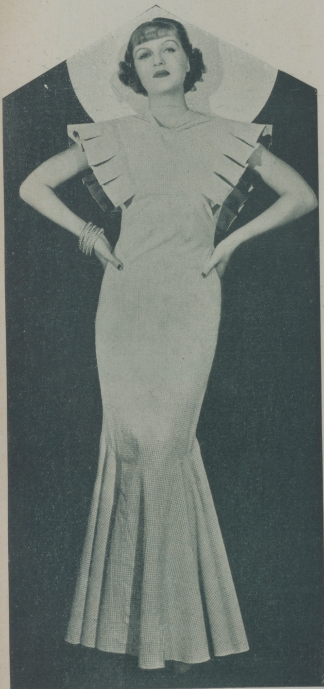
PATRICIA ELLIS, actriz de la Warner Bros, cuya belleza serena le ha producido grandes triunfos

Patricia Ellis es aún una niña, pero una niña rebelde que se ha impuesto a las gentes mayores por sólo su fuerza de voluntad.