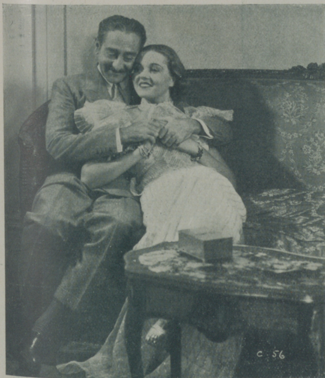
PATRICIA ELLIS y ADOLPHE MENJOU en una escena de "¡Qué semana!" de la Paramount

Hace poco menos de un año la Warner Bros-First National nos presentó este rostro nuevo lleno de gracia y gentileza y hoy ya nos la ofrece como actriz madura y consumada en la gran producción "El Mundo cambia" cinta de honda intensidad dramática en la que Pat pueda demostrar lo que es su arte actual y demostrar lo que es su arte actual y dejarnos vislum-