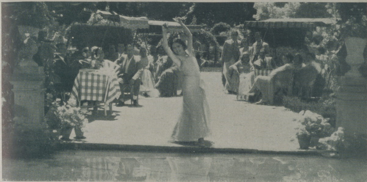
IMPERIO ARGENTINA luciendo con la gracia característica en ella, las excelencias de su arte, en una escena de "La hermana de San Sulpicio" que distribuye Cifesa

Películas verdaderamente grandes. no nos es dado ver todos los días. Llegan hasta nosotros de cuando en cuando una verdadera maravilla y los ojos del público, hastiados quizás de lo mucho mediocre que en materia cinematográfica pasa por su retina, no acierta a recoger, llevándolo al pensamiento, las grandezas de esa producción durante años esperada.