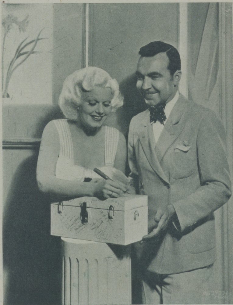
JEAN HARLOW firmando en una cajita en que un cineasta ha recogido autógrafos de las estrellas más famosas

Poco después la vi de nuevo. Hallábase firmando en una gran caja que un admirador de las estrellas había hecho firmar a cada una de ellas y Jean Harlow complaciente, sonriendo con satisfacción, estampó su firma al requerimiento del caballero. Una vez más había complacido a un admirador y como a él desearía hacerlo con todos, según nos ha dicho con sinceridad manifiesta.