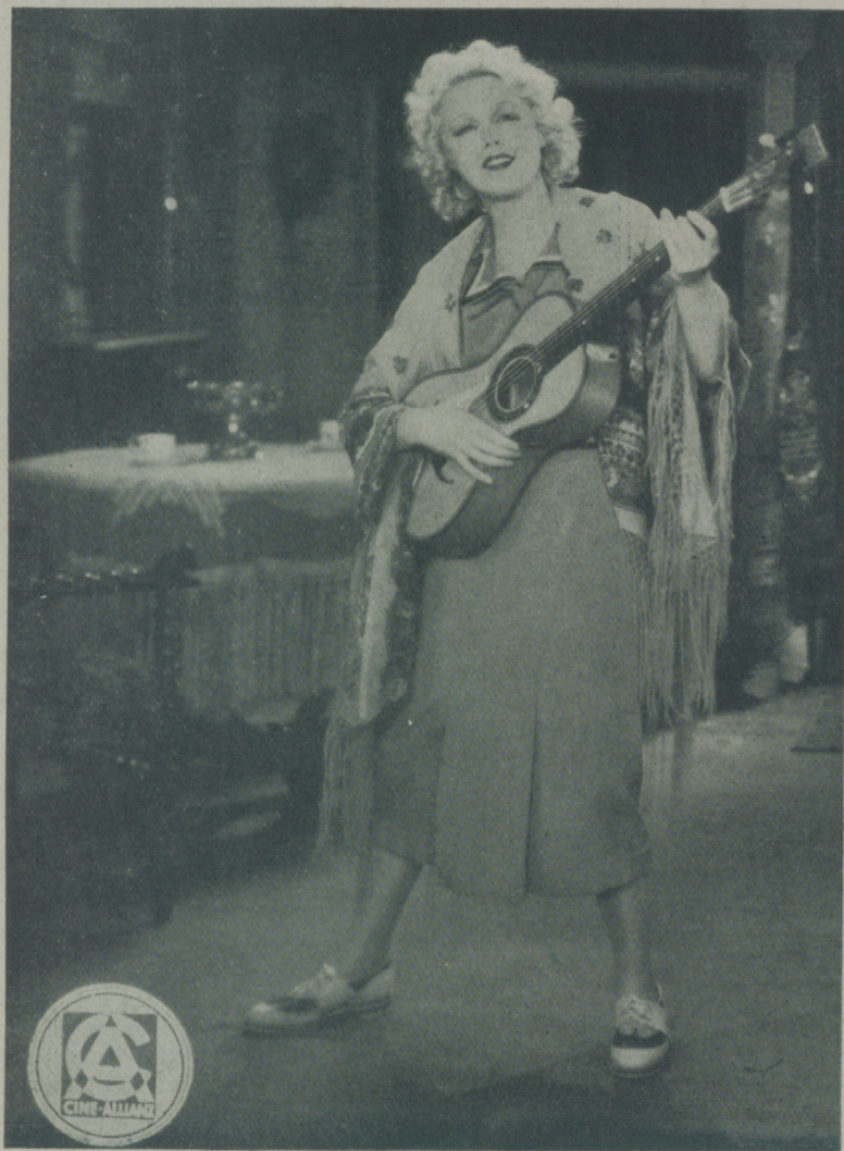
ANNY ONDRA, protagonista de "La señorita de los cuentos de Hoffman" de Ufilms

Desconocida nos pareció la gentil estrella alemana cuando, con motivo del combate de su esposo Schmeling con nuestro Uzcudun, llegó a Barcelona. La pizpireta criatura que en los sets cinematográficos salta como cabrilla loca adoptando las más cómicas posiciones, se nos había convertido en mujercita juiciosa de cara pícara y traviesa y ojos claros e ingenuos que nos miraban con cierta curiosidad al advertir nuestra admiración. De su rostro, había huído la candidez de sus manifestaciones cinematográficas, su