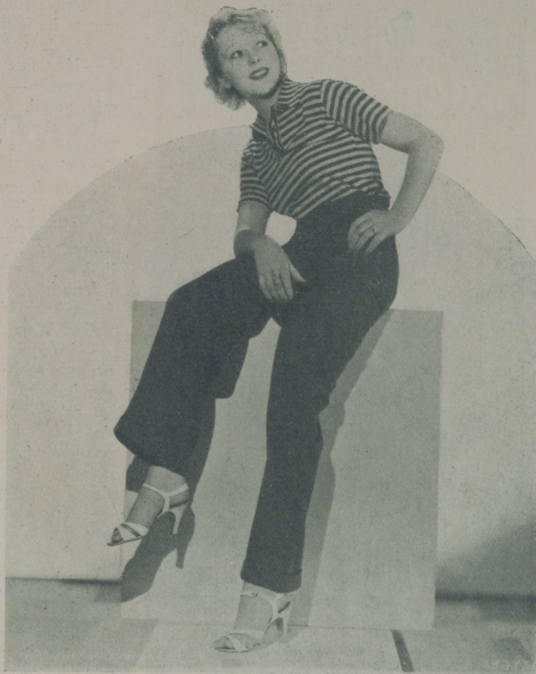
IDA LUPINO, la traviesa actriz de la Paramount que cada día se afianza más en el público cinematográfico

bezas... aunque sean los de palabras cruzadas... que tan de moda están en la actualidad... le contraría muchísimo olvidarse de una palabra que sea de los papeles que representa... pertenece a una familia que figura con brillo en el teatro... desde hace dos siglos... se pinta las uñas... y cambia con frecuencia el color del esmalte que emplea para ello... le parece que el guardaespaldas de George Raft es la persona más rara que ha conocido... su bebida favorita es la sangría... le encanta hacer crochet... empezó a aprender declamación cuando apenas tenía siete años... con su propio padre... Stanley Lupino... famoso actor