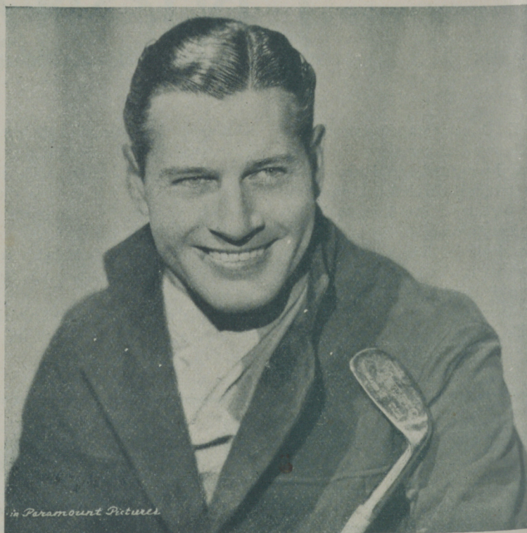
RICHARD ARLEN que acaba de apostarse con Bing Crosby una seria cantidad por cosa de la radio