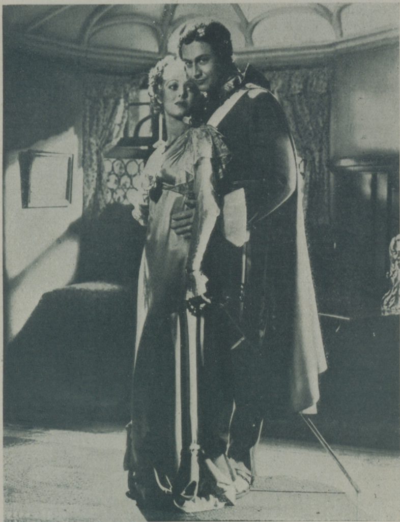
LORETTA YOUNG y ROBERT YOUNG, protagonistas de la película de Artistas Asociados "La casa de Rothschild"

Si bien el nombre de Rothschild es uno de los más famosos en el mundo mercantil y bancario, pocos son los que conocían su curioso origen hasta que se estrenó hace poco en Nueva York la película 20th Century "The House of Rothschild", distribuida mundialmente por la United Artists. Al departamento de investigaciones del estudio se debe haber sacado a la luz que Rothschild significaba "escudo rojo".