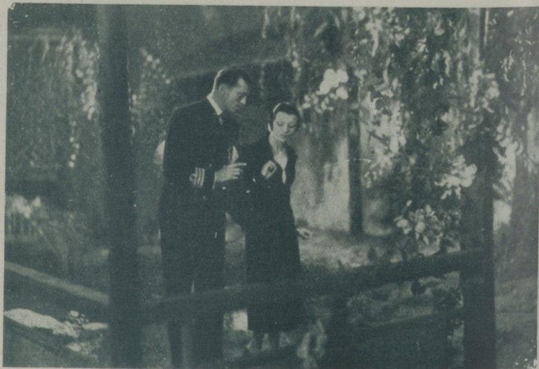
ANNABELLA y JOHN LODER en una escena de "La Batalla" que distribuye D. A. S. A.

Pueden los espectadores apreciar en lo que significa y vale el esfuerzo fantástico que resulta la realización de la obra más grande de la cinematografía francesa: "La Batalla".