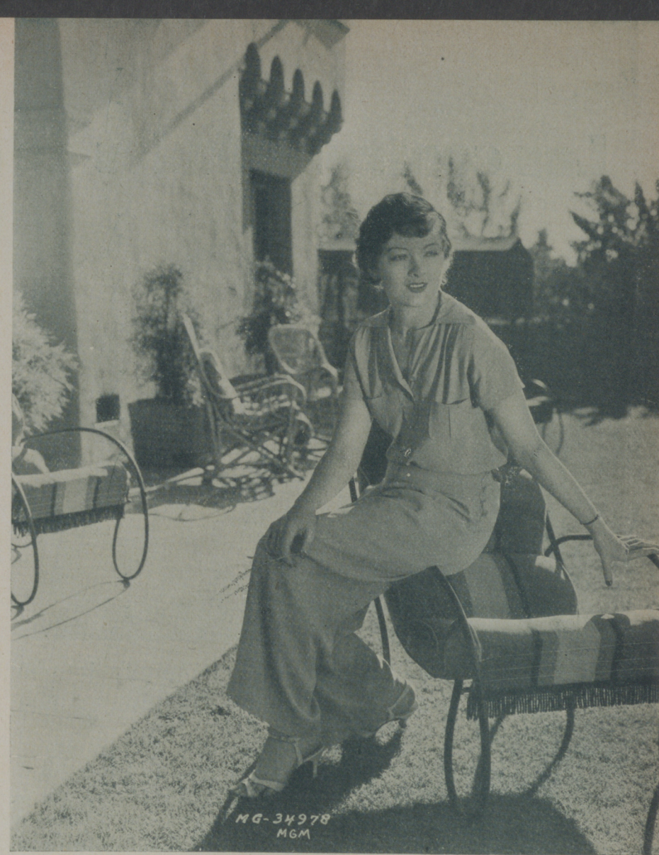
MYRNA LOY la gran actriz de la Metro cuya exótica belleza ha causado tan profunda admiración entre la afición cinematográfica

—No puedo contemplar a estos viejos amigos de mi jardín sin detenerme a pensar en el amor. Ahí tiene usted, la yedra adherida al olmo