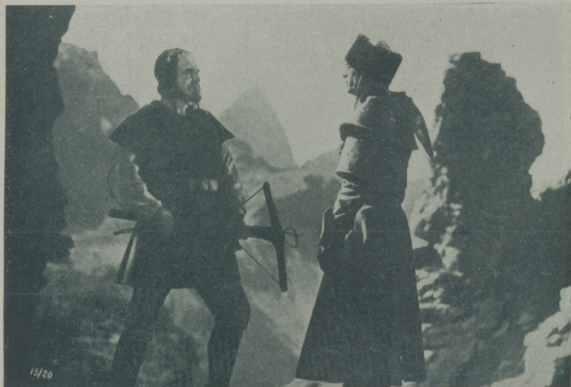
Una escena de "Guillermo Tell" de Selecciones Filmófono