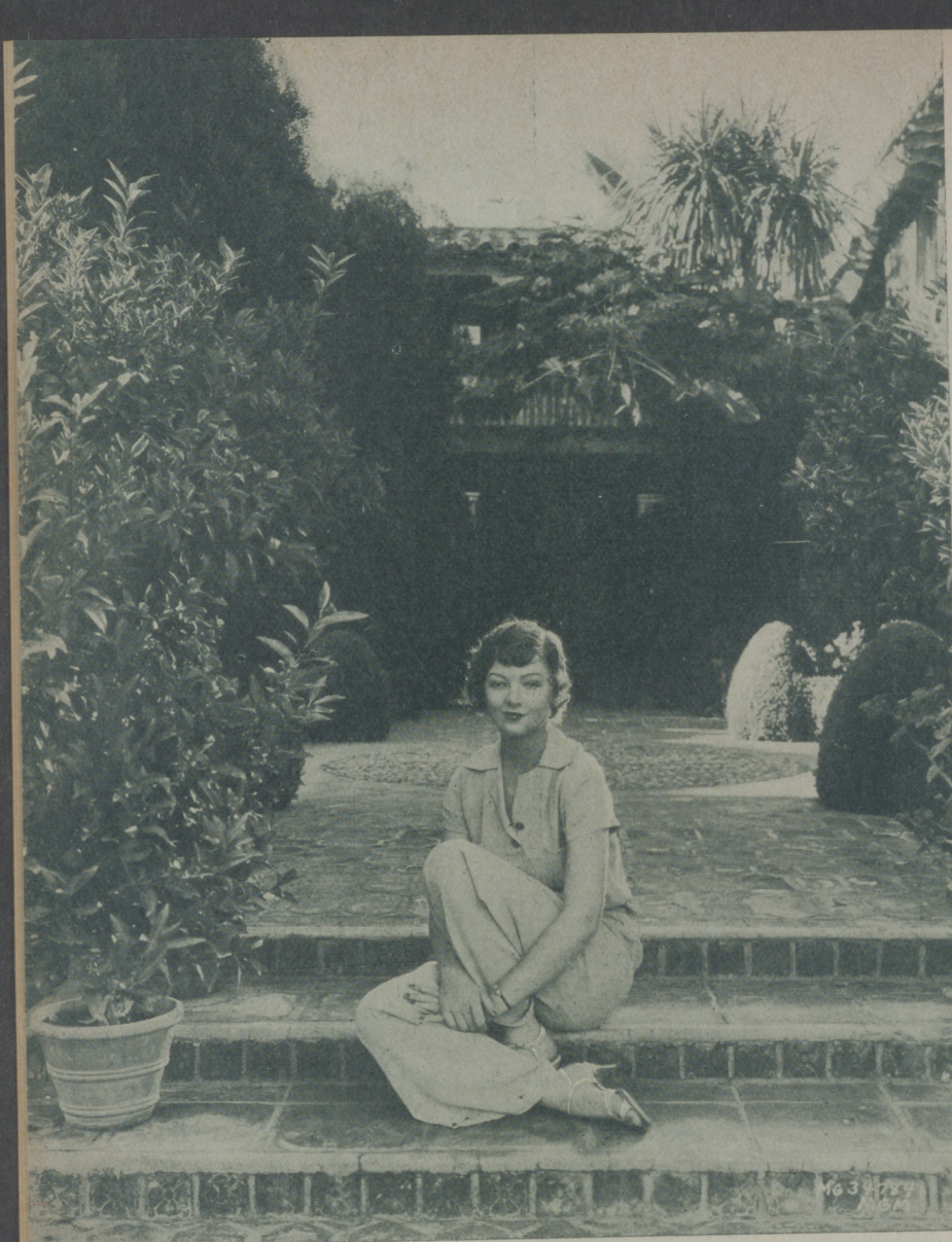
MYRNA LOY en el jardín de su casa se presta a nuestro objetivo con su amabilidad acostumbrada

En el jardín de su casa de Hollywood, un jardín coquetón y elegante que evidencia por lo selecto de las flores, la mano exquisita de una mujer, encontramos a Myrna Loy, la hasta ahora encantadora célibe cuya exótica belleza tanto ha llamado la atención.