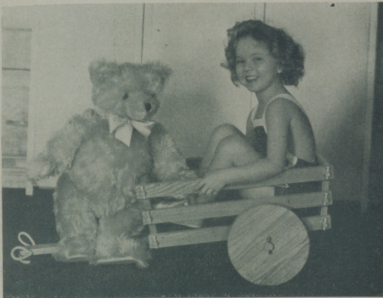
SHIRLEY TEMPLE la muñequita descubierta por la Fox que se ha revelado como genial artista

Está visto que llegar a ser estrella cinematográfica está lleno de inconvenientes nada fáciles de resolver. El poder escalar los escalones de la fama es ya cosa difícilísima que no logran salvar sino unos cuantos privilegiados y que una vez salvados están llenos de inconvenientes que son motivo de grandes preocupaciones que apenas si les dejan en paz los que de una manera indirecta, coadyuvaron a prestarles auxilio.