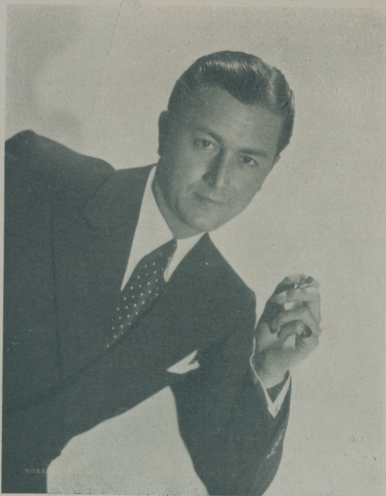
FRANCHOT TONE que con Joan Crawford interpretan "Así amo la mujer" de M. G. M., cuyos nombres han corrido unidos por el mundo entero

TODO CUANTO SUCEDE EN HOLLYWOOD DE SENSACIONAL PODRA USTED SABERLO EN DETALLE ADQUIRIENDO "EL CINE" QUE ES EL DE MAS COMPLETA Y VERAZ INFORMACION