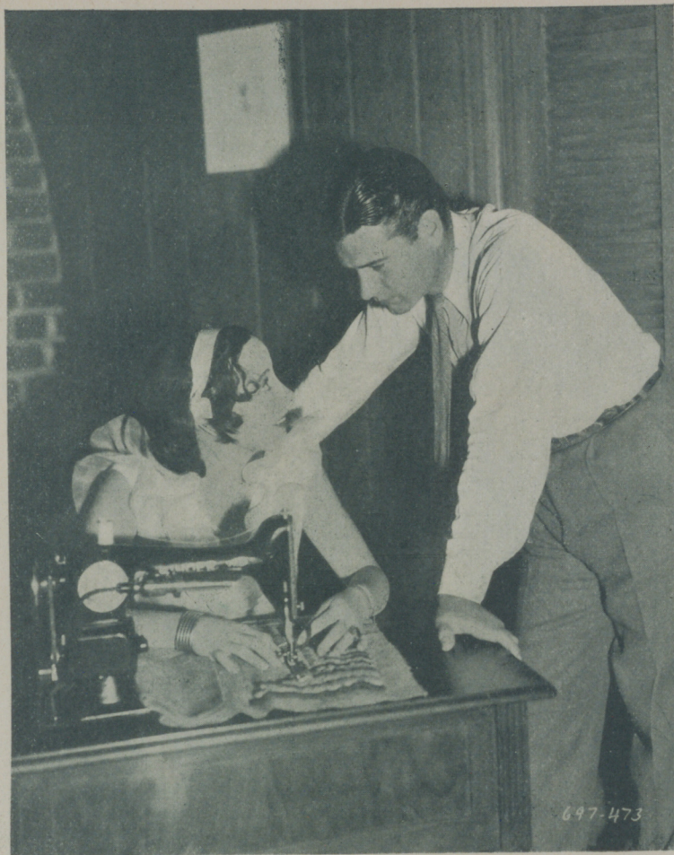
RICHARD ARLEN y JOBYNA RALSTON conocidos actores de la Paramount

Bing Crosby y Richard Arlen son ambos actores de la Paramount, ocupan en Toluca, lugar cercano a Hollywood, sendas casas que quedan casi vecinas; están unidos por cordial amistad. Y esto no obstante, han concertado un desafío en el cual, aunque no ha de correr la sangre, pondrá cada uno de los contendientes cuantos medios halle a su alcance para lograr que el otro abandone el campo en completa derrota... y con mil dólares de menos.