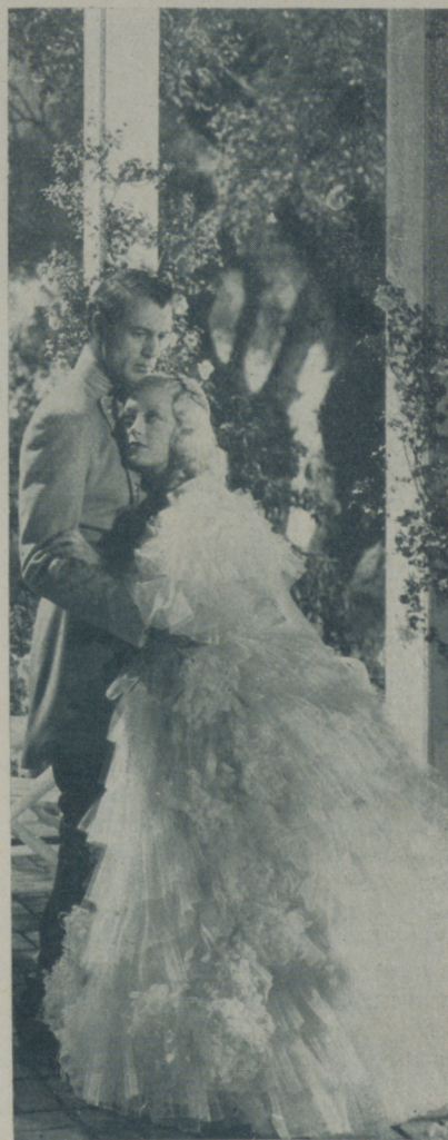
GARY COOPER y MARION DAVIES en una escena de "El operador núm. 13" de M. G. M.