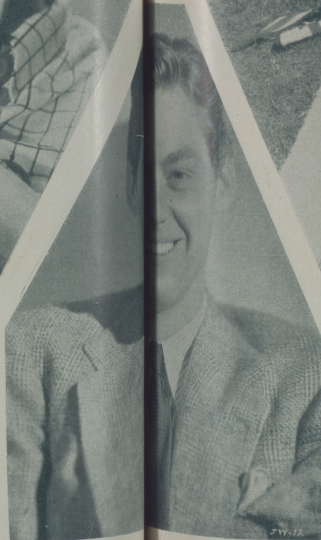
JOHNNY WEISSMULLER en la película de "Tarzán y su compañera"

MAUREN O'SULLYVAN en pleno bosque es sorpresa por el fotógrafo mientras recuerda las escenas de "Tarzán y su compañera"