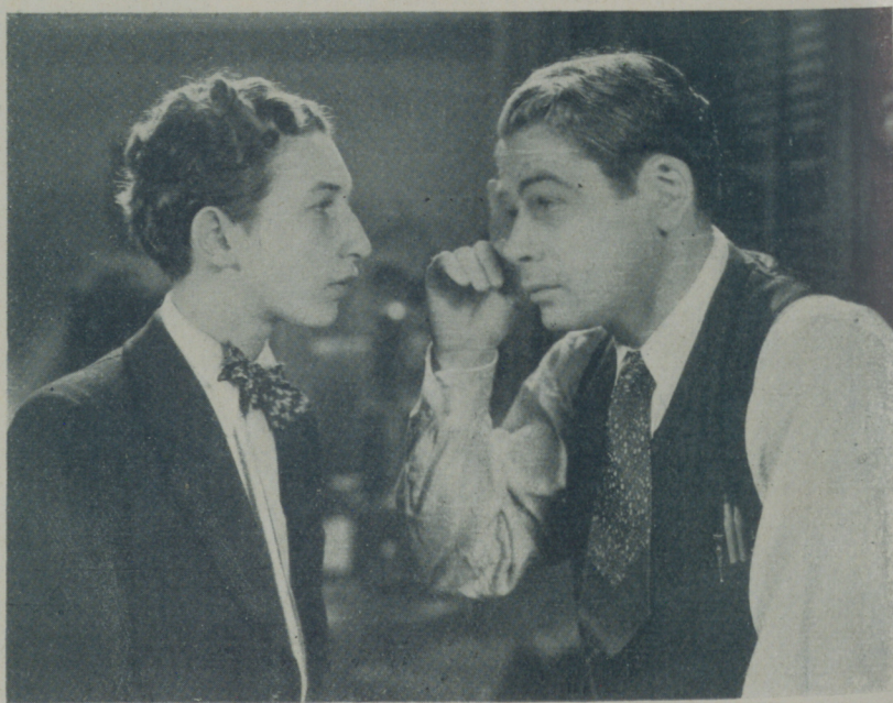
Otra escena de la película "¡Qué hay Nellie!" que protagoniza PAUL MUNI

"Ahora estoy más interesado en que el público cinematográfico me conozca tal cual soy porque creo que, contrariamente a lo que hasta ahora había pensado, voy a permanecer en este arte mucho tiempo, aunque siempre seguiré alternándolo con mis actividades teatrales, porque son éstas, en realidad las que más atraen. El teatro me ha fomentado y en el teatro me he hecho artista y al teatro debo mi celebridad; sería una ingratitud por mi parte abandonar al teatro al que quiero de veras y al que no dejaré hasta que él me deje a mí. Pero el cine también me atrae, siempre que la producción sea de mi gusto y creo que en el cine hay todavía mucho campo que correr y mucho terreno que descubrir. En el cine, tanto como la representación me interesa la dirección. Por esta causa me quedo en el cine una larga temporada. Los estudios Warner Bros.-First National me ofrecen ventajas positivas y me tiene consideraciones aceptables. Mi