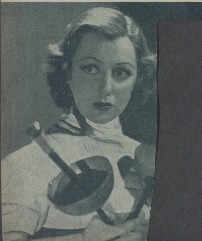
FRANCES DRAKE, de la Paramount