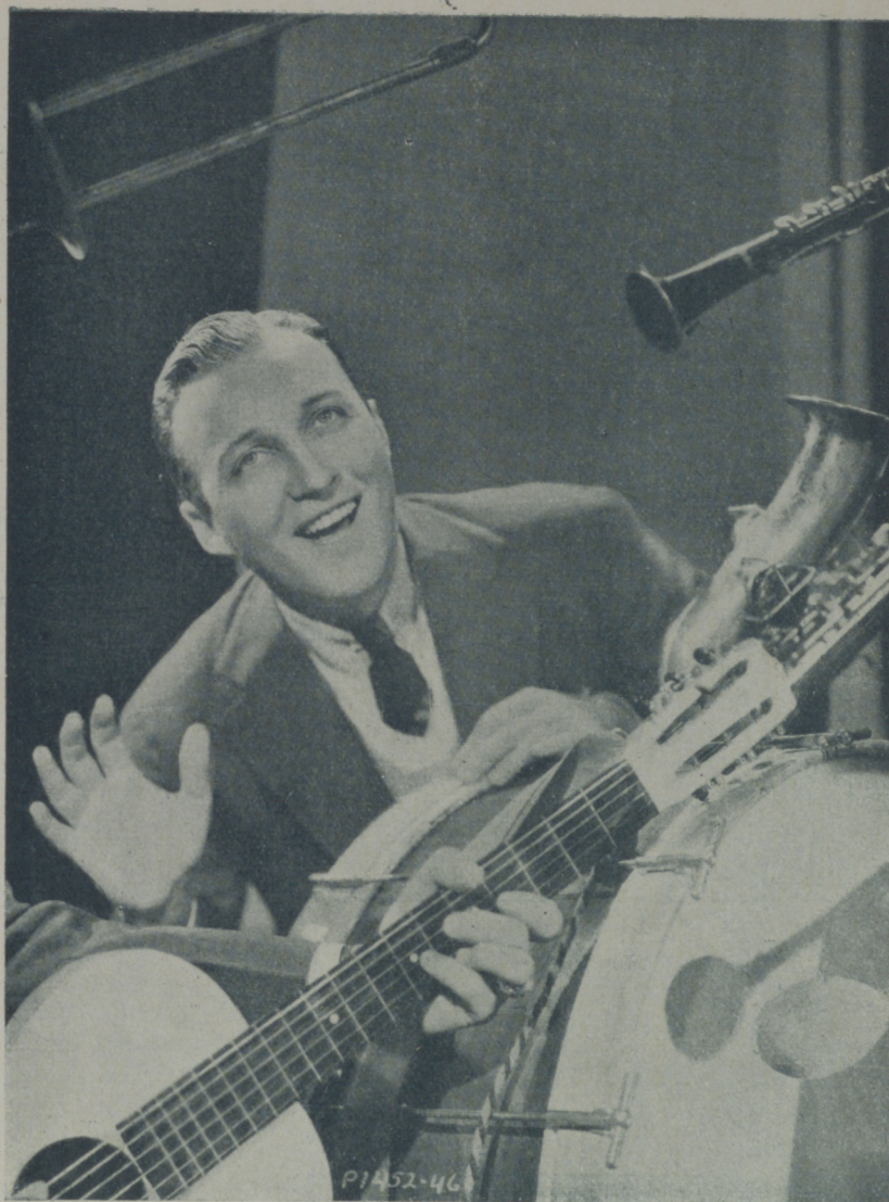
BING CROSBY, de la Paramount

Cary Grant es de la escuela de Sylvia Sidney y Gary Cooper: sólo ocupa el camarín para arreglarse.