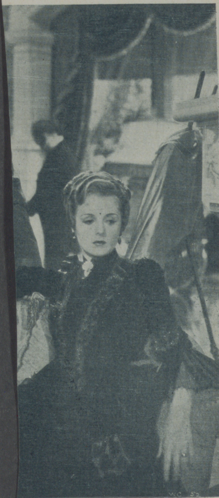
"El mundo cambia" de la Warner

"No quiero aventurarme a trazar planes para lo futuro. No se si seguiré trabajando en el cine muchos años ni sé qué películas filmaré ni sé lo que será de mí, pues como todo mortal estoy completamente a merced del destino. Lo que si sé es que el arte será siempre mi guía y mi fin y que sólo viviré para el arte y que siempre ha sido el arte el que me ha hecho vivir".