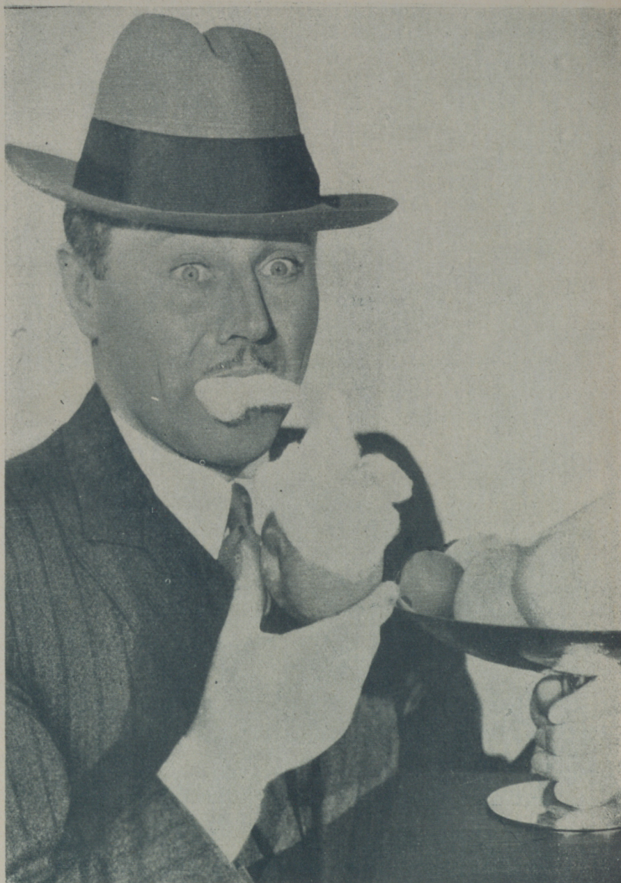
CHARLIE RUGGLES, excelente actor cómico de la Paramount

Por nuestra parte, prometemos coadyuvar de la mejor y más sincera manera, a esa difícil labor selectiva.