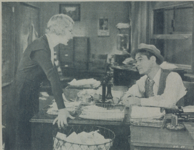
GLEND A FARRELL y PAUL MUNI en la gran película de la Warner "¡Qué hay Nellie!"

Por primera vez Paul Muni se ha dignado escribir para un periódico neoyorkino un artículo en el que habla exclusivamente de sí mismo y de su arte, abandonando como excepción su afán de pasar desapercibido como hombre y de ser admirado puramente como artista.