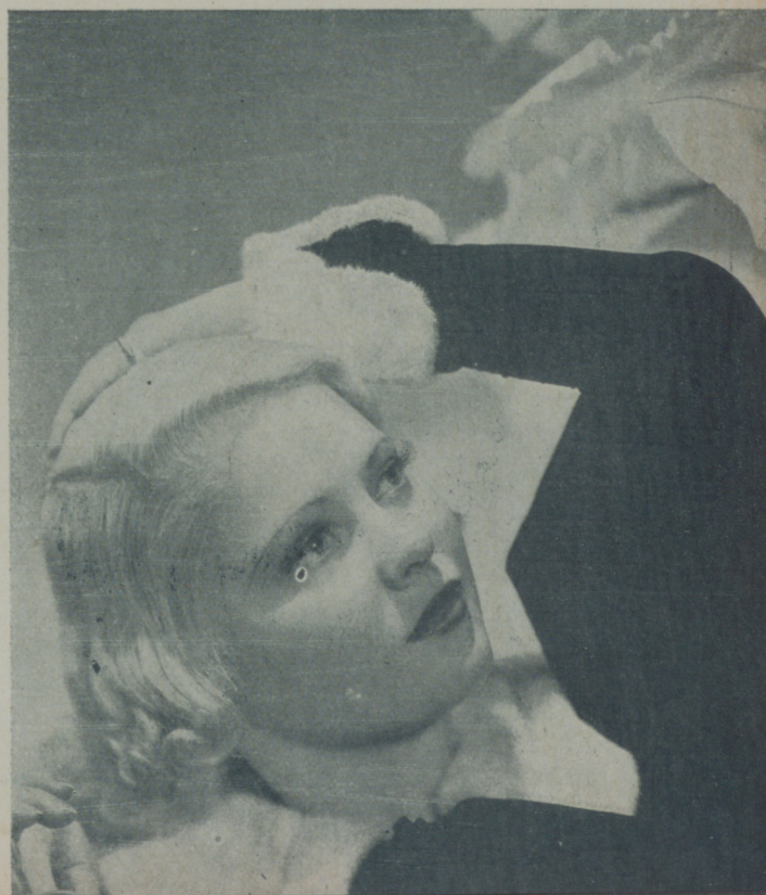
MARY CARLISLE, de M. G. M.