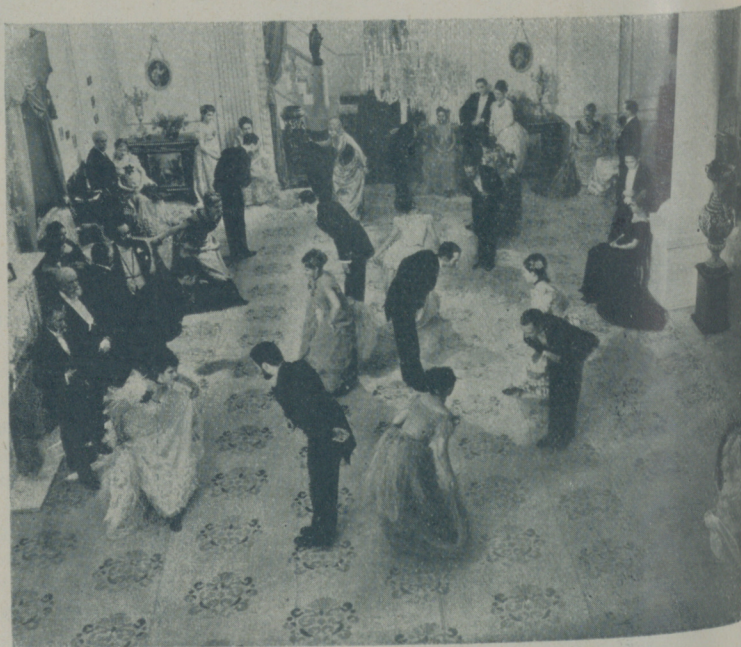
Otra escena de la producción mejicana que distribuirá la citada marca española