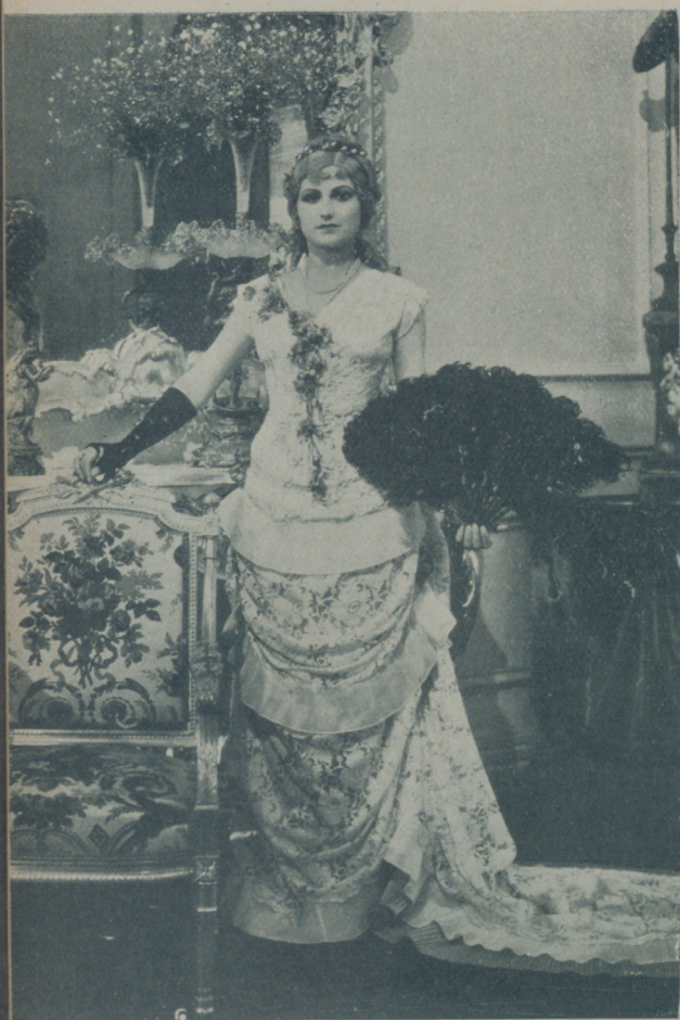
A LAMAR, protagonista de la producción mejicana de Indio Soler , que distribuye Selecciones Fil mónico

Es corriente, al hablar de films españoles, (entre españoles y en España) el sonreírse ante la labor de la mayoría de los intérpretes. Hemos de confesar que lloverá bastante antes de que el cinema español cuente con actores tan ricos en oficio como los artistas americanos de tercera o cuarta categoría.