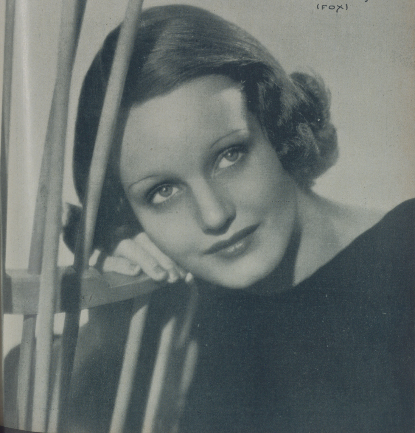
Rochelle Hudson