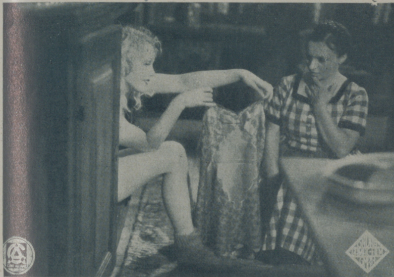
ANNY ONDRA la deliciosa artista protagonista de "La señorita de los cuentos de Hoffmann" que distribuye Ufilms

Un aeroplano deja sentir el zumbido de su hélice sobre los Alpes. En él va Anita, joven de veinte primaveras, heredera de una gran fortuna. Vive en la alta Baviera y vuela de una sucursal a otra sin descansar atendiendo a su negocio. Dueña de muchos millones, bajo la tutela de una tía encantadora, está rodeada de un personal adicto y fiel. Tiene todo cuanto pueda desear menos una cosa que otras jóvenes de su edad tienen: —amor. Es un jefe de empresa en todo el sentido de la palabra; pero, cuando está a solas con su tía, es lo que verdaderamente es: una muchacha que anhela el amor. Hoy tiene que salir para Munich, pero poco antes de su partida ocurre una pequeña desgracia; Anita toma unos polvos soporíferos que estaban destinados para la tía.