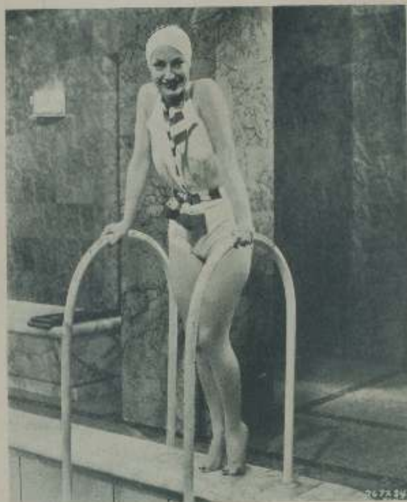
JOAN CRAWFORD, la bellísima actriz de la Metro Goldwyn Mayer, despidiéndose a llover en baño en la piscina de su casa de Hollywood

Mucho se ha hablado de esta mujer y como su carrera cinematográfica está aún en pleno apogeo, mucha se hablará todavía, pero son pocas las veces que, dejando al fondo de su alma llena de vibraciones, se ha dicho la verdad, tras el análisis de sus pensamientos.