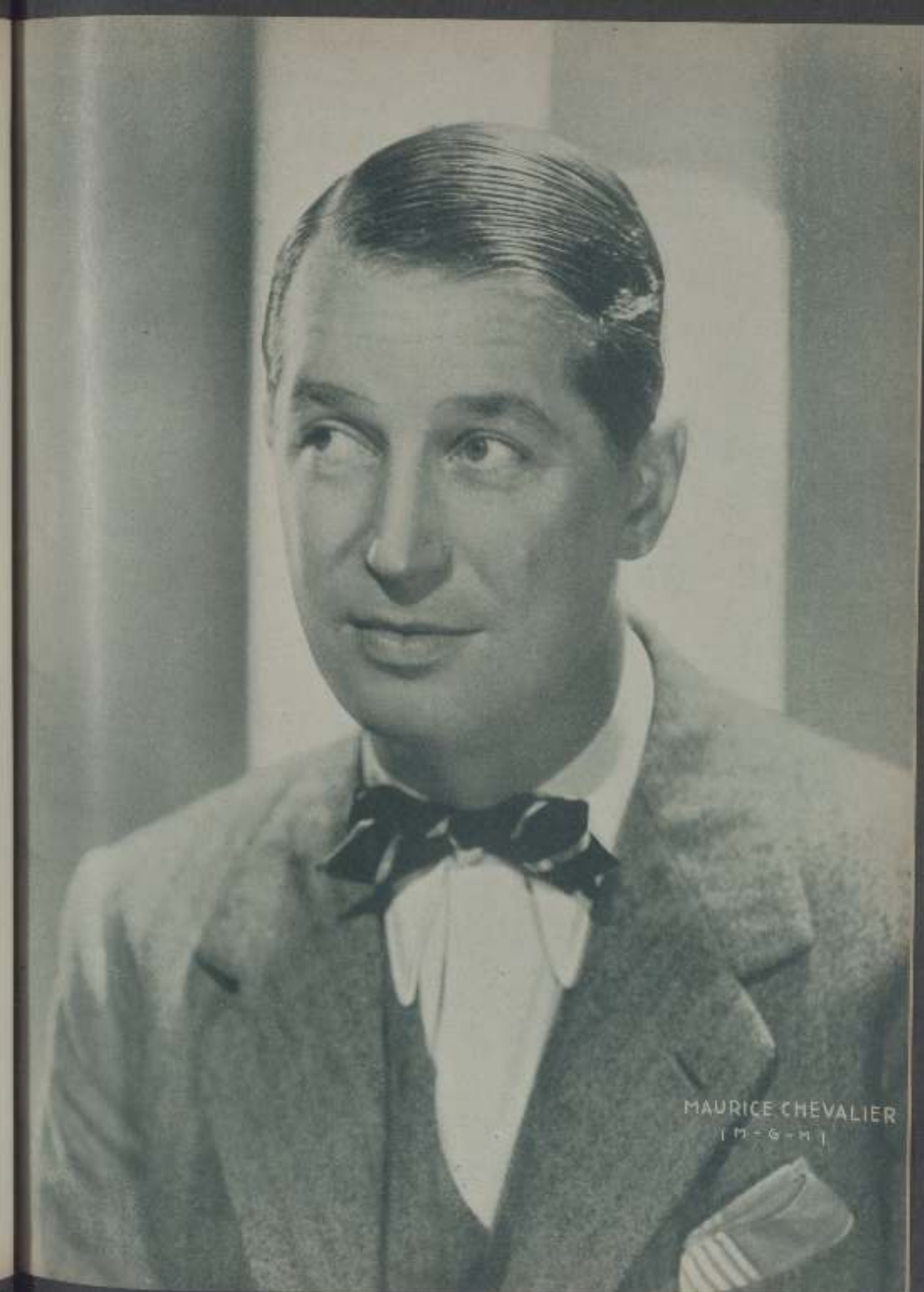
MAURICE CHEVALIER