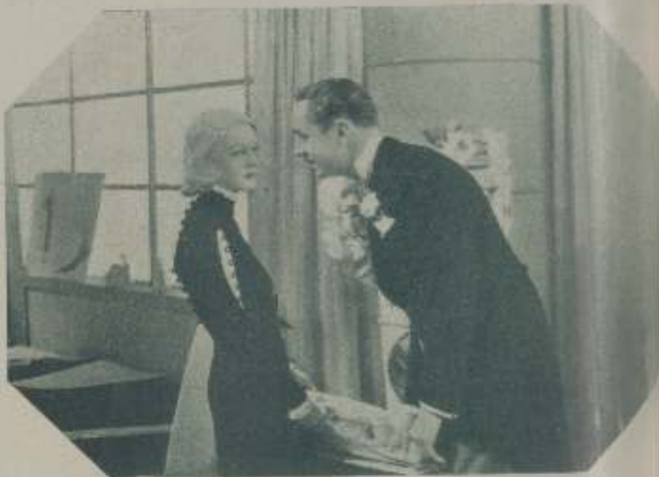
BETTE DAVIS y WILLIAM POWELL, en una escena de "El altar de la moda" de la Warner

—¿Por qué escriben esos mamarrachadas? — preguntó a boca de jarro al director del periódico que la había recibido. — Porque no se documentan primero y escriben ustedes la verdad de los hechos, sin desfigurar las cosas hasta el punto de que a mí me ha costado trabajo reconocerme en ese reportaje odioso. ¿Qué saben ustedes de mi vida particular? Y se atreven a escribir esas barbaridades... Yo regresé a Hollywood hace cuatro meses y desde que llegué no he dejado de salir ni una noche, he ido a todas las fiestas, a todas las bailes, a todos los estrenos, a todas las comedias de moda, y sólo he derramado lágrimas en el set, cuando la escena que he filmado lo requería, pero no me he pasado las noches encerrada en casa durando la "ingratitud" de mi marido como ustedes dicen. Mi marido se ha quedado en Nueva York, es verdad, y va todas las noches al cabaret, pero no a divertirse a mis espaldas, sino a trabajar, pues dirige el jazz que toca en él y no puede abandonar su tra-