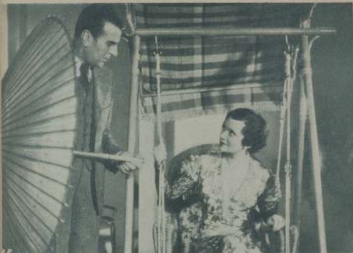
Una escena de "Te quiero y no sé quién eres" que interpreta JEAN MURAT y que distribuye Ufilms.

Los años pasan, van engrasando las líneas cinematográficas rostros nuevos, caras juveniles de legión de muchachos cada vez más atractivos, nuevos calanes de proporciones acóticas que lo mismo se adaptan al papel de un gentleman que al de uno de esos seres primitivos que habitan en las islas del Pacífico. Los años pasan y también en el olvido a actores que en su día fueron grandes y de la memoria se van olvidando aquellos nombres que hicieron las delicias de nuestros padres.