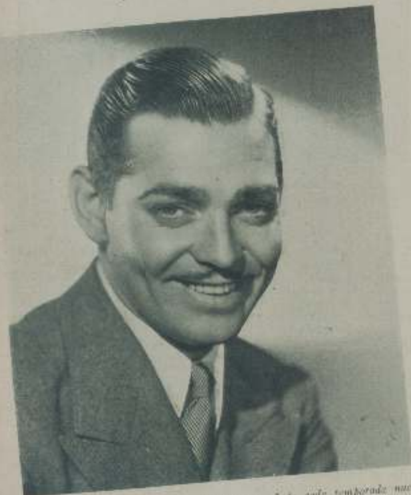
CLARK GABLE, el gran actor de la Metro que sólo cada temporalmente nos devuelve a su prestigio

Va ve el lector, como en Hollywood también pasan cosas, como no siempre son voces publicitarias las que nos hablan de un ambiente que a pesar de los penares, no es tan trivial ni tan lastimoso ni tan frívolo como los funcionarios jóvenes han supuesto o creído.