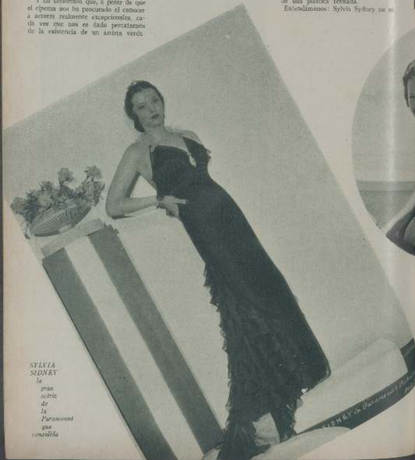
SYLVIA SIDNEY la gran actriz de la Paramount que consolidó