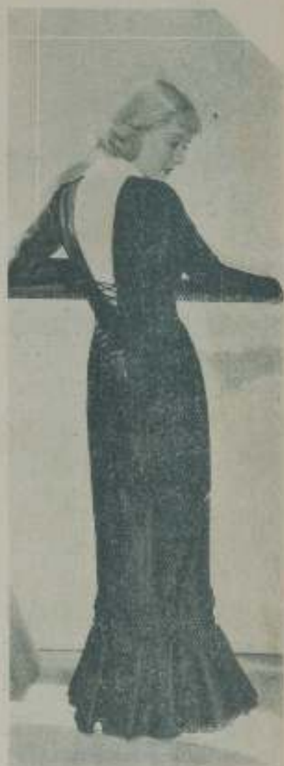
Elegante en su sencillez BETTE DAVIS luce un precioso traje de noche

Bette Davis salió de la redacción riendo fuerte, satisfecha de su ruego de genio y segura de que, en adelante, ya nadie se atrevería a calumniarla.