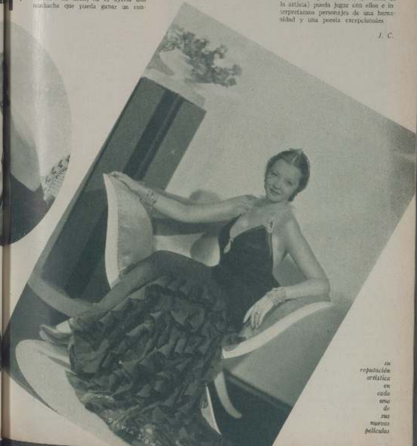
su reputación artística en cada una de sus nuevas películas