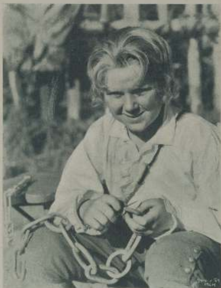
JACKIE COOPER el pequeño gran actor protagonista de "La Isla del Tesoro" de M. G. M.

Luego, alguien descubrió que Jackie era lo que se dice todo un actor. Y le fueron confiados papeles de una responsabilidad tremenda. Pasemos por alto la cronología de sus éxitos. Recordemos solamente algunos de ellos. Quiera ha olvidado aquel muchachuelo de "Champ". ¿Hay posibilidad alguna fuera del cinema y de esta obra maes-