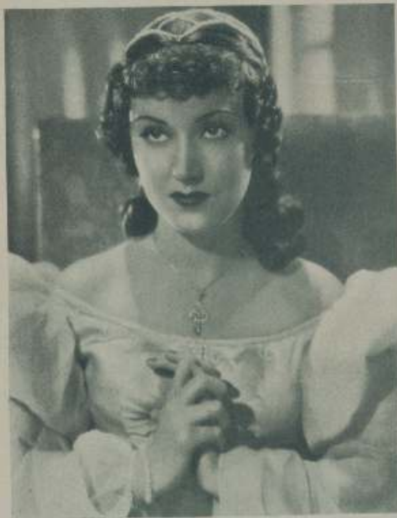
FAY WRAY, delicada actriz de belleza espléndida en una escena de "El hablador florentino" de Artistas Asociados

Pocas mujeres de la belleza de Fay Wray han desfilado por la pantalla. Su belleza no es la de una de esas mujeres fascinadoras que actúan de vampiras, sino todo lo contrario. Es serena, admirable dentro de su aspecto sencillo que da a su rostro la expresión lánguida de las mujeres que llevan dentro de su alma una gran cantidad de romanticismo, delicada y suave como la de las ingenuas.