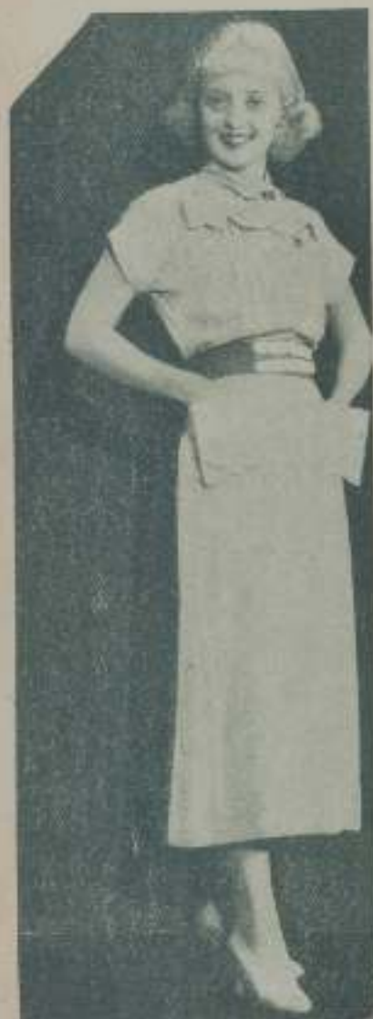
BETTE DAVIS la gentil actriz de la Warner

Bette Davis, con su linda cabecita de un rubio desvaído, sus platinados, sus brillantes ojos azules, su jugosa boca de grana y su cuerpecito envuelto en pequeños tanga se presentó, en bastante tiempo en la redacción de un periódico que había publicado un reportaje en el que se confirmaba que la onerosísima actriz se pasaba las horas del día durando en un rincón de su casa mientras su marido se divertía alegremente en los casinos neoyorkinos.