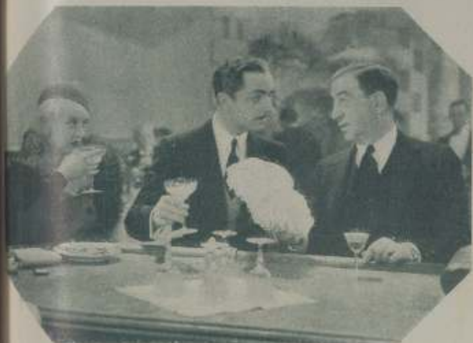
WILLIAM POWELL y BETTE DAVIS intérpretes principales de "El altar de la moda"

tualmente, procurando no faltar nunca a mis deberes de esposa. Así, cuando nos volveremos a reunir, tendremos muchas cosas que contarnos, mientras que si me estaba encerrada en casa flotando todo el día, cuando fuera a reunirme a mi esposo no podría decirle nada y él se aburriría eternamente a mi lado. ¿Qué sacaría de encerrarme en casa y de llorar todo el día? Me envejecería, me saldrían arrugas alrededor de los ojos, se me marchitarían los párpados, las pupilas perderían su brillo y cuando mi esposo me viera no me reconocería. Quiero conservarme fresca y joven para que él siga tan enamorado de mí como hasta ahora, y para conservar la juventud es preciso saber tomar la vida tal como es.