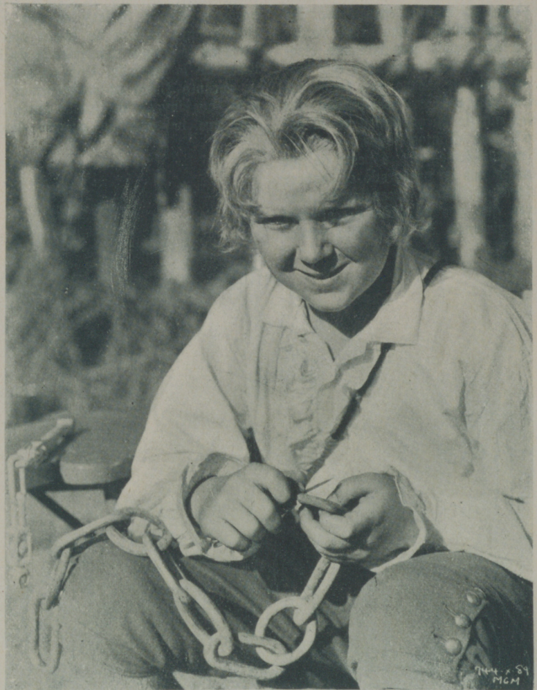
JACKIE COOPER el pequeño gran actor protagonista de "La isla del tesoro" de M. G. M.

Luego, alguien descubrió que Jackie era lo que se dice todo un actor. Y le fueron confiados papeles de una responsabilidad tremenda. Pasemos por alto la cronología de sus éxitos. Recordemos solamente algunos de ellos. Quien ha olvidado aquel muchachillo de "Champ"? ¿Hay posibilidad alguna fuera del cinema y de esa obra maes-