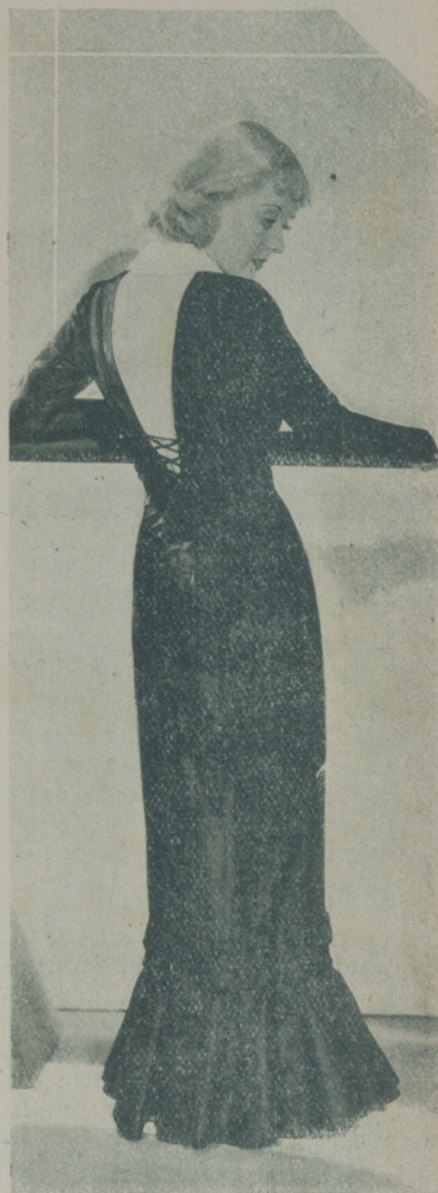
Elegante en su sencillez BETTE DAVIS luce un precioso traje de noche