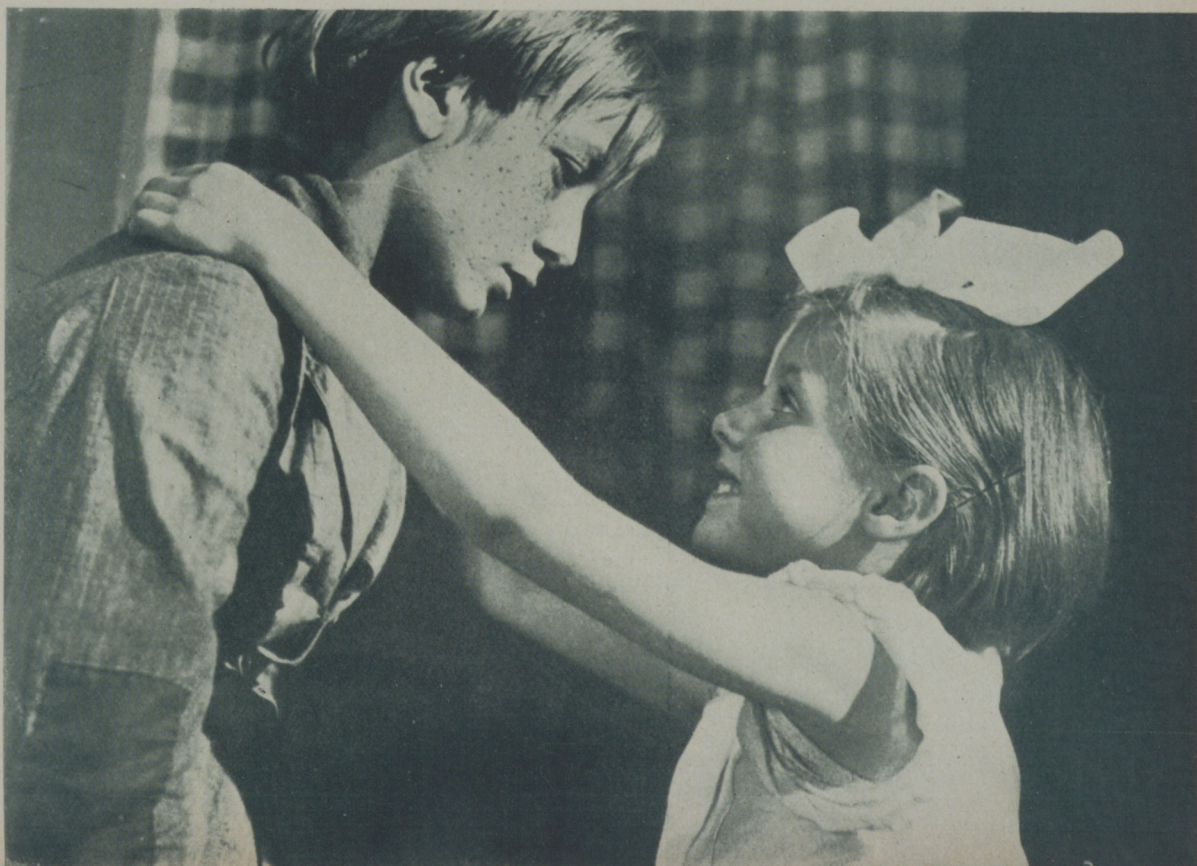
ROBERT LYNEN en una escena de "Pelirrojo" de Selecciones Filmófono