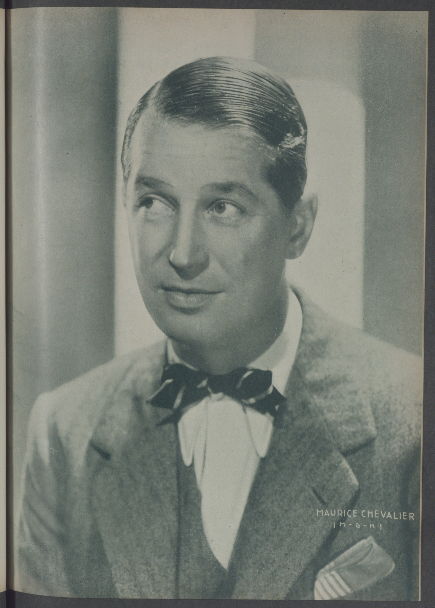
MAURICE CHEVALIER