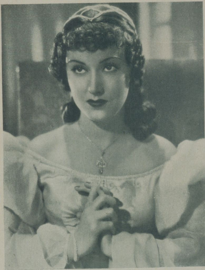
FAY WRAY delicada actriz de belleza esplendente en una escena de "El burlador florentino" de Artistas Asociados

Pocas mujeres de la belleza de Fay Way han desfilado por la pantalla. Su belleza no es la de una de esas mujeres fascinadoras que actúan de vampiras, sino todo lo contrario. Es serena, admirable dentro de su aspecto sencillo que da a su rostro la expresión lánguida de las mujeres que llevan dentro de su alma una gran cantidad de romanticismo, delicada y suave como la de las ingenuas.