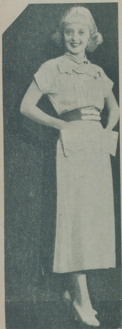
BETTE DAVIS la gentil actriz de la Warner

Bette Davis, con su linda cabecita de un rubio desvaído, casi platinado, sus brillantes ojos azules, su jugosa boca de grana y su cuerpecito cimbreante de pequeña tanagra, se presentó, no hace mucho tiempo en la redacción de un periódico que había publicado un reportaje en el que se confirmaba que la encantadora actriz se pasaba las horas del día llorando en un rincón de su casa mientras su marido se divertía alegremente en los cabarets neoyorkinos.