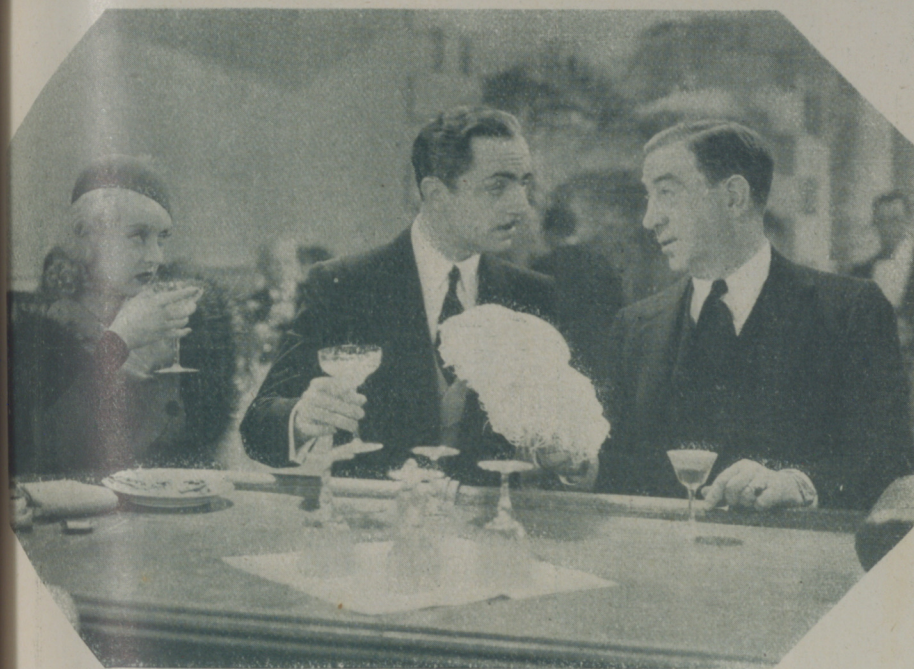
WILLIAM POWELL y BETTE DAVIS intérpretes principales de "El altar de la moda"

turalmente, procurando no faltar nunca a mis deberes de esposa. Así, cuando nos volveremos a reunir, tendremos muchas cosas que contarnos, mientras que si me estaba encerrada en casa llorando todo el día, cuando fuera a reunirme a mi esposo no podría decirle nada y él se aburriría soberanamente a mi lado. ¿Qué sacaría de encerrarme en casa y de llorar todo el día? Me envejecería, me saldrían arrugas alrededor de los ojos, se me marchitarían los párpados, las pupilas perderían su brillo y cuando mi esposo me vería no me reconocería. Quiero conservarme fresca y joven para que él siga tan enamorado de mí como hasta ahora, y para conservar la juventud es preciso saber tomar la vida tal como es.