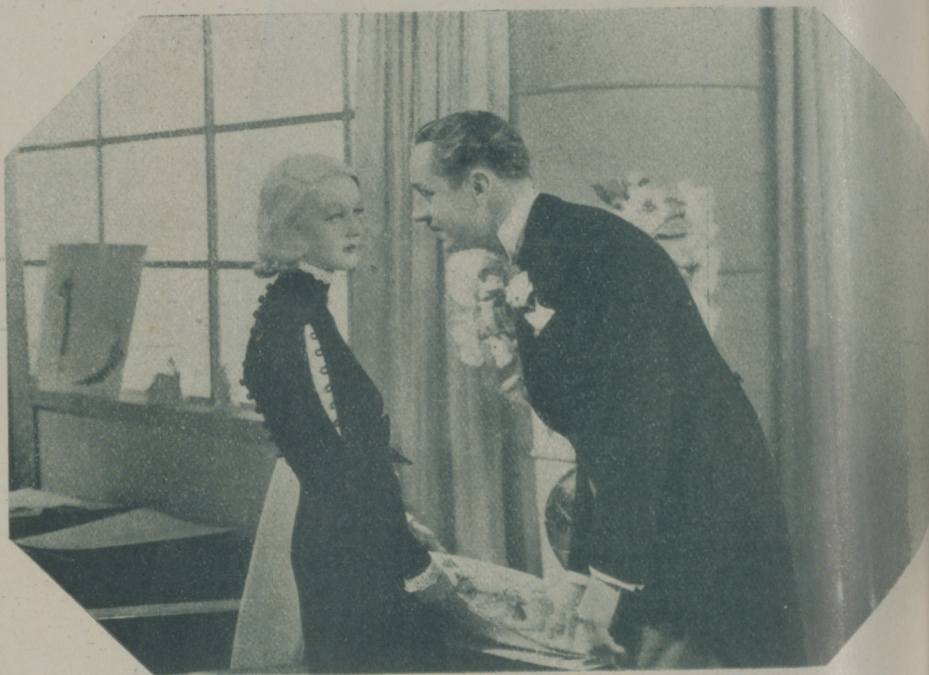
BETTE DAVIS y WILLIAM POWELL en una escena de "El altar de la moda" de la Warner

—¿Por qué escriben esas mamarrachadas? — preguntó a boca de jarro al director del periódico que la había recibido. — Porque no se documentan primero y escriben ustedes la verdad de los hechos, sin desfigurar las cosas hasta el punto de que a mí me ha costado trabajo reconocermé en ese reportaje odioso. ¿Qué saben ustedes de mi vida particular? Y se atreven a escribir esas barbaridades... Yo regresé a Hollywood hace cuatro meses y desde que llegué no he dejado de salir ni una noche; he ido a todas las fiestas, a todos los bailes, a todos los estrenos, a todas las comidas de moda, y sólo he derramado lágrimas en el set, cuando la escena que he filmado lo requería, pero no me he pasado las noches encerrada en casa llorando la "ingratitude" de mi marido, como ustedes dicen. Mi marido se ha quedado en Nueva York, es verdad, y va todas las noches al cabaret, pero no a divertirse a mis espaldas, sino a trabajar, pues dirige el jazz que toca en él y no puede abandonar su tra-