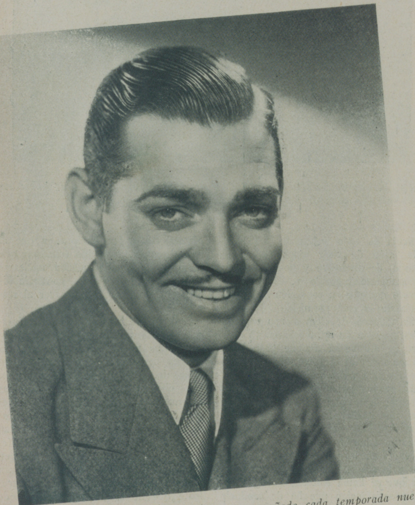
CLARK GABLE, el gran actor de la Metro que añade cada temporada nuevos laureles a su prestigio