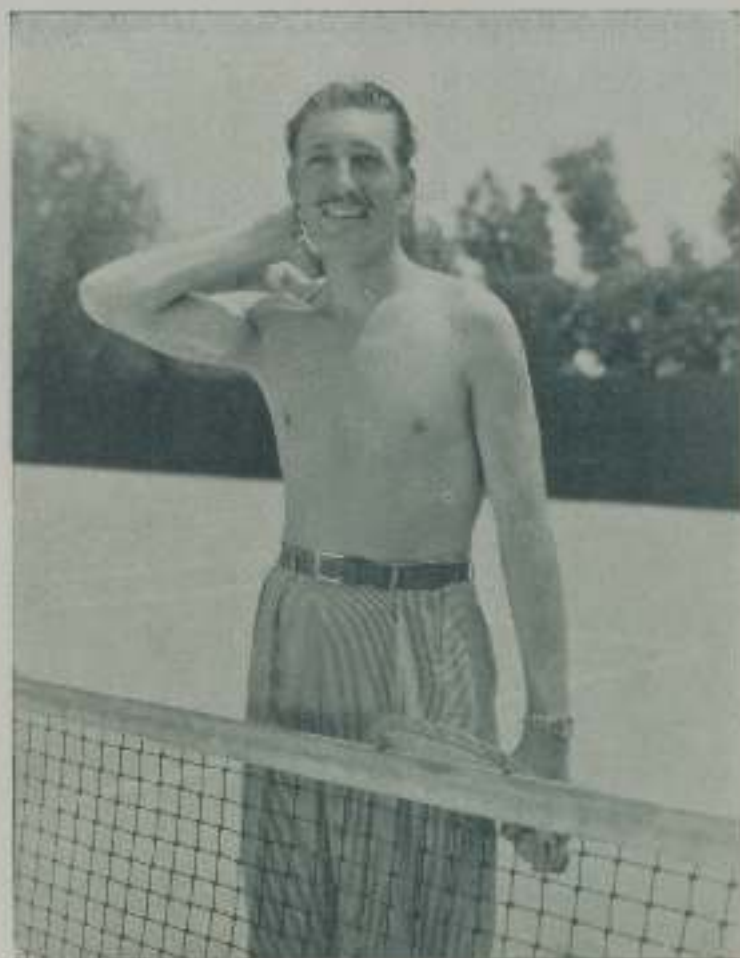
El tenis es uno de los deportes favoritos del actor de la Warner WARREN WILLIAM