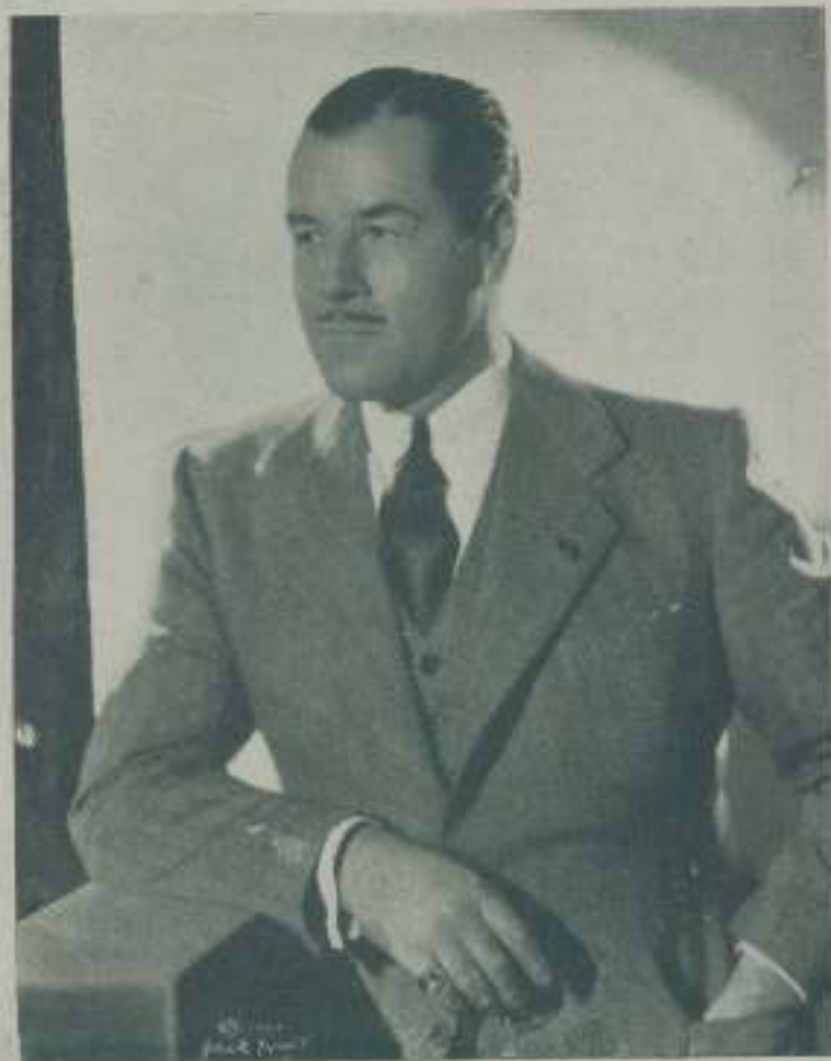
JACK HOLT, uno de los veteranos actores de la pantalla

"Para hacer películas, en España — al igual que en otros países cualquiera — es preciso contar con dinero. Y si se pretende hacer "buenas películas" hace falta contar además con "talento", es decir con cineastas que sepan cinema".