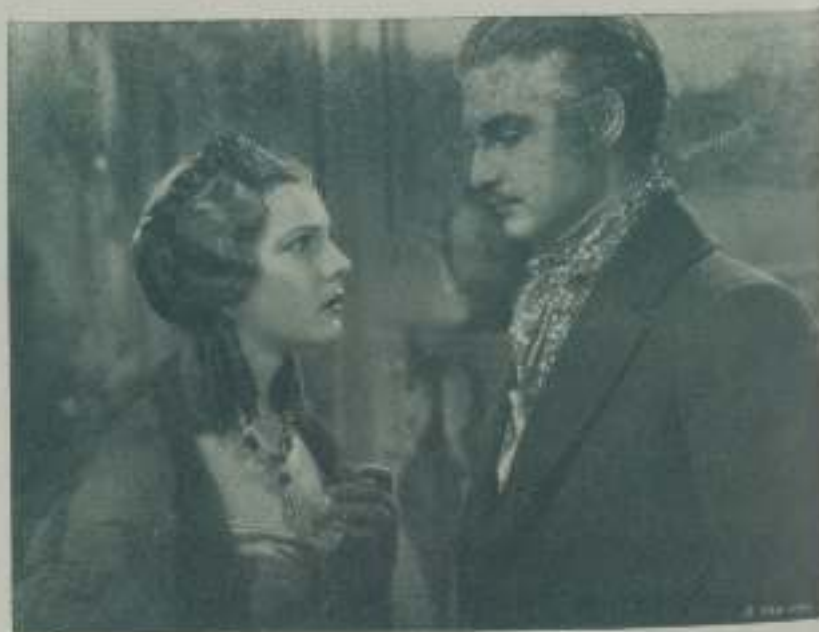
ROBERT DONAT y ELISSA LANDI protagonistas del film Artistas Asociados "El Conde de Montecristo"

Douglas Fairbanks se niega a hacer declaraciones a la prensa, por juzgar que no es el momento oportuno ni adecuado.