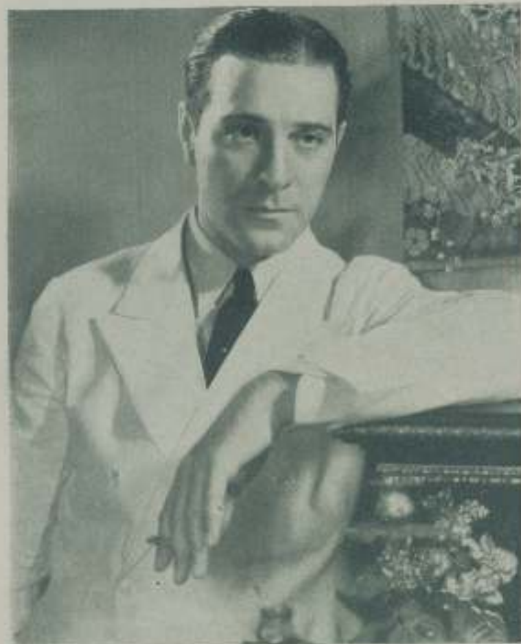
RICARDO CORTEZ actor de la Warner Bros.

Nadie diría que Ricardo Cortez, el eterno traidor, gangster y mala persona en la pantalla, cuando no gigolo antipático, sea un hombre de corazón. Nadie lo diría, desconociendo ciertos detalles dramáticos de su vida.