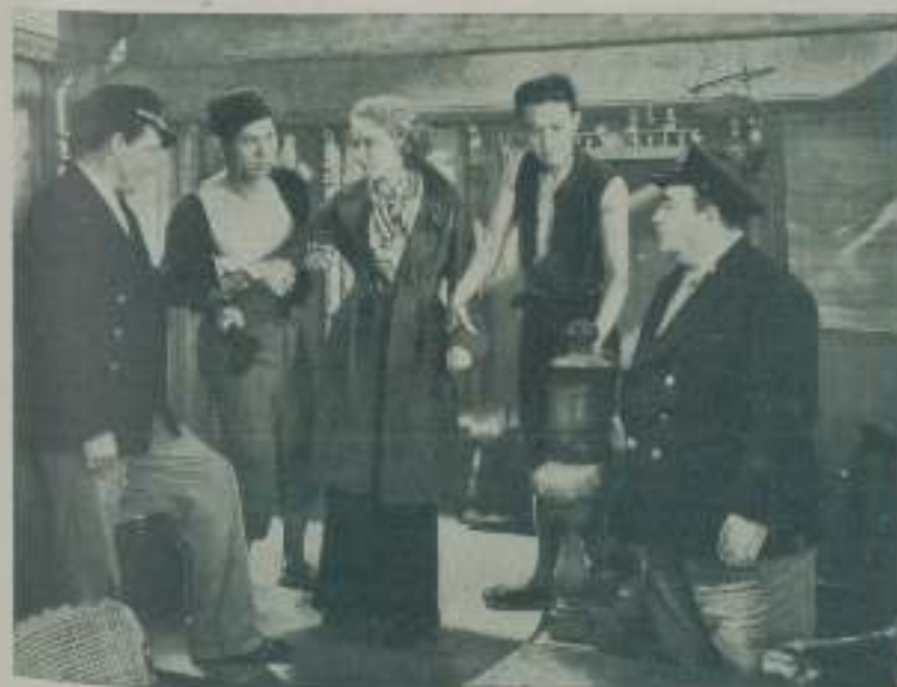
Una escena de "Lucy in Shanghai" de la Fox protagonizada por SPENCER TRACY y FAY WRAY