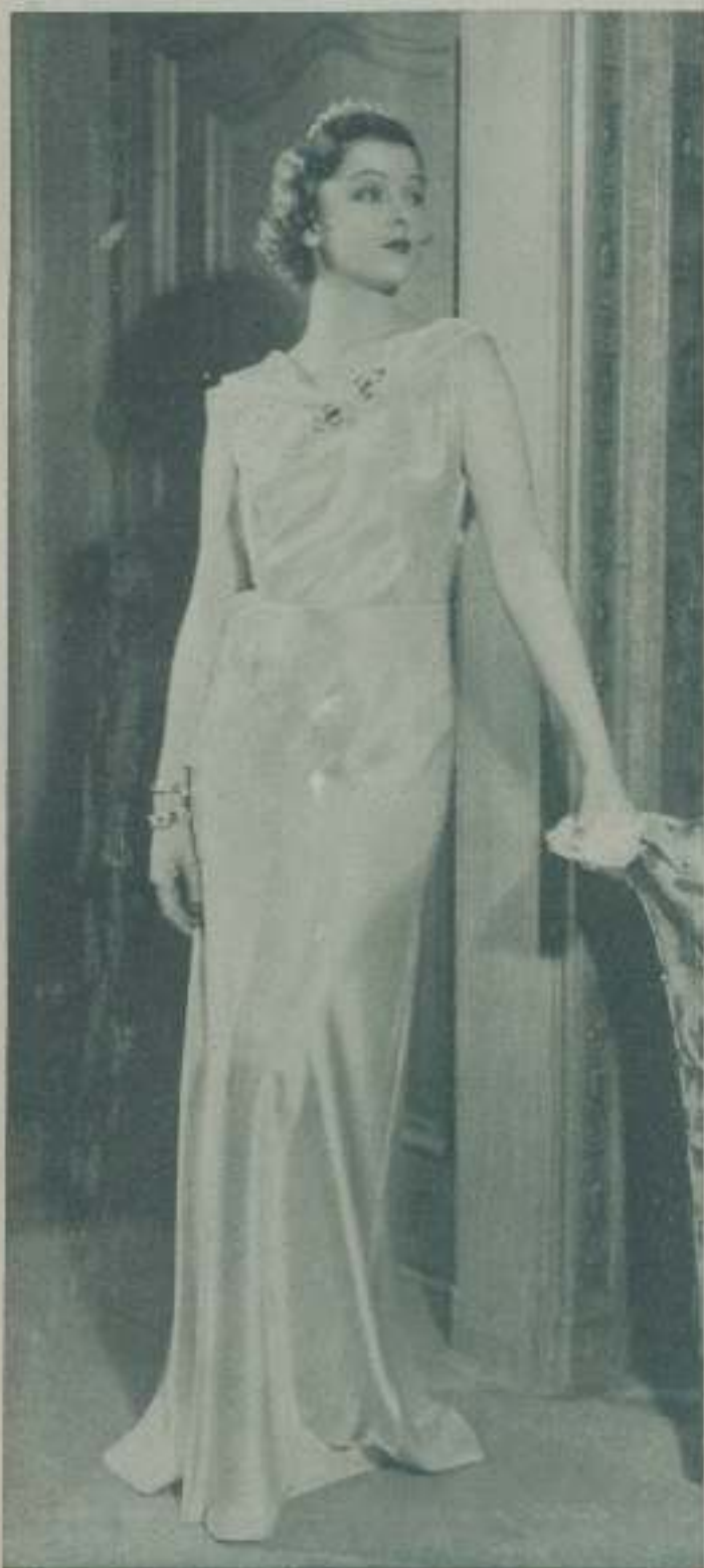
MYRNA Loy, bellísima mujer y admirable actriz de la M. G. M.

Myrna Loy, en la vida privada, es un chécc tranquilla y algo retraída, consagrada por completo a su carrera artística y enemiga del exhibicionismo.