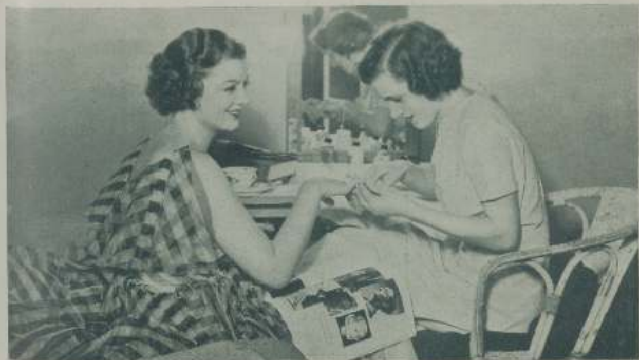
MYRNA LOY otra de las estrellas de la Metro que al sonreír cautiva