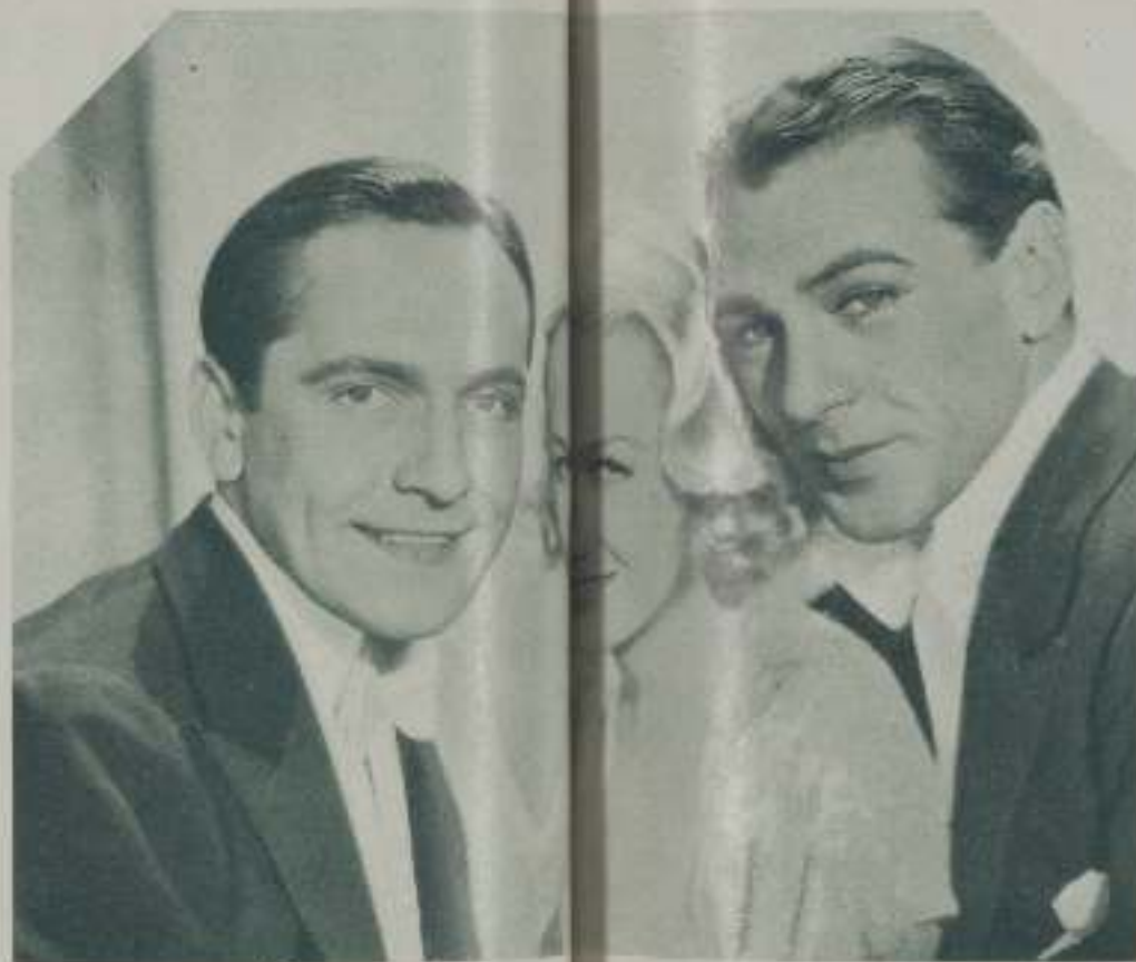
FREDERIC MARCH, MIRIAM HOPKINS y GARY COOPER en "Una mujer para dos" de la Paramount

No es que sintiera miedo alguno, ¿no le da usted cuenta? Tal como se me presentaba la vida y como jugaba yo en aquel entonces (era abondar mucho en ella, valga advertido), me encontraba satisfecho y tranquilo y muy a gusto con mi soltería. Del amor tenía la opinión aprendida en un libro francés, cito de Melchor de Vogué. Dice este autor que un gran amor, vamos, un amor perfecto, entra en la categoría de las obras maestras de la pintura o la escultura o las letras. ¿Cuántas generaciones han de pasar, preguntará él, para que nazca el pintor o el escultor o el escritor capaz de ejecutar una obra de este tamaño? Pues en el amor sucede lo mismo, contesta él. Sencillamente advierte que la dificultad es aún mayor, dado que no basta que existan los dos seres capaces de amar así; han de encontrarse y gustarse.