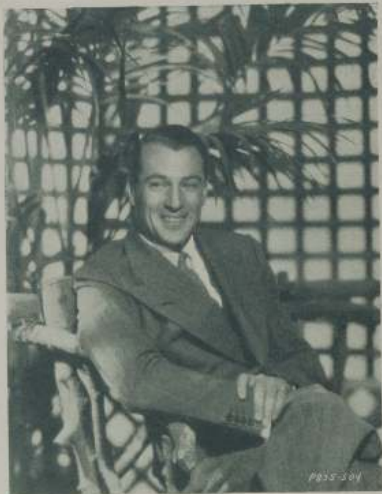
GARY COOPER en su residencia de San Fernando donde vive una luna de miel prolongada

Al caer de la tarde, cuando los oblicuos rayos del sol doran con normanle resplandor las copas de los árboles, donde el roce de las hojas suavemente mecido por la brisa y los últimos gorjeos de las pajarillas que buscan sus nidos forman desmayado y adormecedor murmullo; en la penetrante dulzura de esa hora en que el día que se aleja parece advertirnos con secretas voces que todo en la vida es runce fugitivo entre dos silencios, claridad momentánea entre dos sombras, Gary Cooper, cediendo por ventura al afán que lleva al dichoso a transcurrir en la copa frágil de lo presente los años pasados y los venideros, se complace en recordar, sintiéndose al lado de Sandra, sus tiempos de soltero; aquellos en que se proclamaba resueltamente decidido a no cambiar su libertad por el yugo de amor alguno y los otros, menos distantes éstos, en que comprometido ya a morir con la que hoy es su esposa,