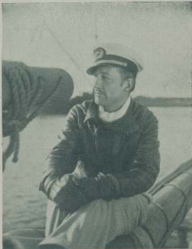
WARREN WILLIAM, excelente deportista, aprovecha sus ocios para cultivar en el Océano

Llega el camión de la Warner Bros a los estudios. Regresa de correos donde ha ido a recoger la correspondencia y viene cargado hasta el techo.