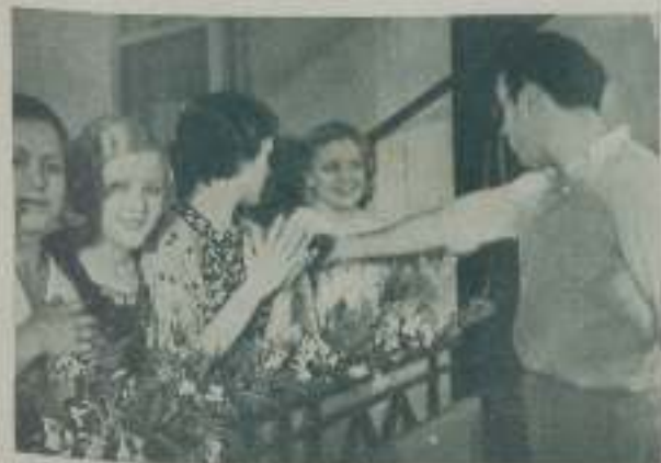
CASTELLVI indica a los artistas lo que han de hacer