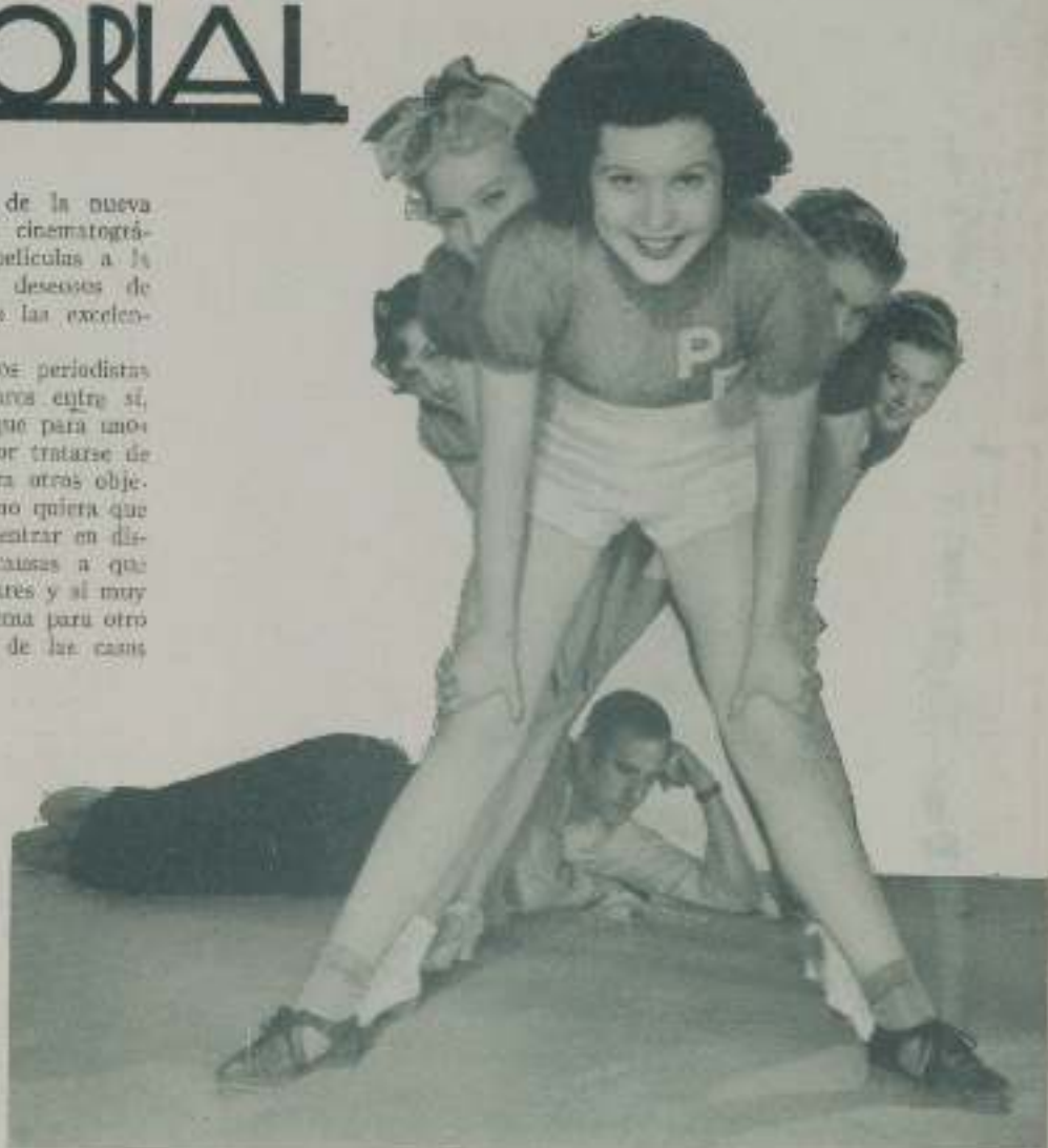
El grupo de extras de Chester Hale que actúan en las películas Metro

Indudablemente son los periodistas y empresarios tan dispares entre sí, que no es fácil que lo que para uno es motivo de negocio, por tratarse de films de público, sea para otros objeto de albanía; pero como quiera que no es nuestro propósito entrar en discusión exponiendo las causas a que obedecen gestos tan dispares y si muy otro vamos a dejar el tema para otro momento haciendo cita de las causas