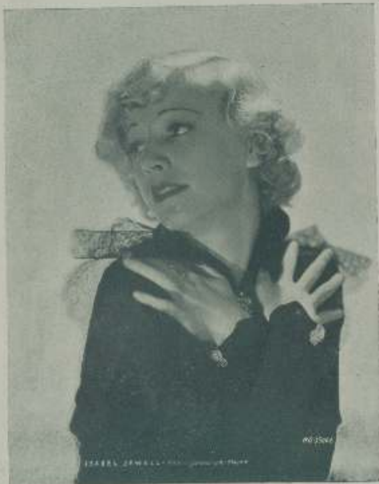
ISABEL JEWELL, bellísima actriz de M. G. M.

Es axiomático en Hollywood el valor de la sonrisa. Y con sobrada justicia, ya que hemos visto sonrisas que valen una fortuna en la taquilla.