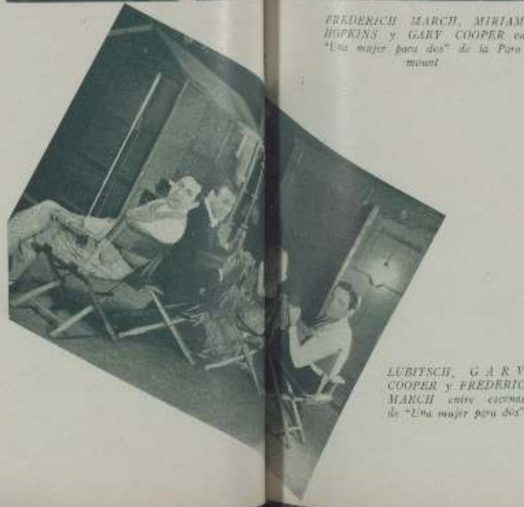
LUBITSCH, G. A. R. V. COOPER y FREDERIC MARCH entre escenas de "Una mujer para dos"

Siendo esto así, declamo yo, ¿quién te asegura a ti que, al casarte, ya has de ir en derechura al fracaso? Quédate, pues, como estás; que más vale no exponerte. Verdad es (y no ha de olvidarse esto en el recuento que le estoy haciendo), verdad es, digo, que a las veces sentía por allá, en lo más bueno, cierta duda que era como si otro yo, hablando dentro de mí, se enfrentara con el Gary Cooper que decía y repetía que no habría de casarse nunca, para reconocerse de este modo: "Pues, mira, todo será, pero la vida que llevo a anda conduce. Claro es que no te afligen grandes penas, que ni siquiera experimentas contradicciones o sinsabores como muchos (casados); pero, ¿dónde están tus grandes alegrías? ¿cuándo has sentido ese bienestar que entaste en otros? Vaya, vaya, confésalo, que desear con toda tu alma encontrar el amor, el sosiego por gozar del cual aunque fueras unos meses, serías capaz de exponerte a mucho, hasta a llevar después una vida de infierno".