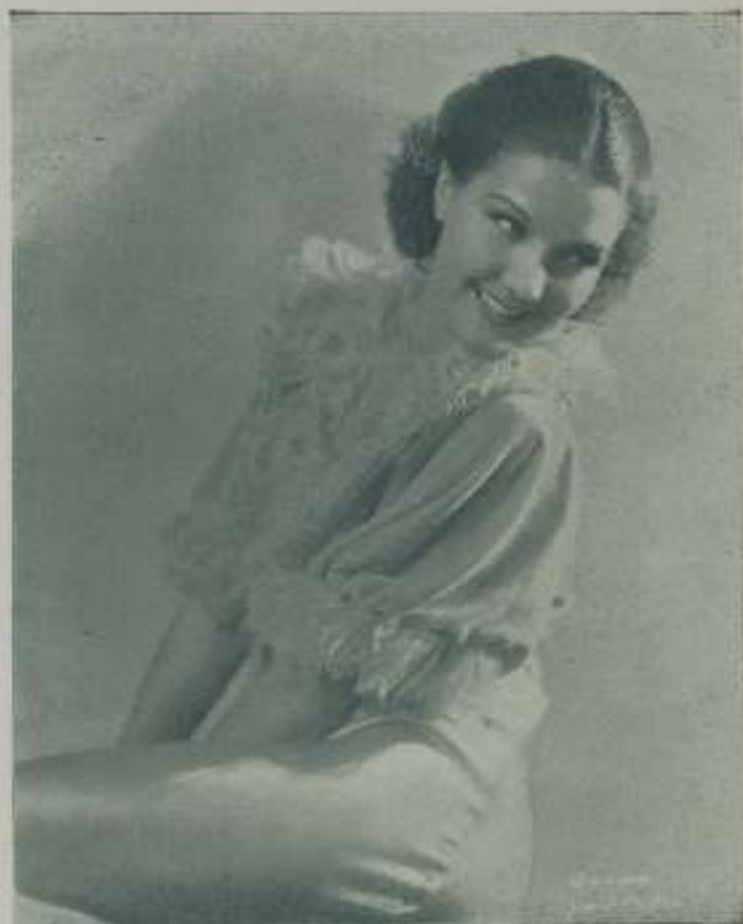
JEAN PARKER una de las artistas que posee la sonrisa más atrayente y jovial de Hollywood