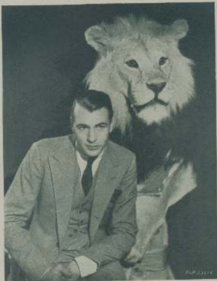
GARY COOPER sentado a los pies de una de las leonas talladas en su estancia al Africa y que fue diseñada por él mismo

—No le parecerá, como en efecto no lo es, ninguna gran cosa — advierte.