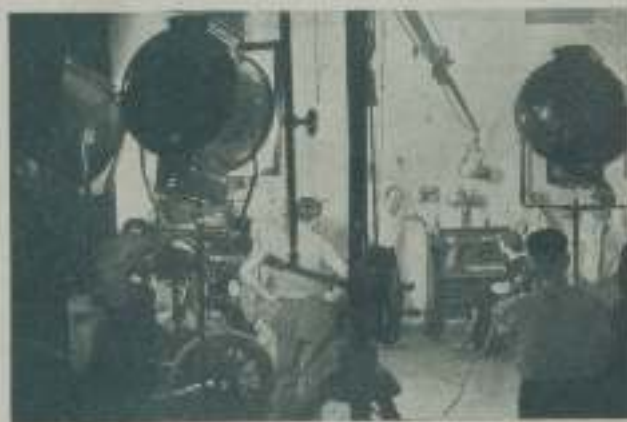
Un momento del rodaje de "Viva la vida"