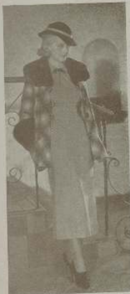
BETTY DAVIS, artista de la Warner que destaca en Hollywood

Sylvia Sydney tiene intención de hacer otro viaje a Europa tan pronto la compra de cuatro o cinco semanas de descanso.