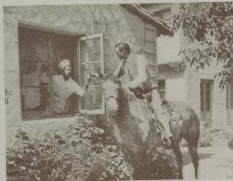
GARY COOPER el admirado astro de la Paramount que no logra perder sus aficiones primitivas

José Buchs viene dando muestras periódicamente de su escaso sentido del cinema y de su habilidad para conseguir dinero aunque realice películas. El último fruto de su actividad se titula "Dos mujeres y un Don Juan" y se exhibe actualmente en las pantallas españolas.