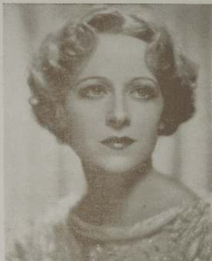
DOROTHY REVIER, guapísima artista de la Universal