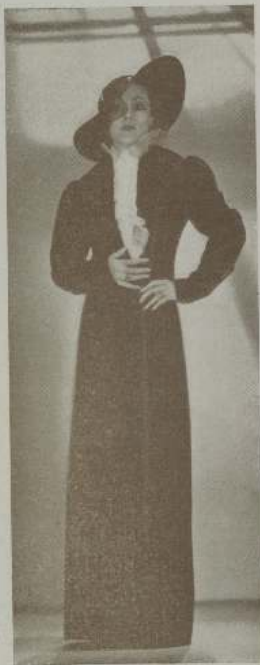
DOLORES DEL RÍO considerada en la actualidad como una de las mujeres más elegantes de Hollywood.

Pocas mujeres temperamentales, tan exultantemente sensibles como la bellísima Dolores del Río, han pisado los estudios cinematográficos americanos. Esta mujer, cuya vida ha sido una continua sucesión de contrastes, desde que emprendió la carrera cinematográfica, ha vivido en los últimos tiempos la vida ordenada y serena de su segundo amor. Necesitaba descansar, reposar un poco, ordenar el cúmulo de ideas que le zarandaban