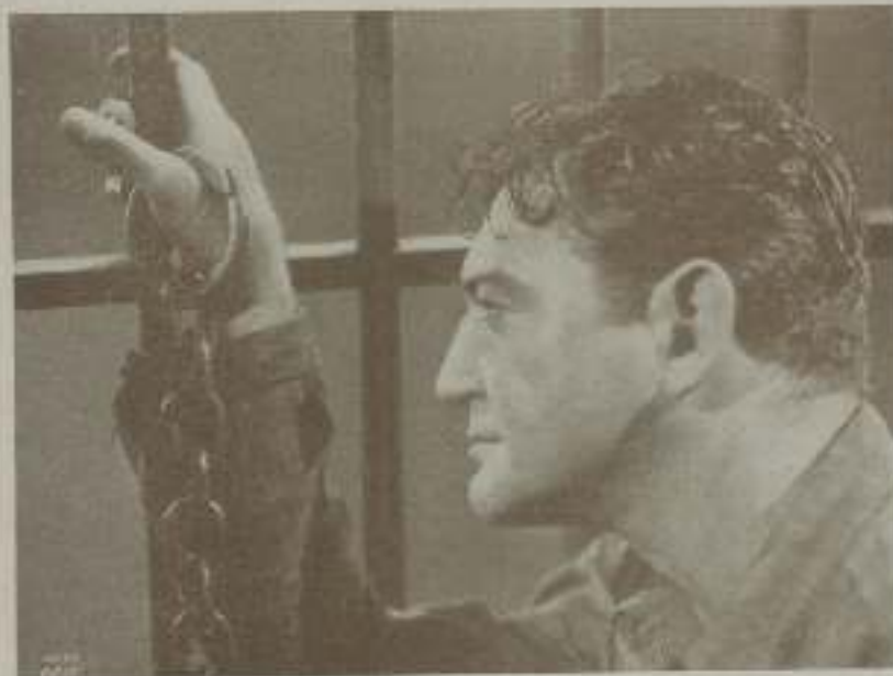
RICHARD DIX protagonista de "Los carreteros del Infierno" de la R. K. O. película basada en las experiencias de prisioneros en los campos aéreos de los Estados Unidos

Si ese hombre que ahora es nuestro héroe ilustre pasase junto a nosotras sin haberlo visto actuar, ni nos preocuparía, y posiblemente, aún y todo después de sentirnos inclinados hacia él, si lo conociésemos particularmente, dentro de la vida real, nos produciría un desengaño.