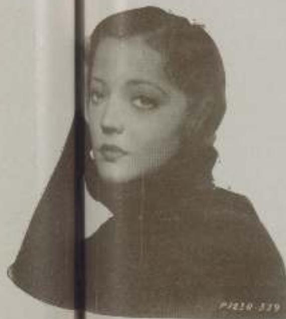
SYLVIA SIDNEY en el cine es más moderna en sus afirmaciones como corresponde a su temperamento

Severos en realidad, tan empalagosos los hombres? Verdaderamente,