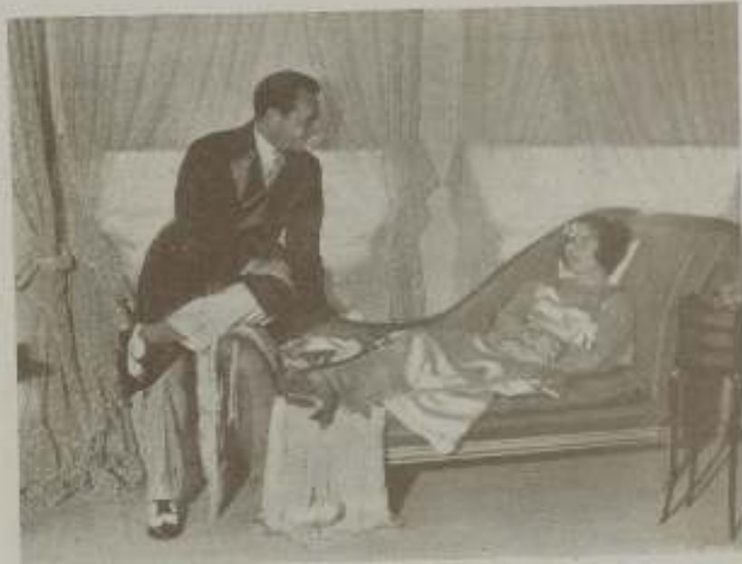
EDWARD G. ROBINSON el gran actor de la First National acompañado de su esposa en la cama recientemente adquirida por ellos en las cercanías de Los Angeles.

Friedrich March ha acordado de tal manera que el estudio le ha concedido un mes de permiso para que vuelva a "recuperar la ilusa" puesto que la Siglo XX lo quiere volver a Artistas Asociados para que actúe junto a Anna Sten en "Reconocida".