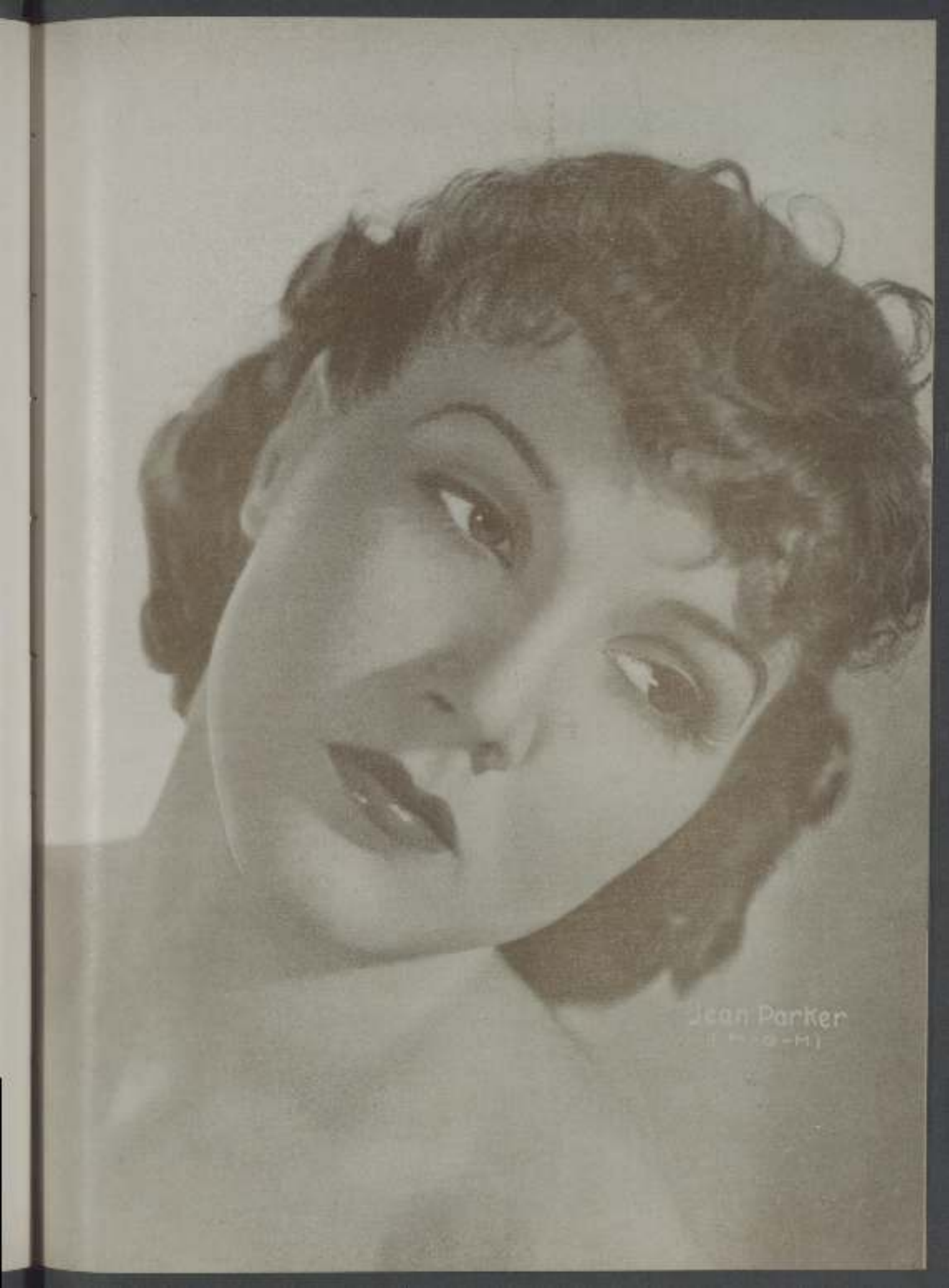
Jean Parker (1908-11)