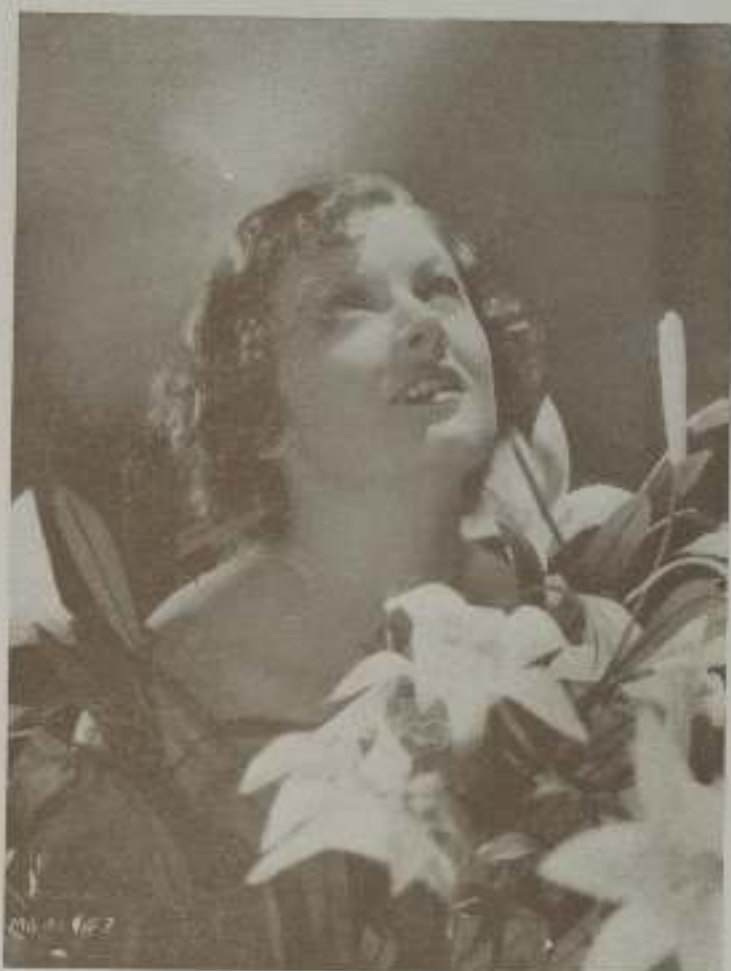
La belleza de MYRNA LOY y su gran talento artístico han contribuido a que le, M. G. M. intentó hacer de ella una de sus más afortunadas actrices.

"Acabados sus estudios, Myrna siguió el camino de la vida bajo la in-