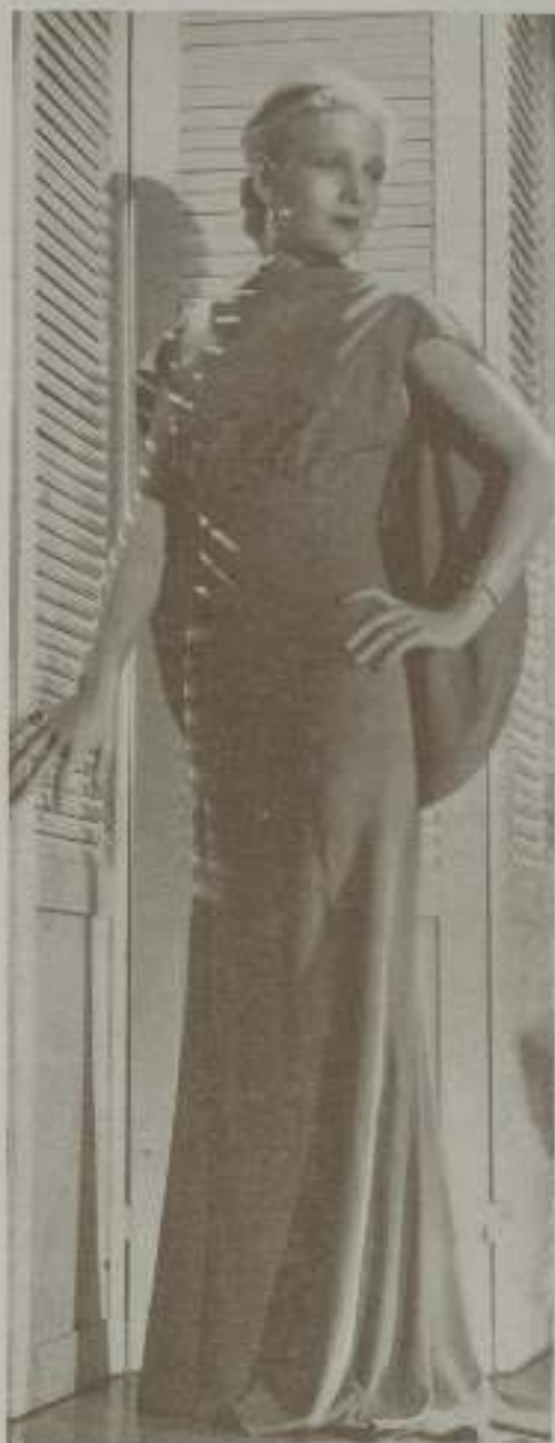
ANN HARDING desgarrada y poco cuidadosa de su belleza antes, se hoy, gracias a unos consejos, una mujer llena de personal atractivo