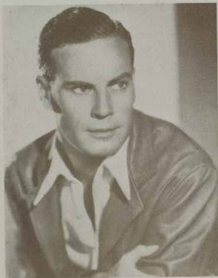
NORMAN FOSTER que cada día se halla más satisfecho de su matrimonio con Claudette Colbert

Cualquiera en su lugar lo estaría. Una mujer como Claudette Colbert, que a parte de su belleza es de una comprensión difícil de encontrar, no llega a nuestras manos todos los días y de esto se desprende que Norman Foster viva encantado del matrimonio porque a pesar de estar casado se halla fuera de sí.