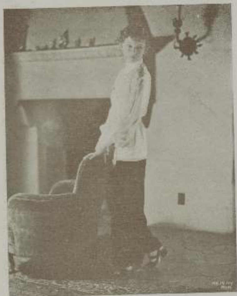
MYRNA LOY, actriz de la Metro, cuya exótica belleza, ha despertado tantas comentarios

Una bella actriz del cinema americano ha visto su imagen perpetuada en mármol, desde hace cinco años, constituyendo la figura central de un grupo alegórico situado frente al Colegio Politécnico de Los Angeles admirado cotidianamente por multitud de visitantes. Y, sin embargo, esa actriz no ha dicho palabra acerca de ello, por espacio de todo ese tiempo.