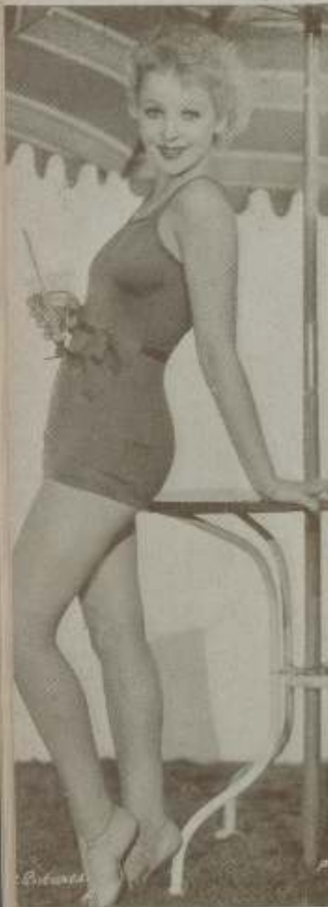
TOBY WING, deliciosa artista de la Paramount llena de modernas opiniones

Dichosa mujer que con su juventud y belleza comienza a vivir una vida llena de emociones. Quien pudiera lograr convencerla de que el amor es la sapientia dicha que puede encontrarse en la humanidad!