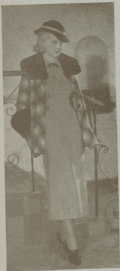
BETTE DAVIS, artista de la Warner que destaca en Hollywood

Sylvia Sidney tiene intención de hacer otro viaje a Europa tan pronto disponga de cuatro o cinco semanas de descanso.