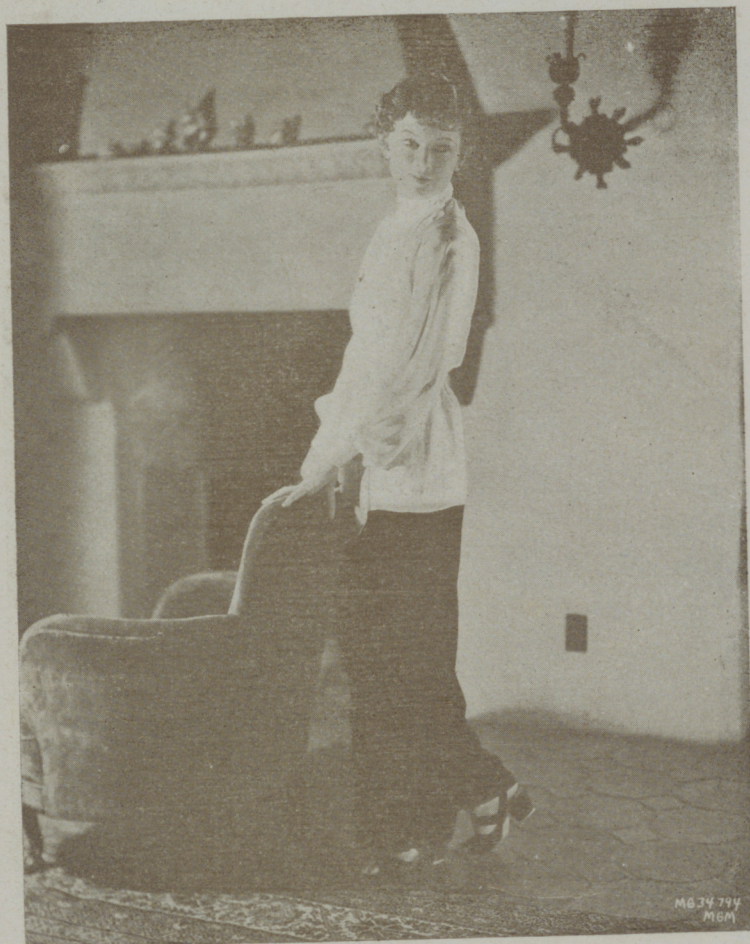
MYRNA LOY, actriz de la Metro, cuya exótica belleza ha despertado tantos comentarios

Una bella actriz del cinema americano ha visto su imagen perpetuada en mármol, desde hace cinco años, constituyendo la figura central de un grupo alegórico situado frente al Colegio Politécnico de Los Angeles admirado cotidianamente por multitud de visitantes. Y, sin embargo, esa actriz no ha dicho palabra acerca de ello, por espacio de todo ese tiempo.