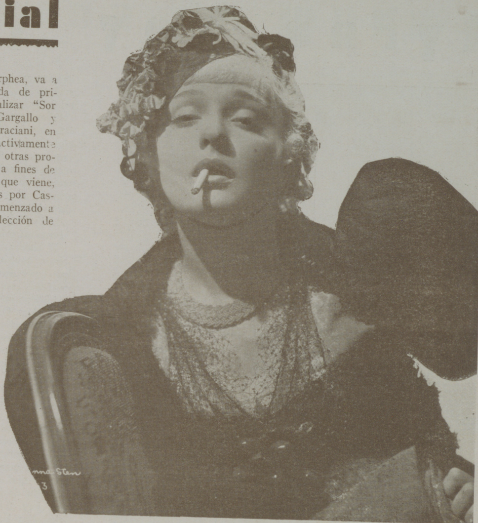
ANN STEN la bella artista rusa cuya interpretación del personaje de Zola "Naná" le está proporcionando ruidosos éxitos

En los estudios de la Orphea, va a dar comienzo la temporada de primavera. Acabadas de realizar "Sor Angélica" dirigida por Gargallo y "Aves sin rumbo" por Graciani, en los estudios se trabaja activamente para preparar el rodaje, de otras producciones que comenzarán a fines de este mes y principios del que viene, películas que serán dirigidas por Castelví y Cola que ya han comenzado a hacer pruebas para la selección de personajes.