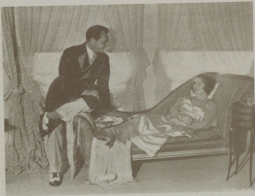
EDWARD G. ROBINSON el gran actor de la First National acompañado de su esposa en la casa recientemente adquirida por ellos en las cercanías de Los Angeles

Frederick March ha engordado de tal manera que el estudio le ha concedido un mes de permiso para que vuelva a "recuperar la línea" puesto que la Siglo XX lo piensa ceder a Artistas Asociados para que actúe junto a Anna Sten en "Resurrección".