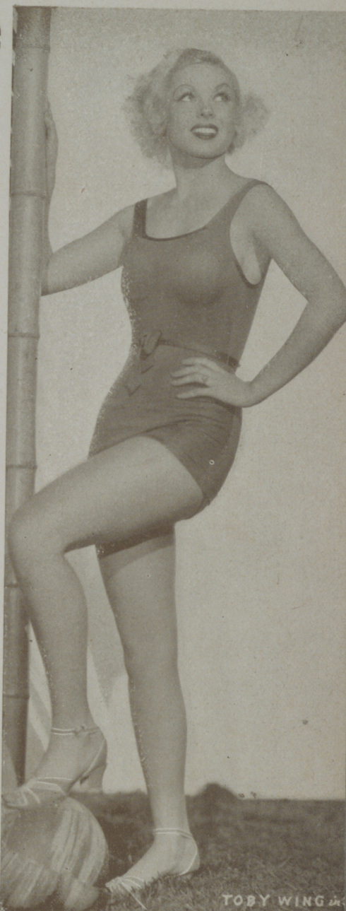
Traviesa y bonita TOBY WING es el prototipo de la mujer moderna

—Eso mismo. Pero eso es más difícil que pescar un tiburón en la playa. Los hombres se preocupan siempre de ellos y nunca de nosotras. Yo por eso prefiero amigos, amigos que me consideren como tal y que no vean en mí mas que a una camarada