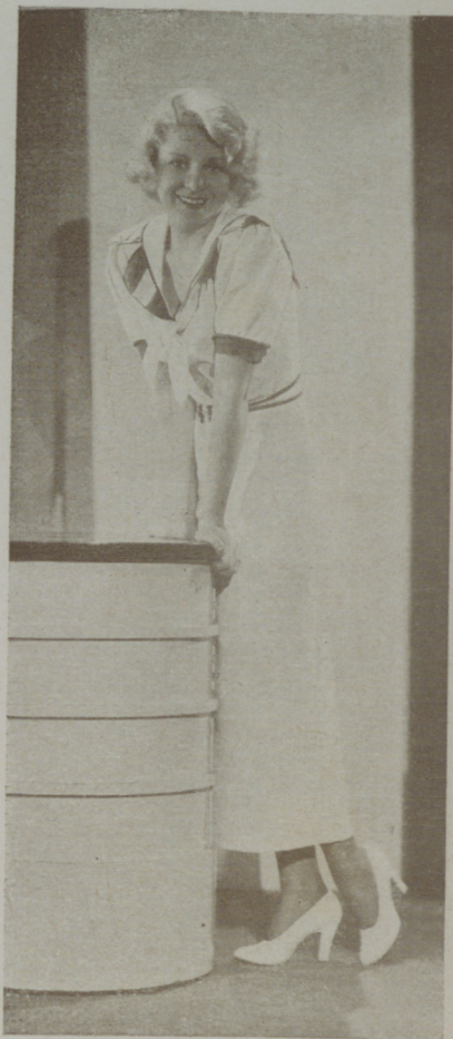
CLAIRE TREVOR bellísima artista de la Fox

Katherine Hepburn, caprichosa como siempre, se negó a recibir a la prensa a su llegada a París, causando no pocos contratiempos al estudio, que, a su regreso a Estados Unidos, la amenazó seriamente, amenazándola con romper su contrato si ponía tantas dificultades a la prensa, a quien debe tan señalados favores. Katharine nada contestó, pero,