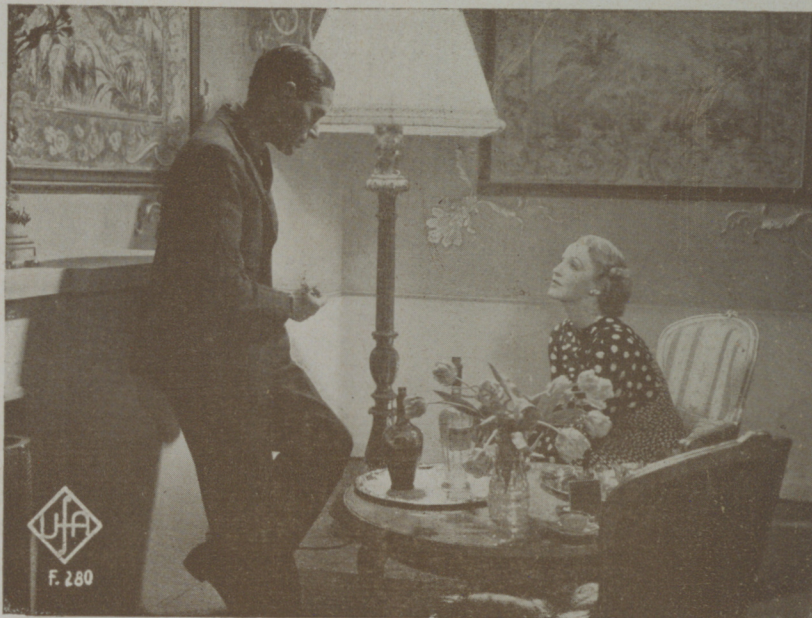
BRIGITTE HELM y PIERRE BLANCHARD en una escena de la producción Ufa "El oro"

Pero el espectador medio, un poco perezoso, digería descuidadamente las píldoras que tan hábilmente doraban los productores de films, sin preocuparse de reaccionar y buscando únicamente una distracción o un embota-