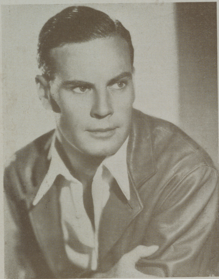
NORMAN FOSTER que cada día se halla más satisfecho de su matrimonio con Claudette Colbert

Cualquiera en su lugar lo estaría. Una mujer como Claudette Colbert, que a parte de su belleza es de una comprensión difícil de encontrar, no llega a nuestras manos todos los días y de esto se desprende que Norman Foster viva encantado del matrimonio porque a pesar de estar casado se halla fuera de él.