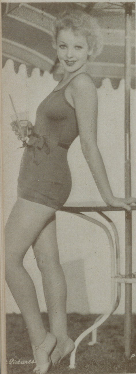
TOBY WING, deliciosa artista de la Paramount llena de modernas opiniones

Aunque hombre observador que ha ido dándose perfecta cuenta del des-envolvimiento sensitivo de la mujer, no opino como esas criaturas que con las piernas al aire, el cabello recortado y rubio, falda ceñida y mucho rojo en los labios, andan por esos mundos de Dios convencidas de que el sexo opuesto no tiene gran atracción y dedicadas especialmente a las tareas que hasta hace poco eran propias de los hombres.