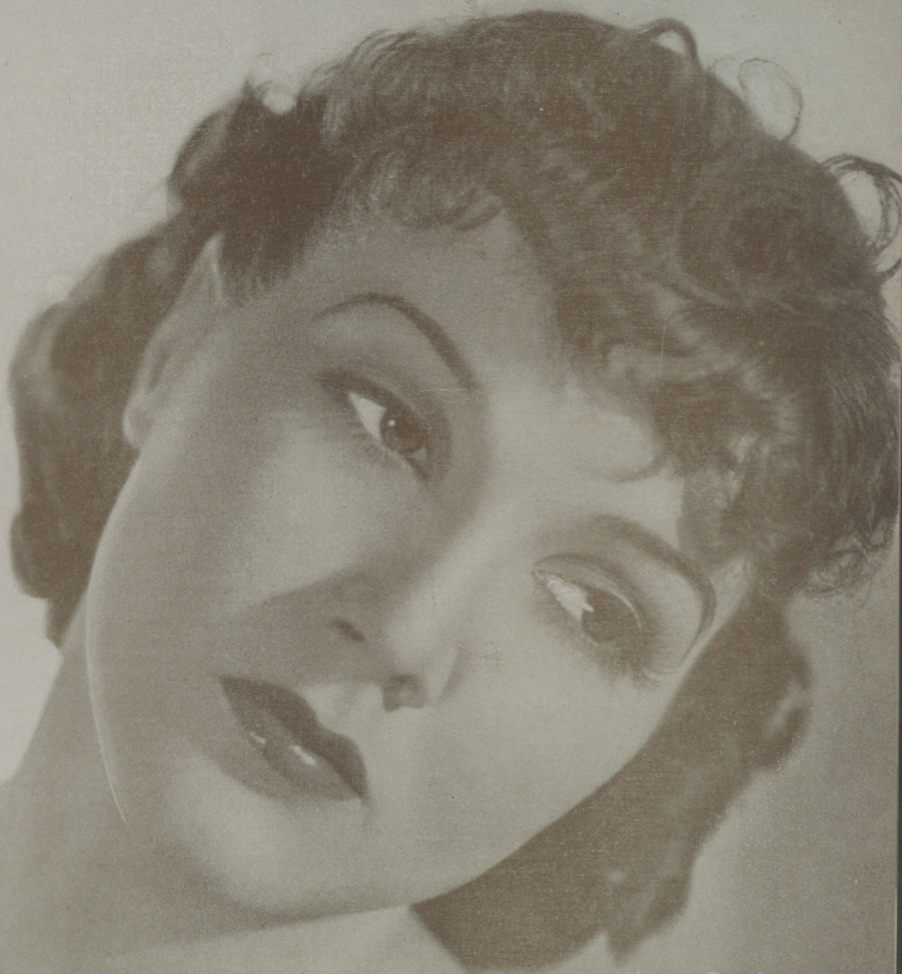
Jean Parker