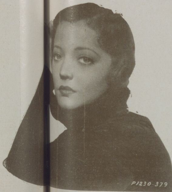
SYLVIA SIDNEY en cabio es más moderada en sus afirmaciones como corresponde a su temperamento

Seremos, en realidad, tan empalagosos los hombres? Verdaderamente,