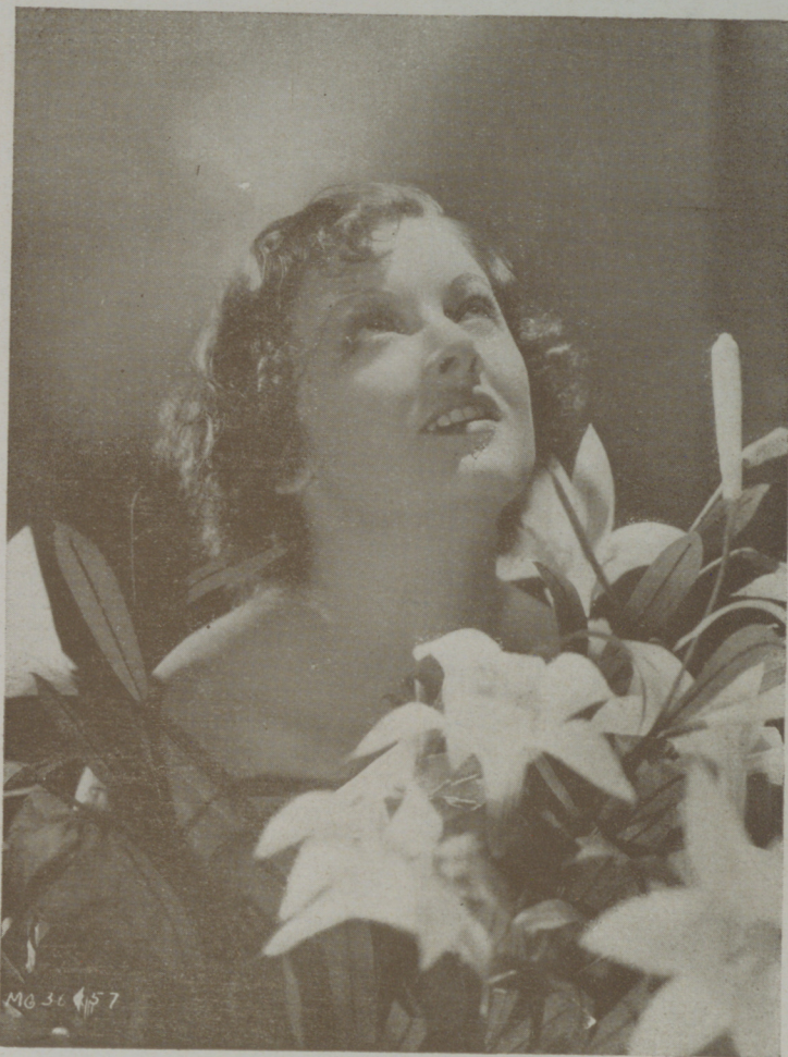
La belleza de MYRNA LOY y su gran talento artístico han contribuido a que la M. G. M. intente hacer de ella una de sus más acreditadas actrices

"Acabados sus estudios, Myrna siguió el camino de la vida bajo la ins-