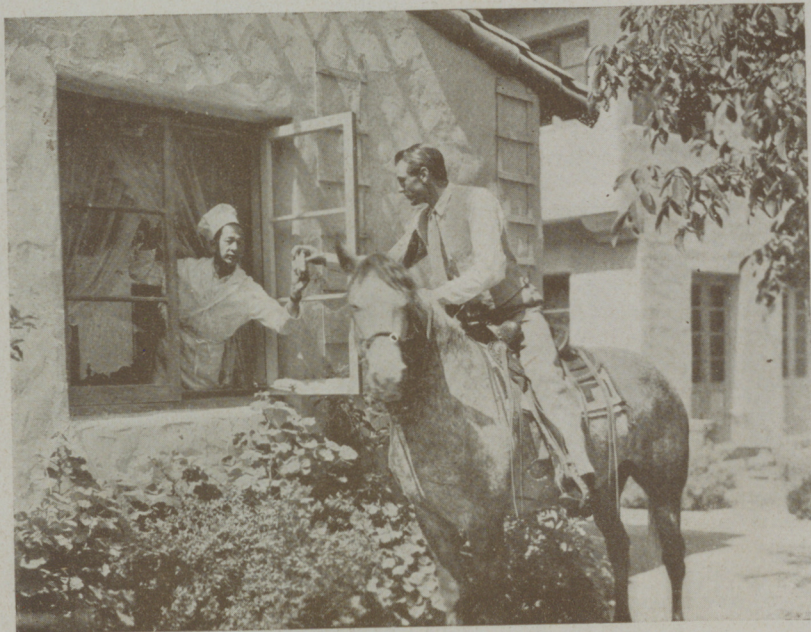
GARY COOPER el admirado astro de la Paramount que no logra perder sus aficiones primitivas

José Buchs viene dando muestras, periódicamente de su escaso sentido del cinema y de su habilidad para conseguir dinero conque realizar películas. El último fruto de su actividad se titula "Dos mujeres y un Don Juan" y se exhibe actualmente en las pantallas españolas.