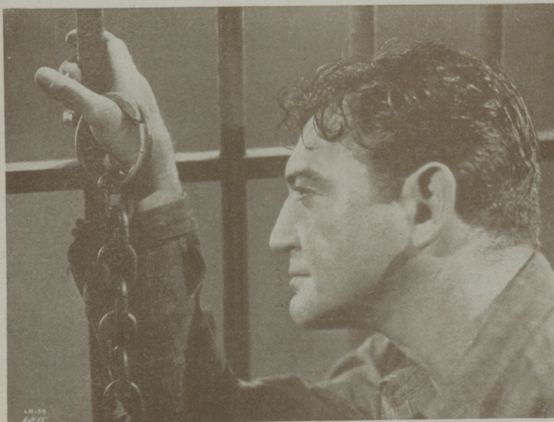
RICHARD DIX protagonista de "La carretera del Infierno" de la R. K. O. película basada en las experiencias de presidiarios en los campos ucranianos de los Estados Unidos

Si ese hombre que ahora es nuestro héroe ilusorio pasase junto a nosotras sin haberlo visto actuar, ni nos preocuparía, y posiblemente, aún y todo después de sentirnos inclinados hacia él, si lo conociésemos particularmente, dentro de la vida real, nos produciría un desengaño.