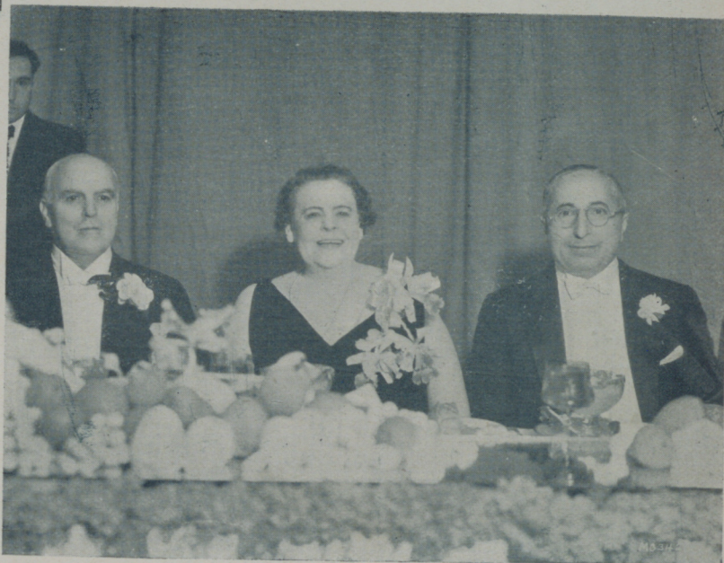
Presidencia del banquete ofrecido por la M. G. M. en honor de MARIE DRESSLER al cumplir 62 años. James Ralph, Gobernador de California, y Louis B. Mayer, están a su izquierda y derecha respectivamente

A pesar de sus sesenta y dos años, edad extraordinaria para el cinematógrafo, Marie Dressler continúa siendo una de las primeras figuras del séptimo arte y a medida que transcurre