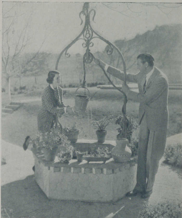
GARY COOPER, el muchachote de Montana que por fin ha logrado hallar la felicidad en Hollywood, acompañado de su esposa SANDRA SHAW

—Jamás creí que el hogar pudiera proporcionar tan íntimas satisfacciones — nos dice ahora sonriendo. — Todo en él es templanza, está exento de egoísmos y las horas te transcu-