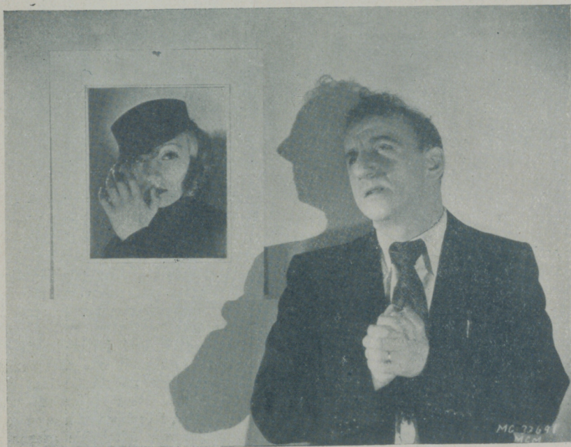
JIMMY DURANTE, el gracioso actor de la Metro, admira sinceramente a GRETA GARBO

Periódicamente (cada dos años aproximadamente), la poderosa organización publicitaria que sirve los intereses del cinema americano conquista la popularidad en el mundo entero, mucho antes de la llegada de los primeros films en que intervienen, a nuevos descubrimientos de la pantalla; a nuevas estrellas cuya fotografía aparece en todas las publicaciones y cuyo nombre pronuncian casi correctamente todos los fanáticos del cinema, antes de haberlas visto en film alguno.