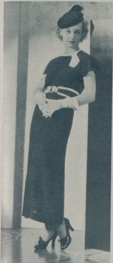
BETTE DAVIS de Warner Bros, luciendo elegante conjunto de tarde

La encantadora Madge Evans ha ido cedida de nuevo a la Fox para "Grand Canary".