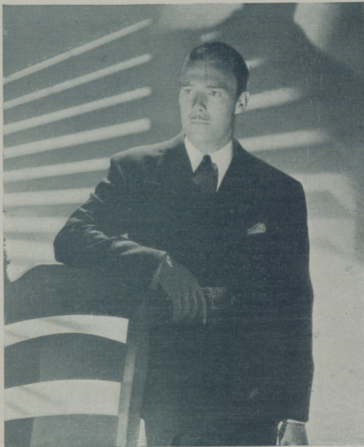
RANDOLPH SCOTT sorprendido por el fotógrafo en su casa