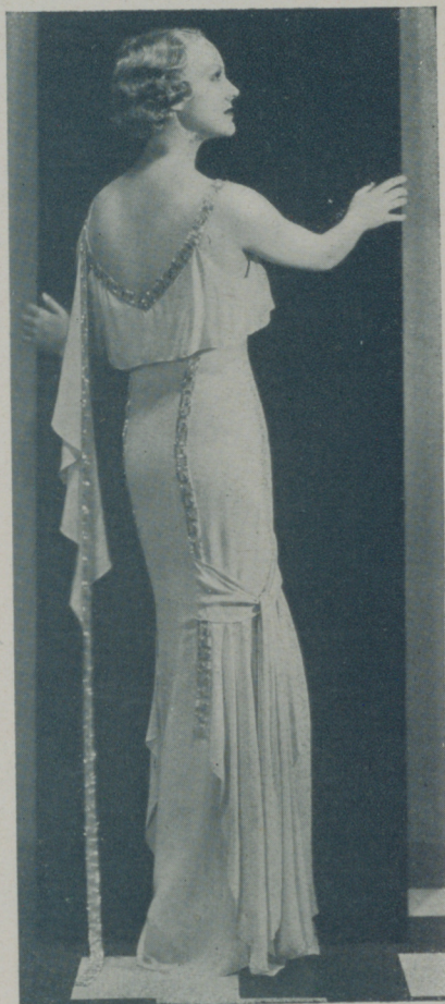
CLAIRE DOOD de Warner Bros con original traje de noche

La Paramount ha pedido el préstamo de la actriz Lilian Harvey a la Fox por considerar que sería la protagonista ideal para la obra "Gaby Desly" que van a llevar a la pantalla en breve.