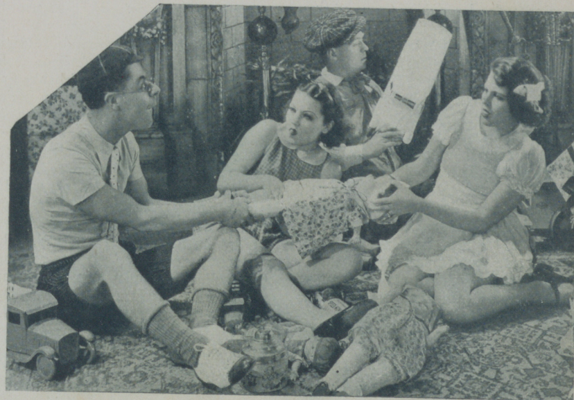
Pero entre tanto se entretienen a jugar a novios que acostumbra a ser lo que más les gusta a las niñas.

Porque fíjese el lector en la otra fotografía que incluyo a este pequeño trabajo y dese cuenta de que cómo se desarrollan estas mujercitas menudas que Hal Roach convierte en actrices. Mujer más admirable apenas podríamos encontrar. Esbelta de líneas, de proporciones que son un canto al ritmo, con piernas fuertes y modeladas con perfección manifiesta. Así son las mujeres que vimos ayer corretear por los estudios cinematográficos haciendo películas como actores de la pantalla. Los chiquillos de ayer se han convertido en hombres y las chiquillas en maravillosas mujeres como la que ilustra la página.