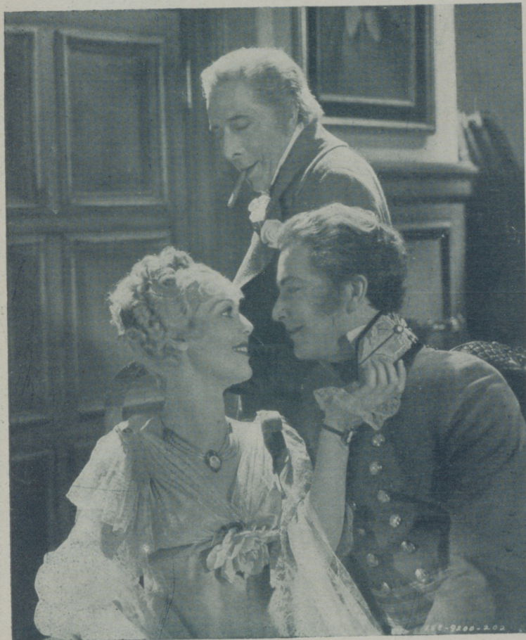
LORETTA YOUNG, ROBERT YOUNG (no son parientes) y GEORGE ARLIS en una escena de la grandiosa película "La casa de Rothschild" de Siglo XX que distribuye Artistas Asociados

Las películas históricas están a la orden del día. Y como cada vez que un género determinado consigue en el cinema un éxito evidente, se multiplica hasta la saciedad. Menos mal que estamos ahora al principio de esa boga y por lo tanto, en los momentos en que todavía puede mantener un tono inteligente.