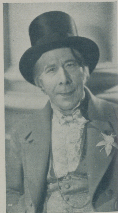
GEORGE ARLIS caracterizado para el film

Compre Vd. "REPORTAJE FILM" en kioscos, 30 céntimos