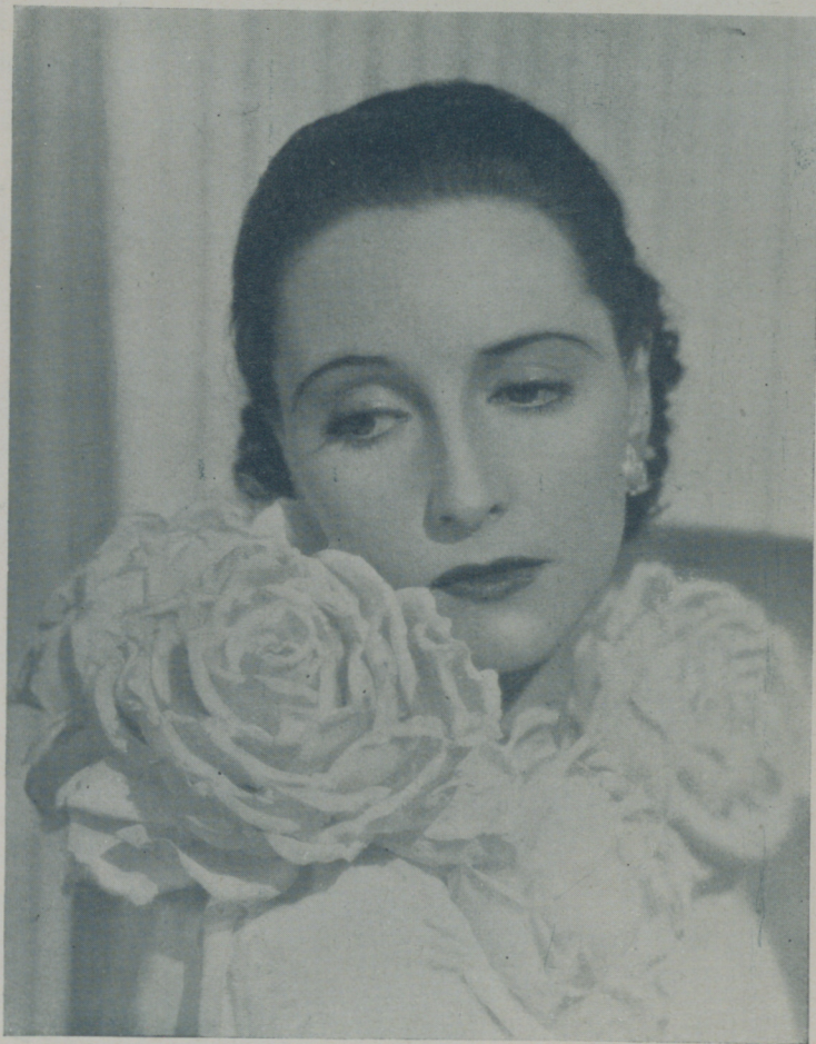
DOROTHEA WIECK, la gran actriz suiza que actualmente trabaja en Hollywood

Después de "Muchachas de uniforme", Dorotea quedó marcada por el papel que en este film interpretó. Su trayectoria artística quedaba desviada.