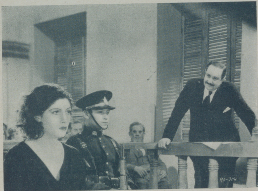
Una escena de la cinta mejicana "Una vida por otra" que distribuye Filmófono en España

Aunque parezca mentira, el anunciado propósito de proteger al cinema español por parte de nuestro Gobierno, tiene numerosos enemigos. Unos son distribuidores para quienes los beneficios que obtienen importando películas extranjeras son tan considerables que, naturalmente, temen el cambio de situación que una legislación nueva pudiera producir. Otros, empresarios, alegan que la mala calidad de los films nacionales ahuyenta a los espectadores de las salas.