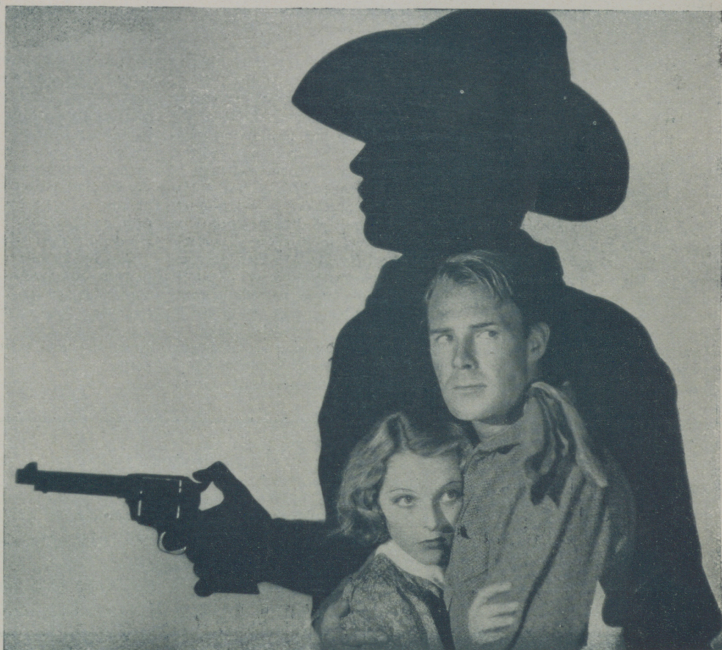
RANDOLPH SCOTT y la deliciosa SALLY BLANE en una escena del film Paramount "El legado de la estepa"

TODO CUANTO SUCEDE EN HOLLYWOOD DE SENSACIONAL PODRA USTED SABERLO EN DETALLE ADQUIRIENDO "EL CINE" QUE ES EL DE MAS COMPLETA Y VERAZ INFORMACION