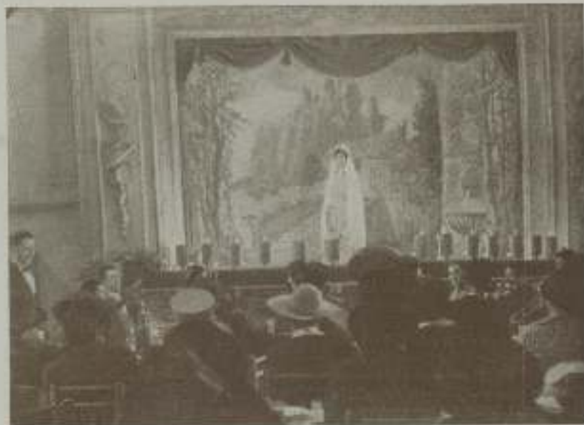
Interior realizado en los estudios de Madrid y que es uno de los aditamentos de la "Doña Francisquita" cinematográfica.

Esperamos pues, poder reseñar en breve el éxito que, indudablemente, ha de conseguir nuestra primera gran producción "Doña Francisquita" que, ha de marcar un verdadero hito en nuestra naciente cinematografía.