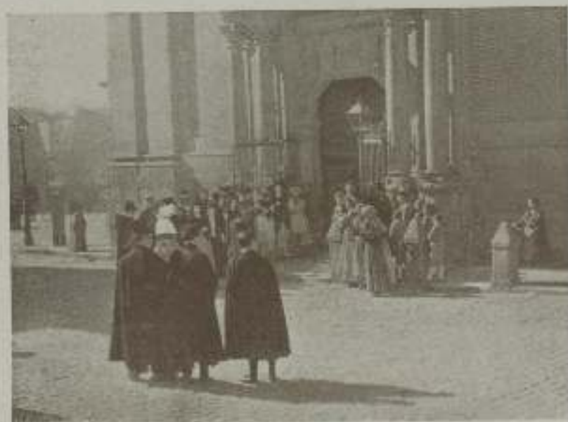
Una escena llena de ambiente de "Doña Francisquita" de Ibérica Film.

Por fin, la obra cinematográfica que más comentarios ha despertado durante su filmación, y en que ha puesto sus esperanzas Ibérica Film va a estrenarse en nuestra ciudad. La afición española con entusiasmo y es debido a que hasta la fecha las producciones realizadas en España, acogidas todas ellas con verdadero cariño por el público, han sido deficientes más que por inteligencia y buena voluntad, por falta de medios.