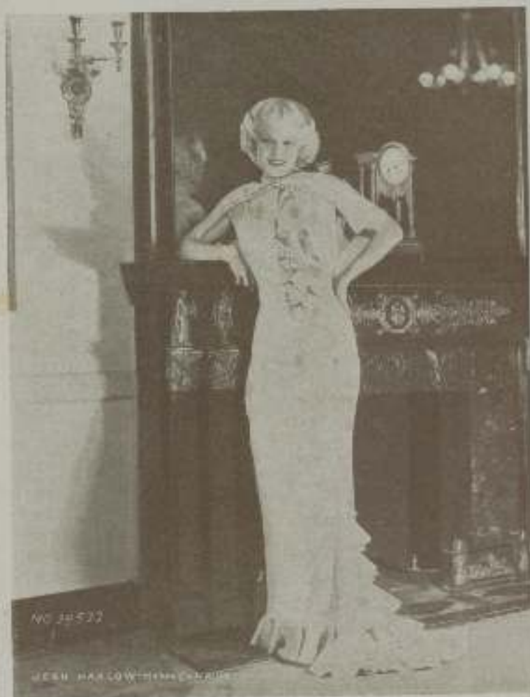
JEAN HARLOW, la estrella de M. G. M., cuya desecada personalidad la ha elevado a las cumbres de la fama.

Los grandes inconvenientes como ficción para llegar al pínaculo de su carrera luchan las artistas cinematográficas está lleno de arbores. La mayoría de las que comienzan actuando en los estudios ven que pasan los días sin conseguir destacar, ya ver que tras la producción realzada les llega el pequeño papel que ha de ser el comienzo de su carrera, la primera afirmación de su personalidad.