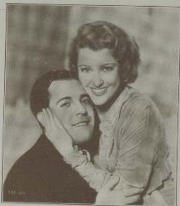
RAMÓN NOVARRO Y JEANETTE MACDONALD en "El gato y el violín"

La elegante figura de la protagonista de "El desfile del amor", travante y llena de movilidad, su voz dulce, su belleza incomparable destacan en la obra con vigor, afirmándose una vez más en la cate-