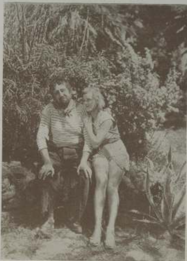
RAIMU y MARIE GLORY en una escena de “Carlomagno” de Selecciones Filmófono

Memos mezclada a propósito al Raimu privado con el Raimu de la pantalla. En el cinema Raimu ha encarnado personajes opuestas de una manera magistral. Pero en “Carlomagno”