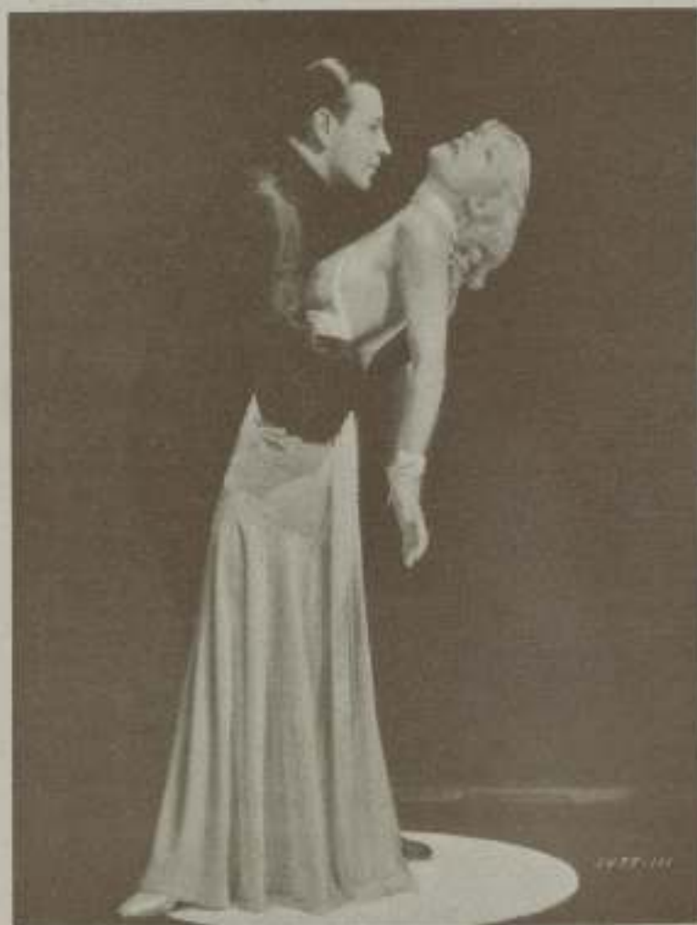
CAROLE LOMBARD y GEORGE RAFT en una apasionada escena de "Boleto de la Paramount"

Carole Lombard pertenece al número de actrices que conquistan admiradores no solamente como tales sino en el trato diario. Lo primero que llama la atención a quien la conoce fuera del estudio cinematográfico es el contraste entre su delicada belleza rubia y su carácter, el cual, sin dejar de ser muy femenina, es de una igualdad casi desconcertante. No hay en ella ni remota traza de miseria y la niñería, por no decir nada de la disposición voluntariosa y de los caprichos no siempre razonables que parecen en no pocas ocasiones constantes compañeros de la belleza y de la fama,