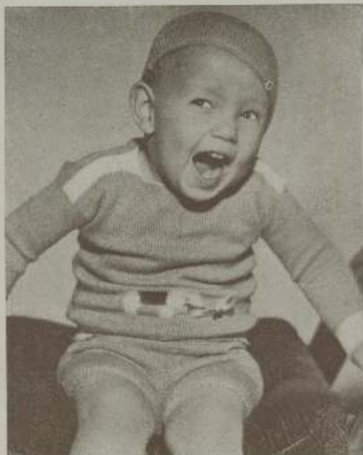
BABY LE ROY, el pequeño actor de la Paramount que sabe reír con toda gracia para sus admiradores.

—Mami, mami — le dice a su mamá el simpático mocoso cuando, en el cine, se reconoce a él mismo. — Soy yo, soy yo.