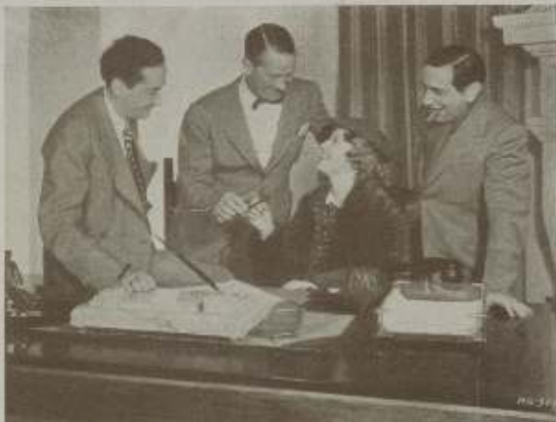
Instante en que JEANETTE MAC DONALD entrega la pluma a CHEVALIER para firmar contrato con M. G. M. a cuya editora pertenecen ya ambas artistas.

Adrian ha regresado a Nueva York muy satisfecho porque no está acostumbrado a llevar sobretodo. Las estrellas encantadas de que el famoso modisto de la M. G. M. no haya sen-