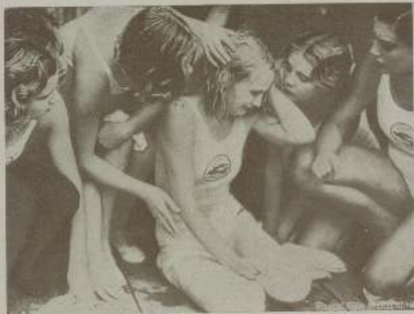
Emocionante escena de "Los 8 golandrines"

Carole Lombard es, según mi juicio, la mujer más hermosa del mundo, y una de las más inteligentes y simpáticas.