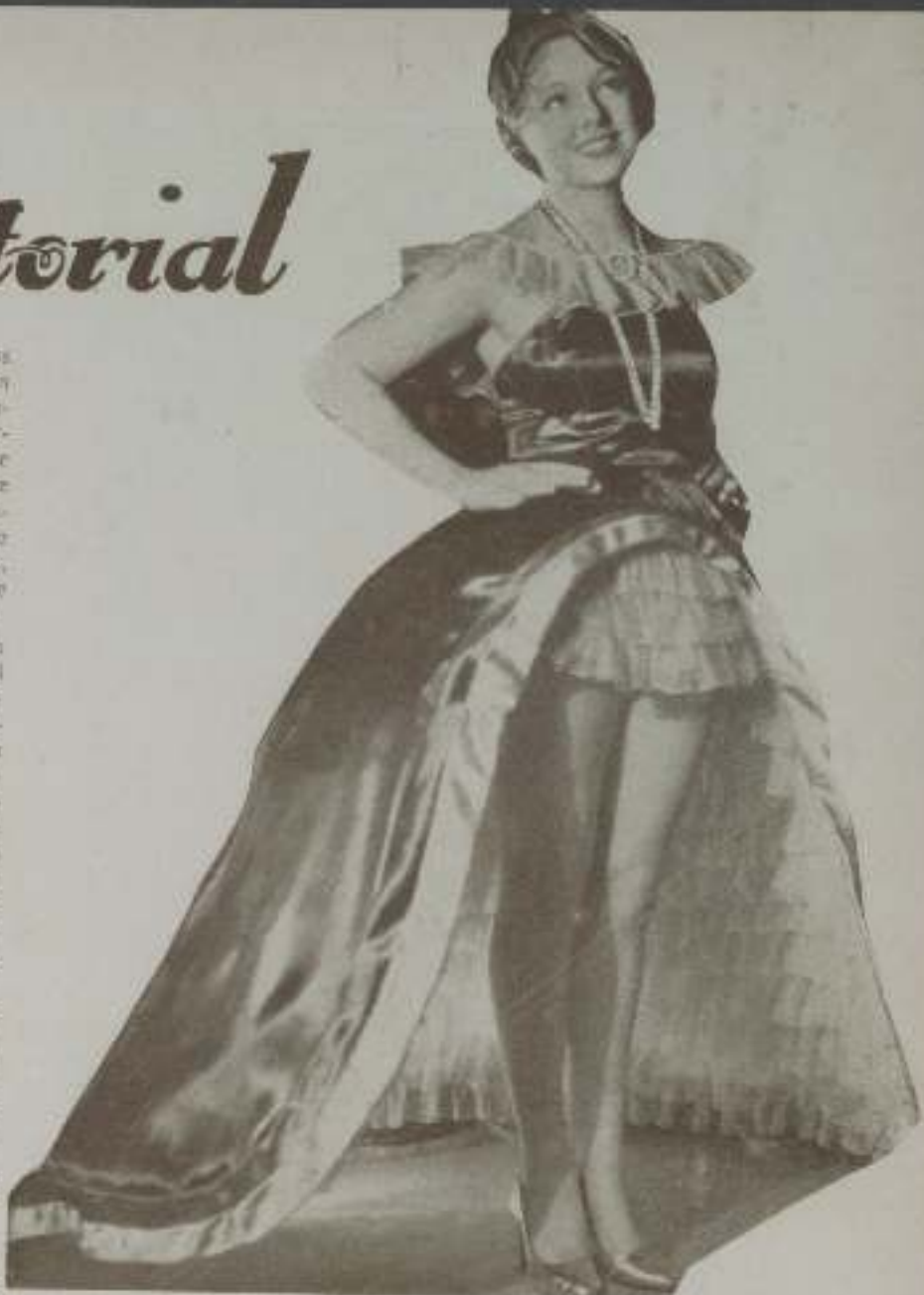
PAULETTE GODDARD, admirable actriz de la Ufa, llena de juventud y de exquisita belleza.

No es que queramos decir de una manera categórica que no haya españoles que dejen de preocuparse de problema tan importante. Muchos hay,