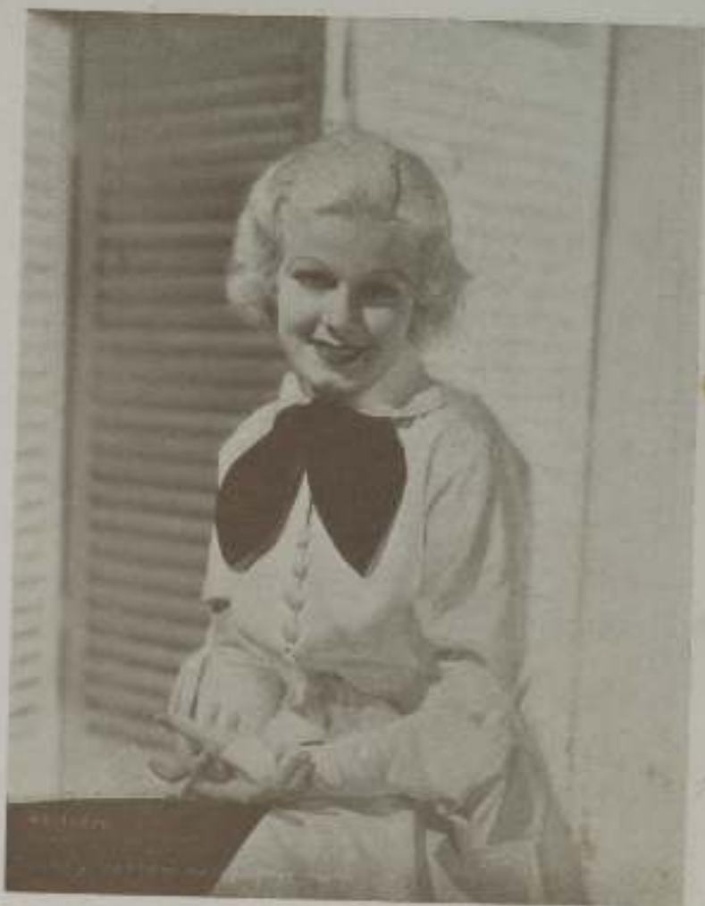
La platinada rubia, que gracias a su talento artístico, ha conseguido que la Metro le otorgara la categoría que merece

Quizás a no ser por esta casualidad, que evidencia una voluntad extraordinaria ya que logró imponer en el mundo entero el tinte de sus cabellos, Jean Harlow no sería en estos momentos la rubia platino más destacada de cuantas rubias platinas existen en el mundo. Su idea fue genial y después logró sostener su popularidad con sus peculiaridades particulares que unidas a su belleza le han proporcionado un gran número de admiradores que la sostienen en el estrellato. M. G. M. que en caso de lanzar es-