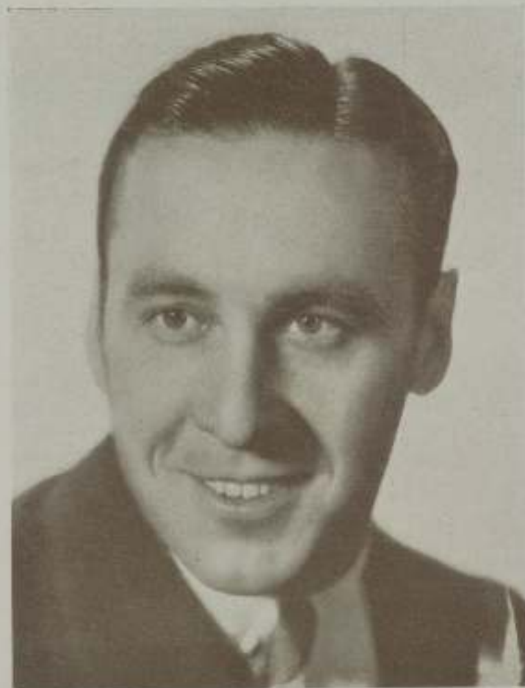
GEORGE O'BRIEN, el simpático actor de la Fox cuyo musculatura conserva en todo su vigor

Pocos hombres han conseguido despertar la simpatía extraordinaria de George O'Brien. El animoso batallador, el hombre de las mil aventuras que puso siempre de relieve la fortaleza de sus músculos, hace una temporada que apenas se le ve por nuestras pantallas y no obstante, todos los buenos aficionados, todos los que recordamos sus interpretaciones en los días venturosos del cine mudo, lo tenemos en la memoria sin poder olvidar los roles excelentes que nos hizo pasar, ya en las películas de vaquerías, ya en las escenas de ring.