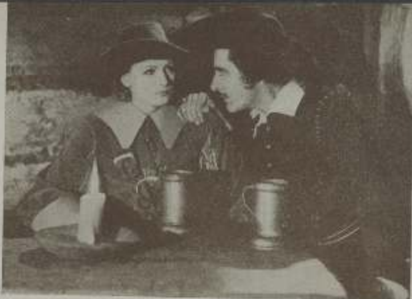
Una escena de "La reina Cristina de Suecia" magnífica producción M. G. M.

Que los españoles nos veamos obligados a oír constantemente lenguajes extranjeros en el espectáculo más importante de nuestra época, es realmente