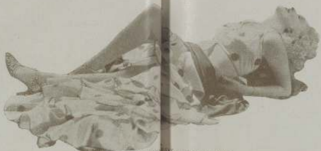
Agradable y bonita HELEN TWELTREEE es adorable siempre

Indudablemente, las manifestaciones de Helen Tweltree tienen toda la apariencia de ser verdaderas. Ella que vive la vida de las artistas, que es una de las mujeres más bellas y admiradas del mundo cinematográfico, sabe mejor que nadie los motivos que inducen a los matrimonios hollywoodenses a tomar resoluciones tan extremas. Además ha podido observar en su propio hogar muchos de esos trastornos que antes citaba y que gracias a su serenidad, al concepto que ella tiene de la vida y del matrimonio, ha logrado evitar, viviendo en completa armonía con su amante esposo. Pero el caso de Helen Tweltree, es de los pocos que existen en Hollywood por la sencilla razón de que coinciden en ella virtudes muy apreciables.