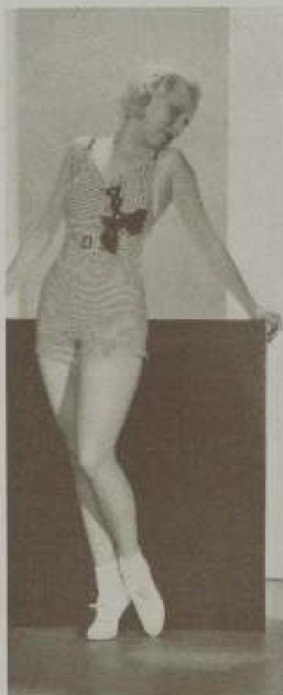
Una extraordinaria obra de M. G. M. cuyo nombre no conocemos

la revista en sobre aparte y debidamente franqueada con treinta y cinco céntimos, cuyo sello de cinco céntimos servirá para ser ranguendo aquí por obra de Impuesto de Exposición.