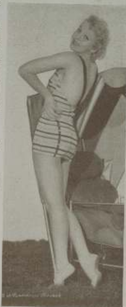
IDA LUPINO, admirable mujer y gran artista de Paramount

Se asegura que Beba Daniels marchará de nuevo a Londres con el fin de hacer "El último vals".