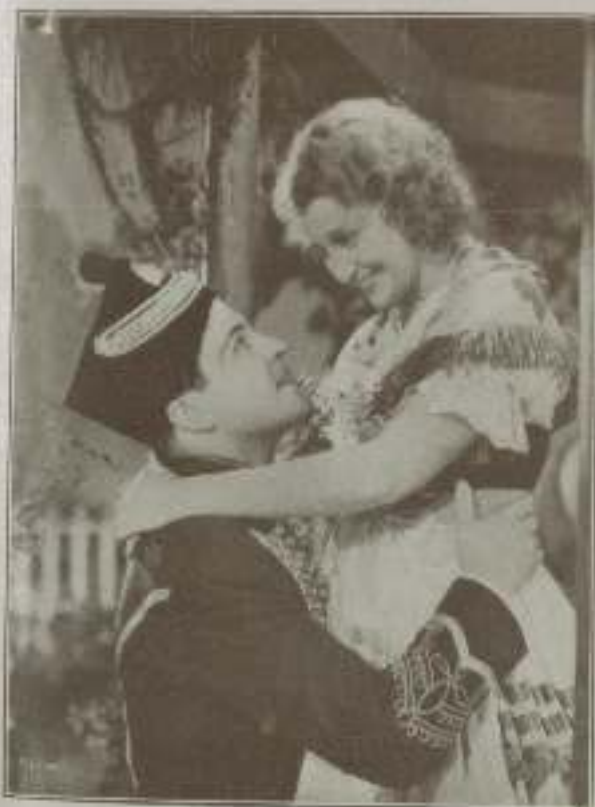
Una escena de "El gato y el violín" de M. G. M.

goría estelar que por su inteligencia y comprensión artística ha conquistado. Y en lo que se refiere a Ramón Novarro ni que decir tiene que es, como siempre, el actor por excelencia, el joven artista para el que los años no pasan, lleno de temperamento y dotado de todas las facultades accesorias para conseguir uno de sus triunfos más rotundos.