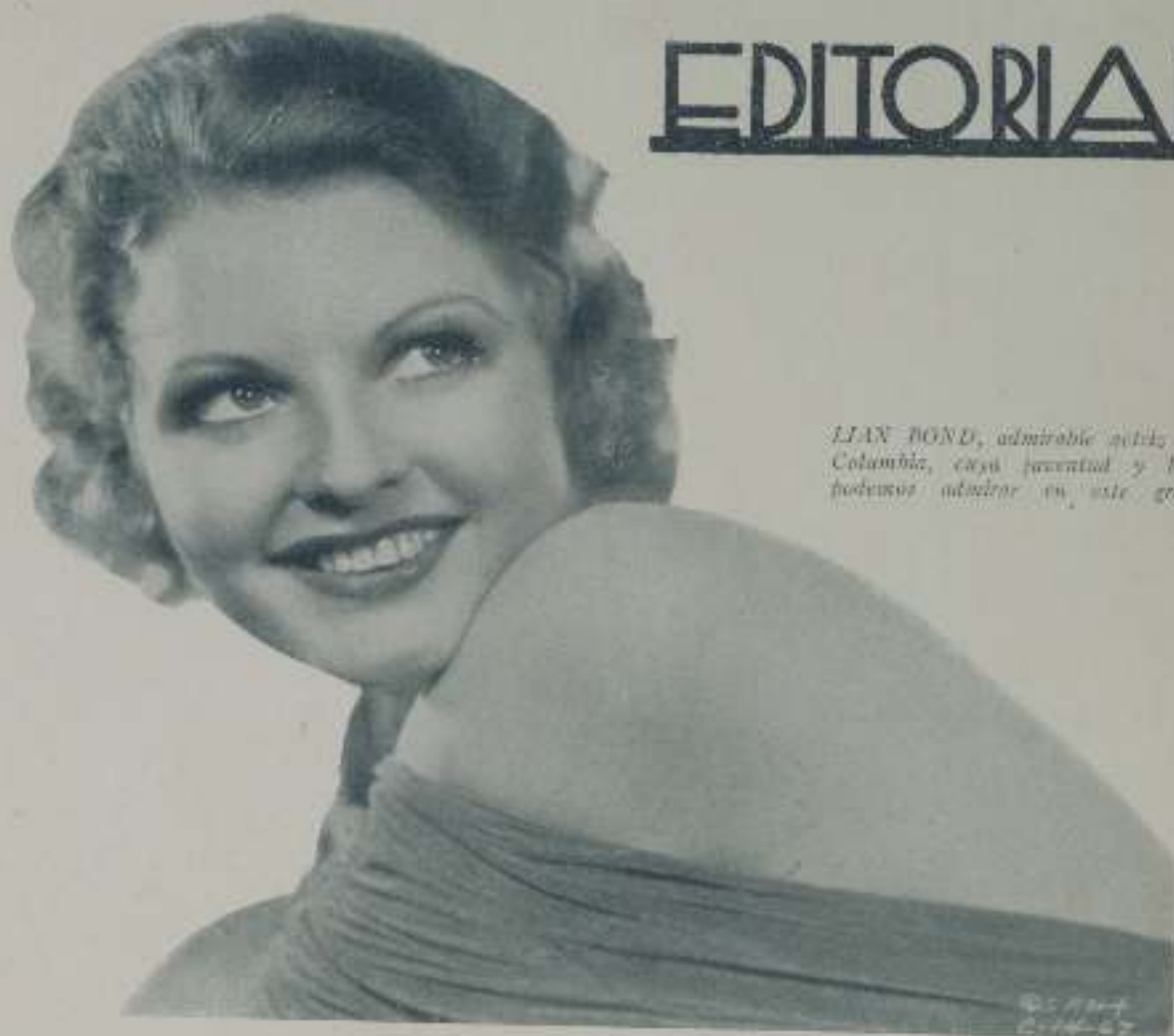
LIAN BOND, admirable actriz de la Columbia, cuya juventud y belleza podemos admirar en este grabado

Temores inundados de un descenso de producción nacional corrieron el último mes de boca en boca. Atocadamente esos comentarios no dejan de ser sólo juicios de tertulianos que, al no tener otra cosa de que hablar, echaron al vuelo las campanas malévolas de su fantasía.