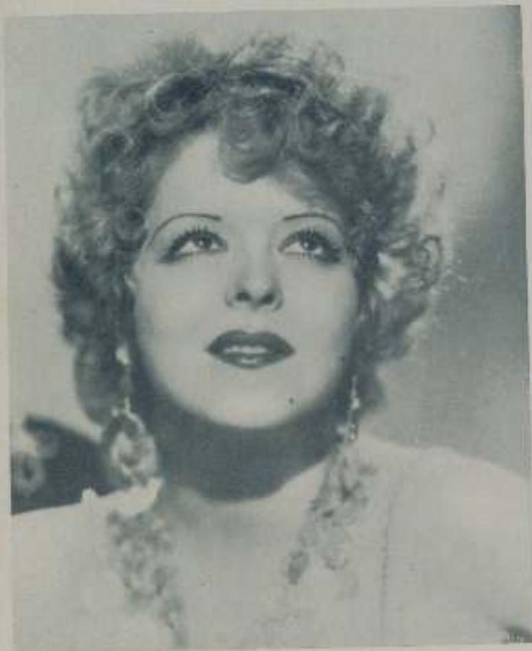
CLARA BOW, la bellísima estrella de la Fox, protagonista de "Hoopla"

Su triunfo es bien merecido. Pocas mujeres han conseguido lograr la popularidad de Clara Bow, indicio palpable de que su personalidad, sin fin de veces discutida, es en ella algo poderoso que la hace triunfar docimino que vaya.