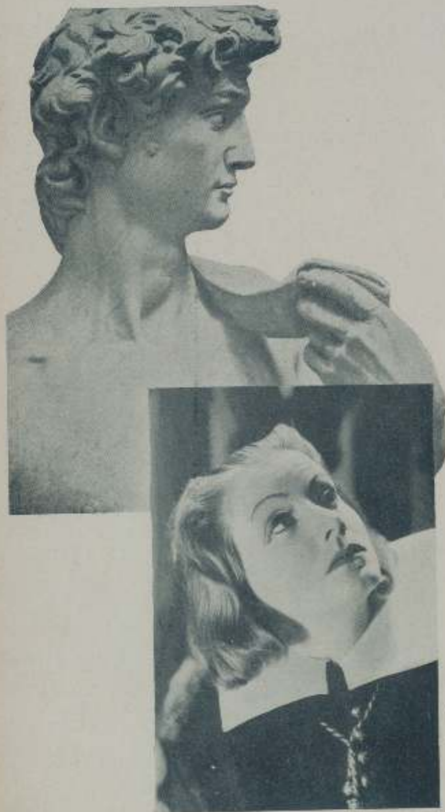
GRETA GARBO, la estelar actriz que ha realizado la interpretación más excelente de su vida artística en "La reina Cristina de Suecia"

Los temas históricos, las vidas de las figuras más relevantes de la historia, han venido siendo objeto de atención por parte de los productores cinematográficos.