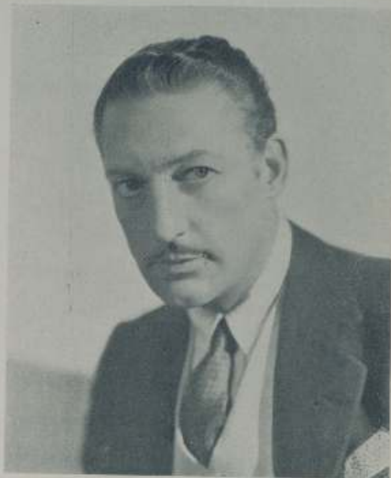
WARREN WILLIAM, el grandioso astro de Warner Bros a quien veremos próximamente en una producción de dicha marca

Facilita mucha la tarea de esas escenas, las más difíciles sin duda de cuantas recoge la lente, la mayor o menor simpatía que sientan entre sí los protagonistas. Si se son antipáticos, para obtener un buen resultado habrá que gastar muchos metros de cinta y el director tendrá que emplear todos sus trucos y gastar todas sus energías para que los artistas rindan el resultado que de ellos se espera. Si son buenos camaradas, si sienten entre ellos mutua simpatía, la escena se hace sola, no tiene que intervenir el director y el cameraman ha de limitarse a buscar el plano adecuado.