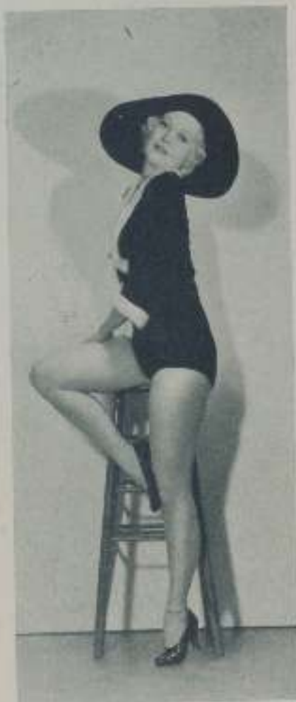
MADGE EVANS, de M. G. M.

nació en Londres. Su hermana y distinción le conquistaron el primer premio en un concurso de belleza en su ciudad natal, y como resultado obtuvo un contrato en la famosa Revista Musical de Cochran. Lillita tiene cabello castaño, y una elegante figura.