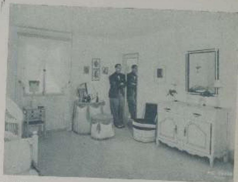
FRANCHOT TONE, el nuevo presidente de Joan Crawford en su residencia de Hollywood

Warren William ha despatentado su sistema y tanto en el teatro como los directores del estudio Warner Bros están alarmadísimos. Los amigos del simpático actor alegan que su desaparición será una buena, una de las tantas que acostumbramos a hacer, puesto que