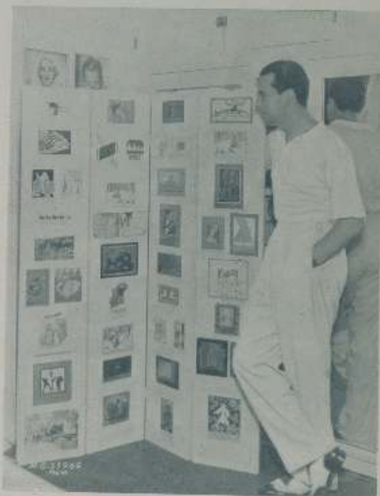
BEN LYON muestra ahora un álbum donde tiene pegadas las felicitaciones que recibió por Navidad y Año Nuevo de sus amigos, admiradores y familiares

Marion Davies, Ben Lyon, Jean Harlow, Norma Shearer, Clark Gable, Lillian Harvey, Janet Gaynor, Will Rogers y varios otros han habilitado las paredes de sus camerinos como álbum de fotografías y de autógrafos. Otro tanto hace Claudette Colbert, solo que para ello emplea una sola pared, dejando las demás tal como se las presentó el estudio. Norma Shearer, a semejanza de Claudette, no tiene todas las paredes de su camerino llenas de autógrafos y fotos; utiliza para esto