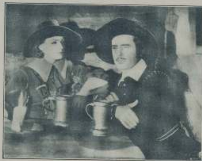
GRETA GARBO y JOHN GILBERT en una escena de "La reina Cristina de Suecia"

Verdaderamente, en año en que la excelencia de películas ha dejado mucho que desear, bueno es tener en perspectiva un gran estreno. Los aficionados tenemos hambre de obras cinematográficas buenas y nos son necesarias para luchar contra las afortunadas ideas rebucantistas, que no quieren ver en el cinematógrafo sino pasatiempos infantiles.