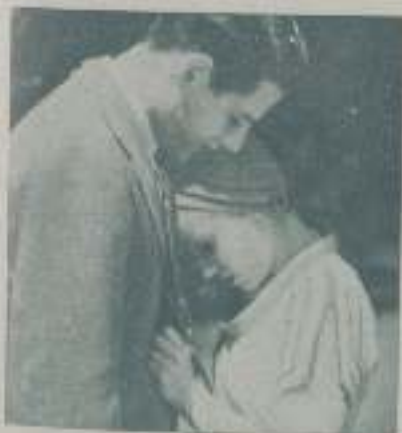
Una escena de la magnífica película "Las 3 golondrinas"

— Benito Perojo comenzará a principios de abril "La hermana San Sulpicio".