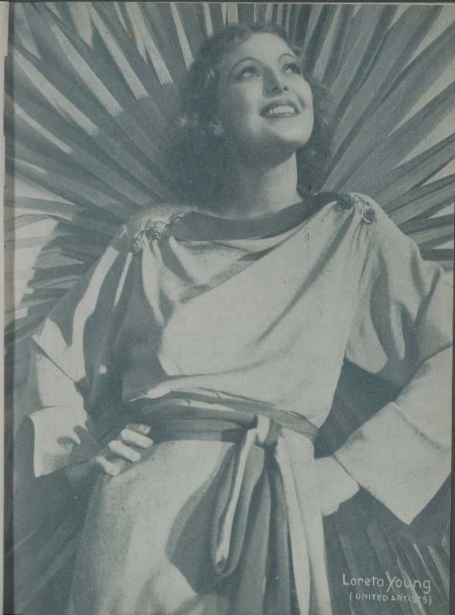
Loretta Young (UNITED ARTISTS)