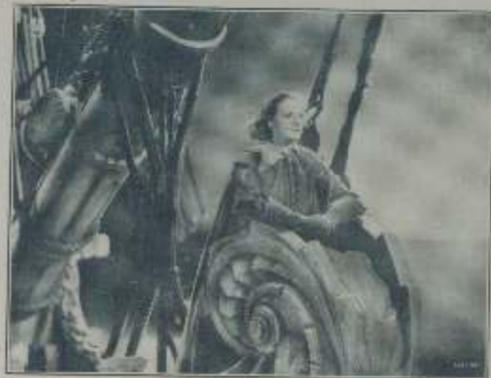
GRETA GARBO en una escena de "La reina Cristina de Suecia"

su principal intérprete, Greta Garbo. La gran actriz sueca expuso su deseo de pasar la vida de su famoso compatriota, lo cual es un adelanto del gran interés que había demostrado la exquisita estrella para realizar el papel que así misma se ha asignado. Todos sabemos la gran comprensión y sensibilidad que posee Greta Garbo, nadie ignora la fuerza en que sabe expresar las pasiones, los estados más profundos de su alma, así es que cabe esperar de su interpretación un nuevo