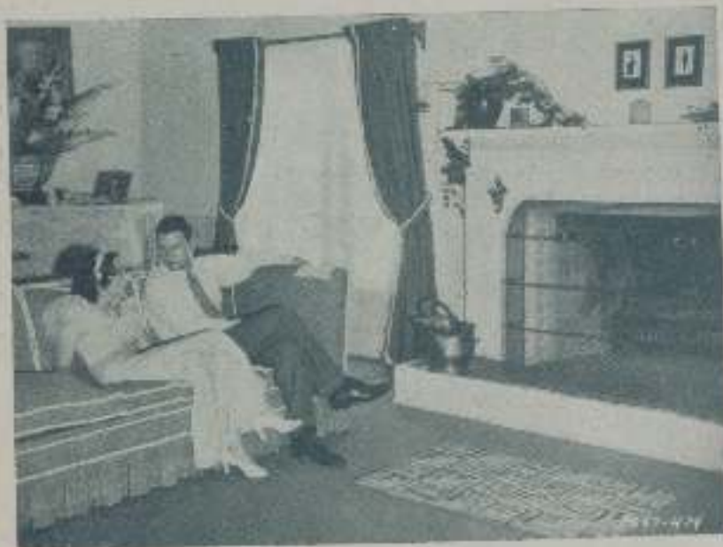
RICHARD ARLEN y JOBYNA RALSTON, en su sala de Hollywood