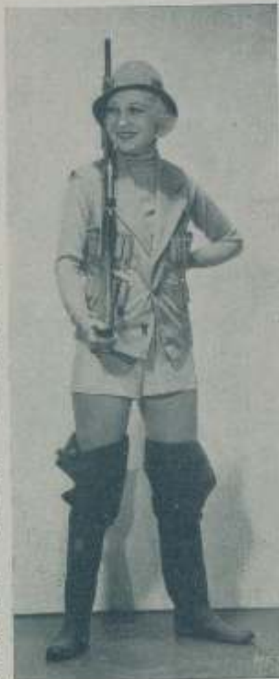
MADGE EVANS vestida con bélico traje

TODO CUANTO SUCEDE EN HOLLYWOOD DE SENSACIONAL PODRA USTED SABERLO EN DETALLE ADQUIRIENDO "EL CINE" QUE ES EL DE MAS COMPLETA Y VERAZ INFORMACION